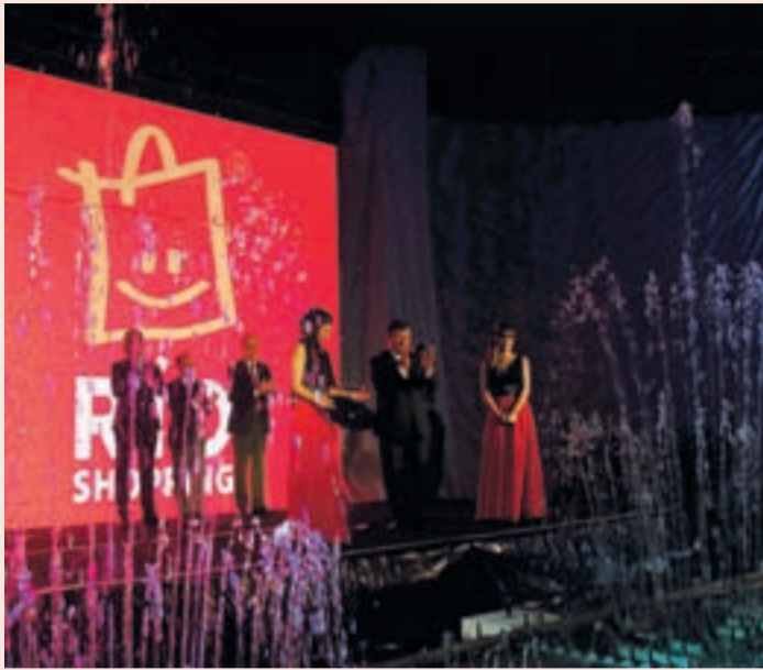
Las autoridades junto a los directores del centro e Ikea.