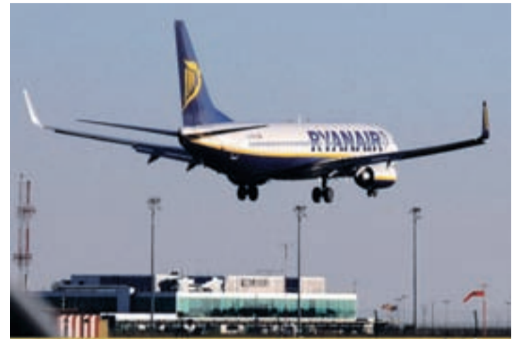
Un avión de Ryanair llegando a Villanubla.

DOS VUELOS CON LONDRES. Por su parte, la compañía aérea