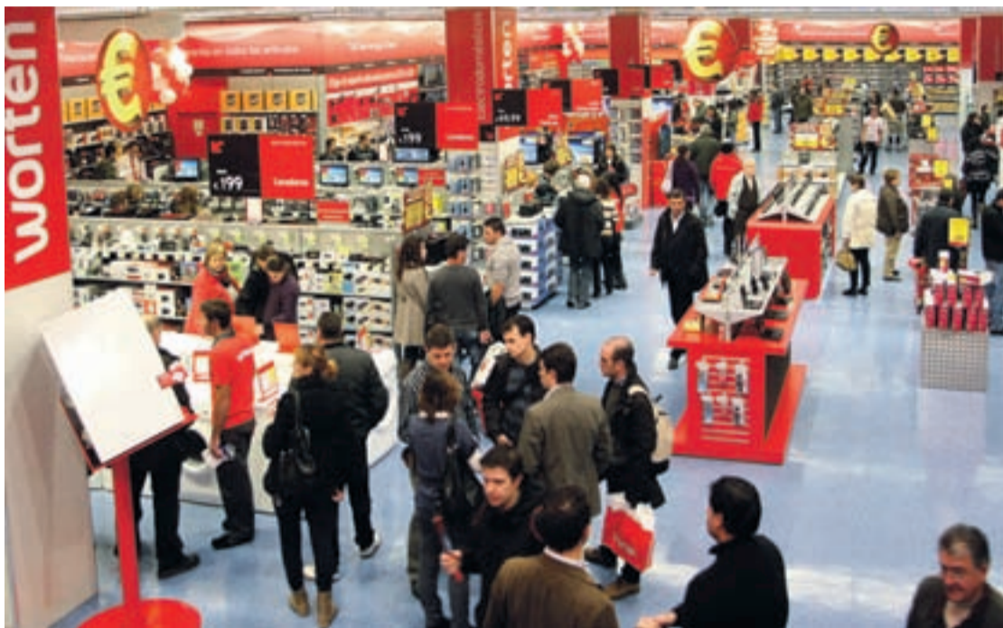
La tienda de Worten en Valladolid contará con 2.450 metros cuadrados.

Worten, que inició su actividad en España en el año 2009, actualmente cuenta con 42 establecimientos y más de 1.400 empleados.