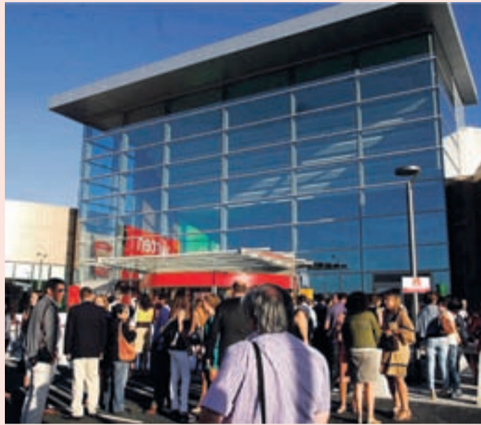
Fueron más de 2.000 los invitados a la inauguración.