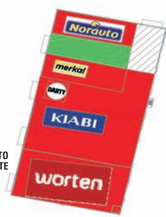
APARCAMIENTO ALA ESTE

Tiene una ubicación fantástica. Permitirá llegar a más consumidores