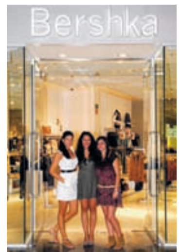
Tres empleadas de Bershka.

En los meses previos a su inauguración, la llegada de este centro comercial ha sido una revolución. Por ejemplo, 3.000 personas enviaron su currículum para uno de los 150 puestos de trabajo en la tienda Primark. Los centros comerciales de toda España reciben, de media, 4,5 millones de visitantes a la semana y emplean a 315.000 trabajadores. El primer festivo que abrirá, según el calendario oficial, será el próximo viernes 12 de octubre.