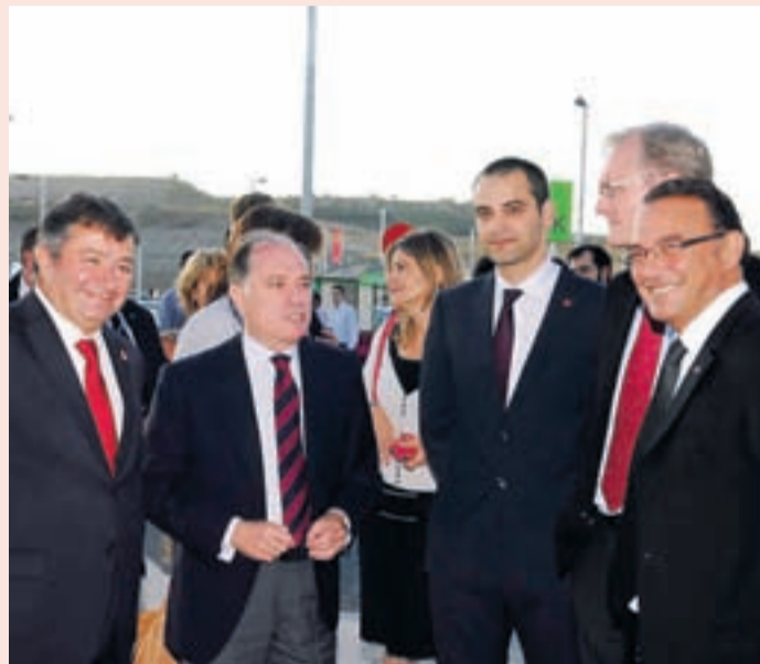
El consejero de Economía junto al Alcalde de Arroyo a la entrada.