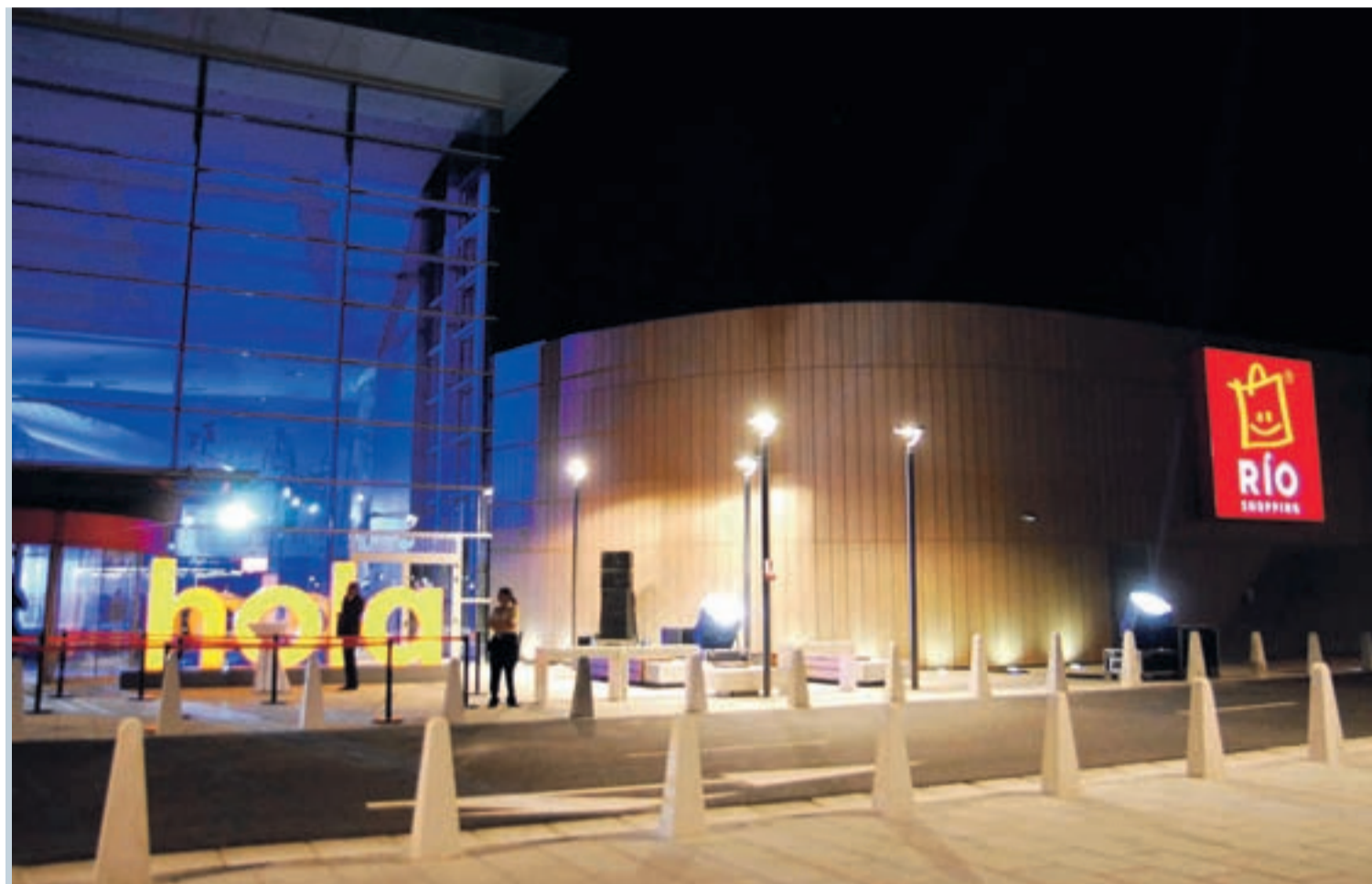
Foto panorámica de la entrada principal al centro comercial Río Shopping de Arroyo de la Encomienda.