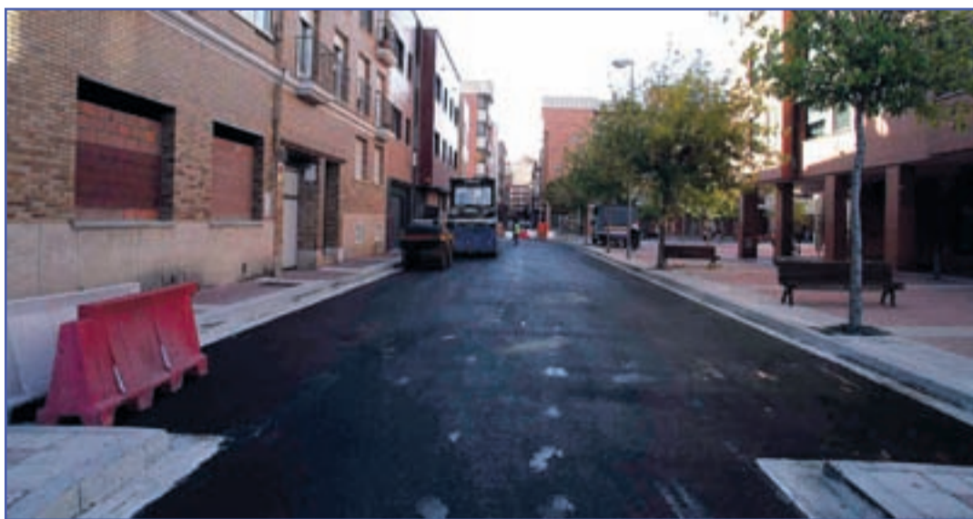
El 19 de septiembre acabaron las obras de reforma de la calle Delicias por un importe de 240.000 euros.

En lo referente a la calle Claudio Moyano se ha realizado una inversión de 330.000 euros con un diseño que ha eliminado las plazas de aparcamiento para ampliar aceras, aunque en el tramo más próximo a Santiago se ha acotado un espacio para las motos. La calle Licenciado Vidriera, que conecta esta vía con Miguel Íscar también se cambia de sentido y su aparcamiento será exclusivo para carga y descarga. El proyecto también ha incluido la