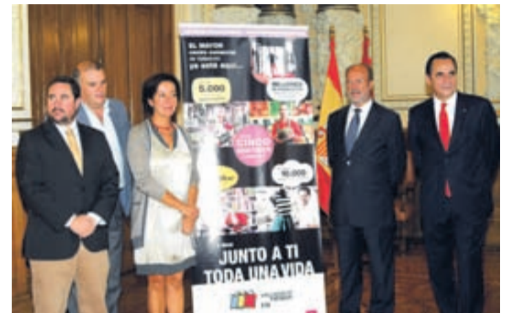
Momento de la presentación de la nueva campaña.

La acción completa la campaña 'El mayor centro comercial de Valladolid ya está aquí y lleva junto a tí toda la vida', que resalta las "grandes ventajas" de los establecimientos tradicionales de la ciudad y que, como ha justificado