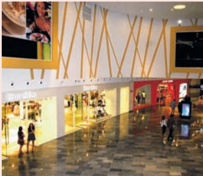
Vista panorámica de una de las zonas del centro comercial