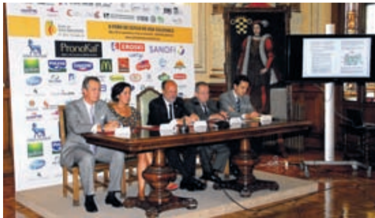
Momento de la presentación en el Ayuntamiento.

Se trata de la segunda edición de este foro, que comenzó su andadura en 2011 en Madrid, organizado por la Fundación España Saludable, dirigida por Jesús Calleja, quien también ha estado presente en el acto celebrado en el Ayuntamiento. El responsable de la organización ha