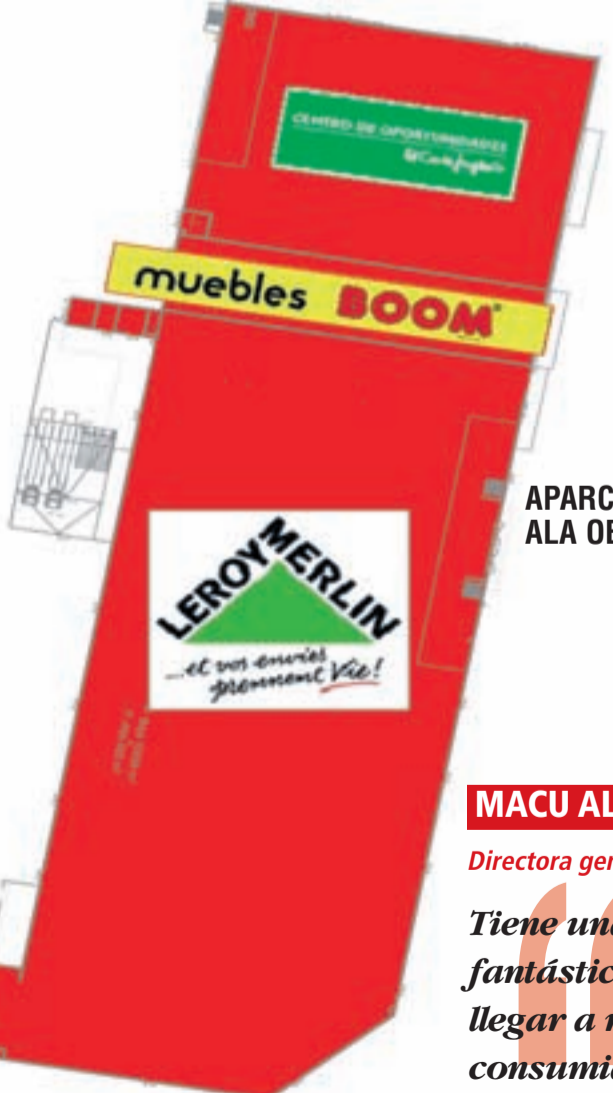
APARCAMIENTO ALA OESTE

Es una gran noticia que ya se hayan incorporado los 23 empleados.