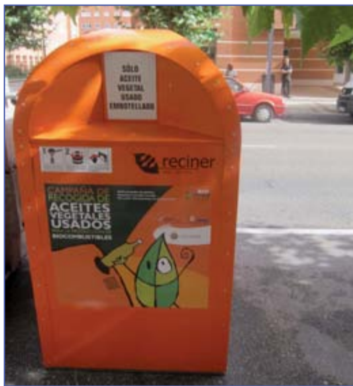
Uno de los contenedores para la recogida del aceite.

Desde su implantación en parte de la ciudad a finales de 2009, este servicio ha permitido retirar 86.000 kilos de aceite, lo que supone una media de 0,31 kilogramos por habitante y año, cifra que aumentará un 17% cuando los contenedores lleven un año instalados. Según las previsiones, a finales de 2013, la cifra se situaría por tanto en 0,50 kilogramos por habitante y año de aceite neto. Hay que recordar que un litro de aceite contamina 1.000 litros de agua, lo que se puede calificar como un dato terrorífico, por lo que este esfuerzo realizado por parte del Ayuntamiento es positivo porque no cuesta dinero y, sobre todo, beneficia al medio ambiente.