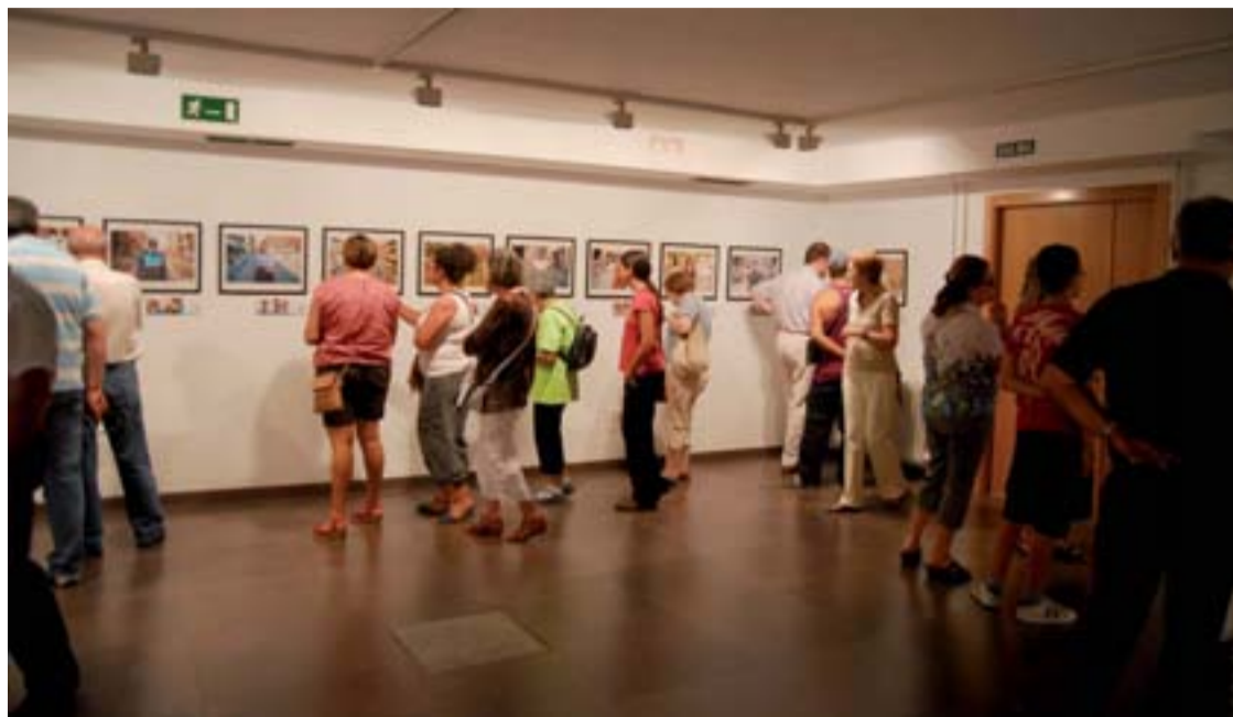
Algunas de las fotografías que se pueden contemplar en la exposición Vallapeople.