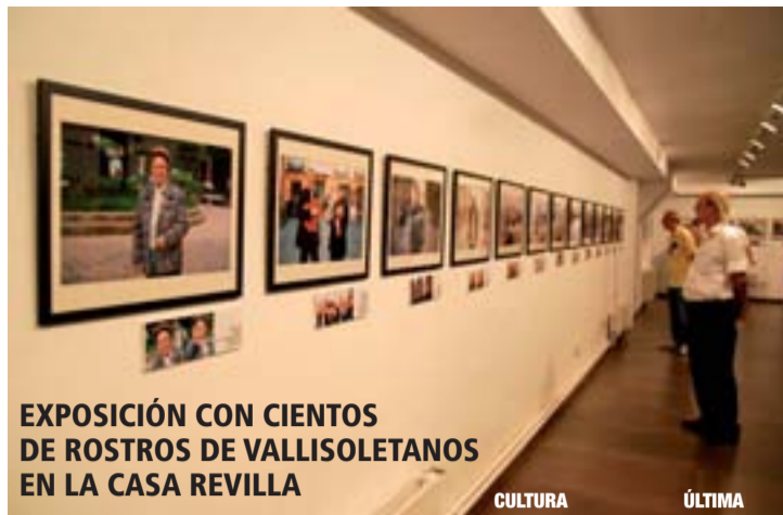
EXPOSICIÓN CON CIENTOS DE ROSTROS DE VALLISOLETANOS EN LA CASA REVILLA