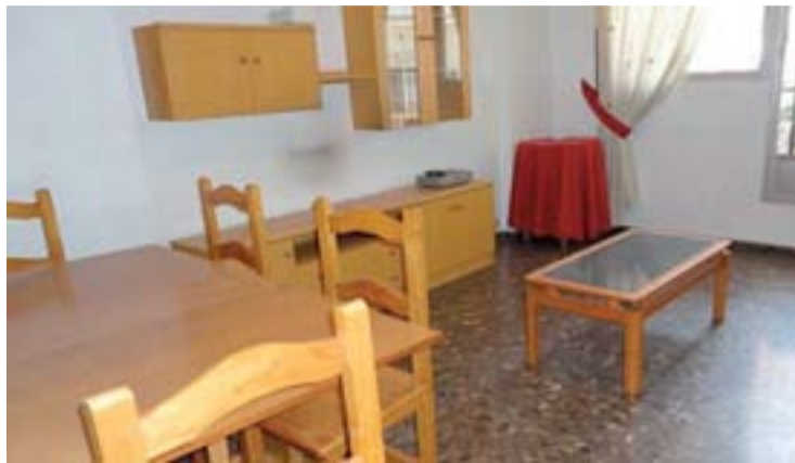
Cada vez más gente prepara su casa para alquilar habitaciones.

Por el contrario, las expectativas económicas de los arrendadores han disminuido un 9,7% con respecto al último año, bajando desde los 332 euros mensuales que se pedían de media en agosto de 2011 hasta los 299 actuales en la media nacional. Eso sí, en Valladolid ha aumentado un 2% y se ha pasado de 191 euros a 195. La ciudad del Pisuerga es de las