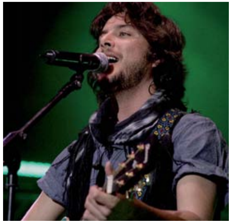
Manuel Carrasco actuará el 7 de septiembre.

También se realizarán servicios nocturnos desde el Real de la Feria a distintos barrios de la ciudad desde las 23.30 horas hasta las 03.00 horas los días 1, 7 y 8, y desde las 23.30 hasta las 01.00 horas el resto de días. Además se suprimen las paradas de calle Ferrari y Duque de la Victoria.