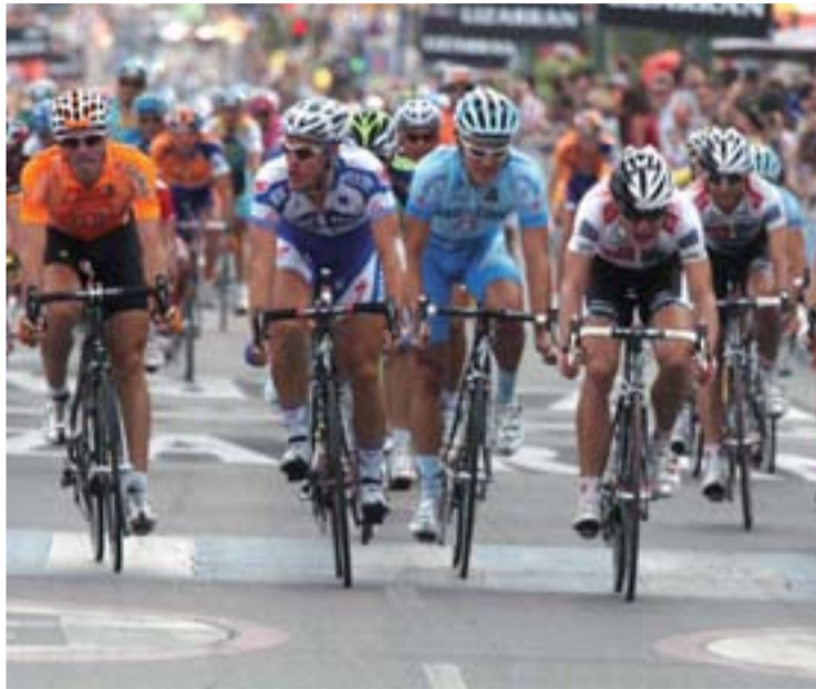
La etapa es propicia para llegar al esprint.

A la entrada por esta carretera, la carrera seguirá por la Ronda Norte para tomar el Paseo Juan Carlos I hasta la calle General Shelly, continuando por el Paseo Arco de Ladrillo, García Morato, San Ildefonso, Paseo Isabel la Católica, Puente Mayor y Avenida de Gijón, con el fin de seguir hasta Villanubla. Desde ahí continuará a Wamba para regresar a la ciudad por Zaratán y entrar por las calles Padre José Acosta, Mieses, Avenida José Luis Arrese y Paseo de Isabel la Católica, donde estará instalada la meta a la altura del Archivo Municipal. Según las previsiones, la cabeza de carrera llegará a este punto a