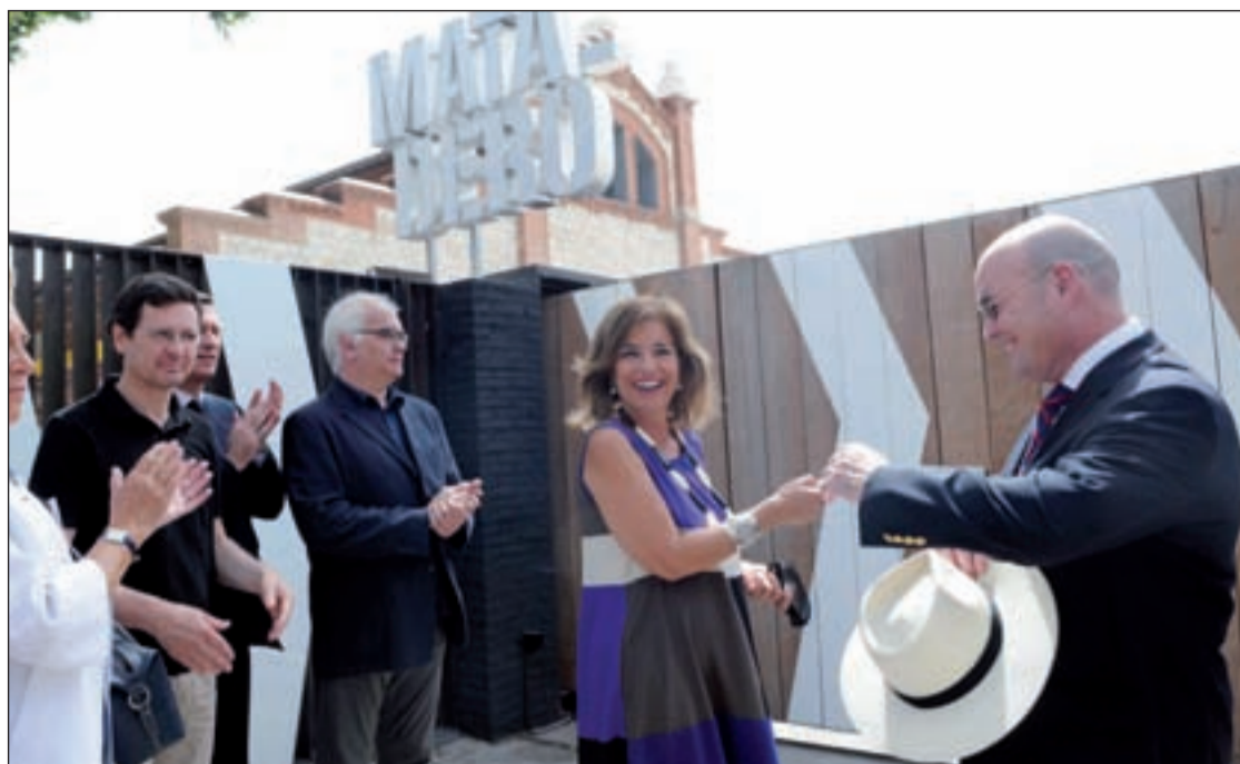
La alcaldesa de Madrid durante la inauguración de los espacios que unen Matadero y Madrid Río

Así, el Ayuntamiento, una vez analizados los informes, ha decidido no desalojar a los alumnos e internos de la residencia y acometerá las obras en vacaciones.