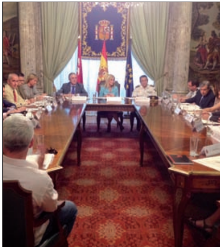
Mesa Técnica de Seguridad y Convivencia de Lavapiés

El plan estará terminado en septiembre y tendrá como obje-