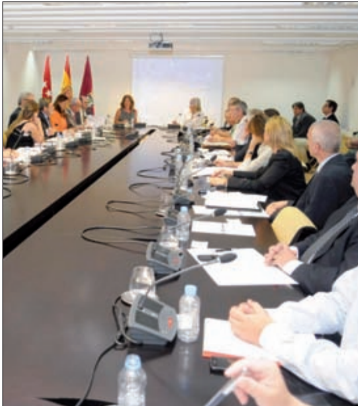
Un momento de la reunión mantenida en el Palacio de Cibeles

La delegada explicó que las medidas para mejorar la seguridad ciudadana no se circunscriben solo a la acción policial sino también a estrategias de participación ciudadana y de carácter social, con referencias concretas a las iniciativas emprendidas en Lavapiés y en Cañada Real. En este último ámbito, mencionó las nueve grandes operaciones contra los clanes de la droga con un balance de 65 detenidos y la demolición de 18 inmuebles dedicados a la distribución de