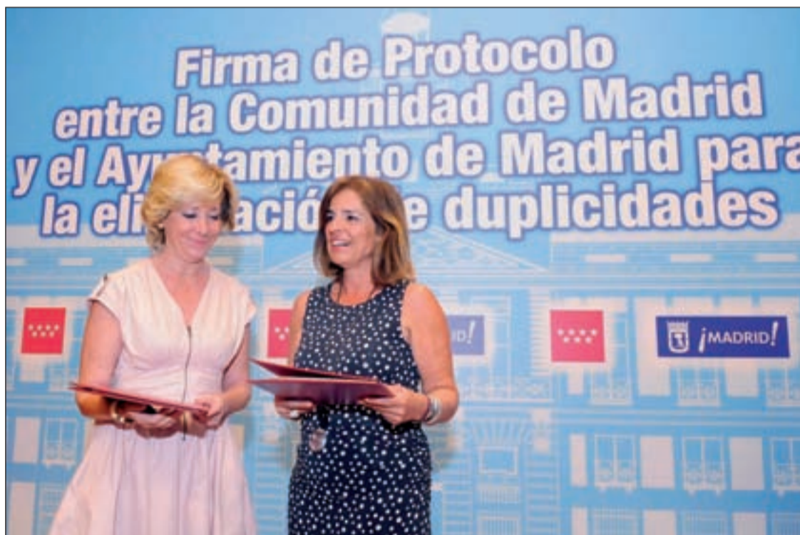
La presidenta y la alcaldesa intercambiaron la documentación correspondiente al protocolo

Comunidad y Ayuntamiento rubrican el acuerdo para comenzar antes de enero de 2013 a eliminar la duplicidad de los servicios públicos Pág. 6