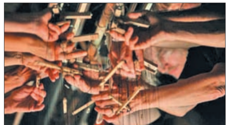
'La Flauta Mágica', de Mozart, de The Salzburg Marionette Theatre

MÚSICA PROYECCIÓN DE OBRAS DE MOZART O BEETHOVEN