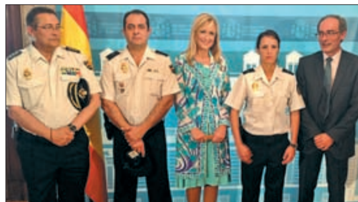
La delegada del Gobierno con los policías premiados

Además, ha señalado que este homenaje es extensivo a todo el Cuerpo Nacional de Policía por "la excelente labor" que está haciendo en su conjunto para incrementar la seguridad del sector de la joyería.