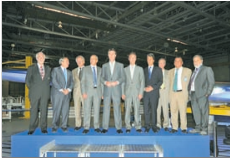
Un momento de la presentación

FABRICADO EN GETAFE ACTO CON EL MINISTRO SORIA