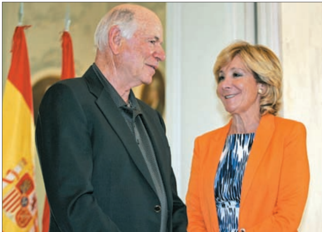
La presidenta Aguirre con el director general de Las Vegas Sand en Madrid

Y es que esta semana el consejo de administración de Las Vegas Sand ha visitado las dos ciudades con el fin de poder tomar una decisión que se basará, principalmente, en los terrenos. "No hay diferencia significativa (entre ambas ciudades). Hay más turismo en Barcelona y más negocios en Madrid, pero Madrid tiene muchos turistas y Barcelona muchos negocios. Por eso, lo mejor para el proyecto es decidir sobre los terrenos, por su mejor situación geográfica y topográfica", ha manifestado el director general de Las Vegas Sand.