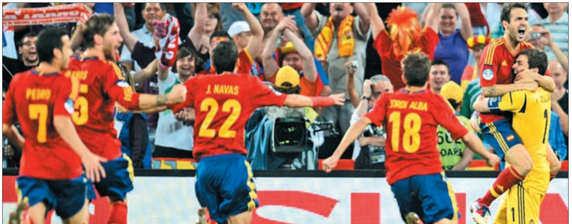
Casillas se abraza con Cesc Fàbregas tras el quinto lanzamiento de la selección española