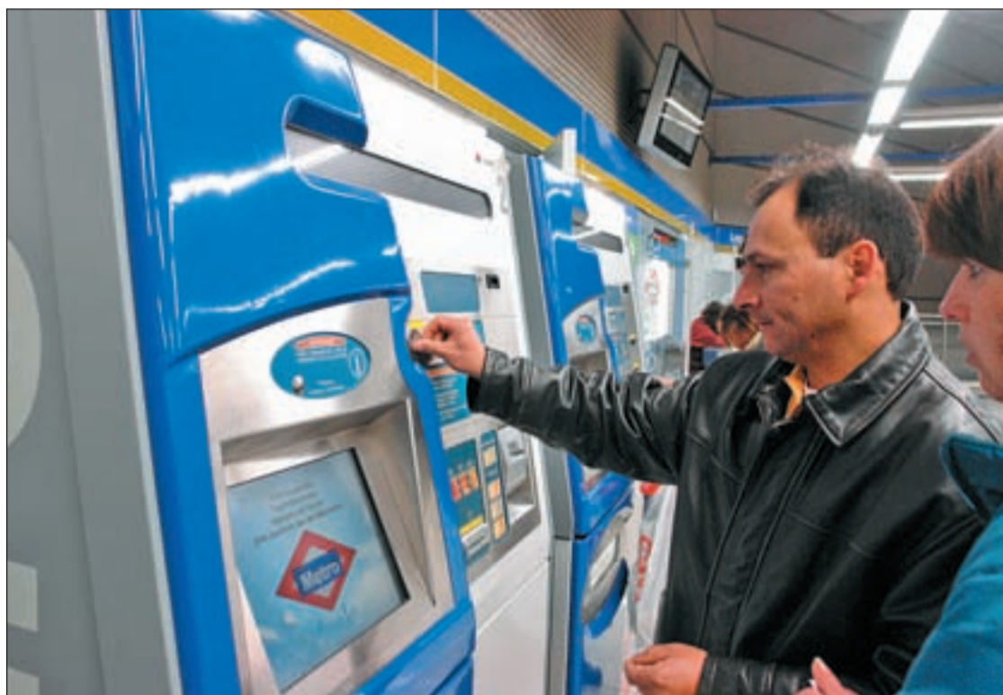
Un usuario compra su billete sencillo para el metro en una de las máquinas del suburbano

Este anuncio de los socialistas también ha coincidido con la entrada en vigor del nuevo precio del billete sencillo. Desde ahora, es más caro. En concreto, diez céntimos más a partir de la quinta estación, pero sin sobrepasar los dos euros. Es decir, al 1,5 euros que costaba hasta hace unos días, hay que sumarle un incremento por cada estación, algo similar a lo que ocurre con los trenes de Cercanías. Pero a diferencia de este sistema, en el metro no se van a instalar torniquetes o puertas de salida que controlen que el destino que figure en el billete se corresponde