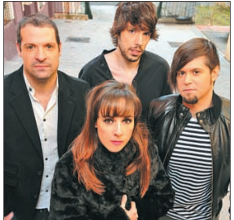
Disphonic, uno de los grupos que participarán en el concierto