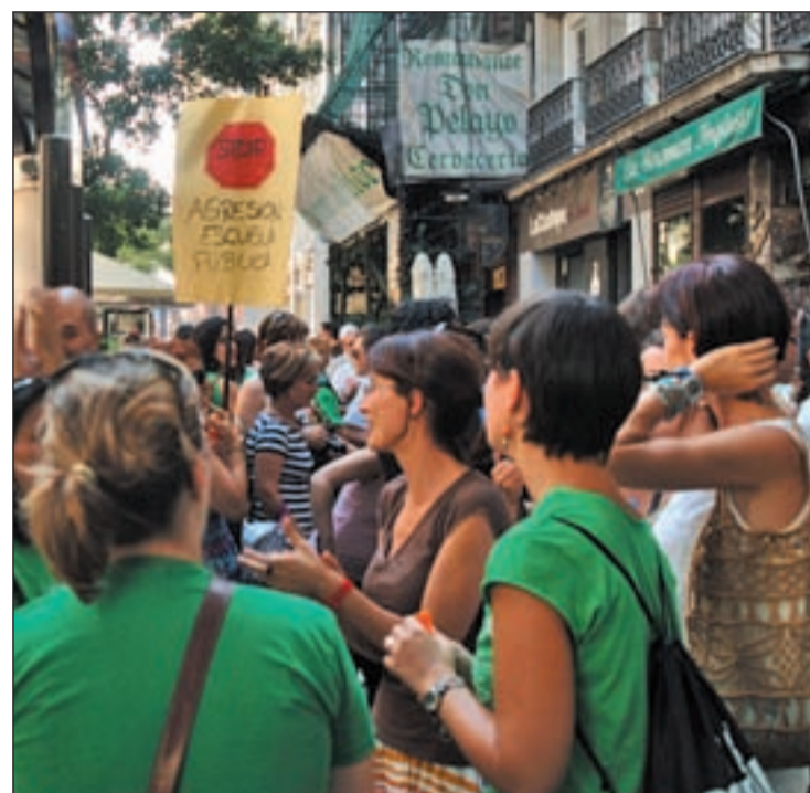
Una de las concentraciones en contra de los recortes CHEMA MARTINEZ

Los recortes en la Educación Primaria se seguirán haciendo efectivos. Se mantiene el au-