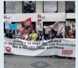
Concentración de los despedidos del Ecyll.