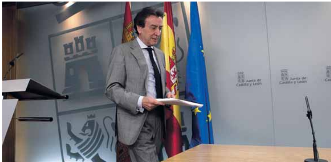
José Antonio de Santiago-Juárez a su llegada a la rueda de prensa tras el Consejo de Gobierno.

Otro de los objetivos es mejorar las perspectivas de los trabajadores y del tejido económico local y regional como consecuencia del impacto directo e indirecto de las reestructuraciones empresariales y deslocalizaciones de empresas extranjeras.