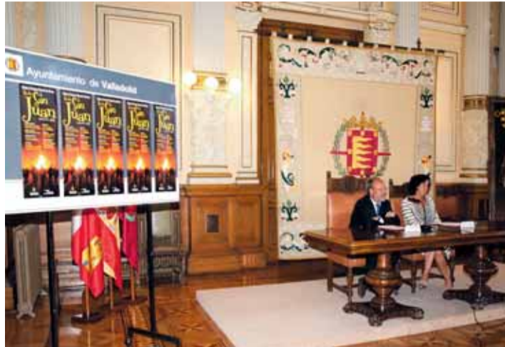
Una de las obras realizadas por Manolo García.

En colaboración con el Ayuntamiento de Valladolid, esta exposición solidaria tendrá por escenario, hasta el próximo día 24 de junio, la Sala Cero del Museo Patio Herreriano, donde las personas interesadas en disfrutar de la obra pictórica de los artistas