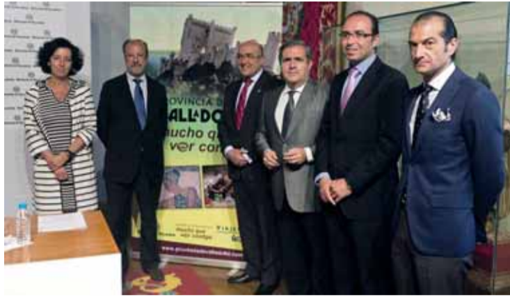
Presentación de la campaña de promoción.

En cuanto a los productos ofrecidos, ha puesto como ejemplo la posibilidad de pasar un fin de semana por 119 euros por personas con dos noches de alojamiento y la visita a una bodega con comida incluida, lo cual resulta "más barato que quedarse en casa". Además, la Diputación