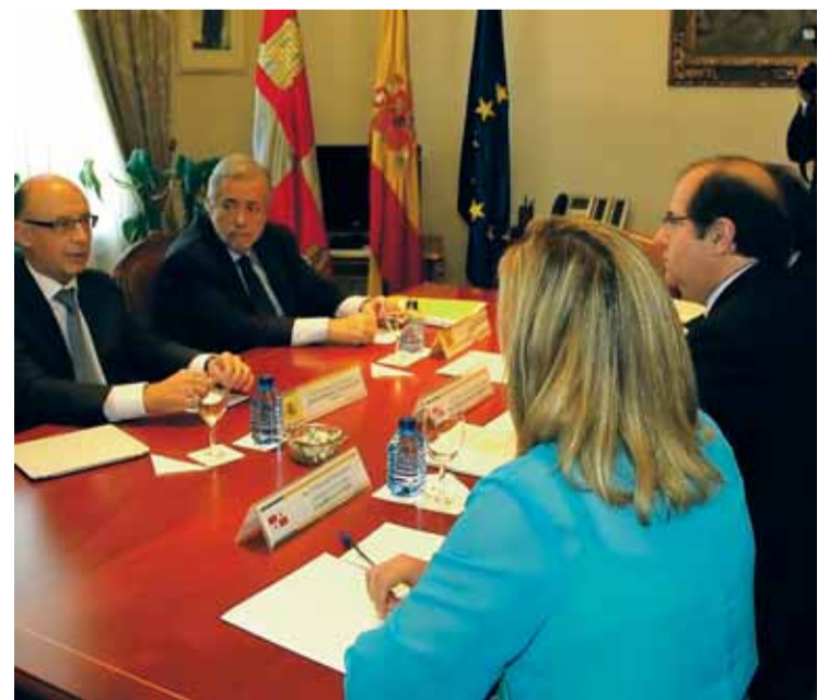
Juan Vicente Herrera y Cristóbal Montoro durante el encuentro en Madrid.

damental del modelo impulsado por la Junta es el fortalecimiento de los municipios para que puedan prestar, de manera eficiente, las competencias y las funciones que la ley les encomienda”. En el planteamiento del Ejecutivo castellano y leonés, se pretende fortalecer los municipios a través de su asociación voluntaria incentivada para crear mancomunidades de interés comunitario, denominadas provisionalmente como distritos.