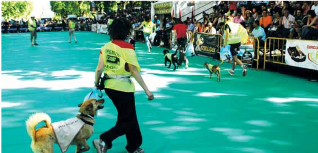
Desfile de perros en adopción durante la pasada edición del Día de la Mascota.

El domingo 17 de junio con concursos, talleres y exhibiciones