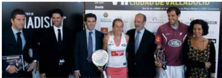
Momento de la presentación.

El máximo representante de la ciudad invitó a todos los vallisoletanos a disfrutar de un tor-