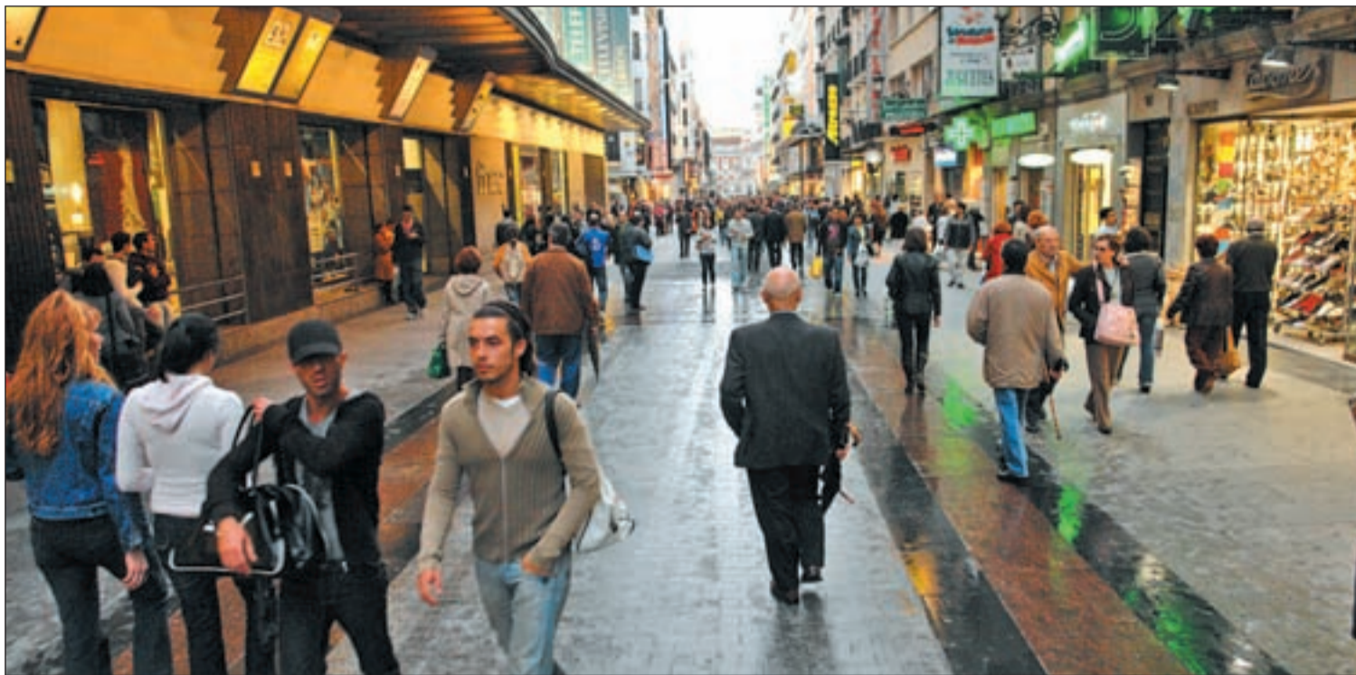
Las tiendas de la calle Preciados abren desde hace meses todos los domingos y festivos del año GENTE