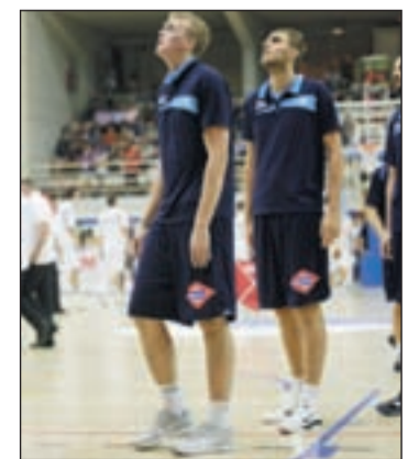
Tensa espera para el Estu

que mantienen la cautela a la espera de lo que decida el comité organizador de la competición. Tras la renuncia del Canarias, se abren dos vías: la repesca de alguno de los clubes descendidos o planificar una temporada con sólo 17 equipos en la élite, una situación que ya se vivió hace varias campañas tras la desaparición del Akasvayu Girona. En caso de optar por la primera opción, el descenso del Estudiantes podría quedarse en una pequeña pesadilla con final feliz