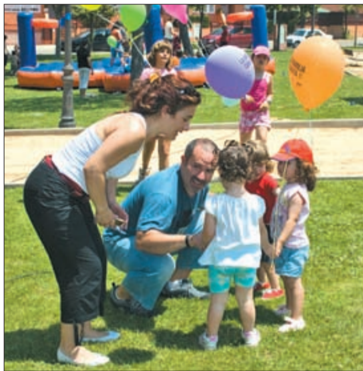
Habrán espectáculos para pequeños y mayores

El objetivo de la feria, organizada por el Ayuntamiento, en colaboración con la Consejería de Asuntos Sociales de la Comunidad de Madrid y la Asociación Familia y Futuro, radica en poner en contacto a las familias con especialistas en diferentes materias, y en ella participarán más de treinta instituciones,