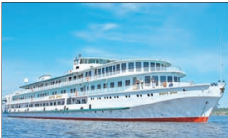
Un crucero de Politours recorre un río

Deslizarse por las aguas tranquilas del Nilo supone un plus