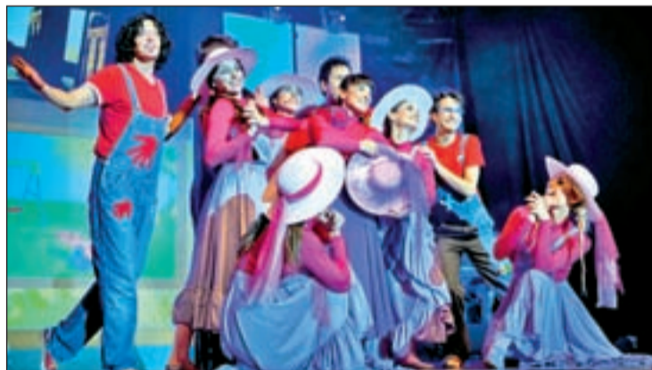
600.000 espectadores ya han visto CantaJuego

Detrás de este proyecto se encuentra el Grupo EnCanto, los