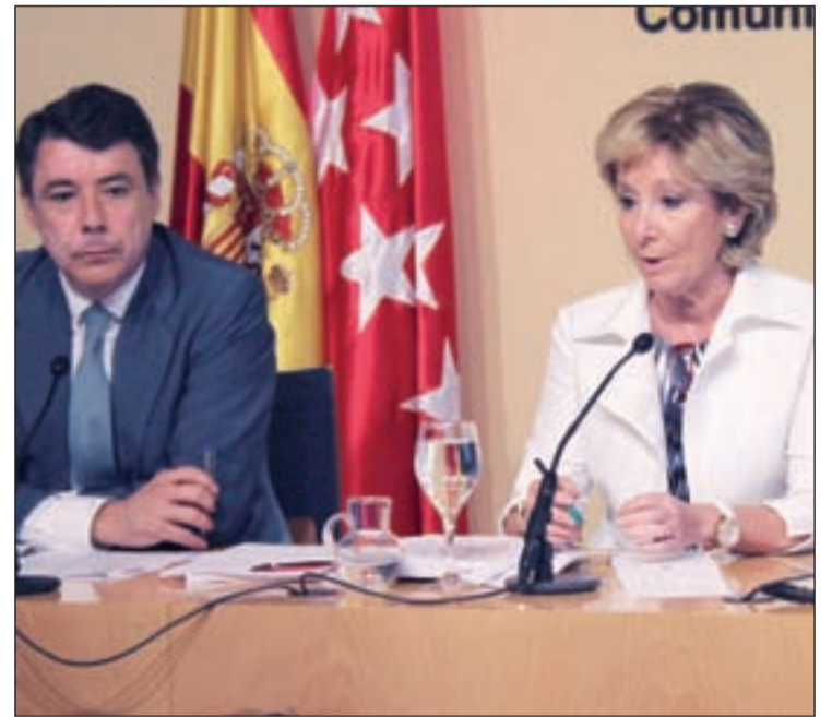
Aguirre y González en rueda de prensa

Por otro lado, el Consejo de Gobierno de la Comunidad de Madrid ha aprobado la constitución de la Sociedad Anónima Canal de Isabel II para la gestión del ciclo integral del agua. "Este es el paso previo para su inscripción en el registro mercantil", ha manifestado González. Final-