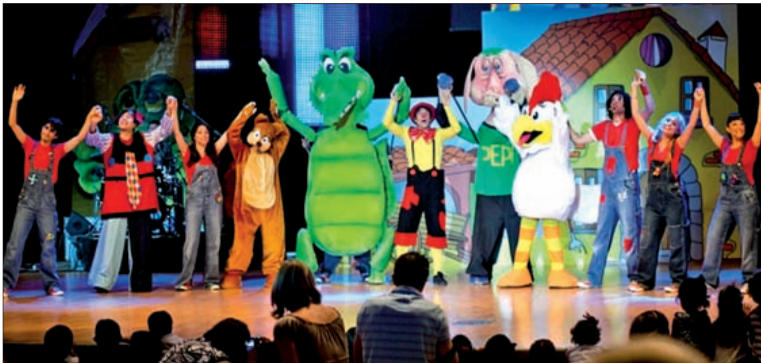
Buby, la Ardilla Cotilla, la Vaca Lechera, el Sapo Pepe, la Rana Juana y Coco son algunos de los personajes