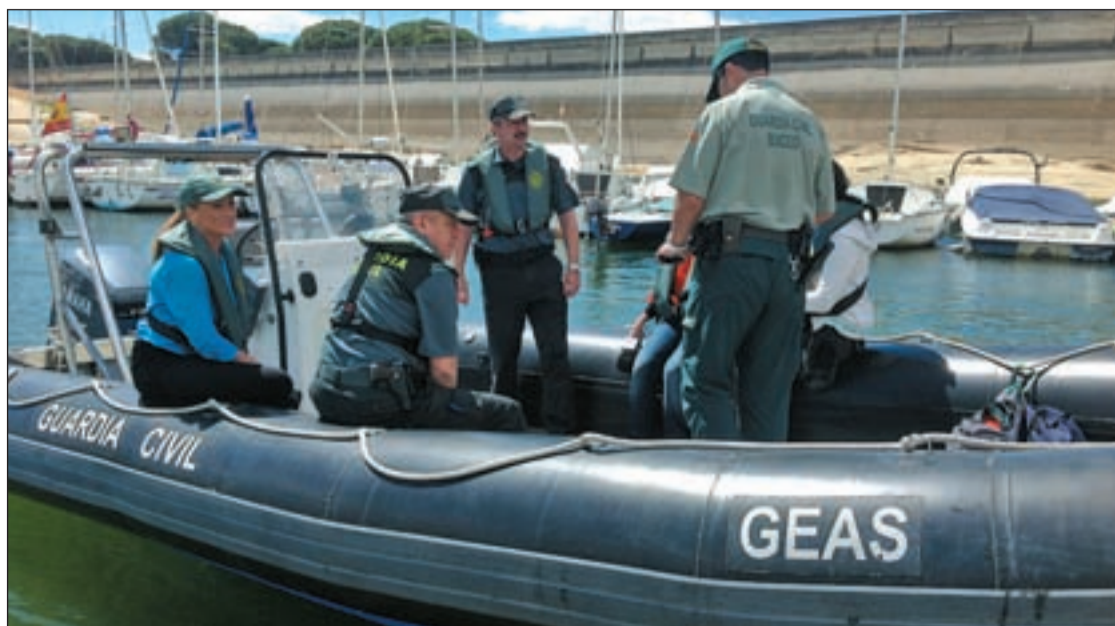
La delegada del Gobierno junto a agentes de la Guardia Civil en el Pantano de San Juan