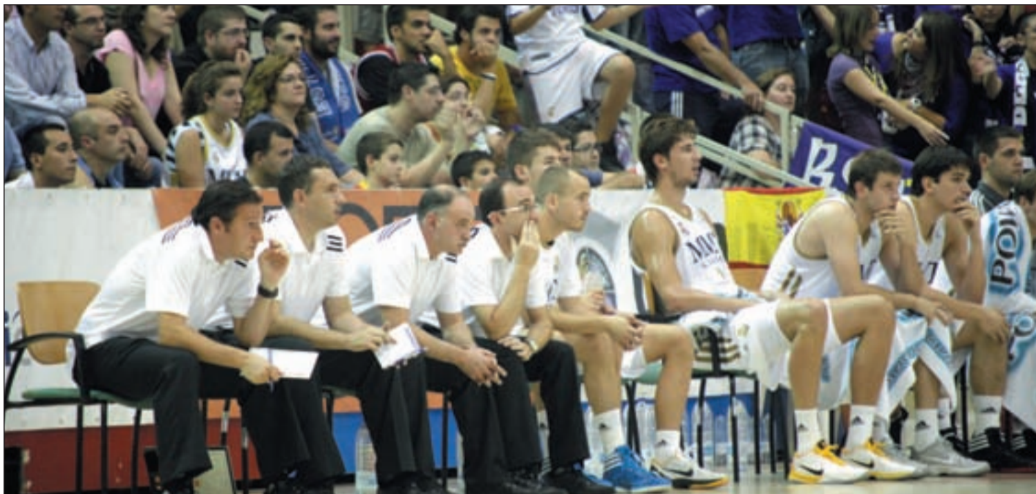
Los blancos esperan recuperar el nivel de los primeros tres encuentros MANUEL VADILLO/GENTE

BALONCESTO EL MADRID PIERDE LA POSIBILIDAD DE PROCLAMARSE CAMPEÓN EN SU CASA