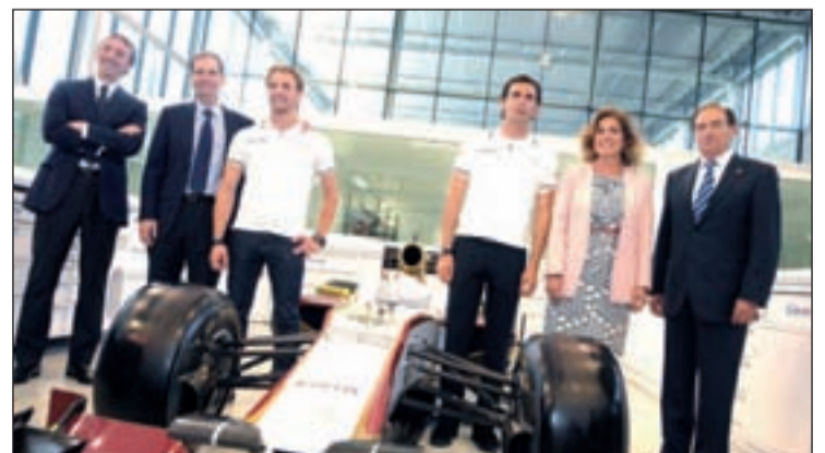
Botella posó con los integrantes de la escudería en la Caja Mágica

En la Caja Mágica, HRT contará con zonas accesibles al público como el futuro museo de la escudería, un área de conferencias y formación, además de realizar visitas guiadas para los madrileños y sus visitantes.