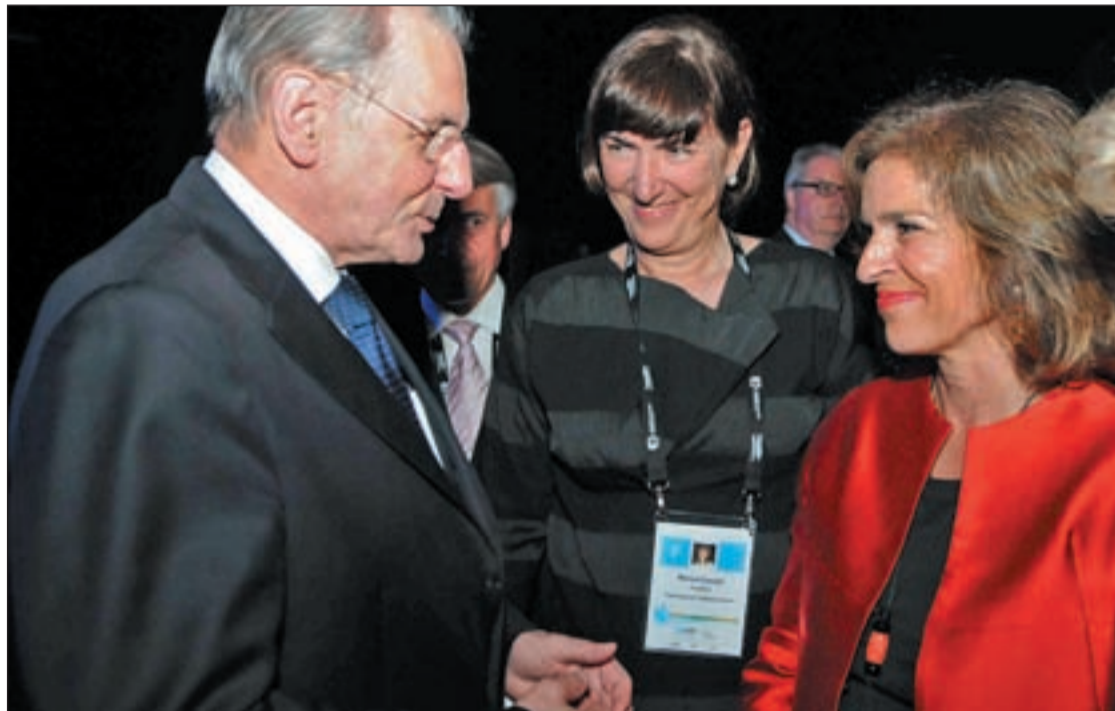
La alcaldesa de Madrid, Ana Botella, junto al presidente del COI, Jacques Rogge

Los miembros de Izquierda Unida celebran la noticia aunque han sido más críticos con la candidatura de la capital madrileña. "Resulta complicado recortar políticas sociales y gasto público que va en detrimento de los servicios a los ciudadanos y, al tiempo, decirles a los madrileños con una sonrisa de oreja a oreja que se están preparando