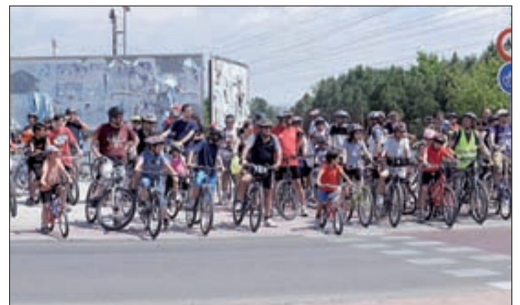
VI Edición de la Fiesta de la Bicicleta en Carabanchel Alto

por último, el recorrido esta especialmente pensado para dar a conocer el barrio de Carabanchel, tanto su parte antigua como moderna, pasando por la bi-