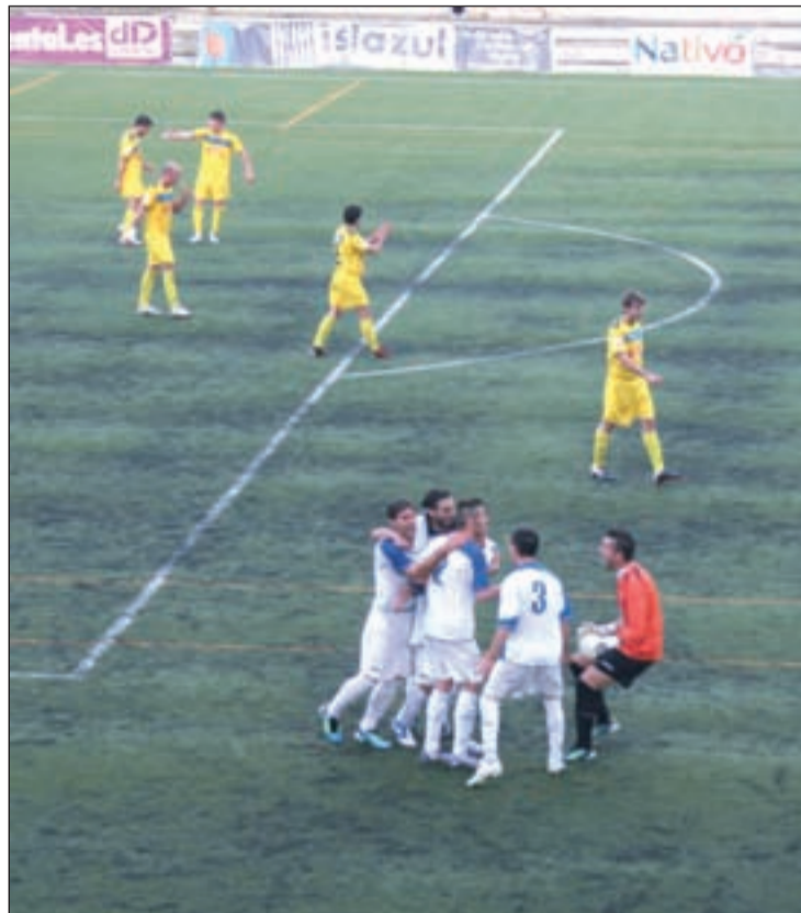
Los jugadores del Puerta celebran el gol de Ónega

Por su parte, el Muro espera sacar ante su público esa versión ofensiva que apenas se vio sobre el césped del Canódromo. De hecho, en sus tres últimos en-