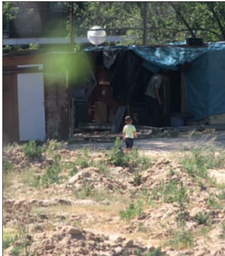
Uno de los menores que vive en los vestuarios del campo