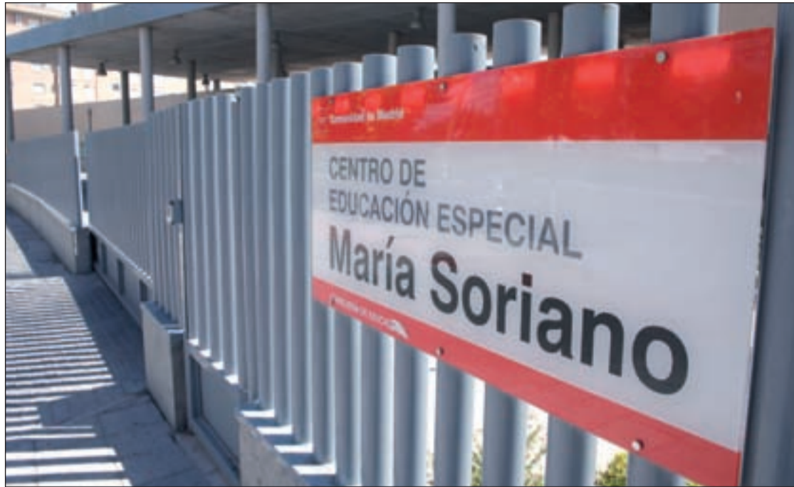
Alumnos del Maestro Padilla van a clase este curso al centro de educación especial María Soriano

Las propuestas deportivas continuarán en la mañana del domingo. A partir de las 9 y media, el club de atletismo La Incolora organiza una nueva edición de sus carreras infantiles en el paseo de Alberto Palacios. De nuevo en la zona verde, pero en el auditorio, a las 14:30 tendrá lugar la actuación musical de ritmos del mundo. La actividad 'Disfruta tu parque' pondrá el cierre a la edición de la Fiesta de la Primavera del presente año.