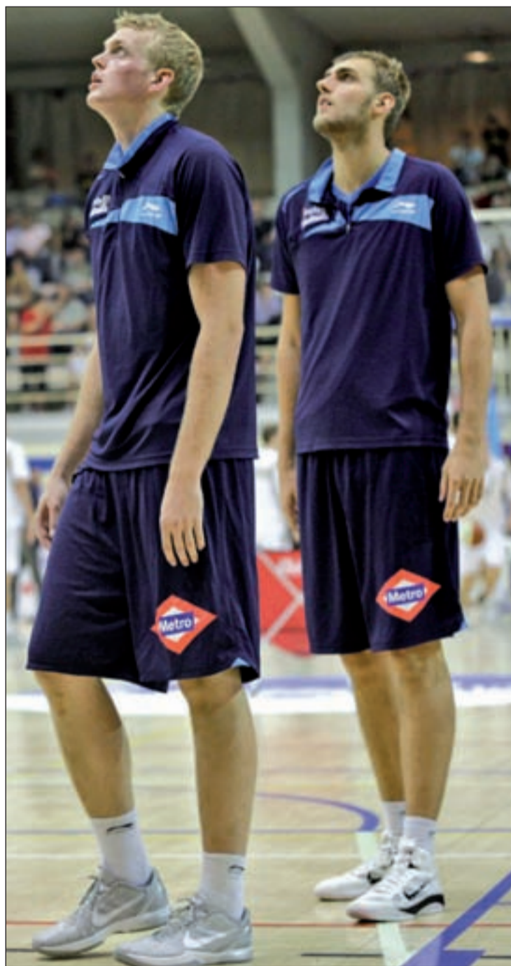
Los estudiantiles se juegan su futuro en diez días

De todos los equipos de la parte más pantanosa de la clasificación, los que peor calendario tienen son el UCAM Murcia y el Mad-Croc Fuenlabrada. Los pimentoneros visitan este domingo al Real Madrid, antes de recibir el miércoles al Assignia Manresa. Como broche final, los hombres de Óscar Quintana podrían jugar la permanencia en