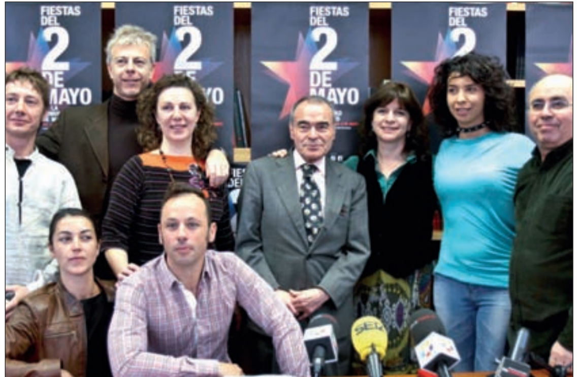
El director de Promoción Cultural de la Comunidad junto a representantes de diversas compañías de danza

El Festimad, por su parte, pondrá la nota de creatividad y biodiversidad musical a las jornadas lúdico-festivas. "Se pone