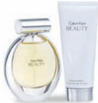
Cofre CALVIN KLEIN BEAUTY Eau de Parfum 50 ml + Luminous skin lotion 100 ml, 55 €