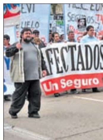
Protesta por el caso PSG

En la proposición conjunta que los cuatro grupos municipales PP, PSOE, IU y UPyD presentarán en el pleno del próximo 9 de mayo, han señalado que es conocida "la delicada situación que están viviendo muchos vecinos de Getafe que un día decidieron destinar sus ahorros a la