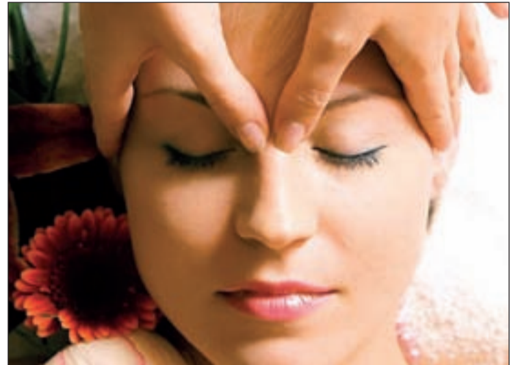
La dermocosmética proporciona una piel sana y cuidada

La línea de tratamiento facial incorpora ingredientes tan innovadores como el 'Aqua-Osmoline', un activo vegetal que estimu-