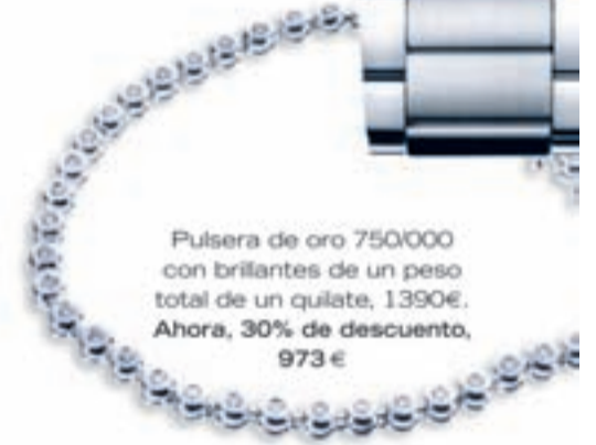
Pulsera de oro 750/000 con brillantes de un peso total de un quilate, 1390€. Ahora, 30% de descuento, 973 €