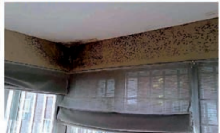
Problemas de humedades por condensación