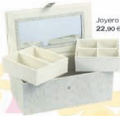
Joyero con espejo, 22,90 €