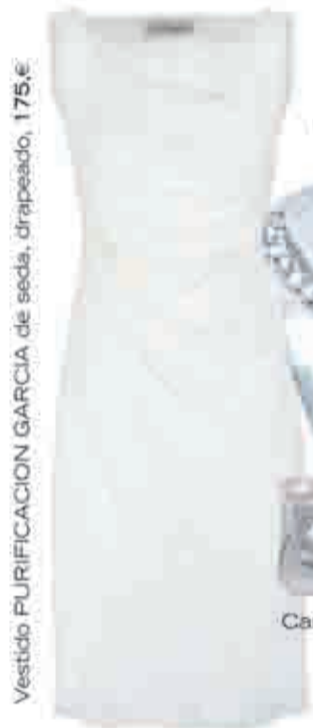
Vestido PURIFICACION GARCIA de seda, drapeado, 175 €