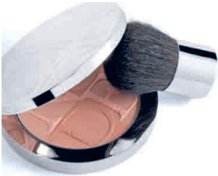
Polvera DIOR NUDE TAN BRONZE, 48,10 €