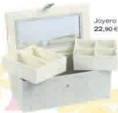
Joyero con espejo, 22,90 €