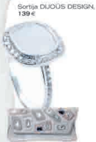
Sortija DIJOUS DESIGN, 139 €