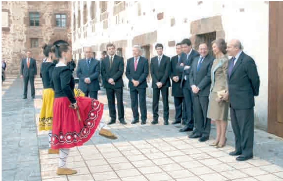
La Reina Doña Sofía inauguró el pasado jueves el Teatro de la Real Fábrica de Paños de Ezcaray.

El presidente del Gobierno de La Rioja, Pedro Sanz, y el alcalde de Ezcaray, Diego Bengoa, acompañaron a la Reina en su visita oficial a La Rioja, junto con el ministro de Educación, Cultura y Deporte, José Ignacio Wert, que incluyó también un recorrido por las exposiciones 'La Real Fábrica'