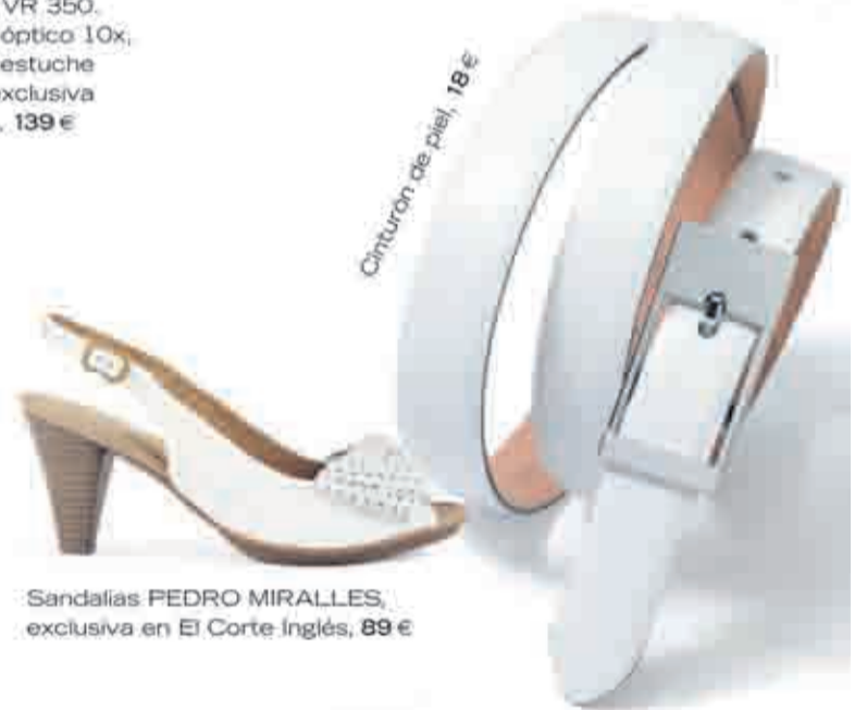
Cinturón de piel, 18 €