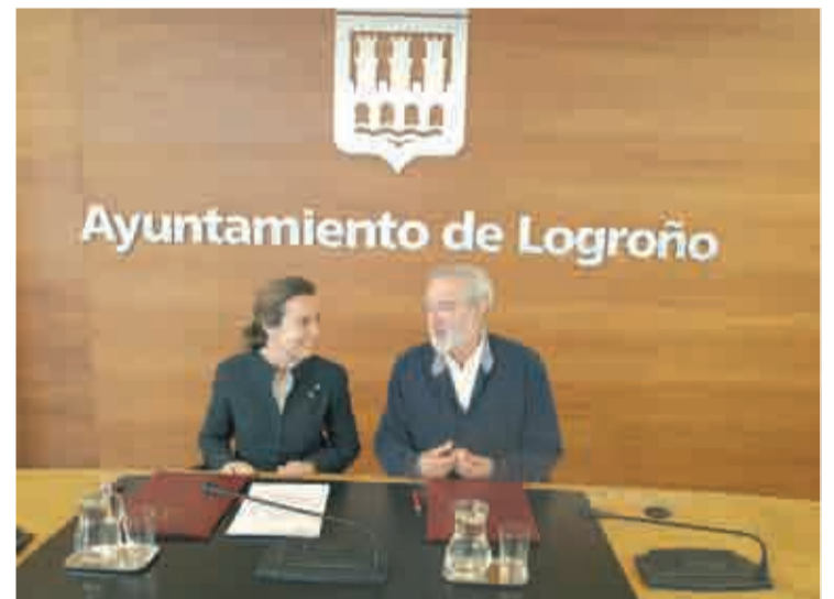
Firma del convenio de colaboración.

Fernández Sevilla" y también en otros edificios como el Centro de Formación Calle Mayor o centros de Servicios Sociales. En concreto, en lo referente a los servicios auxiliares de mantenimiento de la que es sede de la UPL, el Ayuntamiento invierte cerca de 97.000 euros, como recordó la alcaldesa.