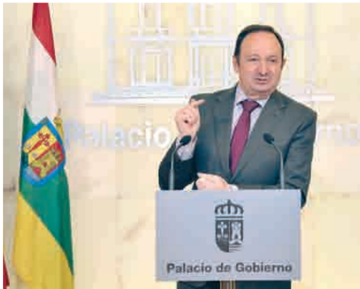
Pedro Sanz, presidente del Ejecutivo riojano, en rueda de prensa.

De hecho, confirmó que ya transmitió al ministro de Justicia que la decisión del Gobierno de