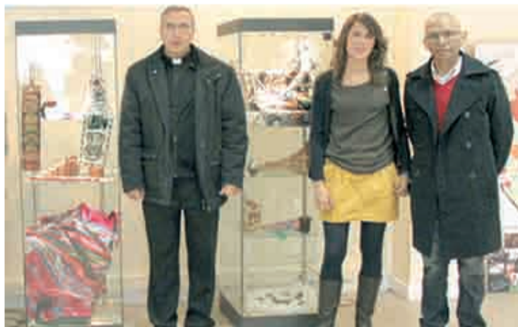
Exposición de artículos de Perú.