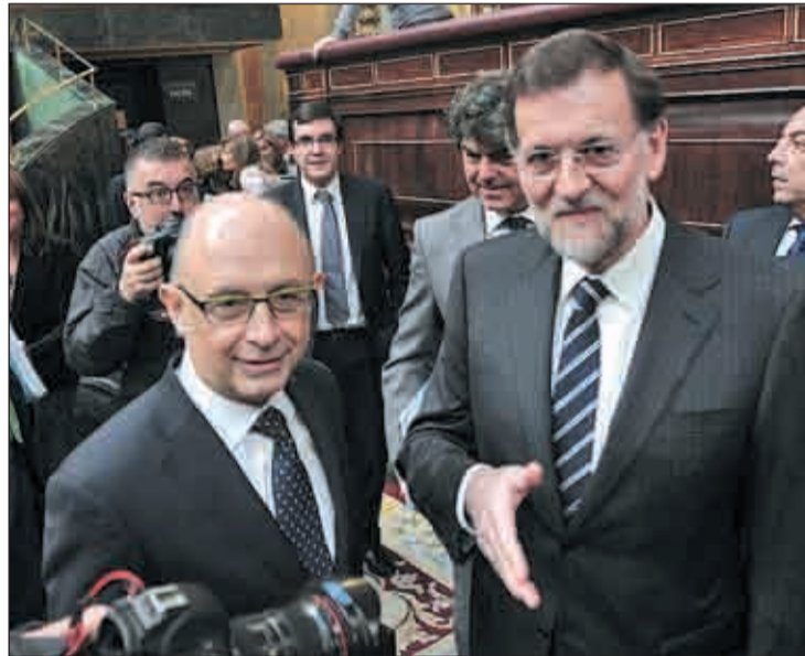
Mariano Rajoy y Cristóbal Montoro tras el Pleno

De este modo, los presupuestos han visto la luz de forma casi definitiva (aún queda el recién