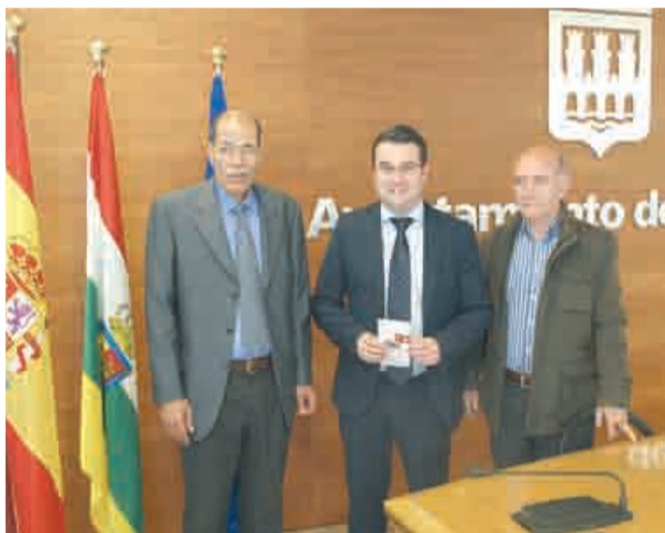
Presentación del programa de vacaciones.

El programa 'Vacaciones en Paz' consiste en la acogida de niños saharauis en familias de Logroño, y de otros puntos de la comunidad, para pasar los meses de julio y agosto. Merino animó a todos los logroñeses a vivir esta experiencia y acoger en sus hogares a uno de estos pequeños. La previsión es que unos cuarenta niños saharauis puedan disfrutar