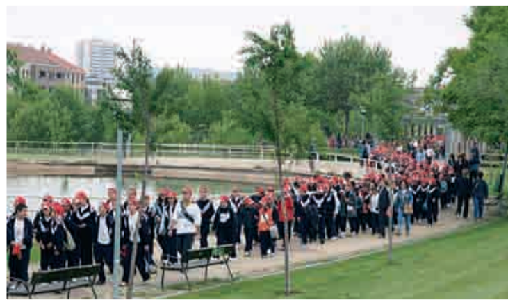
Andando por una buena causa.