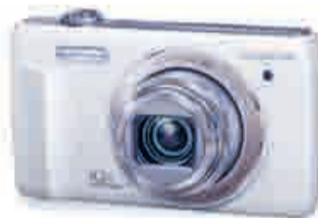
Cámara OLYMPUS VR 350, 16 megapíxeles, zoom óptico 10x, pantalla de 3", con estuche y tarjeta de 4 Gb, exclusiva en El Corte Inglés, 139 €