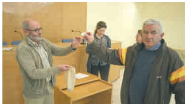
La "mano inocente" saca el número 13.