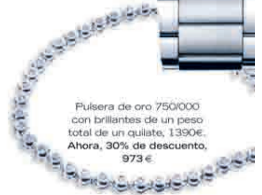
Pulsera de oro 750/000 con brillantes de un peso total de un quilate, 1390€. Ahora, 30% de descuento, 973 €