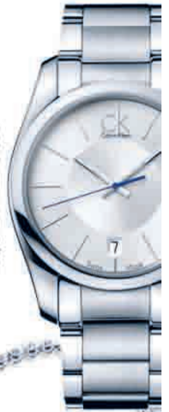
Reloj CALVIN KLEIN, 195 €