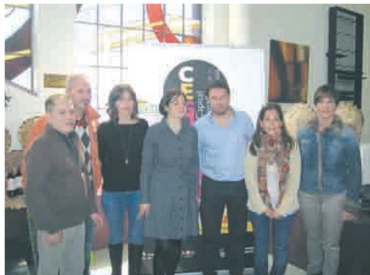
Hosteleros unidos por la dinamización.

La Asociación de hosteleros de la zona del Laurel, 'La Laurel', está trabajando muy activamente por impulsar nuevas actividades dentro de la Capitalidad Española de la Gastronomía y así dinamizar la zona y promocionar la gastronomía riojana.