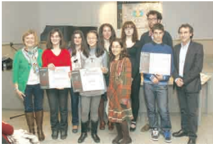
Premiados en el concurso literario.

No obstante, el jurado valoró especialmente aquellas obras referidas a la lectura, la creatividad, la expresión literaria, los escritores, los personajes literarios, las obras clásicas y el mundo del libro.