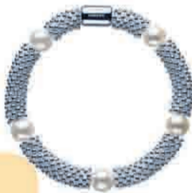
Pulsera LINKS OF LONDON, 285 €