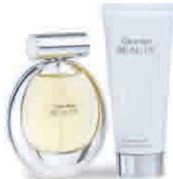
Cofre CALVIN KLEIN BEAUTY Eau de Parfum 50 ml + Luminous skin lotion 100 ml, 55 €