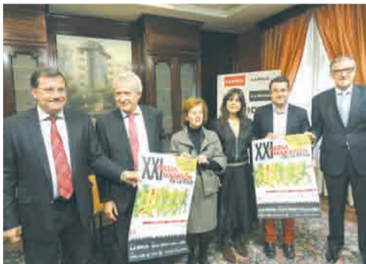
Presentación de la Media Maratón.

Una de las novedades de este año es que se ha adelantado media hora el inicio de la carrera. La inscripción para participar en la Media Maratón ya está abierta a través de internet y de manera presencial se podrá realizar los dos días previos a la misma en la sede de diario La Rioja. Los precios de inscripción se mantienen, 18 euros en las inscripciones previas y 25 euros los