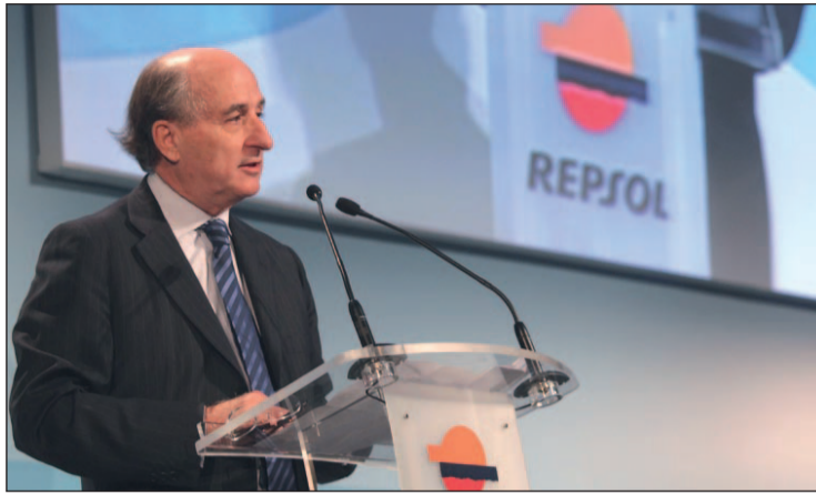
Antonio Brufau, presidente de Repsol

REPSOL EXPROPIACIÓN DE YPF POR ARGENTINA