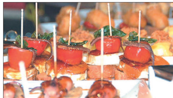
Habrà diversos tipos de raciones y tapas a distintos precios GENTE

Así, habrá diversos tipos de raciones y tapas a distintos precios. Además, habrá actuaciones de baile, música ambiente y calesas de ponis.