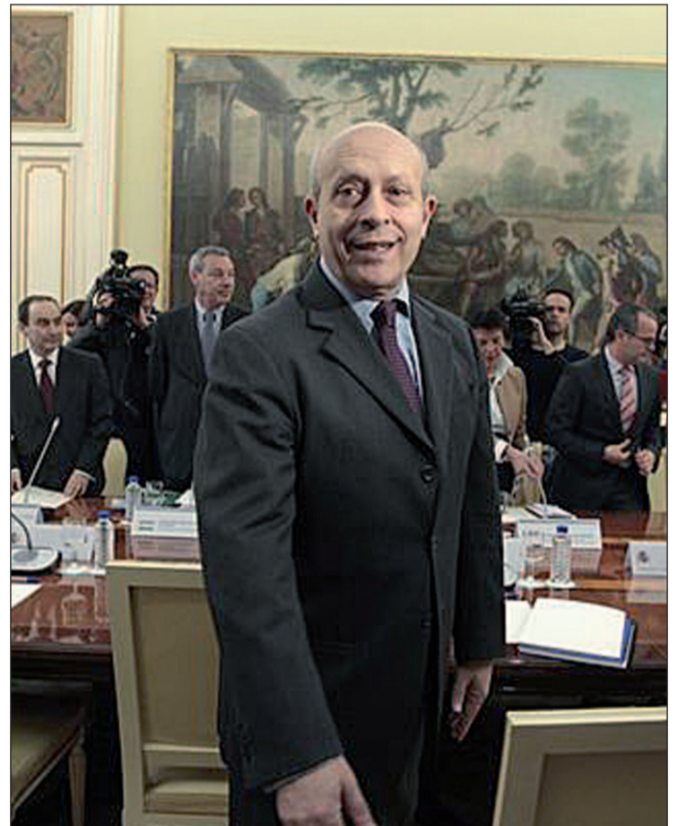
José Ignacio Wert, ministro de Educación

Por otra parte, Wert también ha propuesto aplazar la implantación de los módulos de 2.000 horas de Formación Profesional hasta el curso 2014-2015. También ha propuesto suspender la obligatoriedad de ofertar todas las opciones de Bachillerato y anular la creación de nuevos complementos retributivos del profesorado. Finalmente, ha señalado que las bajas inferiores a los diez días lectivos deberán ser cubiertas con los propios recursos del centro y no por interinos.