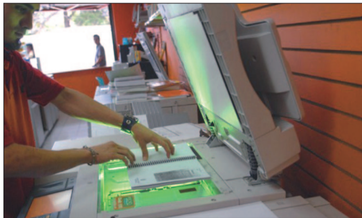
Sala de fotocopias de una universidad española

CEDRO afirma que algunas universidades públicas, y más concretamente las denunciadas, utilizan sus Campus Virtuales para la difusión de ciertas obras de manera ilícita sin respetar los