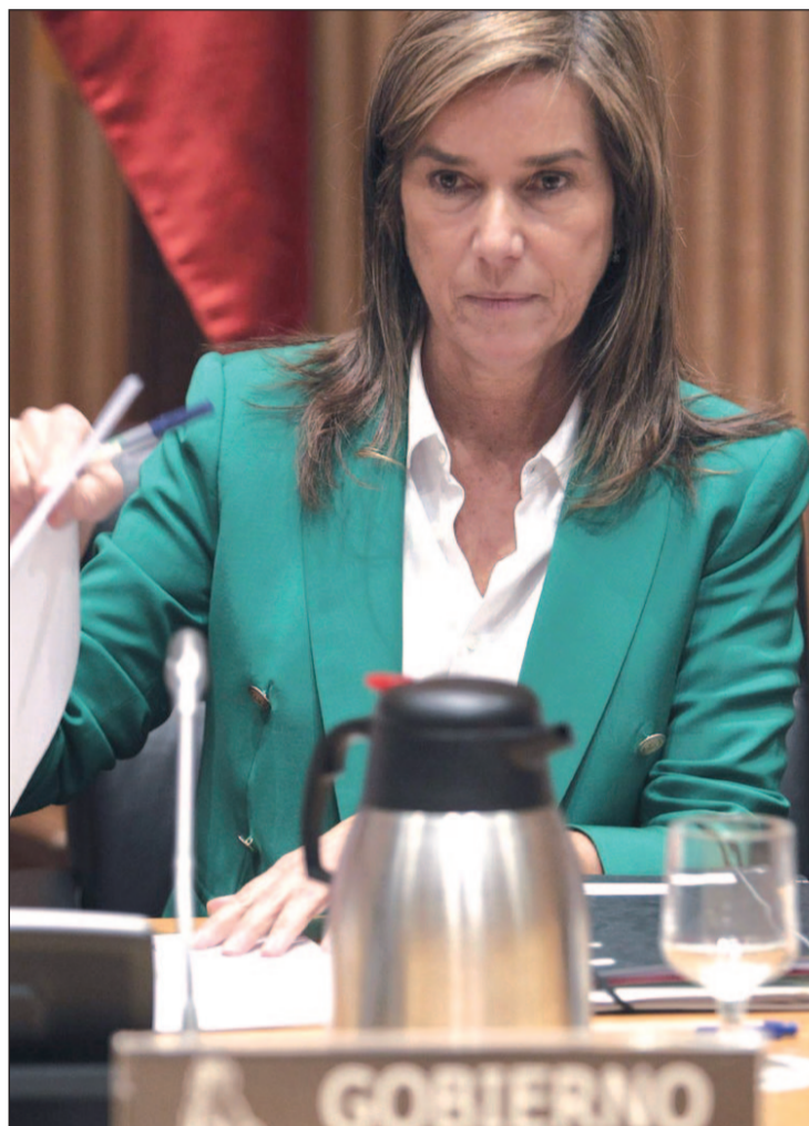
Ana Mato, Ministra de Sanidad, Servicios Sociales e Igualdad

La Ministra de Sanidad, Servicios Sociales e Igualdad, Ana Mato, ante estos datos, mostró su rechazo rotundo ante cual-