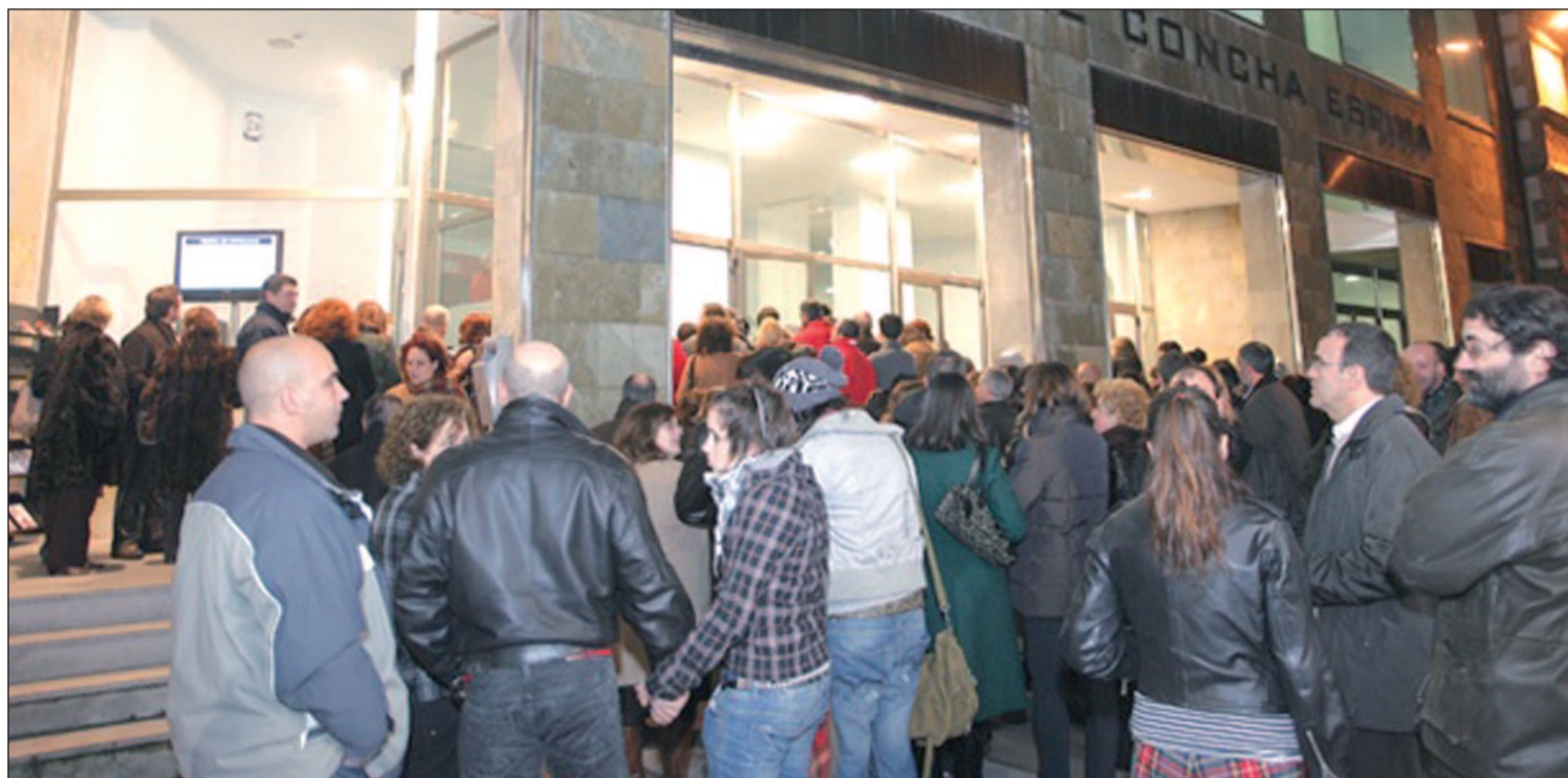
El Teatro Concha Espina de Torrelavega albergará los conciertos del programa MUTE durante los meses de abril y mayo GENTE