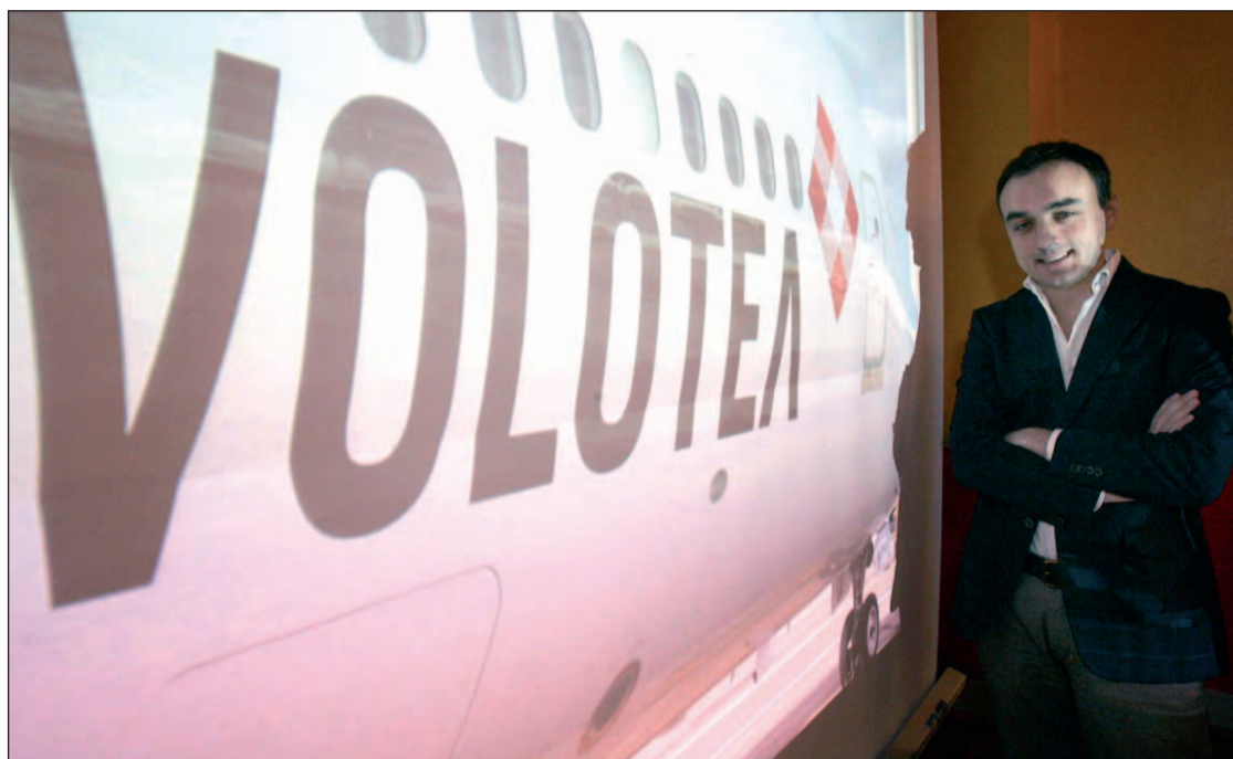
La compañía fue presentada esta semana en una rueda de prensa en el Palacio del Mar de Santander

Durante la festividad de Semana Santa, los precios hoteleros llegaron a aumentar hasta un 66% interanual, sobre todo, en las zonas receptoras de turismo urbano. Sevilla, Cádiz, Córdoba, León, Barcelona y Cáceres son las que ciudades cuyos precios más aumentaron.