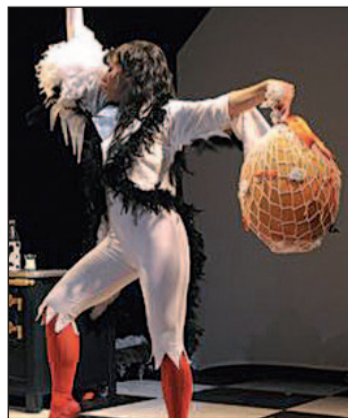
Instantánea de la obra GENTE

En sus sueños, Petit, nos conduce por un mundo de imágenes de la tierra, del aire, del fuego y del mar. Se aconseja un acompañante por niño.