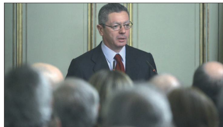
Alberto Ruiz-Gallardón, Ministro de Justicia