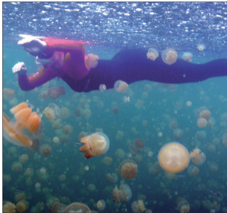
Medusas en su hábitat natural

El dolor es instantáneo y debemos limpiar la herida, pero nunca con agua dulce. Posteriormente hay que aplicar frío sobre la lesión durante unos 15 minutos y bastará con administrar un antiestamínico y un analgésico para el dolor.