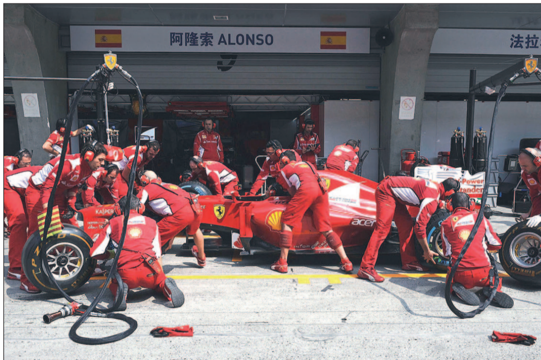
El equipo italiano está viviendo un comienzo de temporada complicado FERRARI ESPAÑA

Con la decisión de Bernie Ecclestone de celebrar esta prueba salvo que los dirigentes locales dijeran lo contrario, la polémica estaba servida. Mientras en el paddock parecía haber unanimidad respecto a no viajar a Bahrein en aras de la seguridad, el director ejecutivo de la Fórmula 1 volvió a hacer oídos sordos. Para aumentar las dudas, el mismo día en el que los equipos llegaban al país asiático, la ciudad de Manama regis-