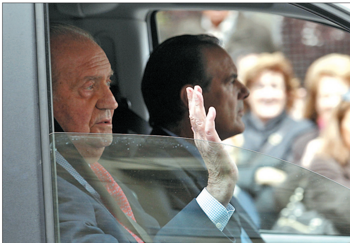
El Rey Don Juan Carlos a la salida del Hospital