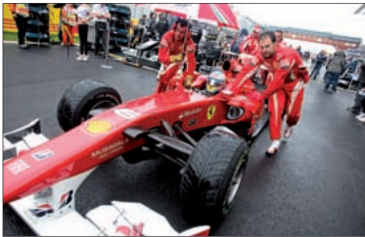
El equipo italiano se llevó la primera alegría del año en Sepang

FÓRMULA 1 EL ASTURIANO DEFIENDE SU LIDERATO