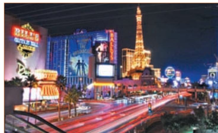
Las Vegas, Nevada

Por último, el 'Spain is different' es la base de una marca sólidamente asentada en el exterior y que genera no pocas tensiones entre su alta valoración.