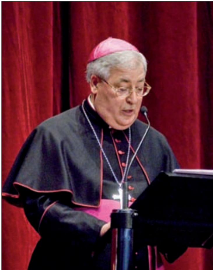
Juan Antonio Reig Plá, obispo de Alcalá de Henares

También señaló que las mujeres que han abortado "llevan el sufrimiento en su corazón y muchas de ellas no pueden dormir y han pasado años y años y años porque el pecado siempre lleva como paga la destrucción de la persona".