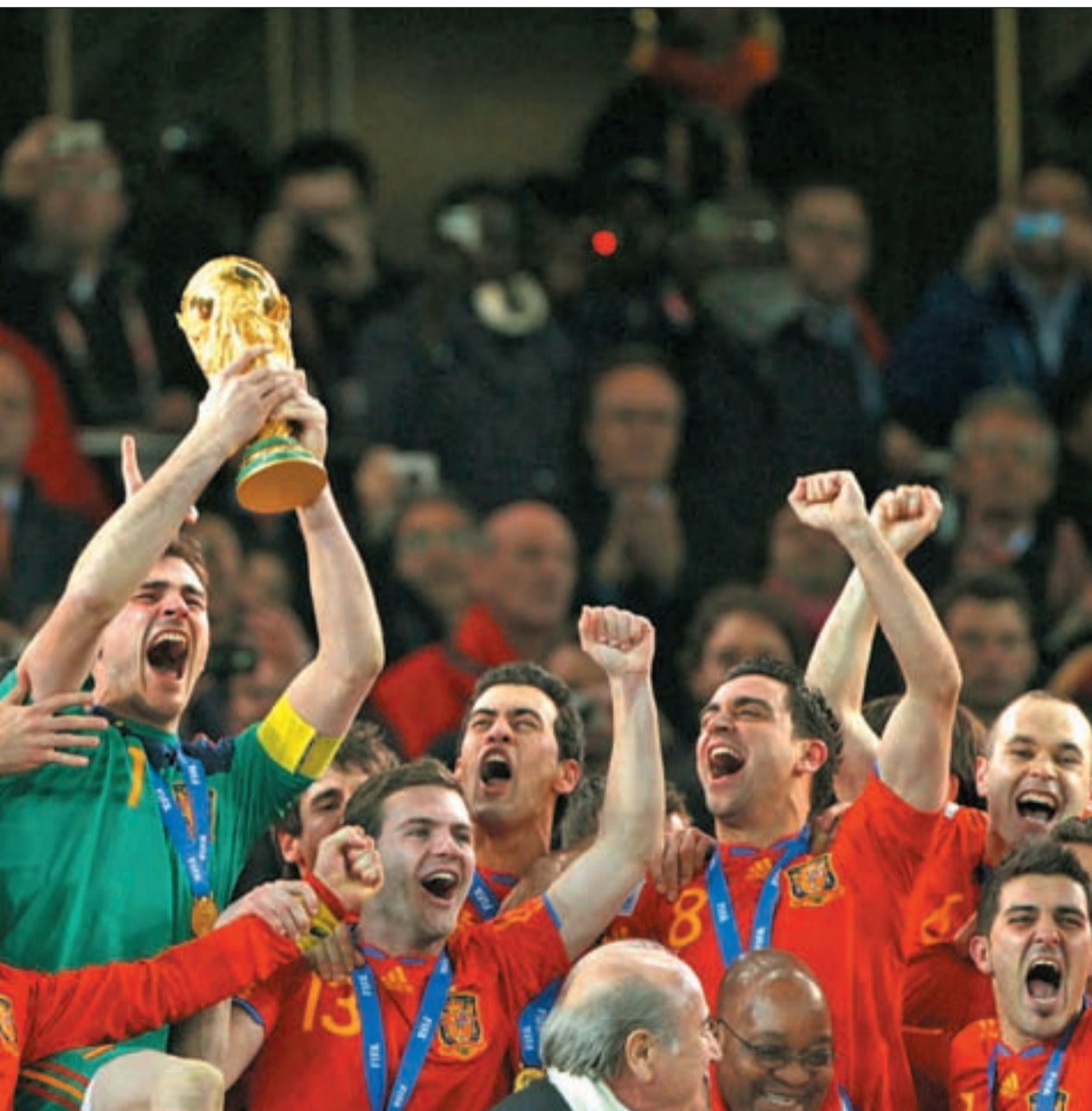
La Marca Española y, por tanto, para la inversión extranjera