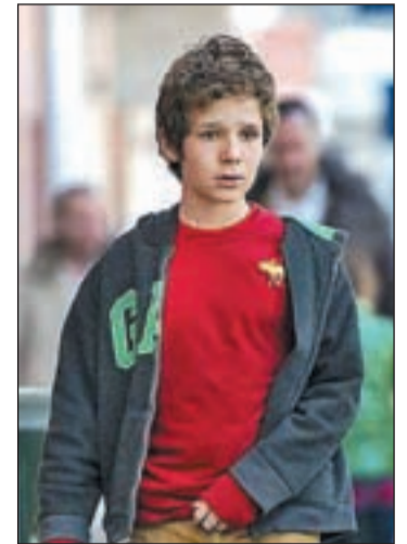
Imagen de archivo

Sin embargo, se cumple una irregularidad legal, ya que Felipe