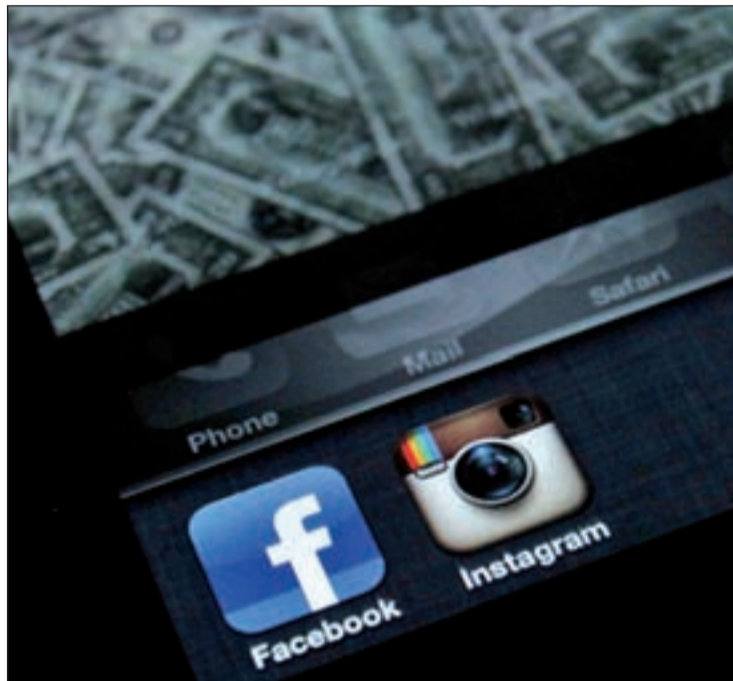
El valor de Instagram en bolsa supera al de The New York Times

Por el momento la aplicación mantendrá su funcionamiento, interacción con otras redes sociales como Twitter y marca. Sin embargo, tras la adquisición de Facebook, el valor de Instagram en bolsa ha cambiado y ahora supera al del periódico The New York Times (741,22 millones de euros), al de la librería Barnes &