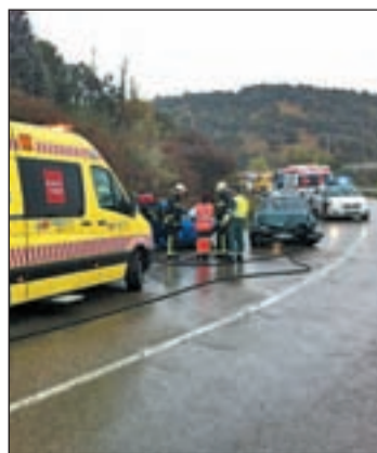
Accidente de tráfico

Se han contabilizado más de catorce mil desplazamientos, doscientos mil menos que el pasado año en el mismo periodo vacacional, pero el número de víctimas mortales ha aumentado