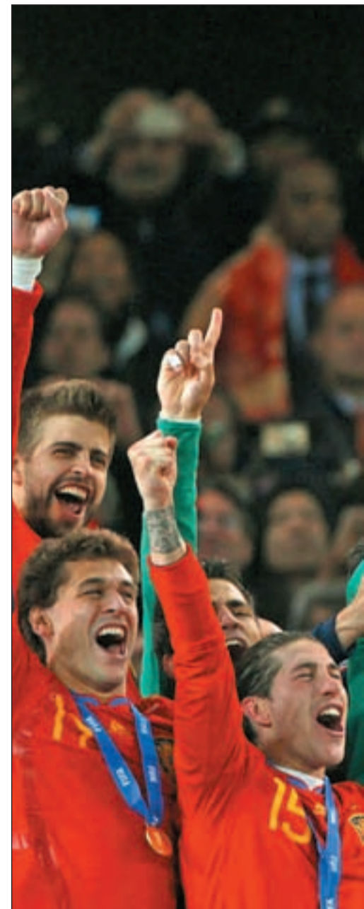
El deporte es un punto clave para la creación de

Por otra parte, no sólo ha incrementado la inversión extranjera en España: la española en el