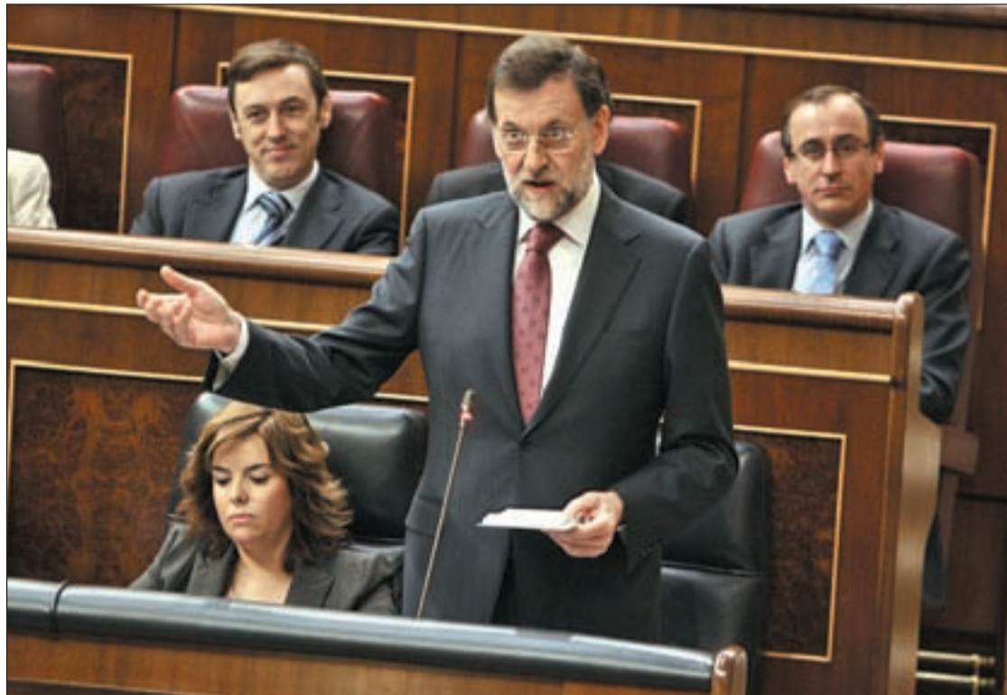
Mariano Rajoy durante su comparecencia en el Congreso de los Diputados

Además, el Programa de Estabilidad "reafirma" el compromiso de reducción del déficit de las Comunidades Autónomas al 1,5% del PIB en 2012. En esta línea, las autonomías que en junio incumplan los objetivos de reducción del déficit serán intervenidas.