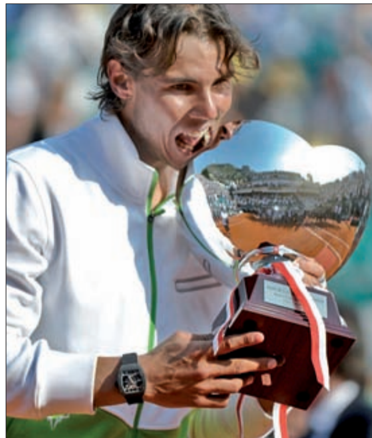
El español posa con el título conquistado el año pasado

Ajenos a ese pulso psicológico, el resto de participantes intentarán romper los pronósticos