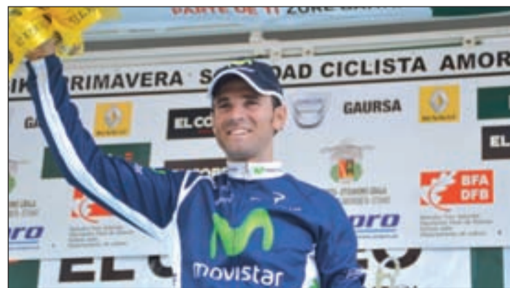
Alejandro Valverde estará en la Flecha Valona

En ambas carreras partirá como favorito Philippe Gilbert, vencedor de ambas el pasado año, aunque varios corredores españoles como Joaquim Rodríguez, Samuel Sánchez o Alejandro Valverde intentarán dejar su sello en dos de las pruebas con más pedigrí del calendario ciclista internacional.