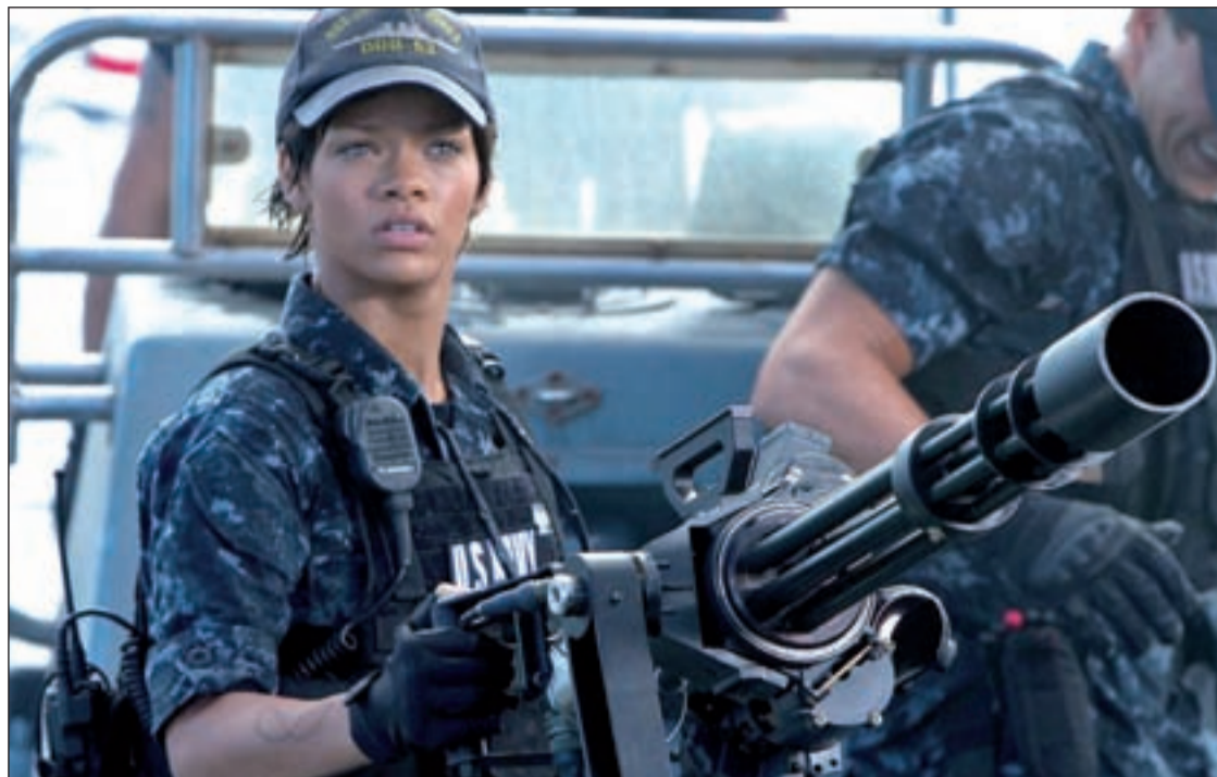
La cantante de Barbados da el salto a los cines