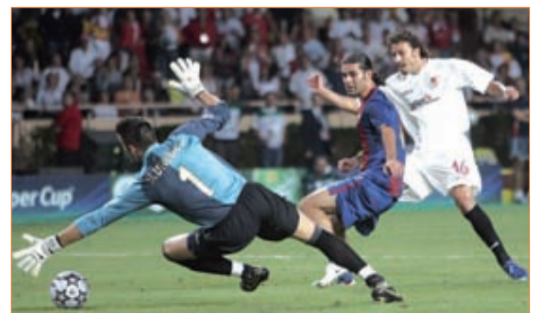
El Sevilla vivió una de sus mejores noches en la Supercopa de 2007

Campeones y la de la Europa League. Muy cerca de ello se quedó el fútbol español en la campaña 2005-2006, en la que el Barcelona ganó su segunda Copa de Europa unos días después de que Sevilla y Espanyol protagonizaran el partido decisivo en la Copa de la UEFA. En esta ocasión, el fútbol español tiene la oportunidad de hacer historia.