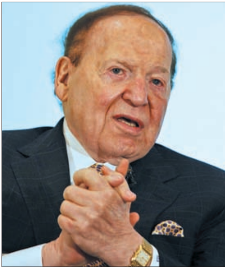
SHELDON ADELSON El propietario de Las Vegas Sands ha asegurado que tanto Barcelona como Madrid tienen sus "diferentes ventajas" para ubicar el megacomplejo Eurovegas y que le gustan ambas ciudades por igual.

Pero, al margen de sus partidarios y detractores, Eurovegas no deja de ser una inversión en el país que aumentaría las cifras españolas por encima del 18,4% que ya han aumentado en el último año. Por eso es preciso dejar el futuro a un lado para centrarse en el presente ya que, a pesar de la crisis, a lo largo del 2011 España ha recibido 28.415 millones de euros de inversión extranjera directa en participaciones de capital (IED), lo que supone un 18,4% más que en el pasado año 2010, según los datos del Registro de Inversiones Exteriores del Ministerio de Econo-