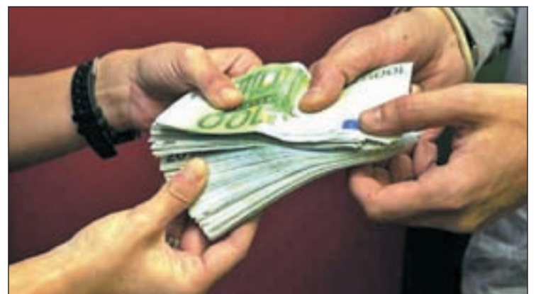
El nuevo plan de lucha contra el fraude limitará el pago en efectivo

El plan de lucha contra el fraude fiscal pretende recaudar hasta 8.171 millones de euros en 2012.