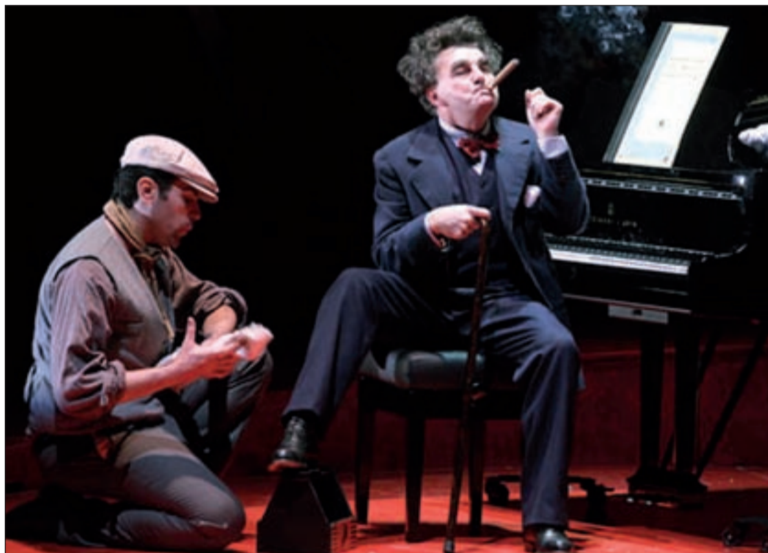
Antoni Comas como el compositor Amadeu Vives

Amadeu pone de manifiesto un combate generacional, con el