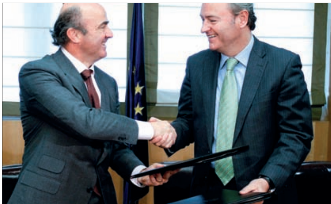
Luis de Guindos y Alberto Fabra durante un encuentro el pasado martes