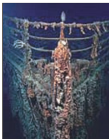
El Titanic cumple 100 años

Pasajeros de 28 países han pagado hasta 8.000 libras (unos 9.900 euros) en el crucero organizado por una firma británica de viajes. El Balmoral seguirá la ruta del Titanic: navegando cerca de