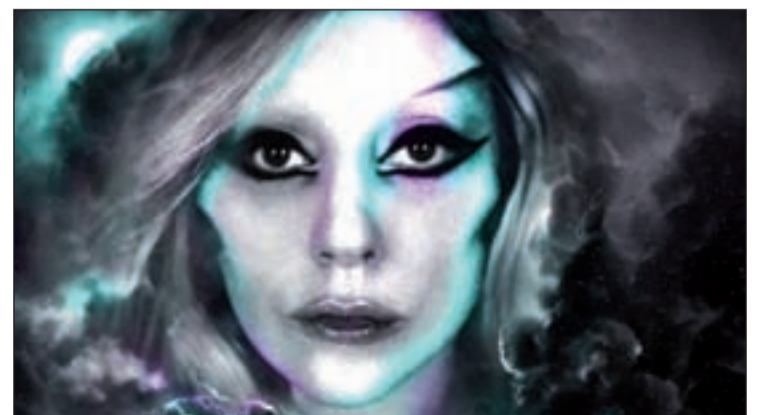
Ya se conocen las fechas de su gira europea

Ganadora de cinco premios Grammy, Lady Gaga vuelve a los escenarios en un nuevo tour, que la propia artista ha definido como "una Electro-Metal-Pop-Opera".