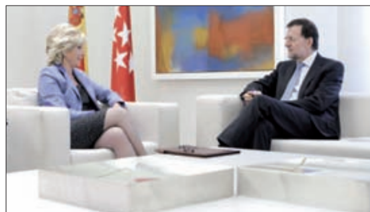
El presidente del Gobierno, reunido con Esperanza Aguirre en Moncloa

"Tenemos que cortar radicalmente con las duplicaciones y triplicaciones de funciones que se producen en este momento. Hay que acabar con todo lo que sea superfluo para poder conservar y mejorar lo que es imprescindible", declaró la presidenta del ejecutivo autonómico tras su reunión con Rajoy.