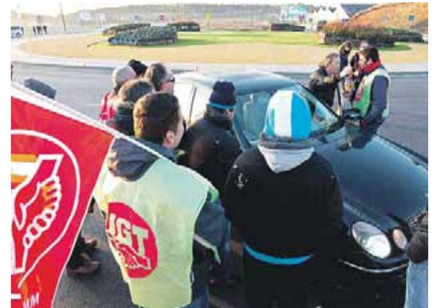
Piquete en los accesos al polígono de Villalonquéjar.