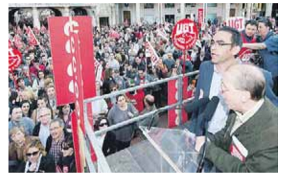
Miles de personas se manifestaron por las calles de la capital como colofón a una jornada de huelga que se desarrolló sin incidentes graves. Al final de la marcha, los líderes de UGT y CCOO leyeron un comunicado en la Plaza Mayor.