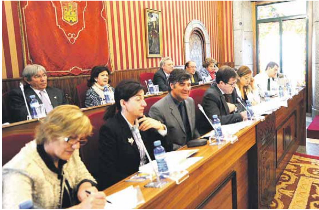
El Pleno aprobó el Plan de Ajuste Económico con los únicos votos a favor del equipo de Gobierno.

El alcalde avanzó que el plan de ajuste "establece unos mínimos" y obligará "a ir haciendo, en distintos momentos, la oportuna actualización de la presión fiscal, dentro de una moderación; habrá que ir actualizando el IPC o lo que proceda en cada caso". Y todo ello, "prestando buenos servicios de calidad y manteniendo la actividad de los centros dotacionales ra-