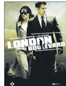
LONDON BOULEVARD Dir. William Monahan. Int. Colin Farrell, Keira Knightley. Thriller.