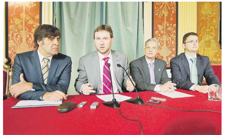
El alcalde, en la presentación de la 1ª edición de los Premios Ciudad de Burgos.

Aunque esta primera edición se ha convocado en marzo y el acto institucional de entrega de los premios tendrá lugar en junio, la intención del Ayuntamiento es que sucesivas entregas se convoquen en torno a Navidad, para resolverse en el primer trimestre del año siguiente.