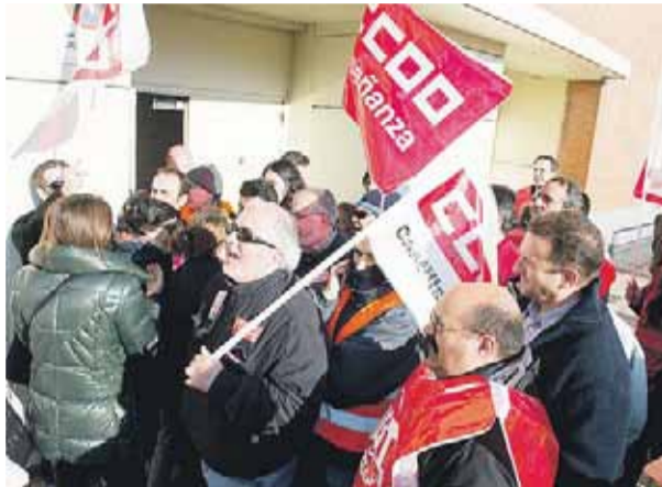
La presencia de piquetes obligó a muchos comercios a cerrar.

HUELGA GENERAL 29-M | MUCHAS EMPRESAS PACTARON EL CIERRE; COMERCIO Y HOSTELERÍA ECHABAN LA PERSIANA ANTE LA PRESENCIA DE LOS PIQUETES