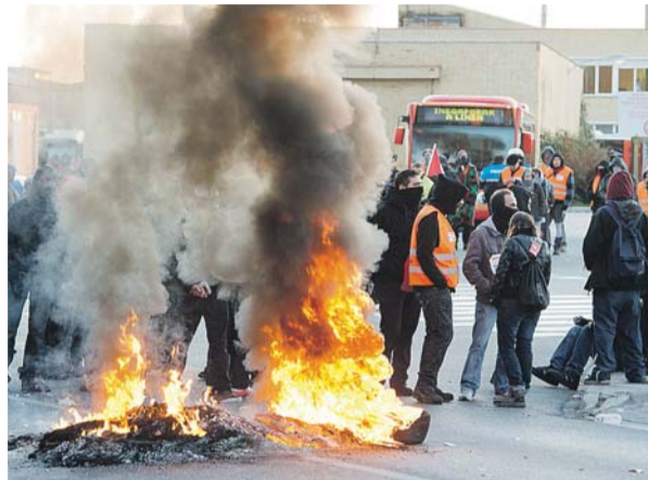
Un piquete impide la salida de un bus municipal.