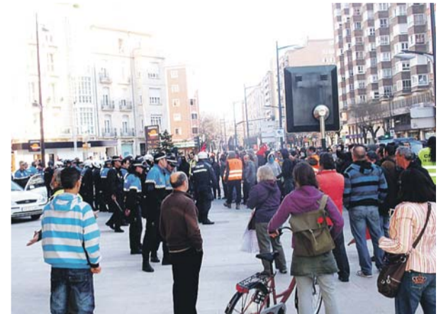
Enfrentamiento entre un piquete y la Policía en la Avda. del Cid.