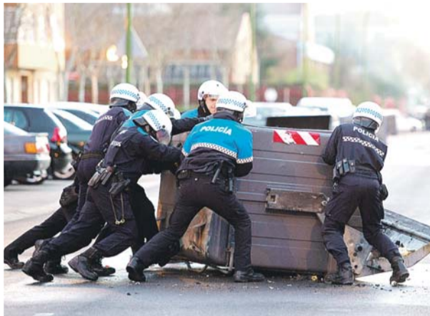
La Policía retira un contenedor de la vía pública.

HUELGA GENERAL 29-M | UN PIQUETE DE LA CGT IMPIDIÓ HASTA LAS 10.00 HORAS LA SALIDA DE LOS AUTOBUSES URBANOS DE COCHERAS