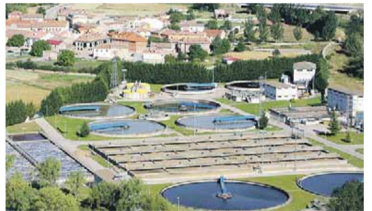
Vista general de la depuradora con el barrio de Villalonquéjar al fondo.

El Corte Inglés presentó el día 26 en un desfile en el Museo de la Evolución Humana las nuevas tendencias de moda primavera para mujer, hombre y jóvenes. Tonos fucsias y naranjas, estilo náutico y prendas de aspecto singular son algunas de las propuestas para la nueva estación.