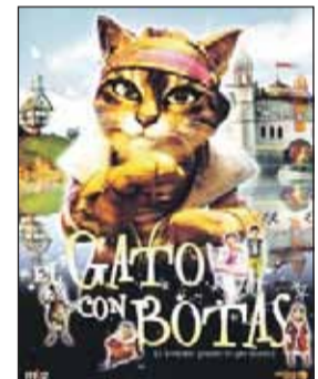
EL GATO CON BOTAS Dir. Raman Hui. Int. Animación. Comedia/Aventuras.