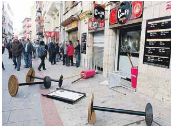
Daños en una cafetería de la C/Moneda tras el paso de un piquete.