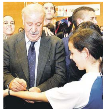
Vicente del Bosque durante la visita a la Universidad.

El seleccionador nacional de fútbol, Vicente del Bosque, visitó la Universidad de Burgos e impartió una conferencia sobre los valores en el mundo del deporte en el Aula Magna. Del Bosque, tras una breve visita por las instalaciones universitarias, habló sobre la importancia del deporte en la educación de los más jóvenes y las buenas relaciones personales como factor de éxito en la selección nacional.