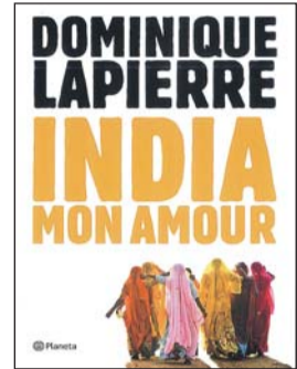
INDIA MON AMOUR Dominique Lapiere. Novela.