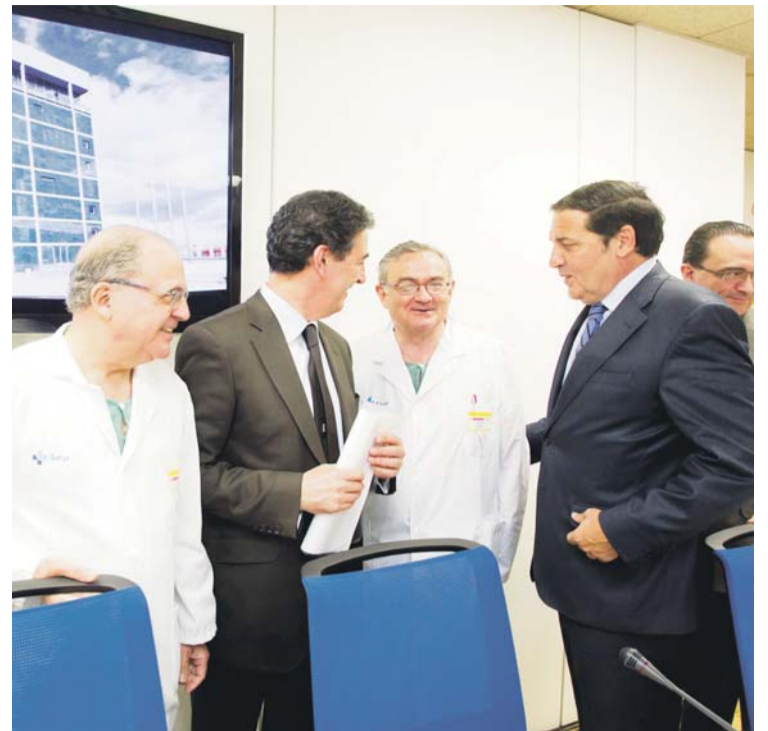
El consejero visitó las instalaciones para conocer la marcha del traslado.