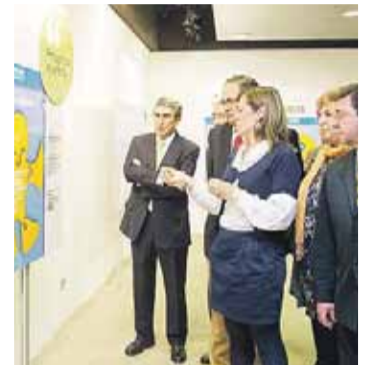
La consejera presentó a los colectivos la nueva norma regional.