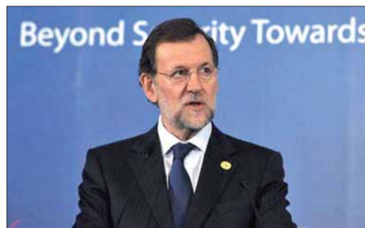
Mariano Rajoy durante la Cumbre Nuclear en Seúl.

En los dos primeros meses del año el Estado registró un déficit