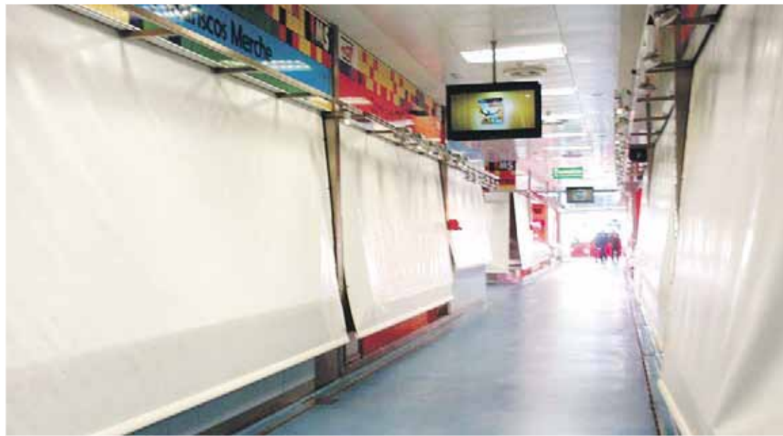
Muchos puestos en los mercados de abastos permanecieron cerrados, como éstos del mercado sur.

Por tamaño de empresas, la encuesta revela que las pymes estuvieron trabajando, "más o menos, con normalidad; mientras que han sido fundamentalmente en las grandes en las que se han llegado a acuerdos", señala la patronal.