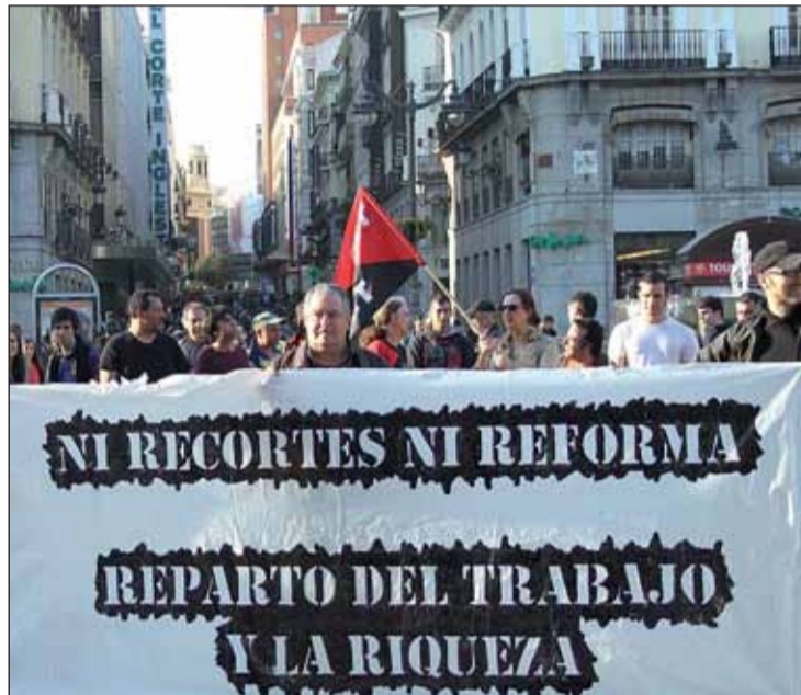
Imagen de una de las manifestaciones contra la reforma laboral.

Durante su comparecencia en la sede de Interior, Díaz destacó dos aspectos claves para realizar estas afirmaciones: la "evolución del consumo eléctrico" y "el arranque de las grandes superficies comerciales". "La normalidad en los centros de trabajo españoles es muy elevada", subrayó.