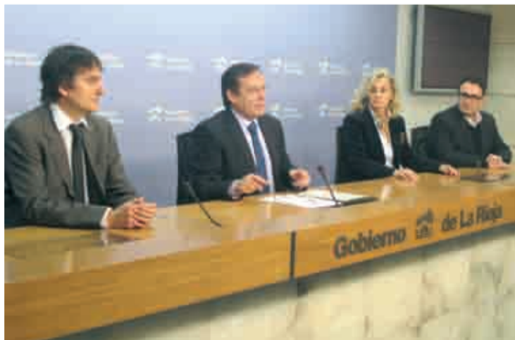
Presentación de las nuevas ayudas.

El resto del presupuesto se destinará a acciones de promoción y servicios que fomenten la incor-