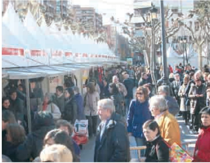
Imagen de archivo de la feria de estocaje.

En su décima edición, el Paseo del Espolón, el escenario de los últimos cinco años, acogerá 240 stands. Este año el número de comercios que participan son 195 y hay 44 establecimientos nuevos. Casi de todo es lo que puede encontrar el visitante en esta feria: Desde ropa de cama, menaje, complementos, ropa, libros, hasta un casco para la