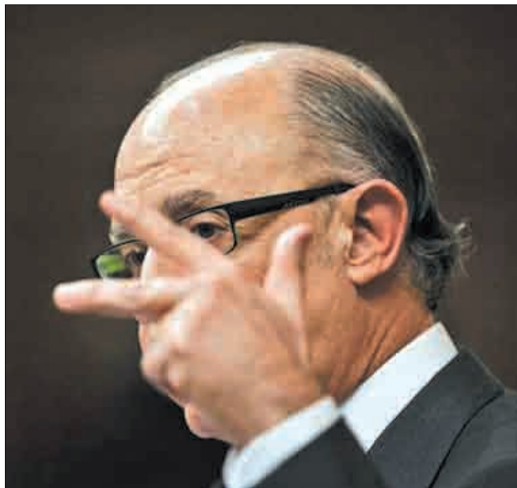
El titular de Hacienda, Cristóbal Montoro, en su comparecencia

La traducción de esta cifra, lejos de paradigmas macroeconómi-