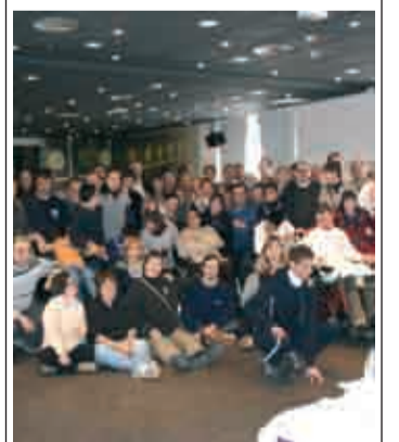
Comedor del hotel Victoria Arnedo.