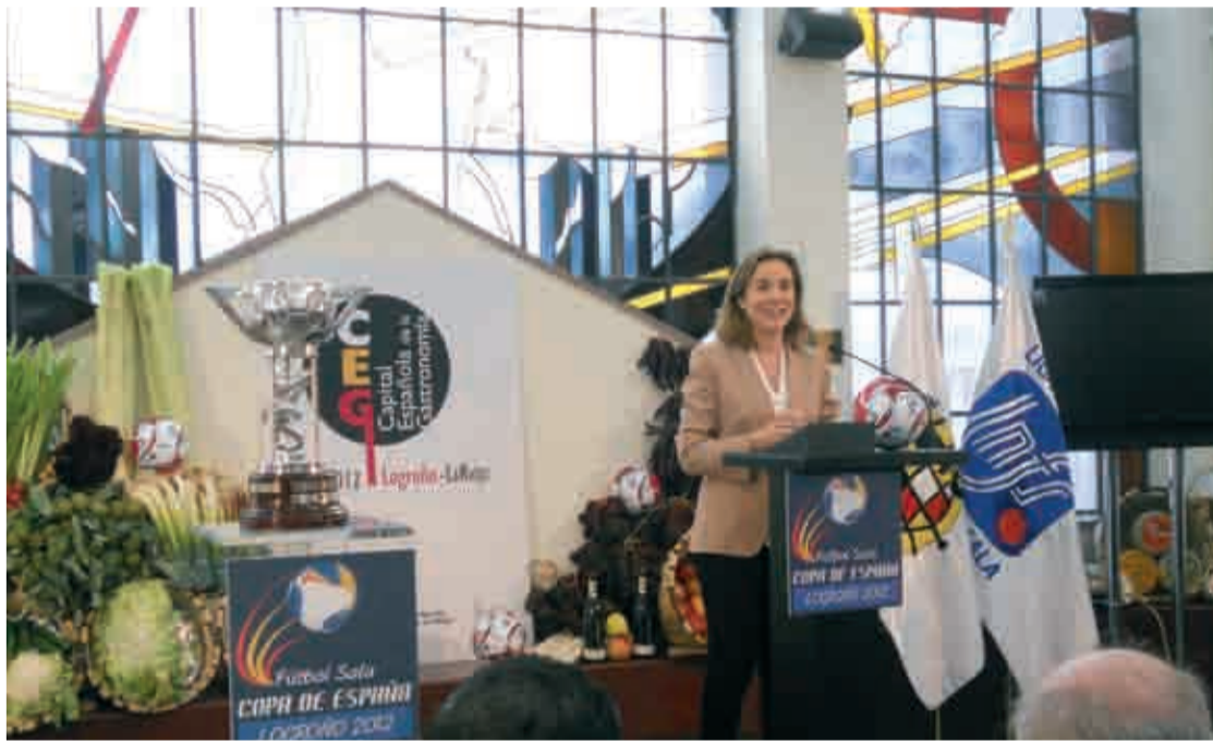
La alcaldesa de Logroño presentó el spot y las actividades paralelas.

Entre las actividades paralelas Lozano destacó la celebración del II Congreso Nacional de Entrenadores y el carácter solidario y de sensibilización que van a tener algunas de ellas como la conmemoración del Día Internacional de la Mujer en el que se leerá un manifiesto en el acto