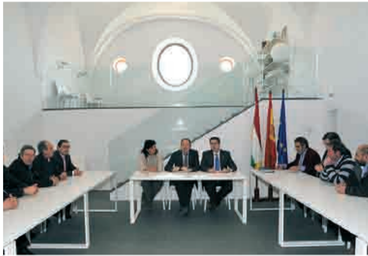
Reunión con los alcaldes del Camero Nuevo.

Durante la reunión con los alcaldes del Camero Nuevo, Sanz abogó por buscar el equilibrio presupuestario entre ingresos y gastos para evitar el endeudamiento y compartir los servicios que se prestan a los vecinos a través de mancomunidades -que