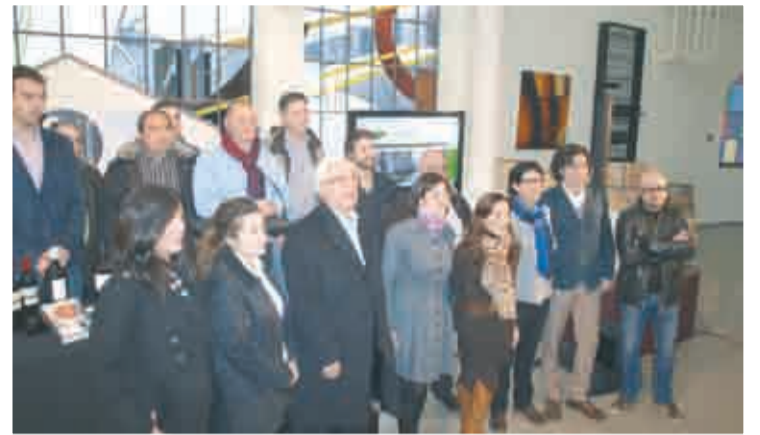
Presentación de la web de 'La Laurel'.