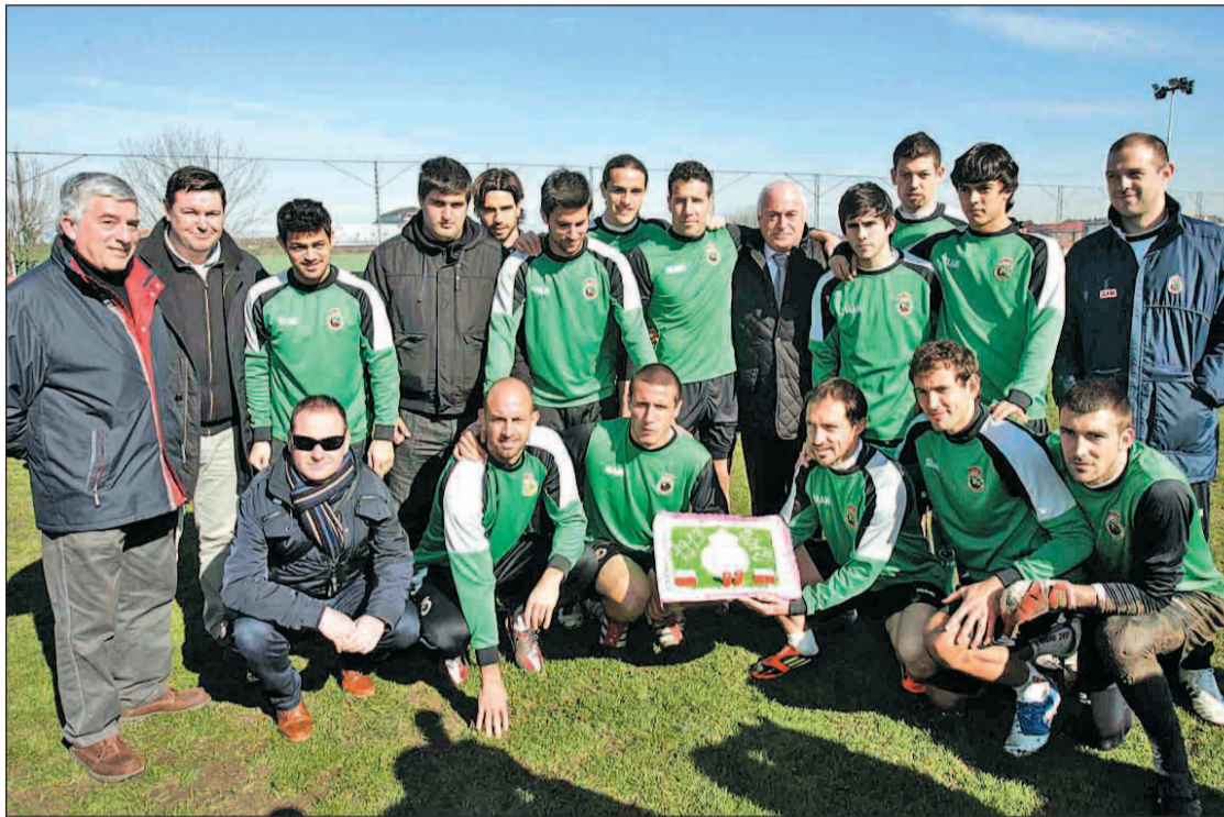
Celebración del 99 cumpleaños con las peñas durante el entrenamiento de este jueves