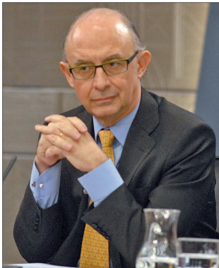
El ministro de Hacienda, Cristóbal Montoro, en una foto de archivo

Aunque no ha precisado la cantidad de dinero que se aportará a este mecanismo sino que se ha limitado a decir que será una