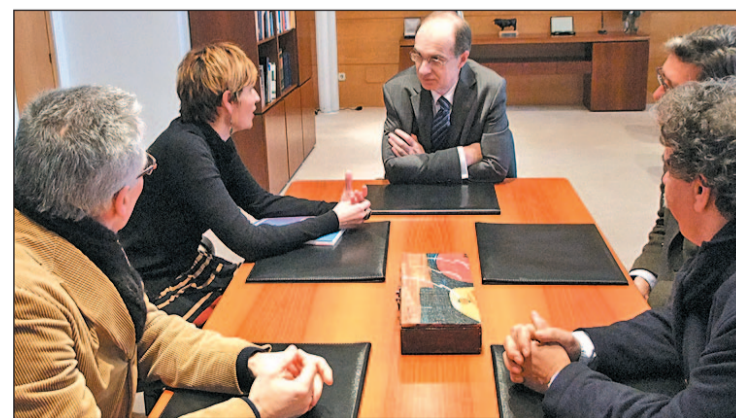
Un momento de la reunión con la Fundación Secretariado Gitano