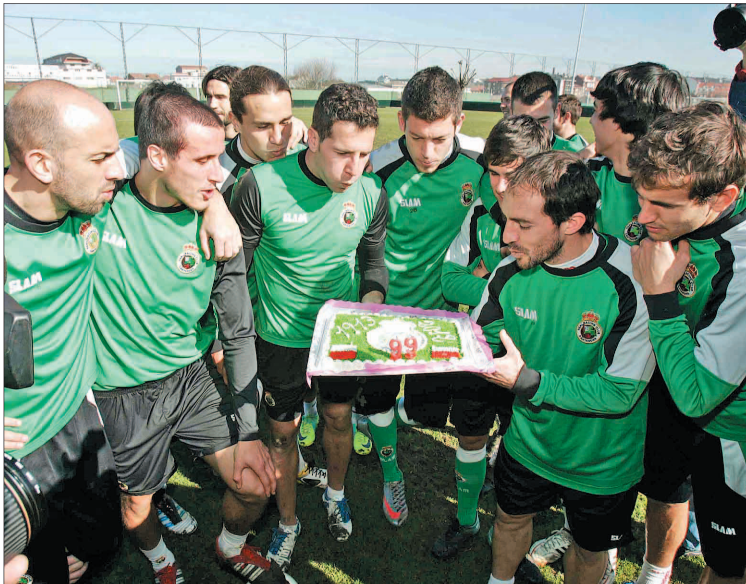
Representantes de las peñas racinguistas llevaron una tarta a los jugadores durante su tiempo de entrenamiento, en La Albericia

El equipo necesita a su afición este sábado, 18 horas, en El Sardinero Pág.18