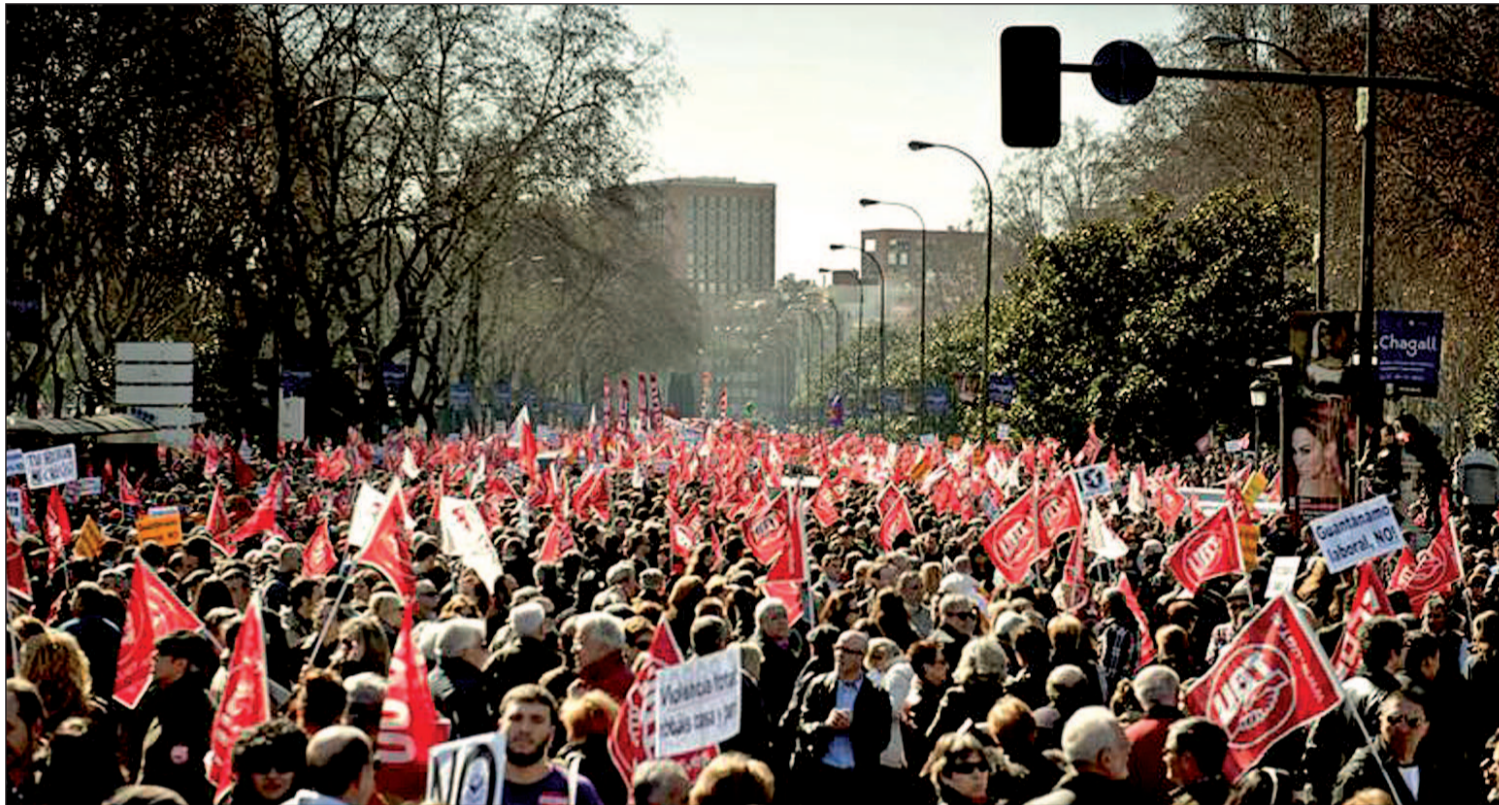
Una de las 57 manifestaciones en toda España en contra de la reforma laboral