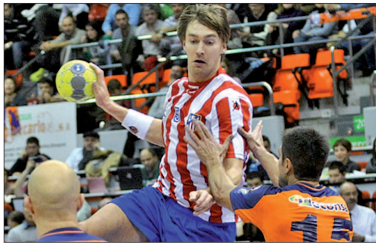
Kallman es una de las referencias del BM Atlético de Madrid

BALONMANO ÚLTIMA JORNADA DE LA FASE DE GRUPOS