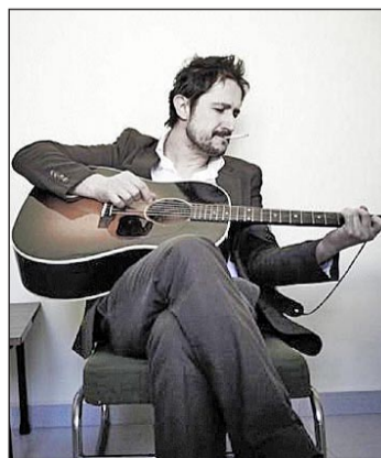
Estará acompañado de su banda

baceteño de adopción que sorprendió a propios y extraños con uno de los trabajos más destacados del pop nacional más reciente. Su eléctrico es el de una banda ensamblada, conjuntada y en el que la canción es más importante que las partes. Viernes 24. Sala BNS.