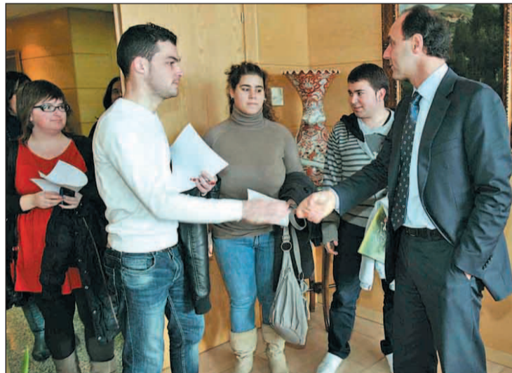
El Consejo de la Juventud continuará funcionando con voluntarios A.A.J.A

CES sin más protestas por ninguna de las dos partes. De la reunión con el Consejo de la Mujer se extrajo la posibilidad ofrecida por el ejecutivo de continuar trabajando "sin local propio y funcionando desde el voluntarismo y con los recursos puntuales que