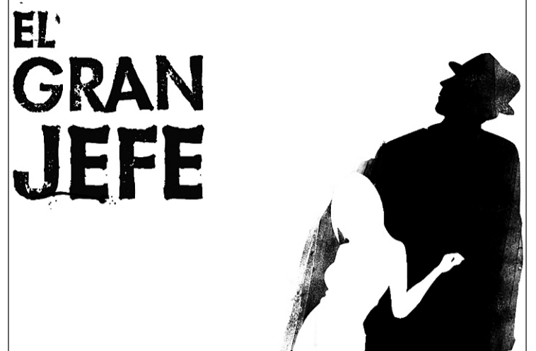
El grupo inició su andadura en 2004. GENTE

Este nuevo centro situado en Peñacastillo e inaugurado recientemente cuenta con una gran pista de hielo abierta a todos aquellos que deseen practicar patinaje. Asimismo, Ice Berry cuenta con todas las comodidades para sus clientes, una gran oferta en hostelería y una nutrida programación de todo tipo de espectáculos.