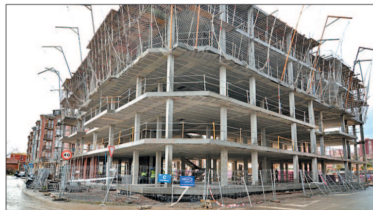
Las VPO han supuesto una inversión de 17 millones de euros GENTE

683 personas se han inscrito en Registro de Demandantes del Gobierno de Cantabria, a través del mostrador habilitado eventualmente en el Ayuntamiento de Santander. Una vez recopiladas todas las solicitudes se procederá a realizar el sorteo de las 123 VPO de La Albericia dentro del plan del Ayuntamiento.