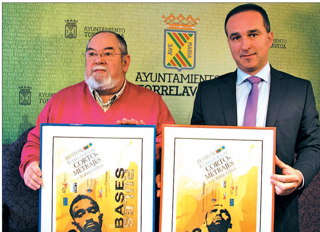
El director del Festival y el concejal de Cultura con el cartel de la XIII edición del evento GENTE

Como novedad de este año, el tríptico aporta información tu-