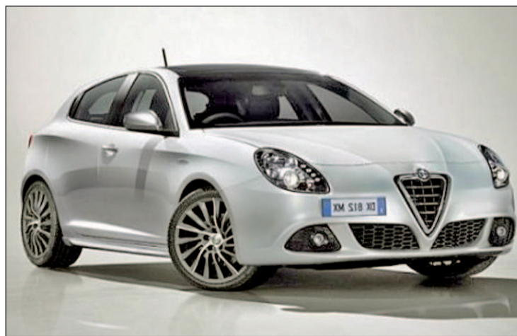
Alfa Romeo Giulietta

Otro coche que cala bastante entre el sexo femenino es el Ibiza Spotify, un coche que nació de la unión de fuerzas de Samsung y la casa española Seat con el objetivo de promover el terminal Samsung Galaxy Mini y su conexión Premium, que permite gestionar miles de descargas musicales. Esta versión del Ibiza tiene tres carrocerías dis-