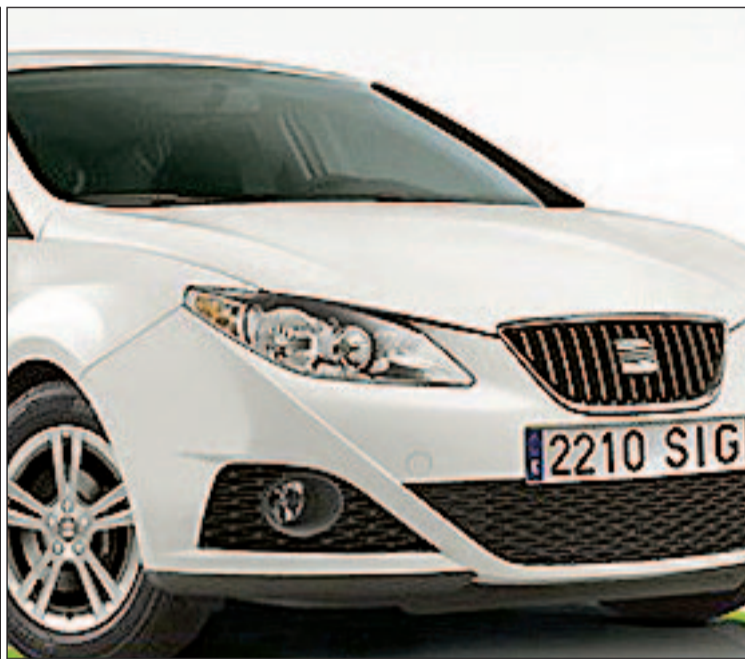
A la izquierda Iron Diamon de la casa rusa Dartz Prombron, a la derecha Seat Ibiza Spotify