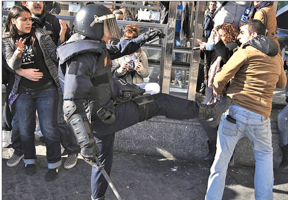
Las cargas policiales se han saldado con más de una veintena de heridos y al menos 26 detenidos, 6 menores

Al respecto, el ministro de Interior, Jorge Fernández Díez, ad-