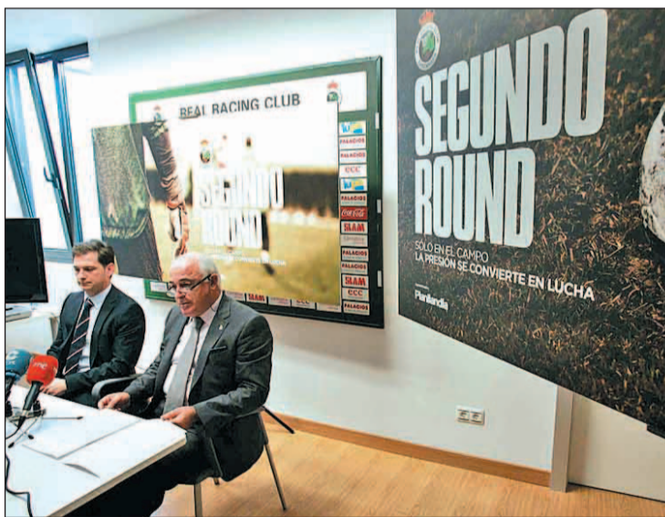
Corino en la presentación del vídeo promoción del Racing. ALBERTO AJA

serie de actividades que el club ha hecho de forma conjunta con la empresa Planilandia. Para todos aficionados que deseen ver el vídeo el link es http://www.planilandia.com/racing2012/Racing_calidad_internet.m4v.zip . Por último, el club ya ha puesto en marcha el proyecto de creación de la Fundación Real Racing Club en la que se espera que formen parte Ayuntamiento de Santander y Gobierno de Cantabria. Para formar la Fundación, ésta tiene que estar dotada con 50.000 euros, de los que el Racing pondrá 30.000 euros y Ayuntamiento y Gobierno tendrían que dar 10.000 euros cada uno.