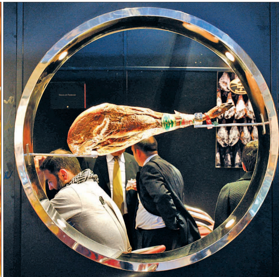
Arasti señaló que se han promocionado estas jornadas entre los principales visitantes de la región, vascos y castellanoleoneses