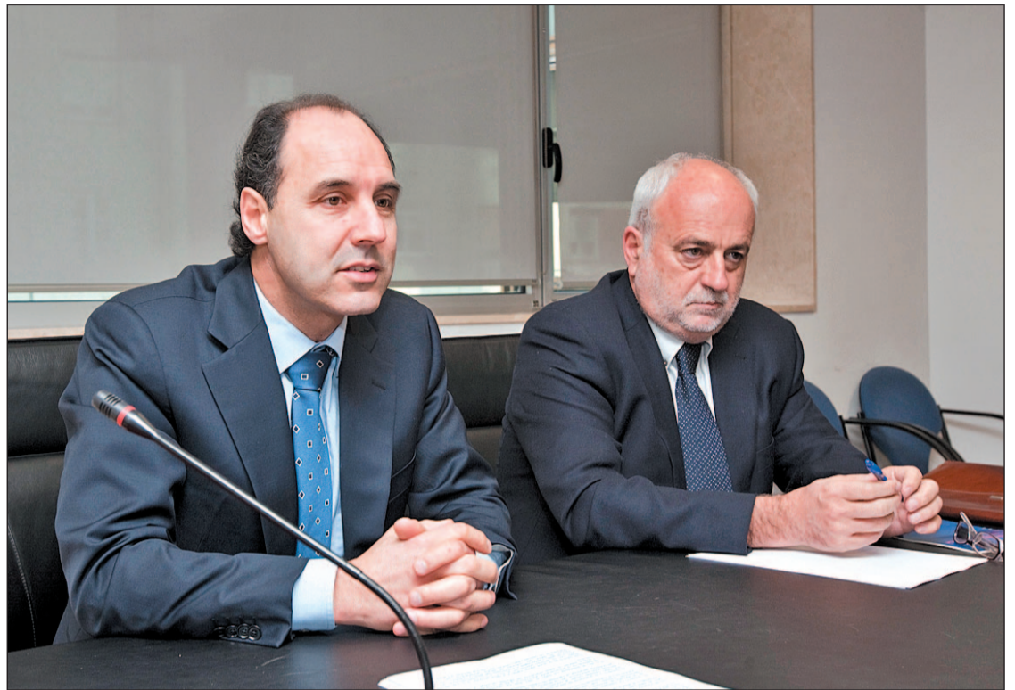
Varios miembros del Consejo Económico y Social se trasladaron al Gobierno para la reunión GENTE

En este sentido, el presidente de Cantabria ya empezó esta semana a reunirse con los colectivos que serán suspendidos temporalmente. El primer encuentro se produjo con el Consejo Económico y Social (CES), a continuación con el Consejo de la Juventud de Cantabria y, por último, a mediodía, con el de la Mujer. Así, se acordó el cierre del