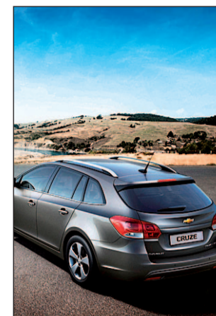
Chevrolet Cruze Station

En el IVAM, el público podrá observar los atributos de innovación, refinamiento y diseño que, a simple vista no se aprecian en el Citroën DS5. Pero este modelo no sólo destaca por una estética y una línea únicas, sino también por incorporar la tecnología full-hybrid diésel Hybrid4 que, además de prestaciones, posibilita unas emisiones reducidas de 99 g/km de CO 2 .