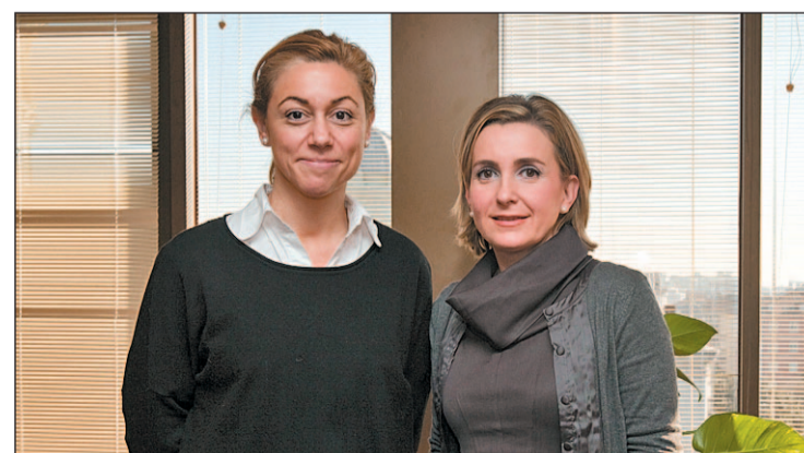
La consejera de Economía y la presidenta de la CEOE