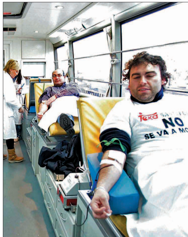
La jornada de donación obtuvo gran afluencia entre trabajadores A.AJA

Sobre los avances en la negociación, Mier indicó que el comité tiene "su estrategia al igual que la empresa tiene la suya". "No nos vamos a engañar, se empieza diciendo una cifra y luego siempre hay un margen de maniobra", destacó aludiendo a que es posible que la empresa se guarde una mejor oferta hasta el último momento. Es por eso que ellos decidieron pelear