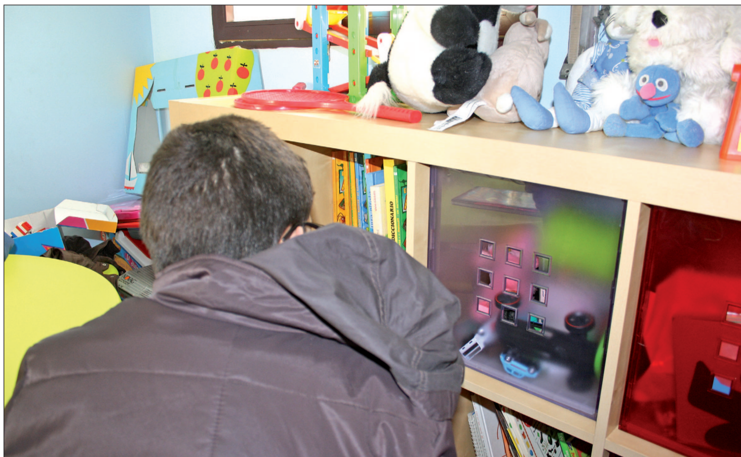
El Síndrome de Asperger es uno de los más difíciles de detectar