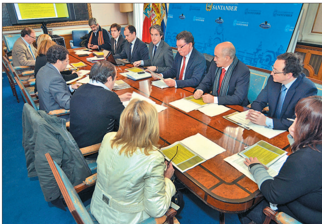
Imagen de la Comisión Mixta del Cabildo de Arriba que tuvo lugar este jueves en el Ayuntamiento GENTE

Finalmente, el ente gestor de las actuaciones estará conformado