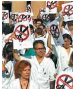
Médicos contra el tijeretazo.

ce difícil su funcionamiento". Los facultativos sostienen que la profesión médica no debe aceptar recortes que provoquen pérdidas de calidad en la asistencia, "especialmente cuando sus efectos recaen en los más pobres, débiles, desfavorecidos e indefensos".