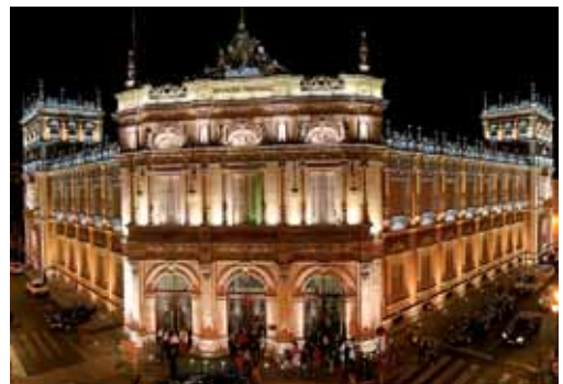
Esta convocatoria se suma a las actuaciones del programa 'Creceemos'.

Esta convocatoria se suma a la ampliación de los servicios para niños de 0 a 3 años mediante el programa Creceemos , cofinanciado con la Consejería de Familia e Igualdad de Oportunidades, para aquellos municipios de la provincia que no disponen de Centros Infantiles y tienen una demanda de menos de 15 plazas.