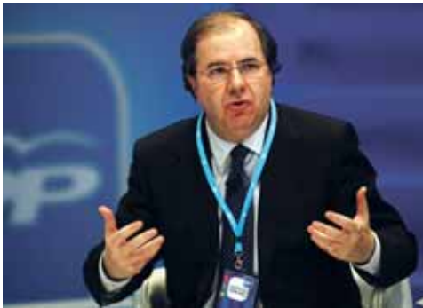
Juan Vicente Herrera durante la pasada campaña electoral.