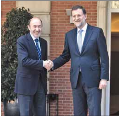
El presidente Rajoy durante su encuentro con Rubalcaba.

Como era de esperar, ETA y el fin de la violencia también ha estado sobre esta mesa. Sin embargo, ninguno de los dos mandatarios ha querido verter en público la conversación mantenida en privado. Tan sólo Rubal-