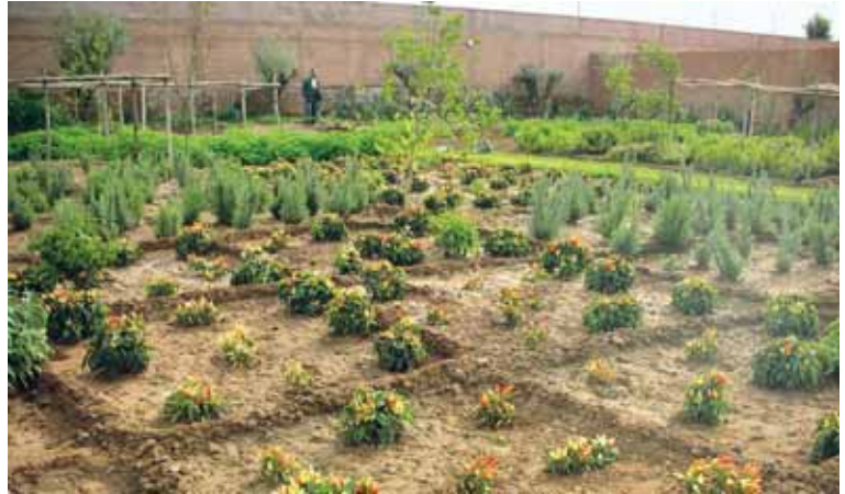
Uno de los huertos participantes en el proyecto con el que ha sido premiado el Ayuntamiento de Atapuerca.

MEDIO AMBIENTE DOS ENTIDADES LOCALES Y DOS ASOCIACIONES