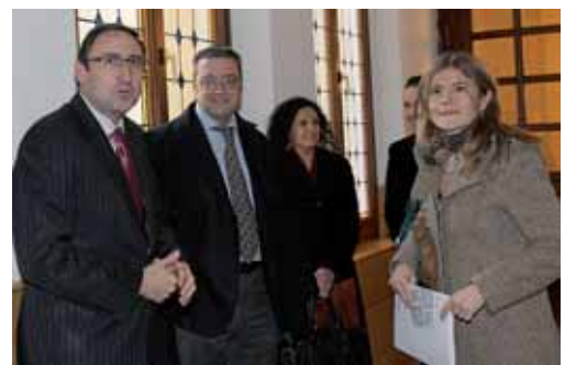
El Consistorio capitalino fue el escenario de la reunión.

Otro de los temas que también se trató durante el encuentro del pasado miércoles 15 de febrero fue la necesidad de "trabajar en la misma línea", por ello hay que fomentar la "coordinación, cooperación y priorización de actuaciones" que permita a las dos administraciones "no solapar esfuerzos para ser más eficaces con las inversiones que realicemos" y lograr, de este mo-