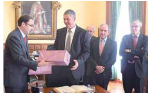
El presidente de Renault España firmó en el libro de honor de la ciudad.