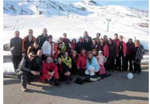
Imagen de una de las actividades en la nieve organizadas por Diputación.

Por otro lado, la Semana Blanca es una de las principales actividades dentro de los Juegos Escolares de la provincia de Palencia y consiste en cinco días de esquí, en dos turnos, el primero de ellos del 26 de febrero al 2 de marzo y el segundo del 4 al 9 de