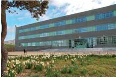
La página web posee un calendario con actividades e imágenes.

El contenido de www.catedrademicologia.es está basado en ofrecer información sobre los hongos así como centralizar las actividades