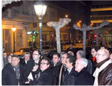
En la imagen, un momento de la presentación.

De esta forma, cabe señalar entre las ventajas más importantes la rebaja del consumo eléctrico y un ahorro entre el 66,5 y el 80 por ciento, el ajuste automático de la luz ambiental según la puesta y salida del sol, la posibilidad de establecer patrones automáticos por zonas o barrios, el control manual por la policía o los bomberos en el caso de accidentes o