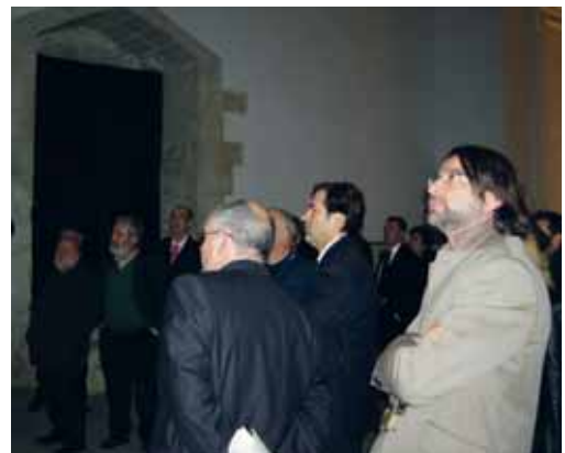
El director general de Turismo, segundo por la derecha, junto a los asistentes al III Convite de Campings celebrado en el antiguo monasterio.

Al finalizar el acto se entregaron diferentes placas de reconocimiento a miembros de la asociación.