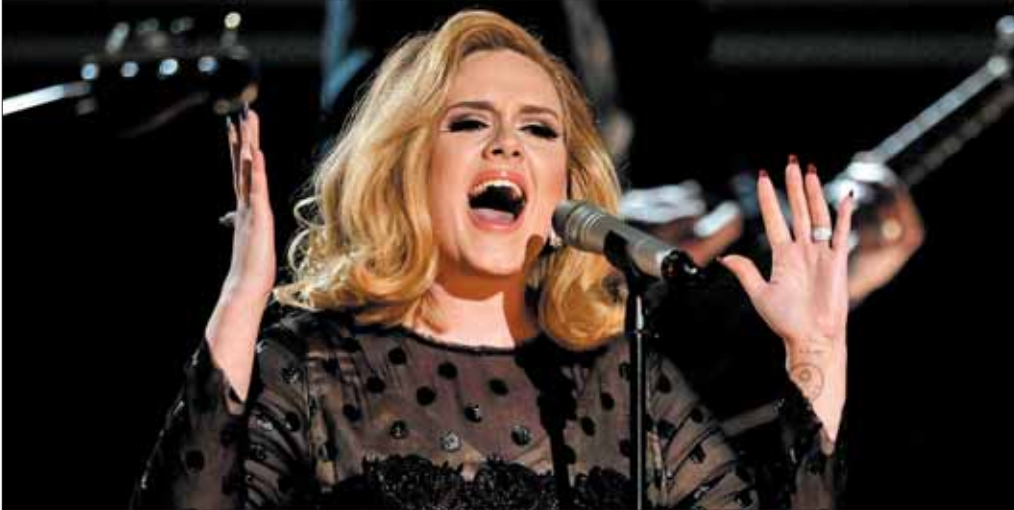
Llevaba cinco meses sin subirse a un escenario.