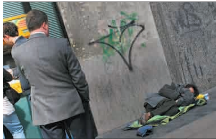
Imagen cotidiana tomada en la Gran Vía de Madrid

En mayo de 2010, España se propuso llegar a una cifra comprendida entre 9,1 y 9,2 millones de personas en riesgo de pobreza y exclusión, reduciendo en un millón y medio en el periodo 2009 - 2010 el volumen de ciudadanos afectados. Sin embargo su trayectoria ha ido en dirección contraria tras