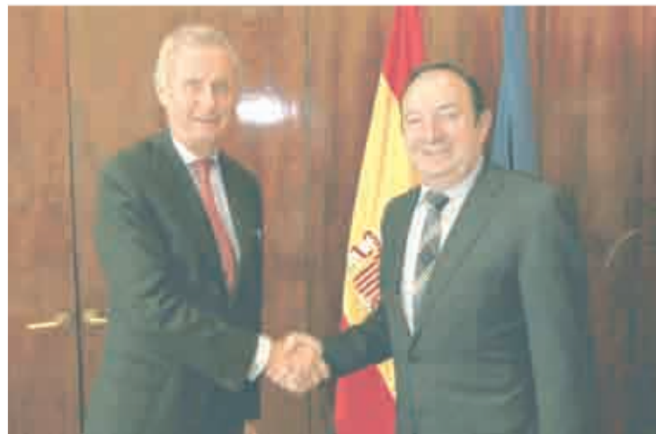
Pedro Morenés y Pedro Sanz.

Por otra parte, Pedro Sanz expresó a Morenés su satisfacción por la decisión del Ministerio de Defensa de bautizar uno de los submarinos S-80, concretamente el S-83, con el nombre del inventor riojano Cosme García.