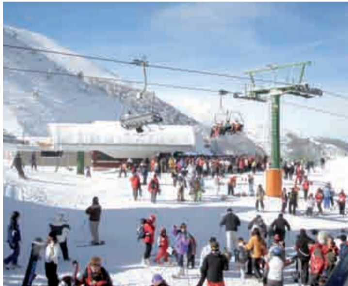
Estación de esquí de Valdezcaray.

Los accesos estarán todos abiertos así como los telesillas, a excepción del de 'Campos Blancos' y 'Valdezcaray'.