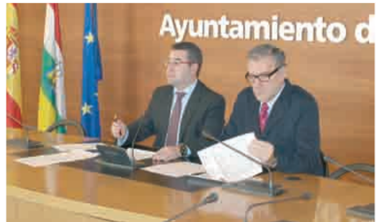
Presentación, en rueda de prensa, de la revisión de contratos.

REVISIÓN DE 13 CONTRATOS DE LOGROÑO DEPORTE