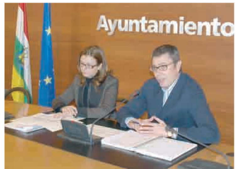
Presentación de los trabajos de transformación urbanística.

En el seno de la misma Comisión se debatió sobre la conveniencia o no de ejecutar el aparcamiento subterráneo para 600 plazas previsto en el proyecto. "Estamos estudiándolo pero cabría la posibilidad de reducir el parking a la mitad, a 300 plazas aproximadamente, o utilizar las que están disponibles