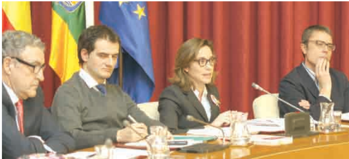
Sesión de Pleno Ordinario del 2 de febrero en el Ayuntamiento logroñés.

Entre las alegaciones aceptadas, destaca la de FER Comercio, referente a las zonas peatonales, donde de la instalación de mamparas u otras estructuras estables que ocupen el frente de un establecimiento comercial, precisarán de la autorización del titular del