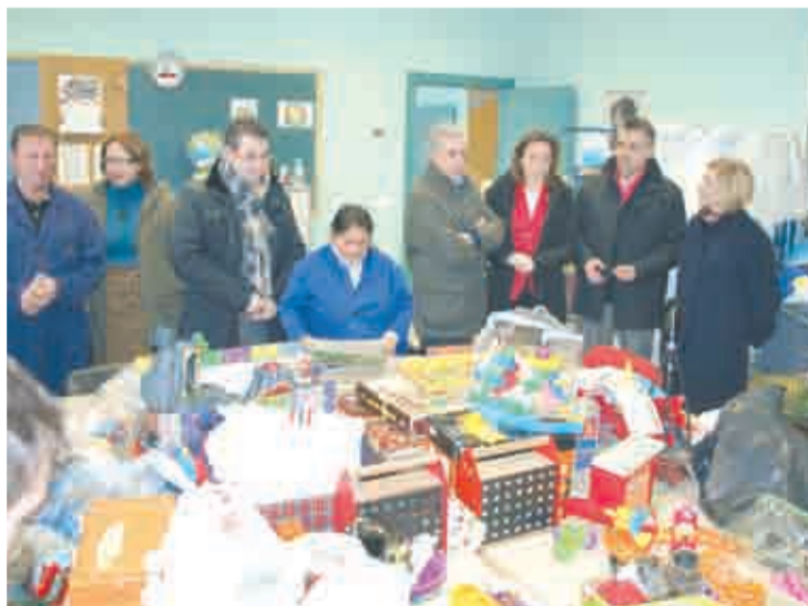
Visita al Centro de Ocupación de Cáritas.

el de Prevención Encuentro Familiar (3.500 euros) y el de Mantenimiento y Conservación de Centro de Día (2.200 euros), todos ellos de Proyecto Hombre.