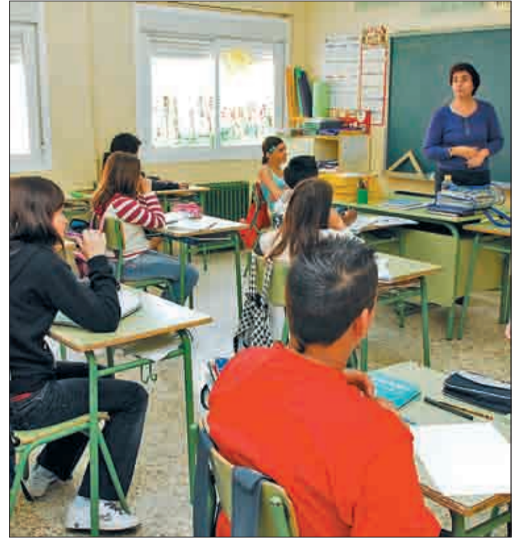
Los colegios tendrán una nueva asignatura

La reforma de la Ley de Salud Sexual y Reproductiva y de la Interrupción Voluntaria del Embarazo exigirá la autorización paterna para poder abortar, además el ministro de Justicia, Alberto Ruiz-Gallardón, ha explicado que la anunciada reforma fijará una serie de "supuestos" y no de plazos, como actualmente está estipulado, en los que el aborto estará despenalizado. Gallardón también se refirió a la cuestión de que las jóvenes de 16