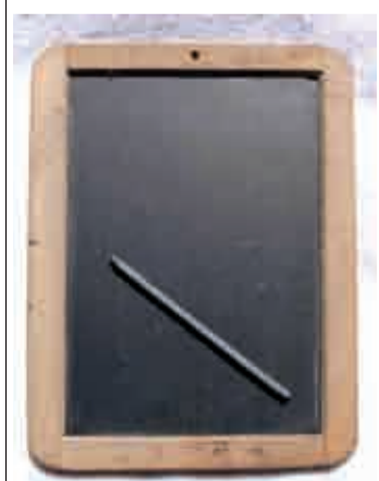
Pizarra y pizarrín, años cuarenta.