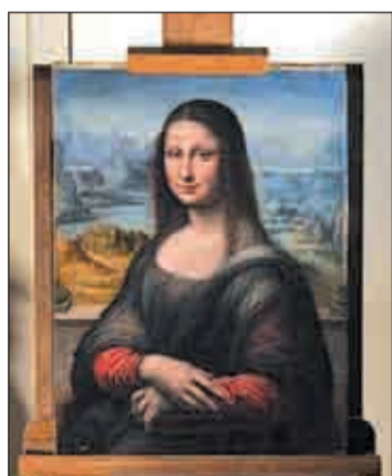
La Mona Lisa española

El volumen total de parados alcanzó a cierre del pasado mes la cifra de 4.599.829 desempleados, su nivel más alto en toda la serie histórica comparable, que arranca en 1996. En términos interanuales, el paro aumentó en enero en 368.826 personas, un 8,7% más.