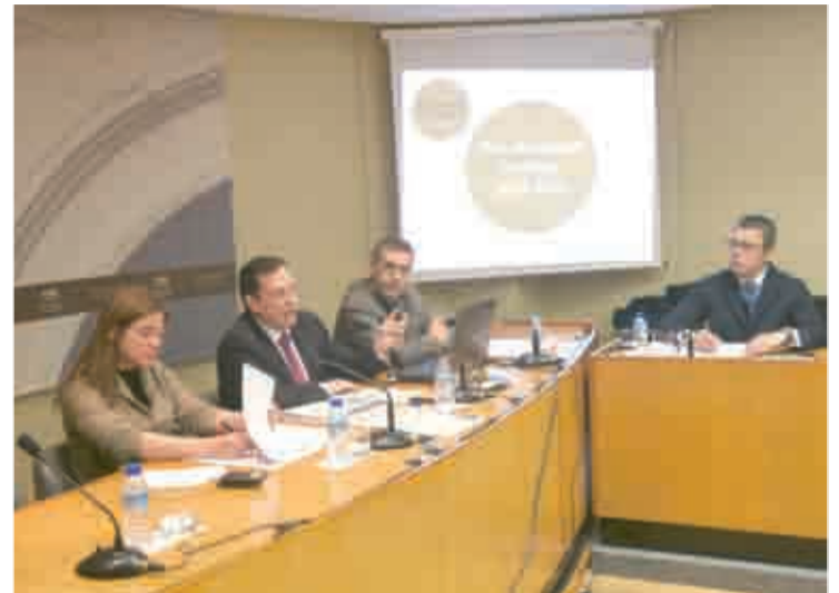
Presentación del Plan de Empleo en el Parlamento de La Rioja.

Los primeros seis proyectos que se pondrán en marcha este primer trimestre son los siguientes: