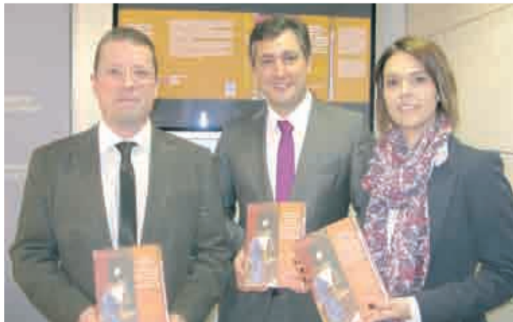
Presentación del libro.

político teórico de la Edad Media española, una obra de referencia trascendental para el estudio del pensamiento sobre el desarrollo del Estado monárquico medieval castellano y la historia del pensamiento español y europeo.