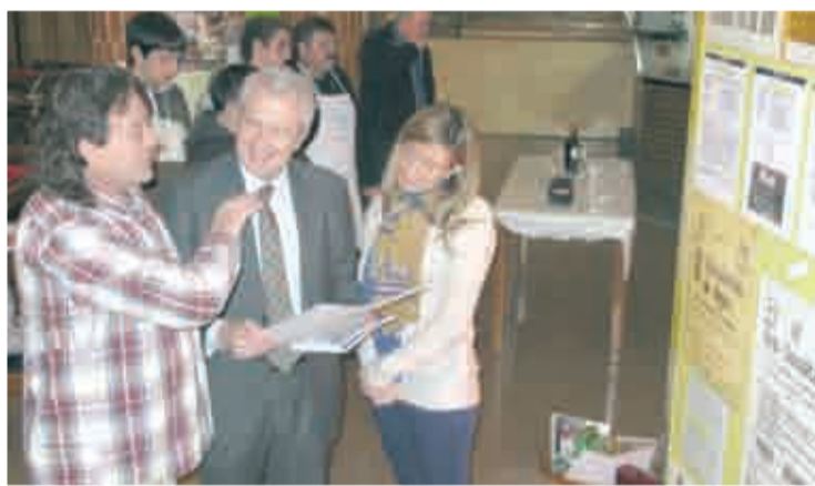
Visita a la exposición.