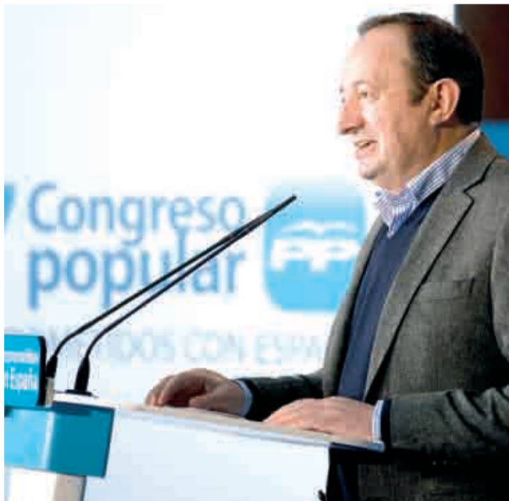
Pedro Sanz en la presentación del Congreso Nacional del PP.

Sanz realizó estas declaraciones junto a la secretaria General del PP, María Dolores Cospedal; y el presidente del PP de Andalucía y Vicepresidente de Política Autonómica y Local del PP, Javier Arenas; en la que presentaron el XVII Congreso Nacional del PP, que se celebrará