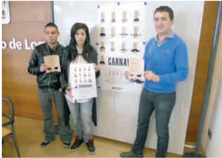
Ganadores del concurso del cartel de Carnaval.

La plaza del Ayuntamiento acogerá la entrega de premios a los ganadores del desfile. Como colofón a la jornada, la Plaza de la Paz será el escenario, a las 21.00 horas, del Carnaval Caribeño, con un