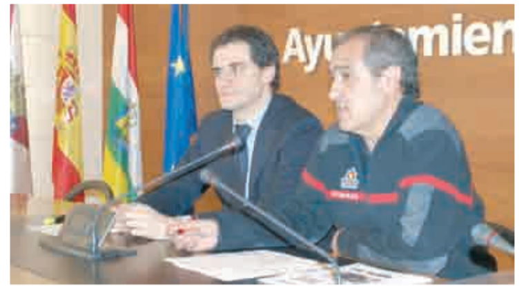
Presentación del balance de actuaciones.

BOMBEROS DE LOGROÑO - 1.300 ACTUACIONES EN 2011