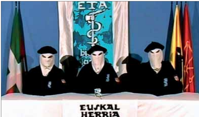
Imagen extraída del vídeo en el que ETA anunciaba el cese de su actividad armada