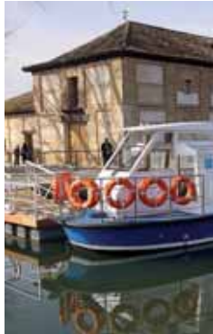
Imagen del Museo del Canal.

Posteriormente, se partirá hacia Villaumbrales donde se podrá navegar en el barco Juan de Homar