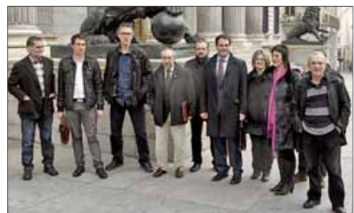
Representantes de Amaiur en la puerta del Congreso de los Diputados

La formación independentista pidió al actual presidente del Gobierno y líder del Partido Popular, Mariano Rajoy, que flexi-