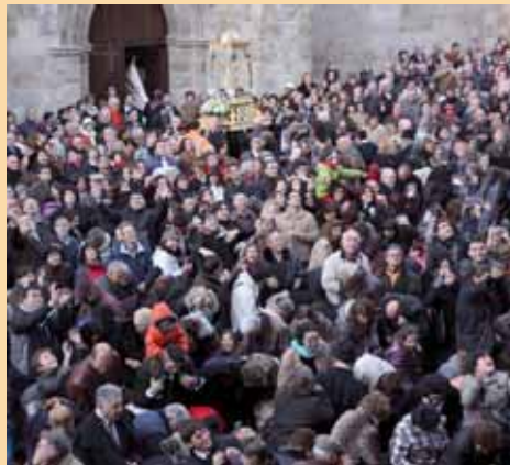
Miles de palentinos se congregan todos los años en 'San Miguel'.

Rectoral. Hubo un tiempo en el que las monedas , las 'perras chicas' , hacían las delicias de los más pequeños. Finalizados los actos, se obsequiará a los presentes con un refresco tradicional .