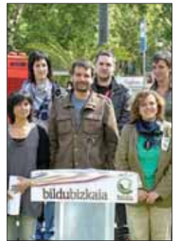
Bildu en una rueda de prensa

Por otra parte, si nos remitimos a un par de semanas antes de los comicios del 22-M, en plena campaña electoral, podemos observar que su carrera política fue hacia delante desde un primer momento, algo que el pueblo corroboró después en los comicios. De hecho, Bildu sólo se vio en un aprieto durante los quince días de la campaña. Du-