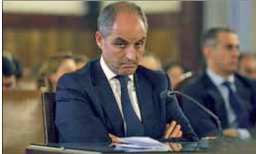
El ex presidente de la Generalitat en el juzgado

ESTÁ ACUSADO POR COHECHO PASIVO EN EL CASO GÜRTEL