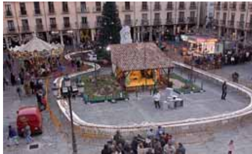
Cientos de palentinos se acercaron a la Plaza Mayor a por una ración.

El Día de Reyes ya no se concibe sin los regalos que traen Sus Majestades los Magos de Oriente y sin el Roscón. Un delicioso postre, que acumula en su haber una tradición de más de 500 años. El secreto de ese sabor está en una exquisita mezcla de ingredientes: harina, levadura, azúcar, mantequilla, huevos, ralladura de cítricos, agua de azahar, frutas escaruchadas y almendras. Otro símbolo indiscutible de este dulce navideño es el regalo que esconde en su interior, generalmente una pequeña figura que simboliza la suerte que tendrá aquél que la encuentre. En muchos casos el Roscón también incluye un haba, que hace que el que la encuentre tenga que pagar el dulce del año siguiente. Una tradición que en Palencia se adelanta al 28 de diciembre con el tradicional reparto que el Ayuntamiento en colaboración con la Asociación de Pasteleros