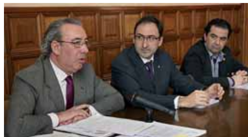
El Consistorio reduce en nueve millones el presupuesto para 2012.

Por otro lado, las propuestas del PSOE tienen según el conce-