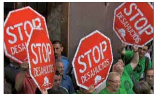
#Stopdesahucios paraliza el desalojo de un familia en Madrid

bastaría entre un 1% y un 2% de los casi 490.000 millones que el BCE ha inyectado a la banca española para evitar nuevos desahucios. Como alternativa a estos desalojos algunos colectivos han optado por la ocupación de edificios vacíos para alojar a las familias sin hogar pero sí con hipoteca. En noviembre, se ocuparon 8 edificios en dos días.