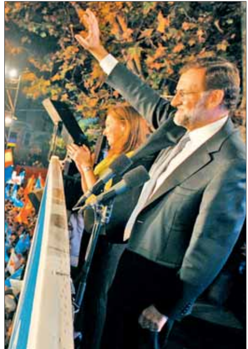
Rajoy celebra su victoria en el balcón de la calle Génova

Rajoy se ha rodeado de sus hombres más cercanos y de máxima confianza para formar un Gobierno en el que Soraya Sáenz de Santamaría, como vicepresi-