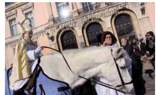
El Cabildo Catedralicio celebró la tradición festiva del 'Obispillo'.

Recorrió la ciudad montado en un caballo blanco y cantó villancicos frente al Belén de la Plaza