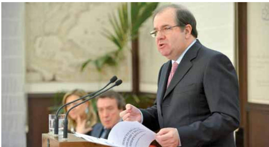
Juan Vicente Herrera durante la explicación de las medidas adoptadas en la rueda de prensa celebrada tras el Consejo de Gobierno ordinario.

"No puedo pronosticar la contestación social que tendrán ni la temo. El panorama que me asusta de verdad es llegar al colapso financiero y no poder asumir las retribuciones de los funcionarios públicos ni mantener los servicios sociales, como está pasando en otras Comunidades. Afortunadamente aquí llevamos mucho tiempo trabajando para que eso no suceda. Nuestro objetivo es trabajar de lo posible a lo responsable y de lo responsable a lo obligado", afirmó.