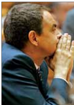
José Luis Rodríguez Zapatero

En el mes de julio, el actual presidente del Grupo Socialista en el Congreso de los Diputados, Alfredo Pérez Rubalcaba, era