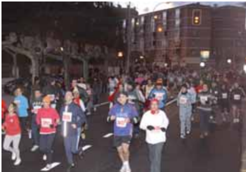
Imagen de archivo de la San Silvestre del año pasado.

En la misma, se utilizará de nuevo el sistema de cronometraje por medio de chips de media frecuencia. Este chip va colocado al dorsal y el corredor deberá pasar por el arco de salida, el arco del punto intermedio y el arco de llegada para acceder a la clasificación.