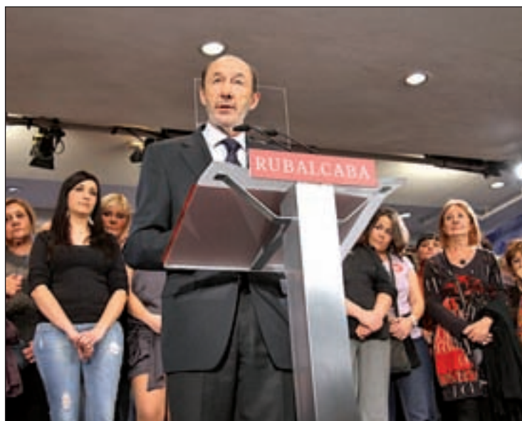
Rubalcaba, en su comparecencia del 20 de noviembre

Queda más de un mes para el trigésimo octavo Congreso Federal del PSOE, los días 3, 4, y 5 de febrero en Sevilla y ya se empieza en la filas socialistas a hablar de continuismo, regeneración, debate de ideas.... Todo para intentar restañar cuanto antes las profundas heridas sufridas en el último 'encontronazo' con las urnas. Los pesos pesados empiezan a posicionarse. El primero en dar un paso adelante para suceder al actual secretario general, José Luis Rodríguez-Zapatero, ha sido Alfredo Pérez Rubalcaba. El candidato socialista en las últimas elecciones generales presentó su candidatura el 29 de diciembre. Y sorpresas o alterna-