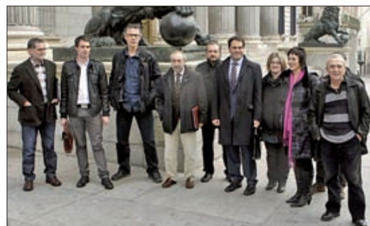
Representantes de Amaiur en la puerta del Congreso de los Diputados

La formación independentista pidió al actual presidente del Gobierno y líder del Partido Popular, Mariano Rajoy, que flexi-