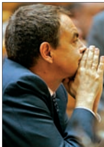
José Luis Rodríguez Zapatero

En el mes de julio, el actual presidente del Grupo Socialista en el Congreso de los Diputados, Alfredo Pérez Rubalcaba, era