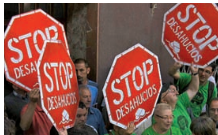
#Stopdesahucios paraliza el desalojo de un familia en Madrid

bastaría entre un 1% y un 2% de los casi 490.000 millones que el BCE ha inyectado a la banca española para evitar nuevos desahucios. Como alternativa a estos desalojos algunos colectivos han optado por la ocupación de edificios vacíos para alojar a las familias sin hogar pero sí con hipoteca. En noviembre, se ocuparon 8 edificios en dos días.