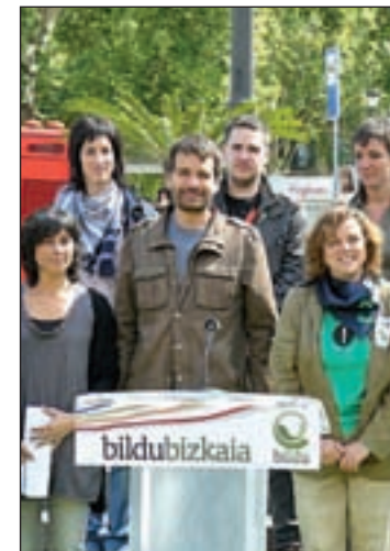
Bildu en una rueda de prensa

Por otra parte, si nos remitimos a un par de semanas antes de los comicios del 22-M, en plena campaña electoral, podemos observar que su carrera política fue hacia delante desde un primer momento, algo que el pueblo corroboró después en los comicios. De hecho, Bildu sólo se vio en un aprieto durante los quince días de la campaña. Du-