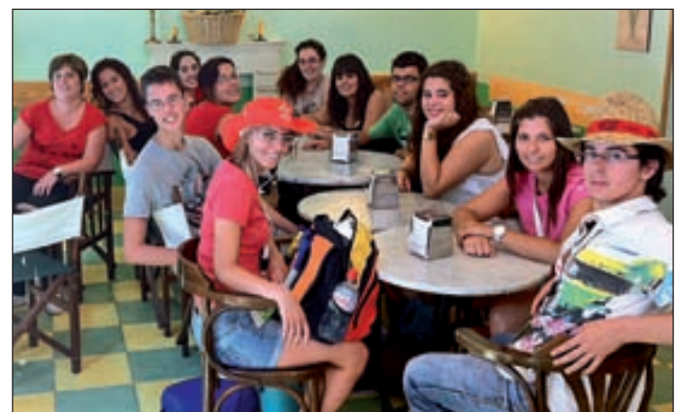
Un grupo de peregrinos en un restaurante madrileño

El estudio de PwC basó sus cálculos en el gasto directo realizado por la organización de la JMJ así como en cifras provenientes de la contabilidad autonómica y nacional a través del Instituto de Estadística de la Comunidad de Madrid y el Instituto Nacional de Estadística (INE).