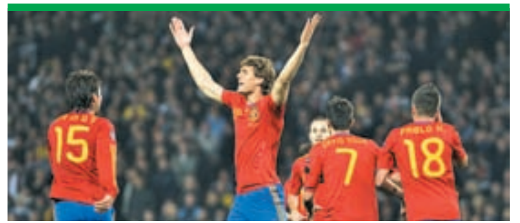
El deporte español prepara un año apasionante En medio de la mejor época de su historia, los nuestros afrontarán 2012 con dos grandes retos: la Eurocopa de fútbol y los Juegos Olímpicos. Págs. 14 y 15