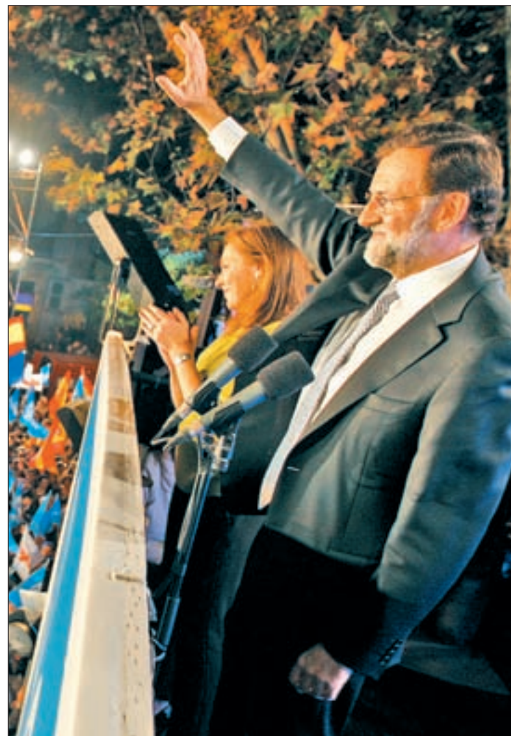
Rajoy celebra su victoria en el balcón de la calle Génova

Rajoy se ha rodeado de sus hombres más cercanos y de máxima confianza para formar un Gobierno en el que Soraya Sáenz de Santamaría, como vicepresi-