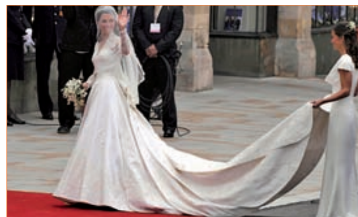
La novia, Kate Middleton, junto a su hermana Pippa

Madre. En cuanto al vestido, la princesa monegasca lució un sobrio Armani de líneas rectas y cristales Swarovski cosidos a mano. La princesa Catalina eligió un Sarah Burton para Alexander McQueen de cuerpo ceñido y mangas de encaje, aunque para sorpresa fue el de su hermana Pippa, quién acaparó la atención de todos los focos.