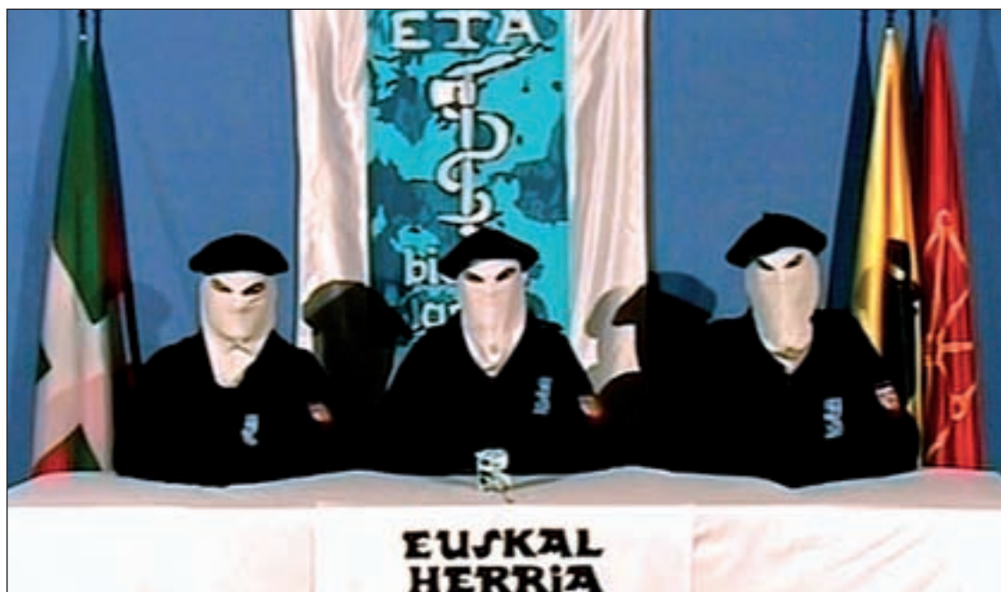
Imagen extraída del vídeo en el que ETA anunciaba el cese de su actividad armada