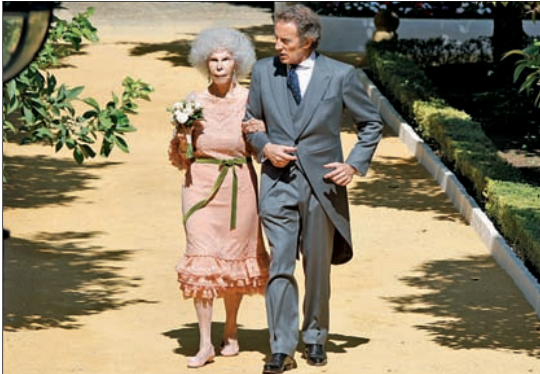
Los novios, la Duquesa de Alba y Alfonso Díez el día de su boda

Malos tiempos también para el mundo de la moda. Dior fulmina a uno de sus diseñadores