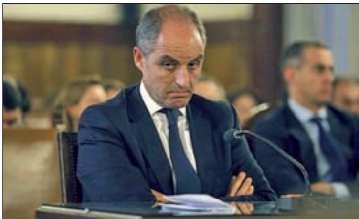
El ex presidente de la Generalitat en el juzgado

ESTÁ ACUSADO POR COHECHO PASIVO EN EL CASO GÜRTEL