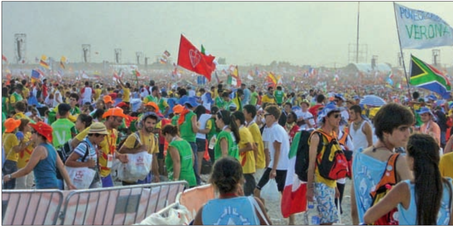
La misa del aeródromo de Cuatro Vientos registró una asistencia de dos millones de personas, según los organizadores de la JMJ