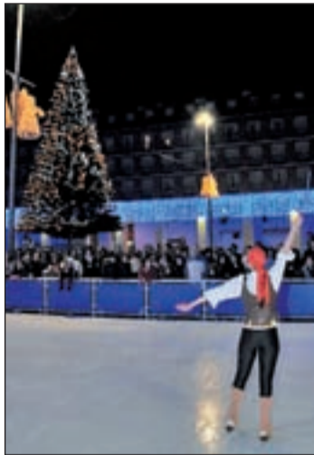
Navidad en Leganés

Por otro lado, desde las 17:00 horas, Cáritas, la Asociación Mujeres del Mundo y la Asociación