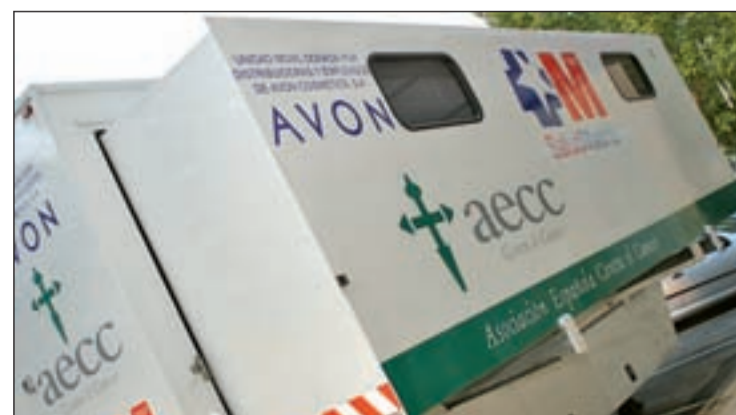
La prevención sigue siendo la mejor arma

Por último, la depresión, también una enfermedad que ellas padecen más, tiene nuevas estadísticas: el 15% de los pacientes tratados con algunos fármacos podrían evolucionar peor que aquellos que reciben placebo.