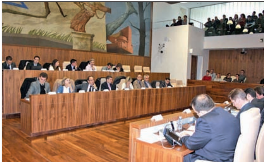
Imagen del Pleno