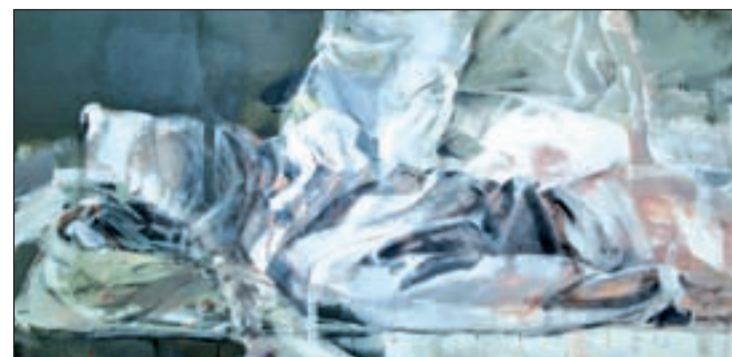
Una imagen de la muestra

ra la reflexión sobre las redes, que se representará este viernes 16 de diciembre en el Rigoberta Menchú, en doble sesión (12:00 y 20:00). La pieza está dirigida por la compañía 'Pikor Teatro'. Las entradas cuestan entre 5 y 3 euros (jubilados y niños).