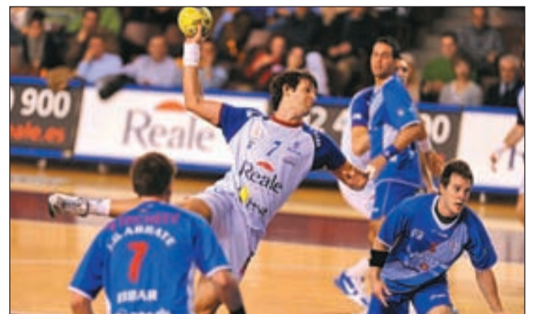
El Reale Ademar León espera al equipo de Dujshebaev

La XXII edición de la Copa Asobal se disputará el miércoles y el jueves en la misma ciudad en la que jugará este sábado la última jornada de la primera vuelta de la Liga Asobal. El torneo tiene el aliciente para los rojiblanco de poder defender su