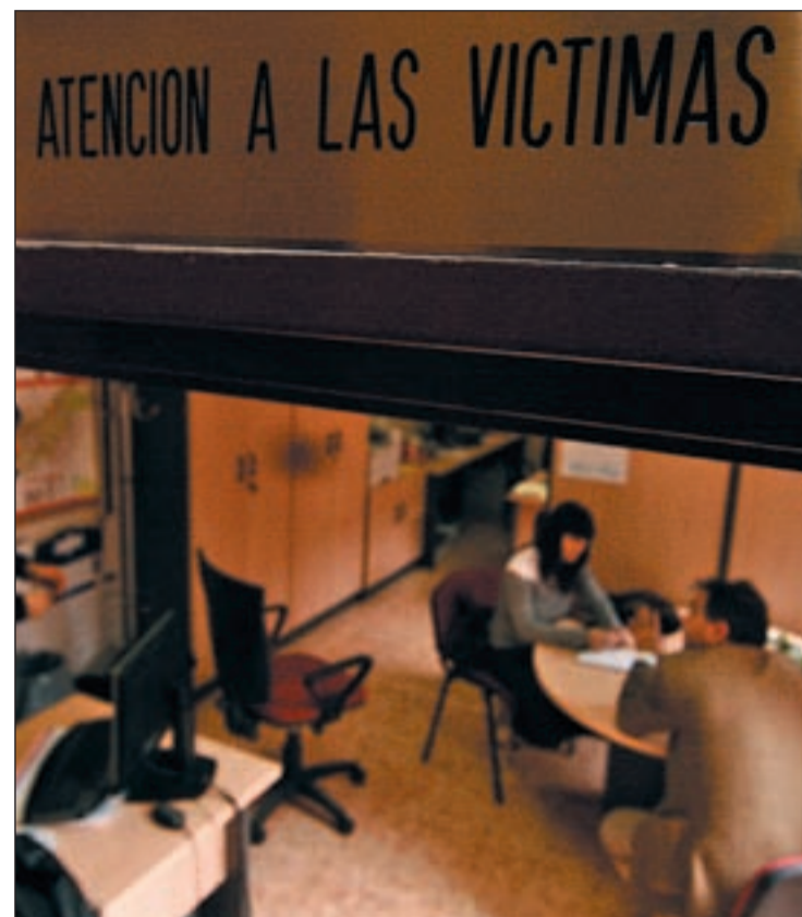
Una oficina de atención a las víctimas de la Comunidad

También son requisitos carecer de rentas que, en cómputo mensual, superen el 75 por 100 del salario mínimo interprofesional vigente, excluida la parte proporcional de dos pagas extraordinarias; y tener especiales difi-