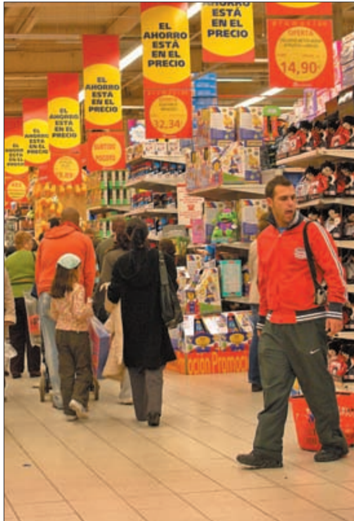
Los centros comerciales podrán abrir domingos y festivos OLMO GONZÁLEZ

Sobre este anuncio de protestas, Aguirre ha señalado que ya ha quedado demostrado que la situación actual "no es útil a la hora de generar empleo, creci-