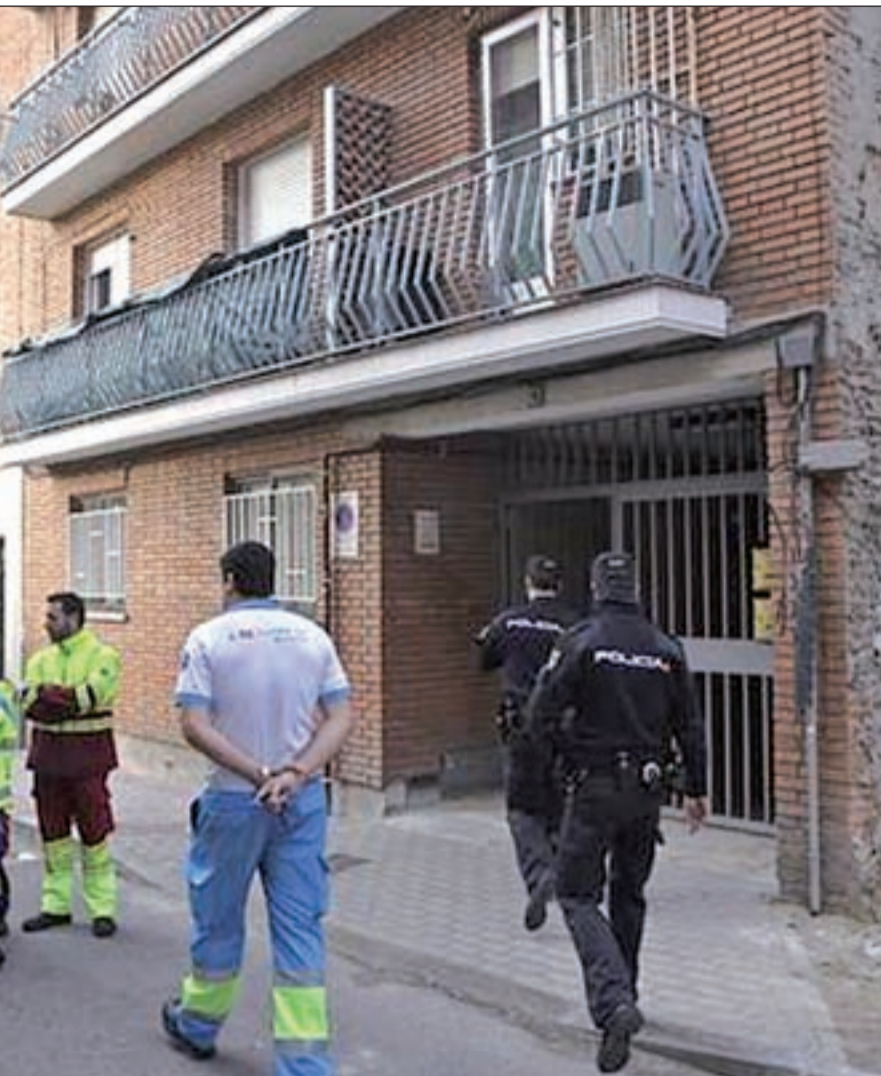
Junto al cadáver en este edificio de Tetuán