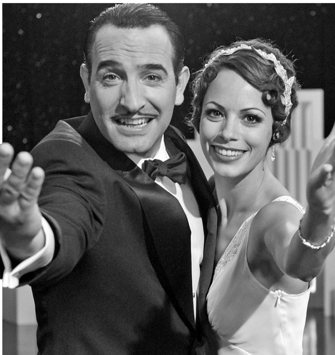
Hazanavicius tardó cuatro meses en hacer el guión y rodó el filme en 35 días

esta producción, lidera un proyecto que ha obtenido la admiración del público en los festivales de San Sebastián y Sevilla. Esta sabiduría popular suele constituir un buen termómetro para medir el impacto posterior de la cinta -que no indica necesariamente calidad aunque en este caso sí la ofrezca- y aquí existe un buen ejemplo. Tampoco cabe obviar la distinción a Jean Dujardin como Mejor Actor en Cannes, aunque Bérénice Bejo merece idénticos piropos por su excelente interpretación. Parecen dos estrellas rutilantes de los años 20, cuando ambos pertenecen a la generación de los 70.