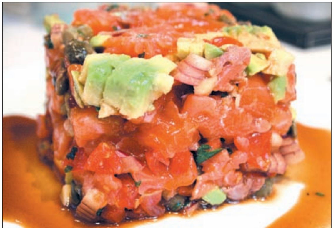
La fruta, el marisco y la verdura, aliados claves contra los excesos de las comidas y cenas navideñas

Canapés de atún y pimientos, de salmón y queso light o de jamón ibérico con tomate (sin tocino) son una buena forma de empezar el banquete. Para continuar, salpicón de marisco y una buena ensalada. Uriol recomienda una mezcla de hojas verdes como rúcula y canónigos, piña, maíz y salsa rosa baja en grasa. El toque estrella, unos langostinos que no