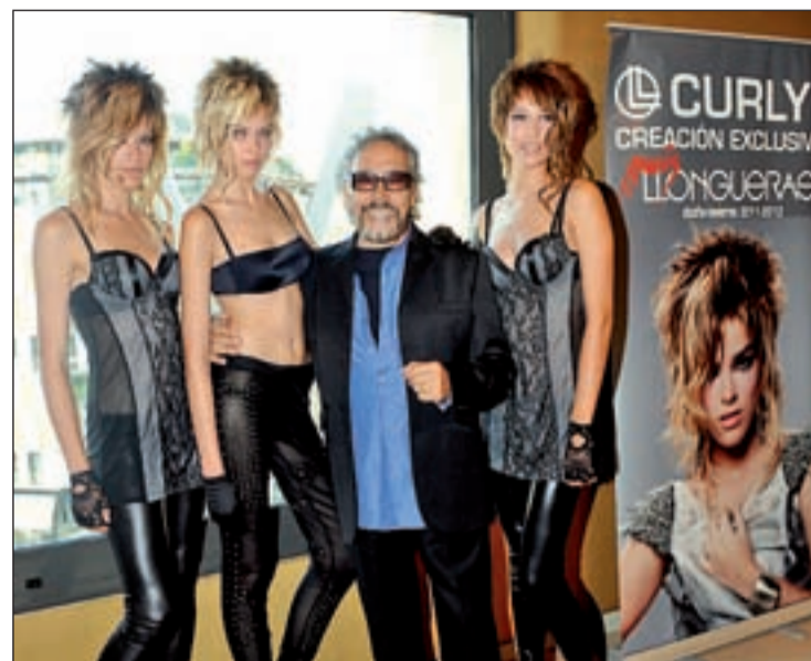
Luis Llongueras acompañado por modelos de su colección Curly

Llega el frío y la gran pregunta es ¿qué hago con mi cabello?. ¿Alisarlo?, ¿rizarlo?, ¿ondas tal vez? Precisamente las ondas y el pelo rizado son la principal apuesta del estilista Luis Llongueras. Su colección para este otoño-invierno 2011 se llama 'Curly' y apuesta por los ondulados más informales que enmarcan la sonrisa y resaltan la mirada. Es más, la firma define a la mujer del siglo XXI como a una auténtica diva que viene pisando fuerte mientras luce una cabellera con ondas despampantantes. Esta Navidad veremos por todas partes cabellos lisos en la raíz con gestos anchos en las puntas o en la parte central. Las ondas se convierten ahora en un estilo novedoso que beneficia, sobre todo, a la mujer mediterránea.