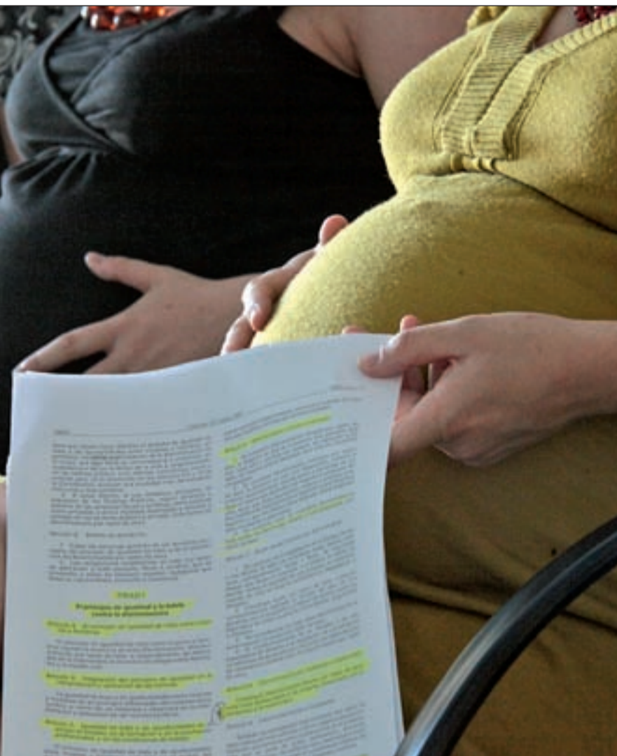
de sufrir incontinencias urinarias que tienen una solución médica muy sencilla