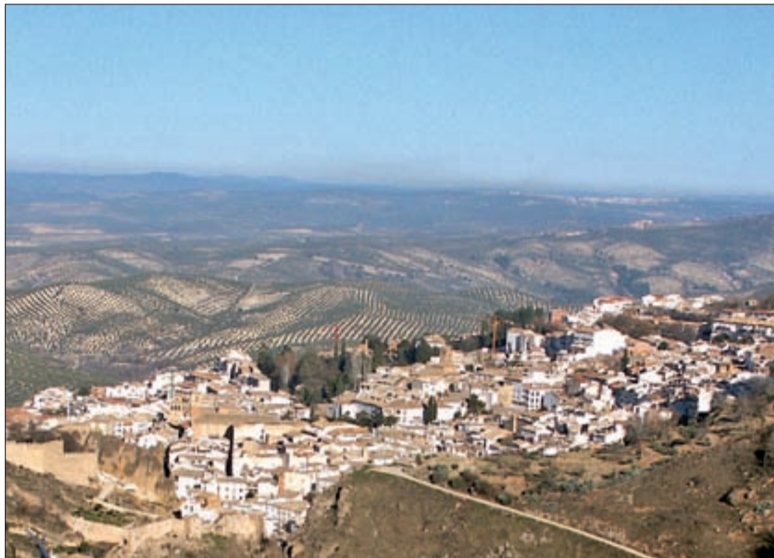
Panorama de Cazorla

La nieve en la Sierra, los mares de olivo y el encanto del pueblo de Cazorla son una opción perfecta para escaparse en el invierno. Ha comenzado ya la cosecha olivarera, los jienenses desperezan los tractores, cambian los arados por grandes remolques y bajo la helada comienzan a varrear los olivos de picual o de royal, en la falda de la sierra de Cazorla, también el acebuche. Durante estos meses Jaén huele como nunca, las almazaras humean, las cuadrillas trabajan sus campos, muchos explotan sus propios olivares y en la optimización del trabajo bien organizado el agricultor se juega mucho.