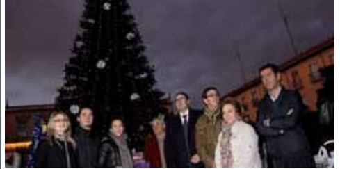
Palencia estrena la Navidad