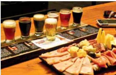
El 56% de los castellanoleoneses eligen los bares para beber cerveza.