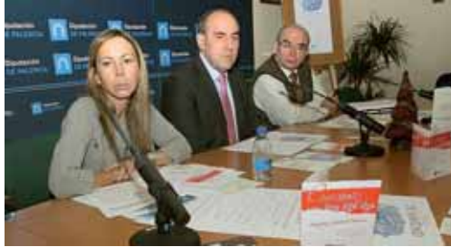
El Concurso Provincial de Belenes ha recibido 29 inscripciones.

Por otro lado, el ciclo de conciertos en la provincia, con un total de cinco actuaciones llegarán a los municipios de Villamuriel de Cerrato, Paredes de Nava, Saldaña, Guardo y Frómista. Los primeros correrán a cargo de la Coral Santa María del Castillo y el resto de la Escuela de Música y Danza de Guardo, explicó Fernández Caballero, al tiempo que subrayó que "queremos que los jóvenes que se