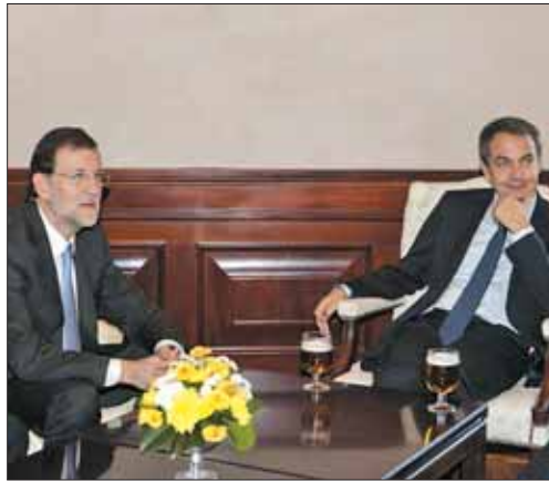
Zapatero y Rajoy conversaron tras el acto del Día de la Constitución.

Rajoy, que acudió esta semana, al igual que Zapatero, a la recepción por el XXXIII aniversario de la Constitución, anunció que la primera ley que aprobará su Consejo de Ministros será la que desarrolle la reforma constitucional sobre la estabilidad presupuestaria y que así lo va a anunciar Zapatero en la cumbre europea. "Vamos a decir que somos un país fiable, con el compromiso de no renunciar de ninguna manera a la contención del déficit y la deuda y tampoco a las reformas necesarias para mejorar la economía y crear empleo". Rajoy des-