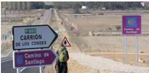
Imagen de archivo de la carretera P-980 de Frómista a Carrión.

La carretera P-980 tuvo su última intervención de ensanche y mejora del firme en 1995, llevándose posteriormente labores de conservación ordinaria. Debido a un tráfico creciente y al tiempo transcurrido desde su construcción, el estado del firme se ha ido deteriorando. Además de ciertos daños superficiales, será necesario reparar capas inferiores del firme allí donde se han apreciado cesiones.