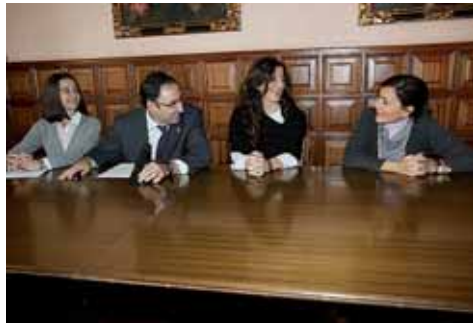
La entrega de premios se llevará a cabo en el mes de febrero.

El certamen, al que el año pasado se presentaron más de un centenar de cuentos, está dirigido a personas de todas las edades, que deberán presentar sus trabajos, inéditos y con una extensión máxima de cuatro folios, antes del próximo 20 de