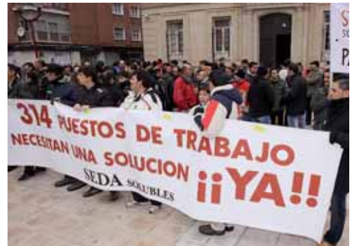
Imagen de archivo de una concentración de los trabajadores de 'Seda'.

De esta forma, el deudor queda suspendido de las facultades de administración y disposición de su patrimonio que serán ejercidas por la administración concursal. Asimismo, en el auto se hace un llamamiento a los acreedores de Seda Solubles para que pongan en conocimiento de la administración concursal la existencia de sus créditos en el plazo de un mes a contar desde el día siguiente a la publicación del mismo en el Boletín Oficial del