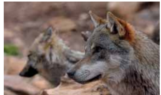
En los últimos meses se han producido varios ataques por la provincia.

La organización exige que sea la administración quien asuma el coste de los daños directamente y que modifique su "inadecuado plan de gestión del lobo, que lejos de lograr la compatibilidad de la especie con el medio rural está generando una grave situación de alarma en muchos pueblos en los que la ganadería es prácticamente la única alternativa económica posible para sus pocos habitantes".