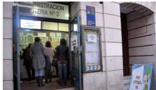
Los consumidores no recortarán su presupuesto en la compra de lotería.

de juguetes, aconsejaron elegir solo aquellos que han sido aprobados y seguir las recomendaciones de edad. "Sensatez y precaución son los mejores aliados".