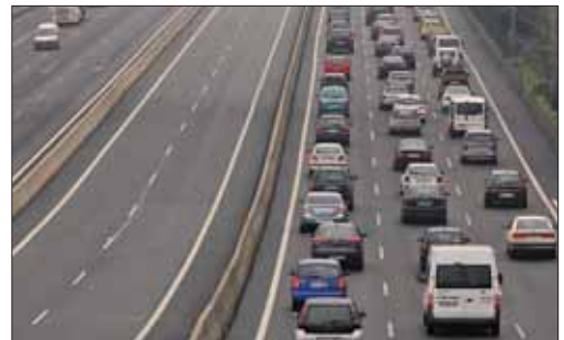
Miles de personas efectúan viajes los puentes.

En un comunicado conjunto, han dejado claro que "no hay