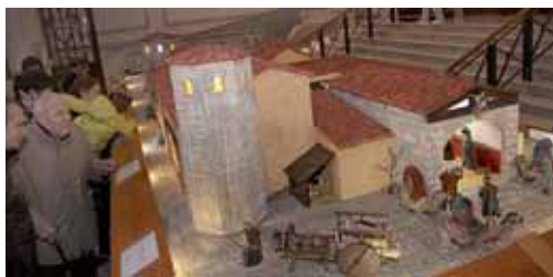
Imagen del Belén ubicado en el vestíbulo del Palacio Provincial.

Asimismo, se podrá visitar hasta el próximo 6 de enero el Belén Christus Natus Est. Navidad en la Villa Romana La Olmeda en el vestíbulo del Palacio Provincial y del 16 de diciembre al 6 de enero el Centro Cultural Provincial acogerá Un Belén para el Rey. Navidad en el Alcázar . El mismo, mostrará al público un interesante montaje del Nacimiento de Cristo, realizado por la Agrupación Belenista La Morana .