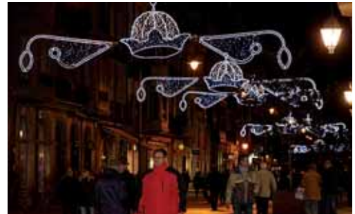
Este año como novedad se ha instalado un abeto en la Plaza Mayor.