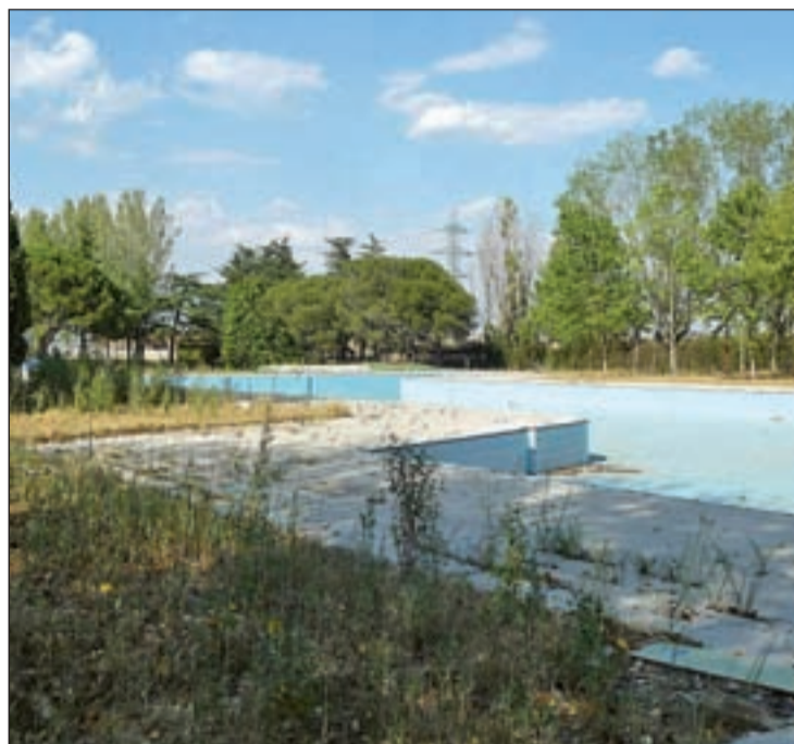
La instalación fue objeto de polémica en el Gobierno de Montoya

La reconstrucción de 'Solagua' se enmarca en el un plan plurianual proyectado por el Gobierno