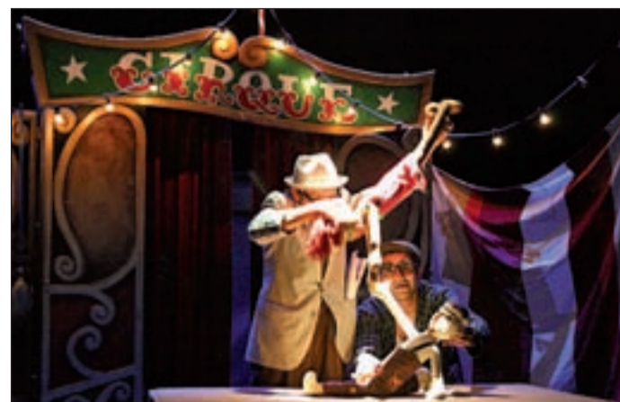
Escena de 'Cirque dejà vu', de la compañía La Baldufa

La serie de Fernando Moleres también recibió el segundo premio de 'Vida Cotidiana' dentro de 'World Press Photo 2011', por retratar la situación de los menores presos en la cárcel de Pademba Road, una prisión que fue construida para alojar a unos 300 presos, pero que alberga a más de 1.100, muchos de ellos adolescentes.