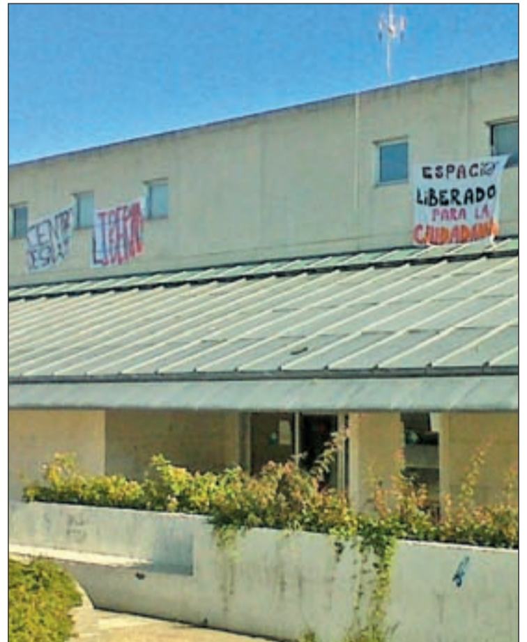
Carteles de los okupas desplegados en el centro de salud

La razón de "liberar este edificio público" responde a "la negativa constante del Ayuntamiento que ha denegado el uso de otros espacios públicos municipales, como las plazas, para hacer actividades informativas, sociales o asambleas", alegan desde este colectivo. Por ello, "tras agotar todas las vías" han optado por okupar este "espacio abierto para la ciudadanía". Asimismo, han denunciado que en esta superficie, ubicada sobre una vía pecuaria protegida por la ley "y que prohíbe la construcción con fi-