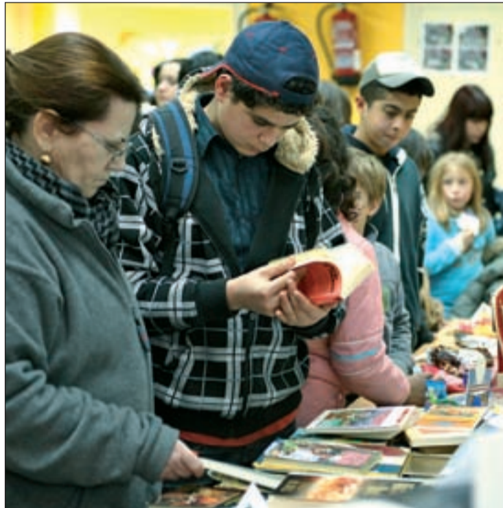
Los mercadillos de trueque erigen como una alternativa responsable

Desde moda elaborada por mujeres víctimas de la explotación sexual, hasta artesanías para dinamizar la economía colec-