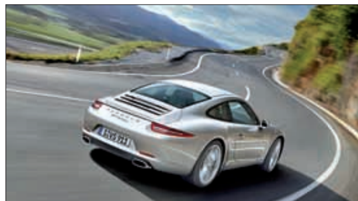
Uno de los vehículos Porsche de los cursos de conducción segura

El formato de estas clases es teórico y práctico, y además, siempre bajo la supervisión de los monitores de Porsche.