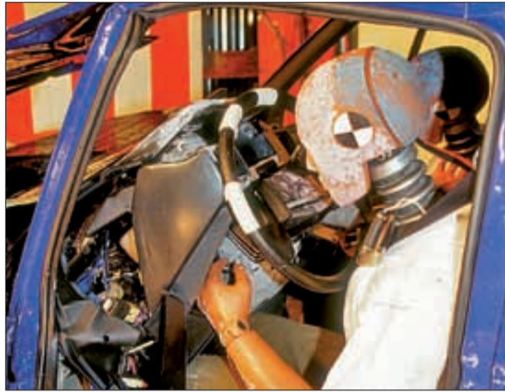
Pruebas de los dispositivos de seguridad de los automóviles

Pero las cifras negras esconden más causas que se sustentan en la desobediencia de las obligaciones viales. En España, cada