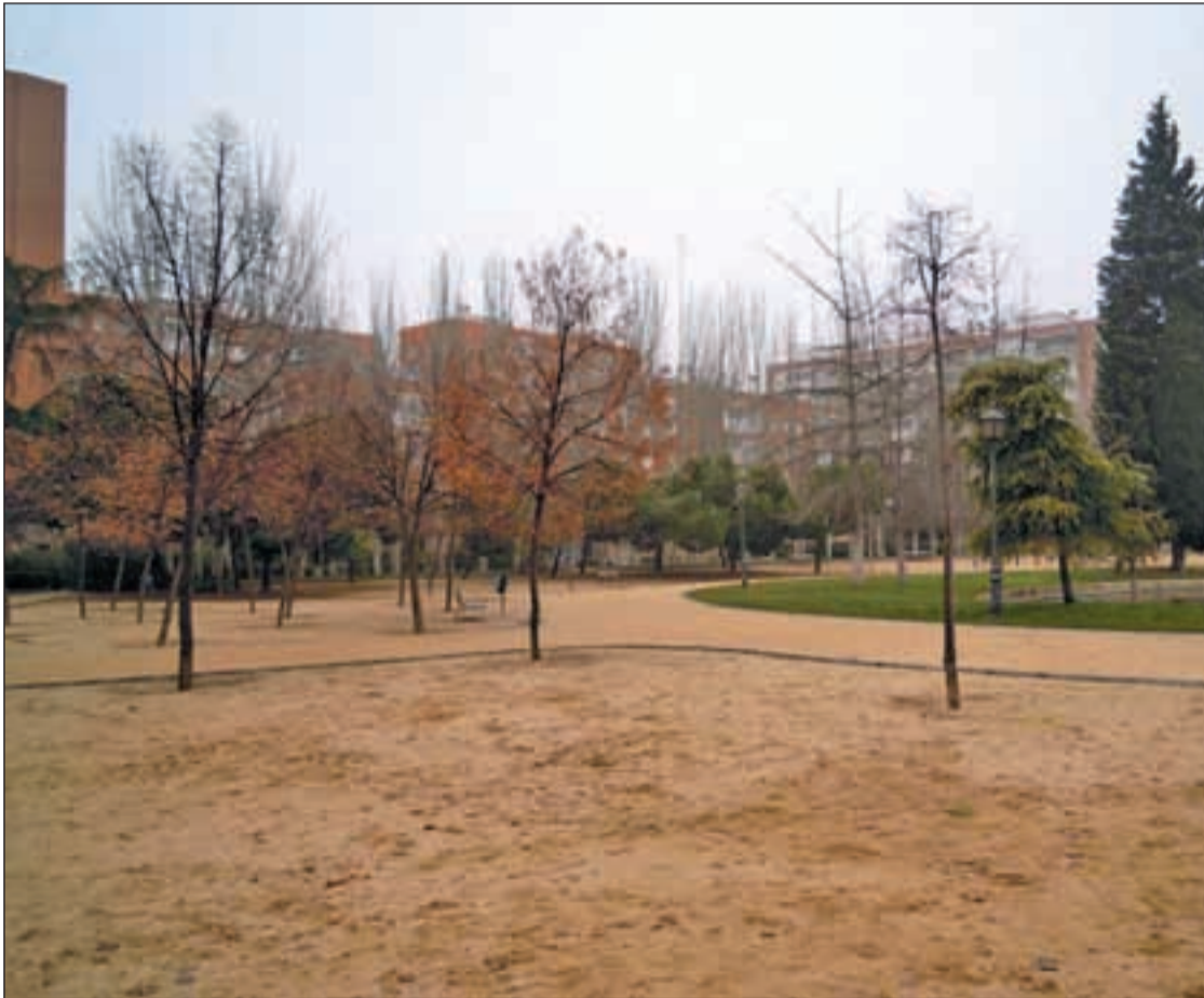
Una zona del Parque de Aluche

El Ayuntamiento niega la falta de mantenimiento de la zona verde de Latina y asegura que se limpia al mismo ritmo que el resto de parques Pág.5