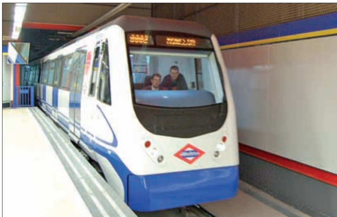
Uno de los trenes que recorre habitualmente la Línea 3 del suburbano madrileño

A nivel de ciudad, 393 personas fueron detenidas por delitos contra la seguridad vial; 186, por violencia doméstica; 182, por lesiones; 132, por amenazas y 127, por hurtos. Le siguen los 46 detenidos por agresiones y abusos sexuales y otros tantos por robo con violencia o intimidación en las personas; los 32 por otros delitos contra el patrimonio; los 30, por robos con fuerza en inmuebles; y los 23 por delitos contra la salud pública. Además, hubo 18 detenidos por falsedad documental, 16 por robo o hurto de uso de vehículos y también por delitos contra la propiedad industrial y doce por robo con fuerza en vehículos.