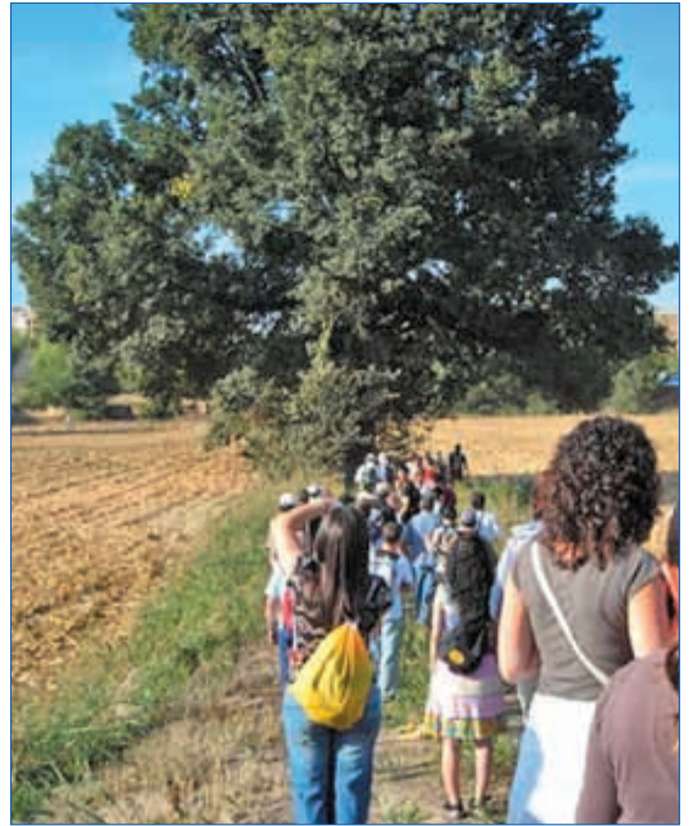
GRUPO INVESTIGACIÓN PARQUE

"Estamos hartas de que se diga que todas somos víctimas de trata y se nos niegue nuestra capacidad de decisión para ejercer esta actividad que, aunque la desarrollamos en condiciones cada vez más penosas, es la actividad que hemos decidido escoger para trabajar", denuncian. Por último, las convocantes de la manifestación dicen que quieren tener los mismos derechos que el resto de trabajadores.