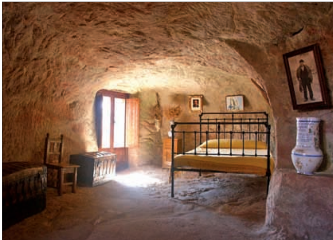
Interior de la casa de Linio Bueno, en Alcolea del Pinar, excavada en la roca

Como usuarios habituales de la N-II podemos pasar por delante de un lugar destacable mil veces sin parar ni percatarnos de su interés. Es el caso de la casa de Piedra de Alcolea del Pinar que fue construida poco a poco a golpe de maza y buril por Lino Bueno. ¡Qué increíble ocurrencia! ¡Ni los del 15-M de hoy en día! ve una piedra enorme en mitad del pueblo y decide excavar su casa en ella, una auténtica iniciativa de libertad, rebeldía y hartazgo frente a la dificultad de adquirir terreno.