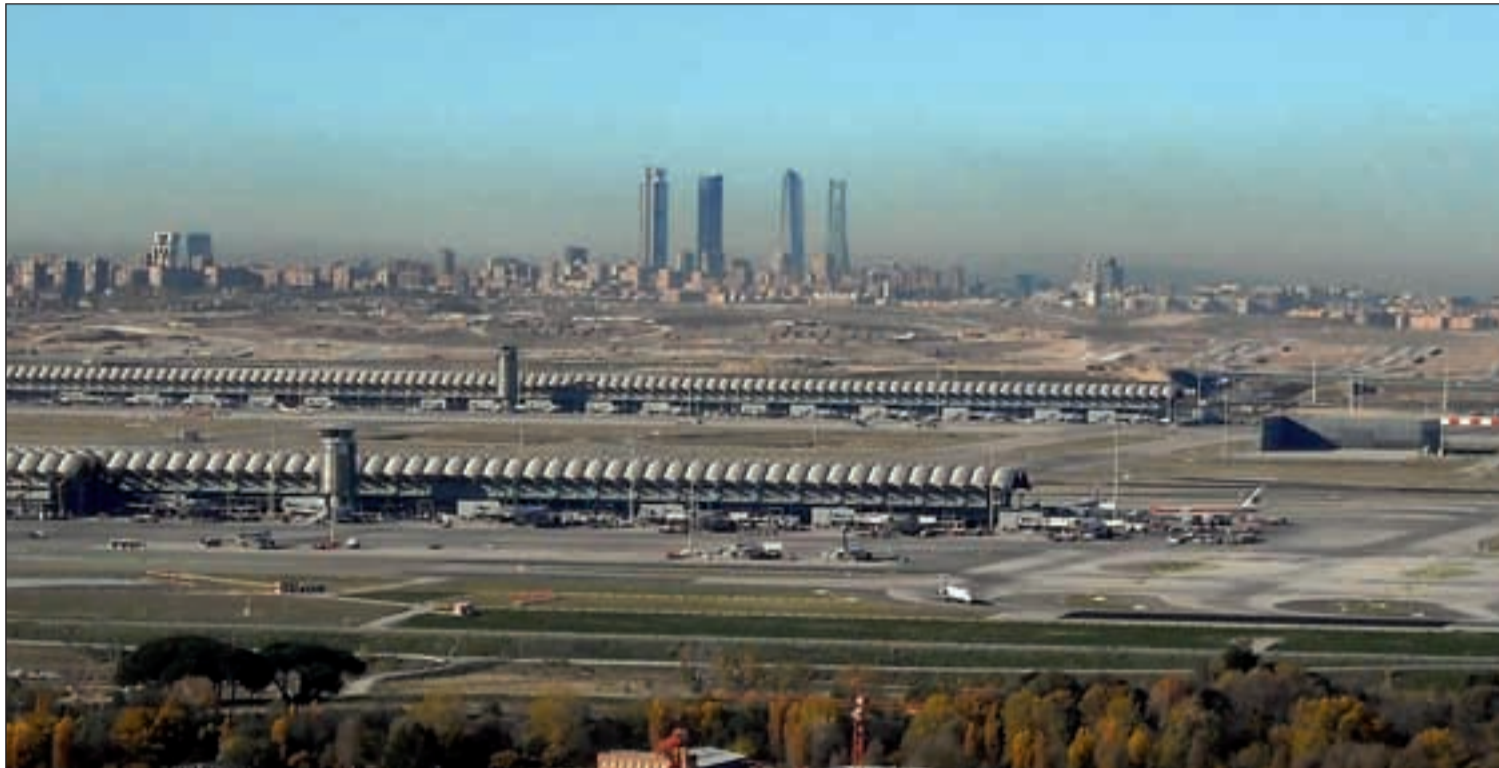
La boina de contaminación que ha cubierto el cielo de Madrid recientemente