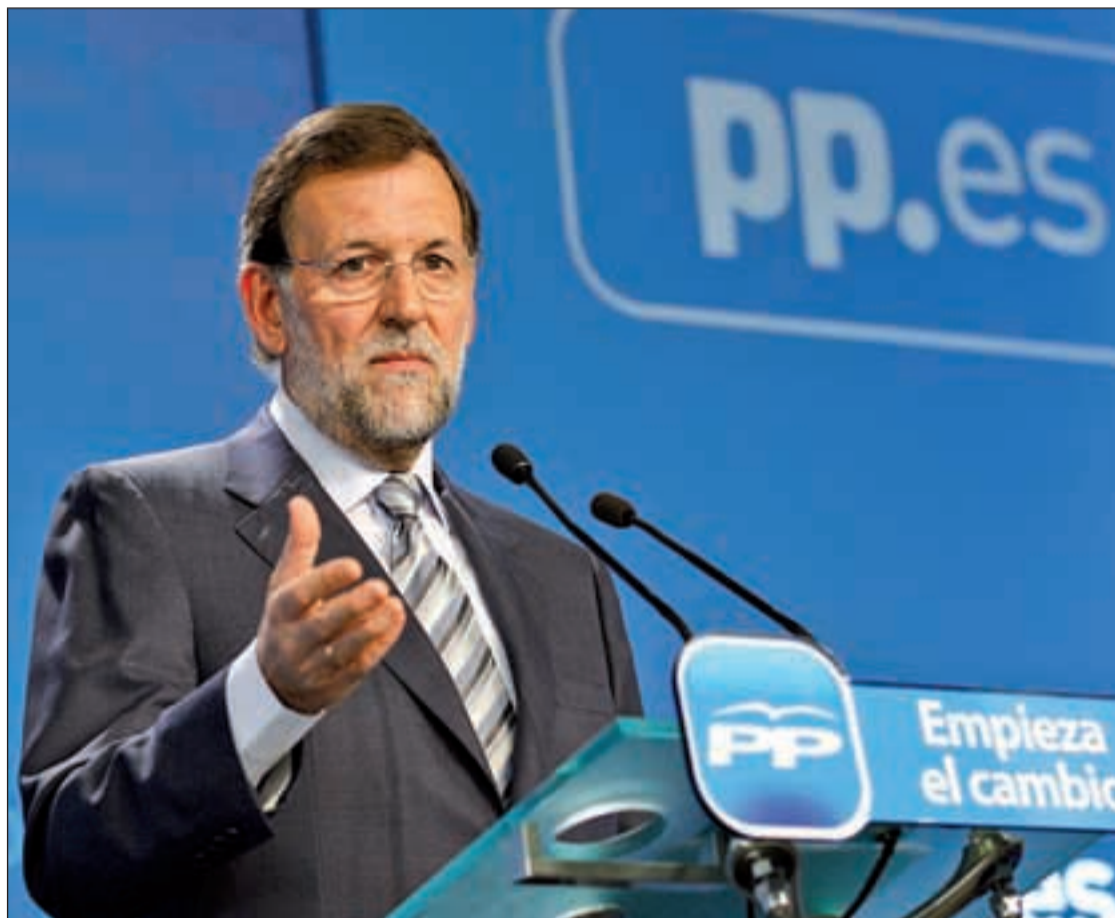
El presidente del PP, en la presentación del programa electoral

Mariano Rajoy apuesta en su programa por la 'mochila austriaca', un modelo de "capitaliza-