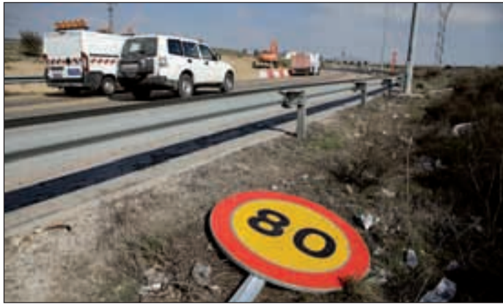
Una señal caída tras un accidente en una carretera

LA MORTALIDAD EN LAS CARRETERAS SE HA REDUCIDO UN 67,2