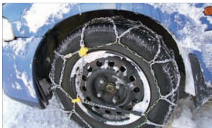
Neumáticos de invierno

Un ejemplo muy ilustrativo es que con las ruedas de verano, las que mayoritariamente usamos en nuestros coches, en un frenazo a 50 kilómetros por hora, con lluvia, perderemos el control del mismo y el accidente esa casi asegurado; en cambio, si tenemos que hacer un frenazo a la misma velocidad, con el suelo mojado por la lluvia y con los neumáticos invernales, el resultado es el opuesto, tendremos