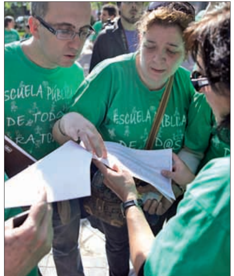
Profesores durante una protesta