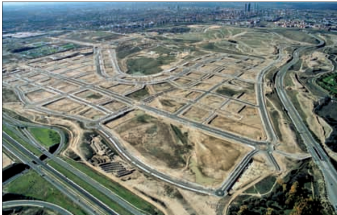
Vista área de la zona de Valdebebas

Así lo confirmó el vicepresidente de la Comunidad, Ignacio González, que aseguró que él personalmente, por parte de la Comunidad, y el ministro de Industria Turismo y Comercio, Miguel Sebastián, representando al Gobierno de España, están negociando la viabilidad de este proyecto. Además, explicó que el empresario tiene previsto "desde