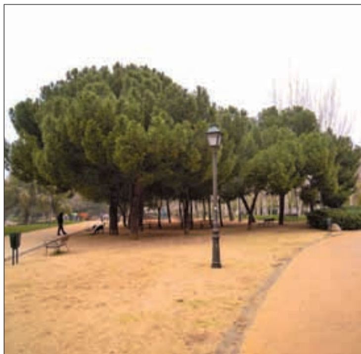
Uno de los espacios del pulmón verde del barrio de Aluche

Los residentes, comentan por otro lado, que la situación se ha visto agravada en los últimos días por una plaga de cotorras, “que se están acabando de cargar los árboles”. El colectivo ciudadano, en una reunión mante-