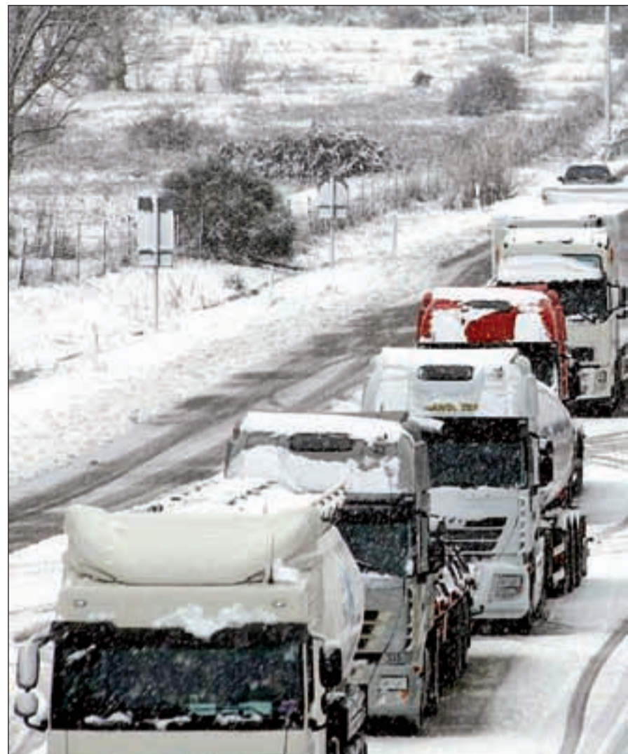
Los neumáticos de invierno contribuyen a una mayor adherencia al firme

Ante el invierno que nos espera, el RACE ha llamado la atención de que en nuestro país más de un millar de vehículos circulan con las gomas desgastadas, algo muy peligroso que no hace más que provocar accidentes. En el año 2010, un total de 12.400 accidentes con víctimas mortales, se produjeron bajo condiciones climatológicas adversas. La adherencia al asfalto, probablemente, fuera una de las causas de estos siniestros, y es que con las ruedas desgastadas, tanto la adherencia al asfalto, el agarre