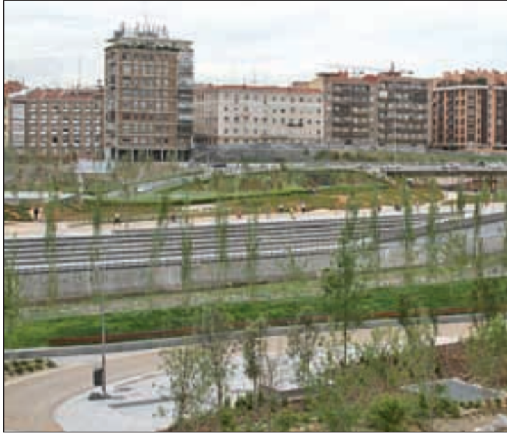
Uno de los espacios que componen el proyecto 'Madrid Río'

Este nuevo premio viene a sumarse a otros ya obtenidos con anterioridad, que reconocen la transformación urbana y los beneficios ambientales derivados del proyecto Madrid Río. Entre ellos, el premio "Green Good Design", concedido por el Ateneo de Chicago por contribuir al incremento de las zonas verdes en la ciudad, y el premio "Capital", que otorga la revista del mismo nombre, por crear no sólo un eje medioambiental, deportivo y cultural, sino también un espacio de ocio, estancia y encuentro para los madrileños.