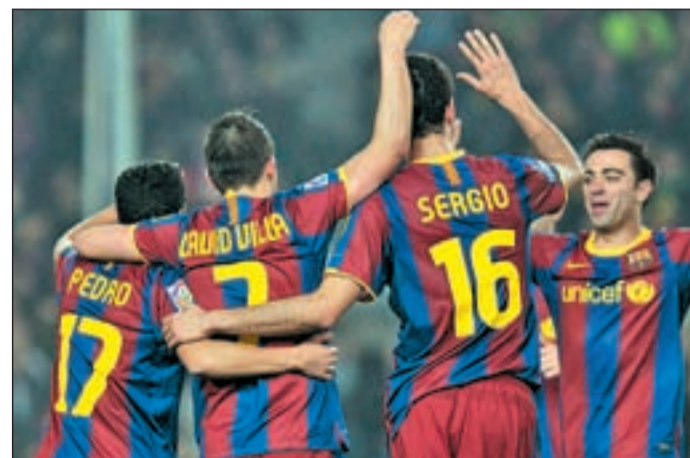
El Barça recibe el miércoles a uno de los rivales más débiles

Ese privilegio de colocarse líder de grupo ya lo ostenta el Athletic Club que tras derrotar en la jornada anterior al Paris Saint Germain tiene el camino abierto hacia la siguiente ronda. Los 'leones' tienen la oportunidad de aumentar distancias respecto a sus perseguidores, ya que este jueves reciben al Red Bull Salzburg de Austria, tercero con tres puntos.