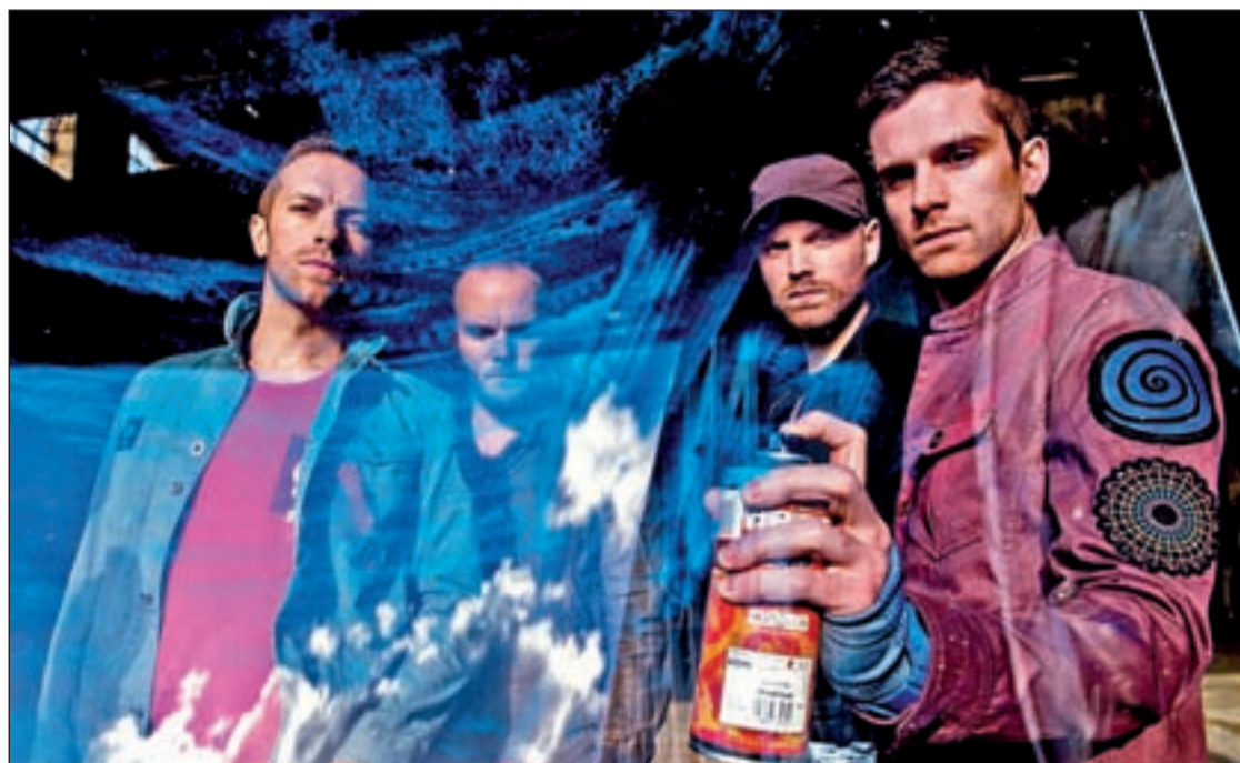
De izquierda a derecha, Chris Martin, Will Champion, Jonny Buckland y Guy Berryman

El pasado 6 de octubre, el anuncio oficial del grupo a través de Internet (web y redes sociales) provocó una gran conmoción entre sus seguidores, decenas de miles en el territorio español. Cuatro meses y medio después del concierto ofrecido en el BBK Live de Bilbao (7 de julio), se confirmaba su regreso a España con nuevo trabajo discográfico bajo el brazo. Quienes estuvieron en aquella cita ya pudieron comprobar cómo suenan en directo nuevas canciones co-