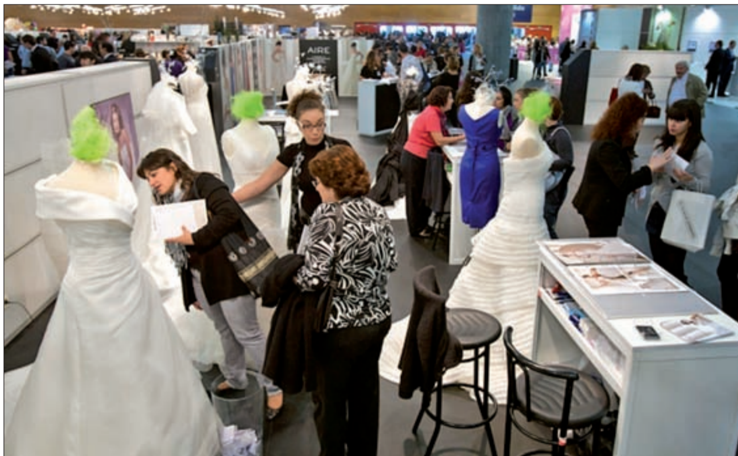
Miles de visitantes recorren cada año el Salón 'Las Mil y Una Bodas' de IFEMA