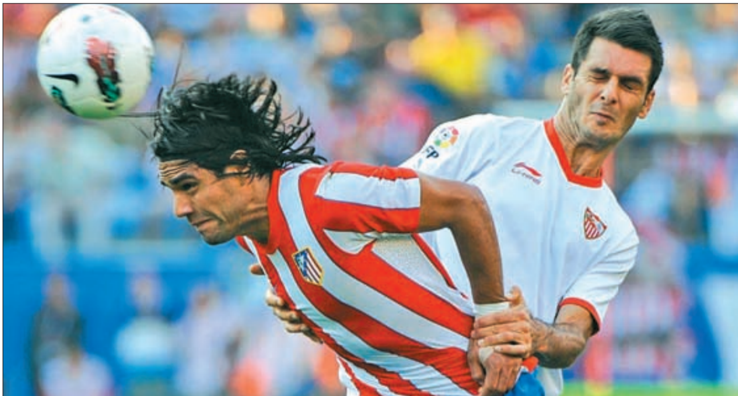
Falcao, uno de los fichajes estrella del Atlético de Madrid, durante un encuentro del presente curso ante el Sevilla

HASTA SEIS EQUIPOS DE PRIMERA NO LUCEN PUBLICIDAD ESTA TEMPORADA EN SUS ZAMARRAS