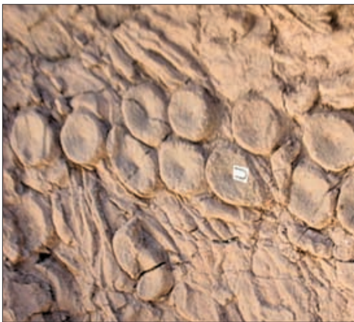
Imagen del yacimiento de Nevada

La evidencia se encuentra en el Berlín-Ichthyosaur State Park en Nevada, donde pueden encontrarse restos de ictiosaurios de la especie Shonisaurus popularis , que medían unos 14 metros. En el yacimiento de fósiles,