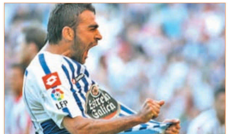
Al Deportivo no le ha afectado el descenso a Segunda División

lladolid. El club blanquiuoleta lleva dos temporadas en Segunda División; en ambas ha tenido que dejar vacía la parte delantera de su elástica ante la falta de ofertas que complacieran sus expectativas. Esa situación no la sufren por el momento los tres últimos descendidos (Hércules, Almería y Deportivo) que mantienen a sus patrocinadores.