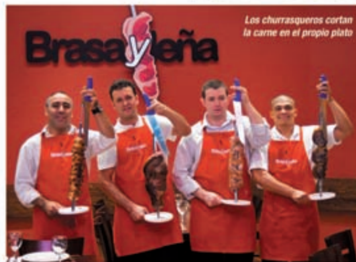
Los churrasqueros cortan la carne en el propio plato