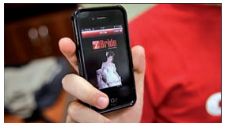
Imagen de una de las aplicaciones móviles para organizar una boda

aquello que buscan. Pero no es el único. BlackBerry planificador de boda, Wedding Plannin, iWedding iPhone Wedding Planner o iBride Wedding Planner ayudan a planificar al detalle toda boda. También la tecnología cuida tu bolsillo gracias a la aplicación Money Saver. Aliados 2.0 siempre disponibles.