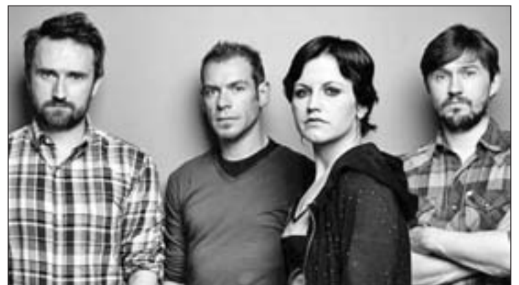
Dolores O'Riordan es la vocalista y líder de esta formación

tions', 'So Good' y 'Roses' serán los temas incluidos en el álbum. Dolores O' Riordan (vocalista y líder del grupo), Noel Hogan, Mike Hogan y Fergal Lawler se reunieron el pasado año para hacer una gira que visitó España. Su popularidad en nuestro país comenzó tras la publicación de 'No need to argue' (1994).