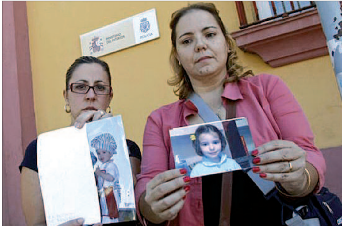
Familiares de los menores muestran imágenes de los desaparecidos

Mientras tanto, la Policía Nacional abandonó la búsqueda de los dos menores en el río Guadalquivir. Este martes, el Grupo Especial de Actividades Subacuáticas (GEAS) rastreó en una zodiac el río entre la capital cordobesa y la barriada periférica de Alcolea, en busca de pistas, pero no se encontró nada. Los agentes se emplearon al máxi-