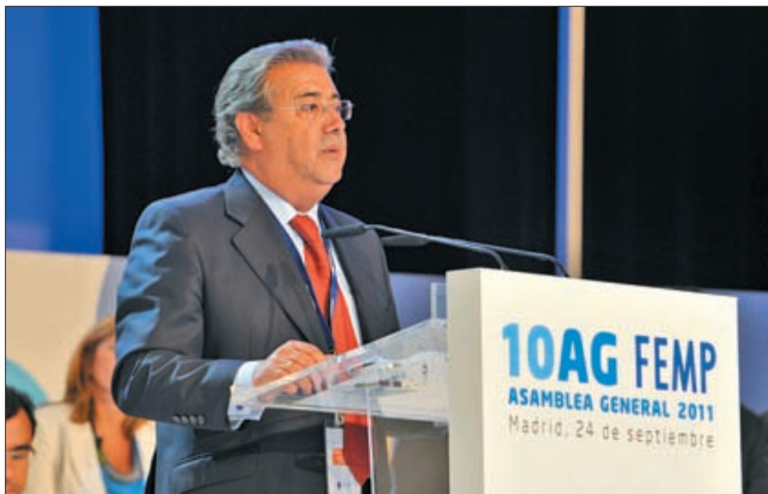
Juan Ignacio Zoido, presidente de la Federación de Municipios y Provincias (FEMP)