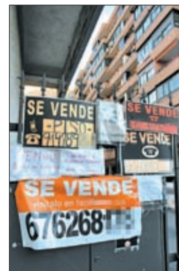
Viviendas en venta

El mercado inmobiliario no levanta cabeza. En agosto, la compraventa de viviendas cayó un 38 por ciento respecto al mismo mes de 2010. Tan sólo se realizaron 27.038 operaciones, y la vivienda nueva fue la que más cayó. Los datos también han sido peores que los de julio, y así en tasa intermensual la caída ha sido del 4,8 por ciento.