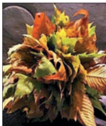
Un ramo de temporada

del año y ahora toca el otoño y sus flores. Los girasoles, las rosas y las margaritas, son las claves de la elegancia otoñal, aunque no pueden faltar las hojas rojizas o marrones de los árboles para dar el toque final. En los centros de mesa los naranjas, calabazas, amarillos y verdes oscuros ofrecen el éxito seguro.