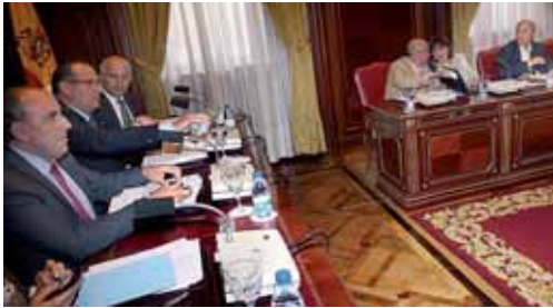
Un momento del pleno celebrado en la Diputación Provincial.

Al respecto, el equipo de Gobierno del PP acusó a la oposición de sembrar "alarmismo" y defendió que las instalaciones además de cumplir con todos los requisitos en materia de salud y medio ambiente van a ser un revulsivo para traer empresas a la provincia cuando finalice la crisis económica.