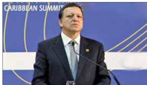
El presidente de la Comisión Europea, Durao Barroso.

Los ingresos se destinarán a financiar el presupuesto de la UE, reduciendo así las aportaciones de los Estados miembros, y a los presupuestos na-