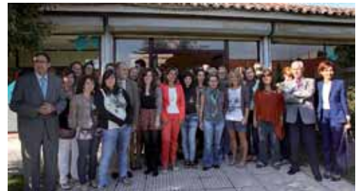
La consejera asistió al inicio del programa comunitario.