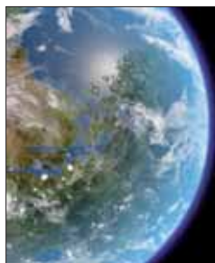
Nuestros recursos se agotan.

ta el 31 de diciembre de 2011 los recursos que se consumen para satisfacer la demanda ecológica se deberán a la explotación de los recursos por encima de lo que pueden producir y acumulando tanto gases de efecto invernadero como otros contaminantes.