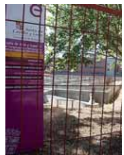
Ha mejorado el aspecto del solar.

Desde la Delegación Territorial, se responde así a las demandas del colectivo vecinal, solventando una situación que se ha producido por "circunstancias ajenas a las previsiones de la Junta de Castilla y León, indicadas por unas condiciones de crisis económica, que ha