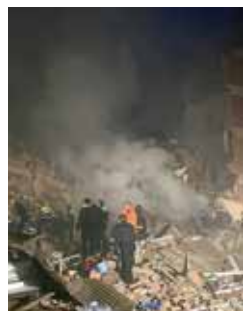
Imagen de archivo del suceso.

El colectivo de afectados por la deflagración acaecida en la madrugada del 1 de mayo de 2007 -con el resultado de nueve fallecidos, diversos heridos y cuantiosos destrozos materiales- señala en el recurso que un informe de los peritos apunta al hallazgo en un contenedor del Parque de Bomberos de restos de calderas, contadores de agua, así como trozos de conducciones deformadas, llaves de paso y reguladores sin poder precisar a que instalación individual co-