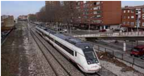
Fomento ratifica que el AVE llegará a Palencia en 2012.