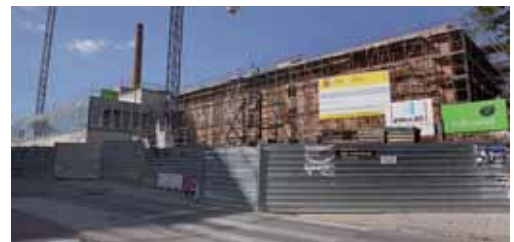
Imagen de como se encuentran las obras de La Tejera.

la próxima Junta de Gobierno Local la decisión final sobre estas mociones para permitir a los portavoces de los grupos de la oposición un estudio más pormenorizado de las propuestas realizadas por iniciativa del PP.