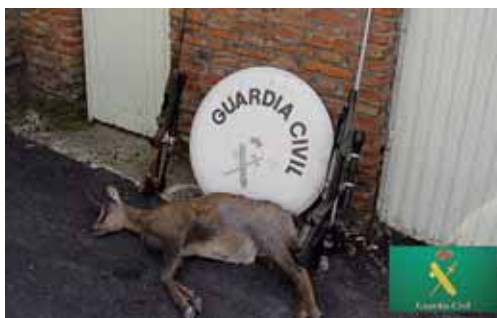
Imagen del rebeco abatido en el Parque de Fuentes Carrionas.

Inmediatamente, se estableció un dispositivo para poder interceptar a esta persona, participando personal de las Patrullas del Seprona de Guardo, Saldaña, Equi-