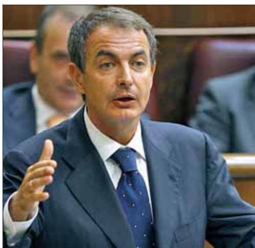
Zapatero en su última intervención parlamentaria.

Las elecciones del 20N se acercan y el ambiente se va tensando in crescendo. José Luis Rodríguez Zapatero vivía la semana pasada su última intervención parlamentaria como presidente del Gobierno, símbolo de que su legislatura había llegado a su fin. Pero no lo hizo en calma. Con la aprobación del decreto ley de Prórroga de los Presupuestos Generales del Estado de este año para 2012 se ha recrudecido más, si cabe, el tema de los recortes y no hay actualidad más candente. Ni un arma electoral tan potente. No obstante, los dos candidatos con más opciones a la presidencia en las próximas elecciones, Mariano Rajoy y Alfredo Pérez Rubalcaba, se encuentran inmersos en una batalla por los recortes. Ambos aseguran que