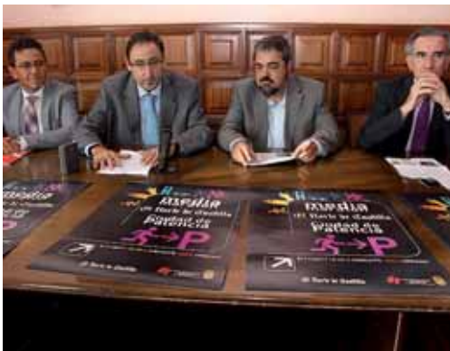
Un momento de la presentación en el Ayuntamiento de Palencia.

La prueba se celebrará el 5 de noviembre en la capital palentina y se ha establecido un límite de 1.200 atletas