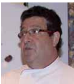
Imagen de archivo de Sánchez.

Desde el Grupo Popular en el Ayuntamiento de Venta de Baños señalan a través de un comunicado que dicho solar fue vallado