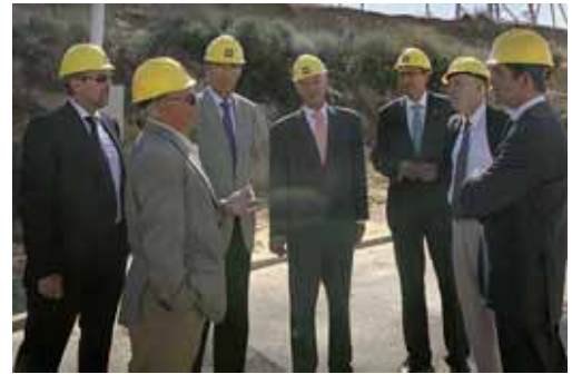
El alcalde y el delegado territorial de la Junta visitaron las obras de mejora.

Por su parte, el regidor palentino mostró su satisfacción al considerar que es "una magnífica noticia que todos los ciudadanos puedan tener un mejor suministro y se garantice la seguridad del mis-