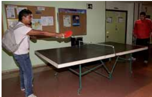
Las propuestas van dirigidas a jóvenes de 16 a 30 años.

jala de Juventud, Vanesa Guzón, una media diaria de 350 partici-