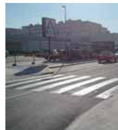
Imagen del resultado de las obras.

La actuación ha consistido en comunicar ambas vías demoliendo la acera de la Avenida de Cu-