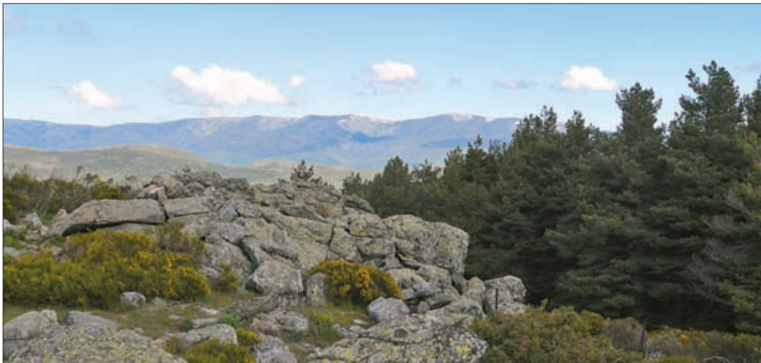
Alrededores del Puerto de Canencia con los Montes Carpetanos al fondo