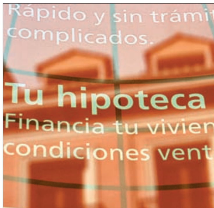
Cartel publicitario de una hipoteca en una sucursal

Los expertos explican que la tasa final del Euríbor dependerá de las subidas de tipos que aplique el Banco Central Europeo (BCE) a la luz de la evolución del pre-