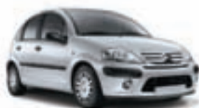
Citroën C3 1.1 Audace. Precio anual orientativo con bonificación.