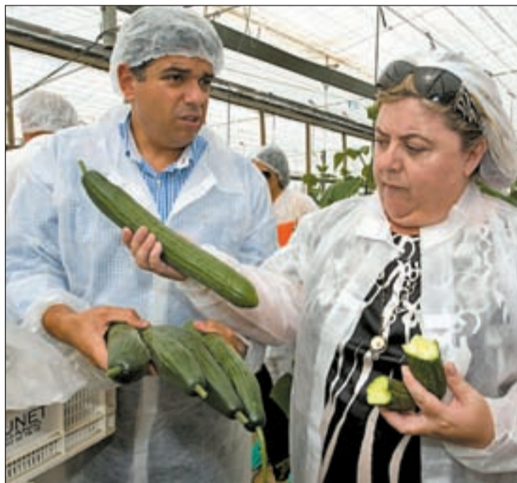
La consejera de Agricultura andaluza en una planta de pepinos

La 'crisis del pepino' ha causado quince muertes y ha afecta-