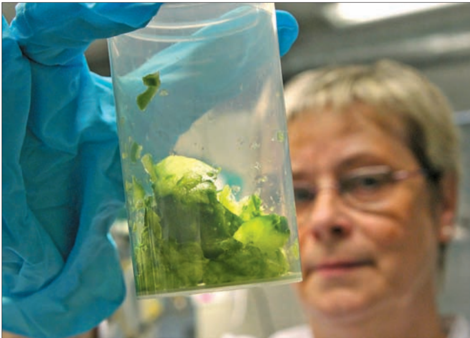
Una científica analiza en Rostock, Alemania, algunas hortalizas españolas

Las autoridades alemanas desmienten que el origen del foco de la infección mortal por E.coli partiera de los productos hortícolas españoles • Pérdidas de 200.000 euros semanales Pág. 3