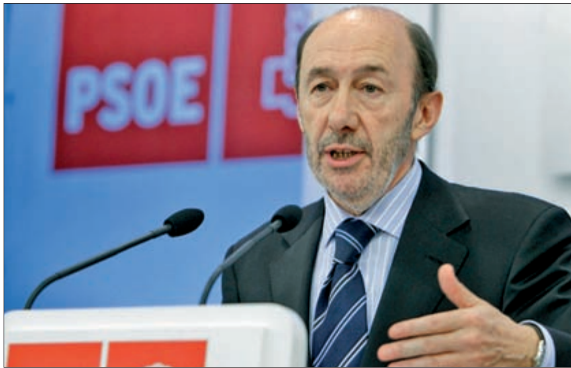
El vicepresidente del Gobierno, Alfredo Pérez Rubalcaba, durante una rueda de prensa en Ferraz

Extremadura sigue pendiente de la decisión de IU, que tiene la llave para que gobierne tanto el PP como el PSOE. UPyD es clave también en 26 municipios de todo el Estado, sobre todo en Madrid, Castilla y León y Andalucía porque su apoyo determinará el futuro local de PP y PSOE.