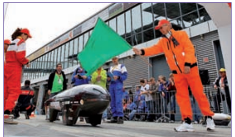
ESTUDIANTES DE TODO EL MUNDO Este certamen se ha convertido en una cita de referencia internacional para los estudiantes de ingeniería. Innovación, creatividad y compromiso definen la filosofía de este evento.