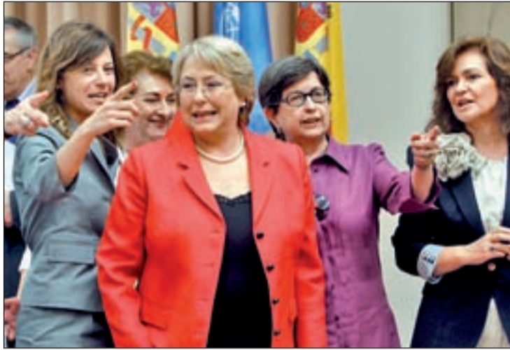
Michelle Bachelet junto a Bibiana Aído y otras autoridades

Su discurso, armado y directo, fue claro: la igualdad de las mujeres en los ámbitos de dirección y responsabilidad no es sólo una cuestión de justicia social, sino que está íntimamente ligada al desarrollo económico. Así, Bachelet señaló que "el empoderamiento económico de las mujeres es la puerta de entrada para