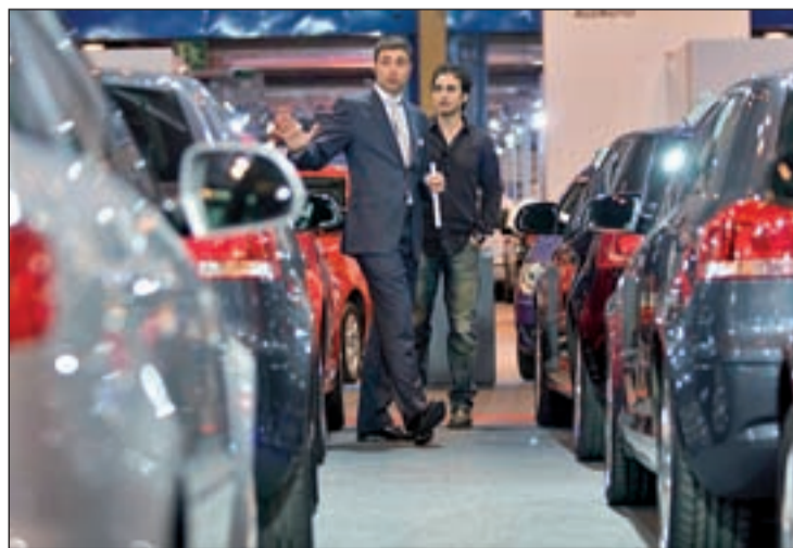
En abril, las ventas de vehículo de ocasión subieron un 19,6%

La patronal de los concesionarios destacó que, durante el pasado mes de abril, el 52,8% de las transacciones de automóviles de ocasión se efectuaron entre particulares, mientras que el 44% contó con la intervención de profesionales, lo que evidencia la creciente atención que los concesionarios prestan a este negocio, ante la caída de las ventas de vehículos nuevos.