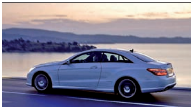
La marca alemana saca pecho ante las ventas de su modelo Clase E