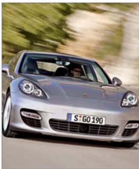
Imagen del modelo híbrido Panamera de Porsche

Por lo que respecta a las prestaciones, el coche es capaz de acelerar de cero a cien kilómetros por hora en seis segundos y de alcanzar una velocidad máxima de 270 kilómetros. El Panamera puede llegar a 85 kilómetros por hora en modo eléctrico, en el que la autonomía es de 270 kilómetros. Sin necesidad de sacrificar la deportividad, el Panamera Hybrid S combina una potencia total de 380 CV con un consumo medio de sólo 6,8 litros a los 100 kilómetros, lo que equivale a unas emisiones de CO2 de apenas 159 gramos por