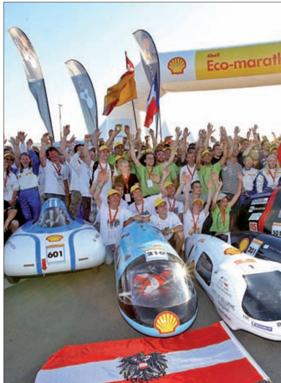
El Eco-Marathon Shell: sólo para vehículos energéticamente eficientes

Según precisa Shell, en la edición de este año han acudido 187 equipos y ha habido vencedores de diez países, que han participado por primera vez este