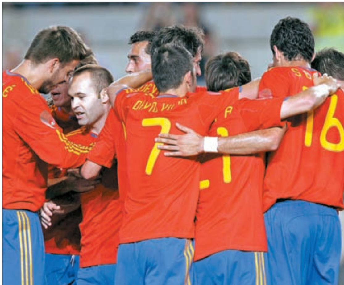
Los campeones del mundo vuelven a juntarse tres meses después

Tras estos últimos triunfos, la selección española es un producto a explotar por parte de la Real Federación Española de Fútbol (RFEF). Si hay un mercado cuyo escaparate aún no contaba con la presencia de la 'Roja' ese es el norteamericano, por lo que Ángel María Villar y el resto de dirigentes no dudaron en aceptar la proposición de jugar dos en-