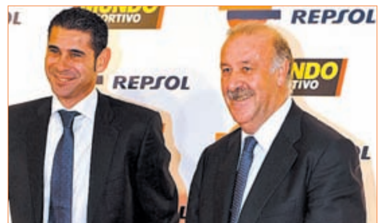
Hierro fue el principal responsable de la llegada de Del Bosque

Las principales novedades en la lista de Vicente Del Bosque para esta gira son la presencia en la lista de Borja Valero y Manu Del Moral, dos jugadores que todavía no saben lo que es vestir la 'Roja', así como el regreso de algunos futbolistas que ya estuvieron citados con la selección en