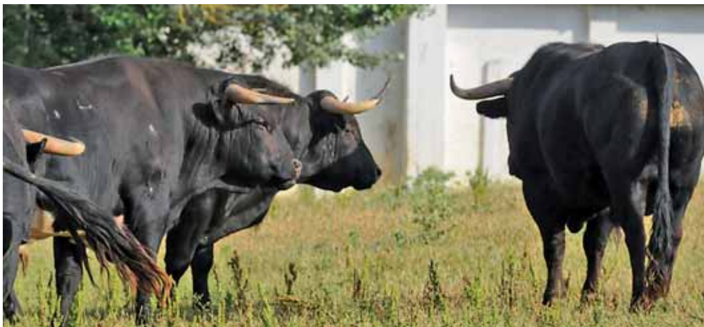
Las reses bravas de la divisa Valdellán pastan en un paraje casi idílico, entre encinas y robles. En la foto, varios utreros junto a la plaza de tientas.

La singularidad de esta ganadería introducida en 2002 es el encaste de los toros, de Santa Coloma, de la rama de Graciliano, un encas-