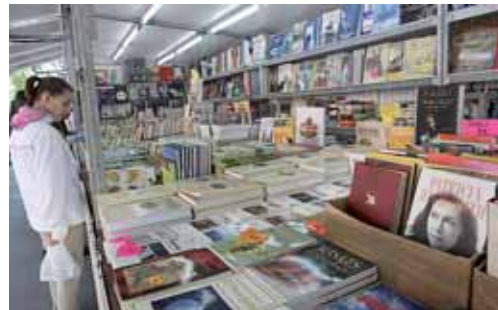
La oferta de la Feria del Libro se aproxima a los 30.000 títulos.

San Francisco de la capital palentina. Asimismo, tendrán lugar diversos espectáculos de magia, pasacalles musicales con gigantes y cabezudos, desfiles de peñas y teatro de calle. En cuanto a las actividades deportivas, a los tradicionales torneos de golf, gimnasia rítmica, petanca y tiro olímpico, se suma este año como novedad un campeonato de Tribasket en la zona deportiva del parque Isla Dos Aguas. El mismo, clasificatorio del Campeonato de España, se celebrará el domingo 12 de junio de 10 a 19 horas en colaboración con