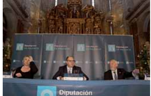
Imagen de archivo de la celebración del año pasado en Aguilar.

El objeto de esta convocatoria es la concesión de ayudas económicas que faciliten la creación, ampliación o mejora de actividades empresariales en el medio rural de la provincia. La finalidad última de la misma es dinamizar la economía mediante el desarrollo de un tejido empresarial local y la generación y mantenimiento de puestos de trabajo estables, tanto directos como indirectos.