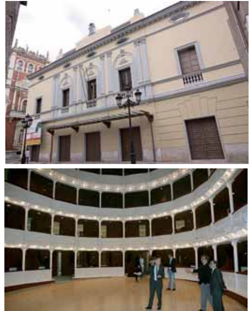
El Teatro Principal luce una nueva imagen tanto fuera como dentro.

Por último, el subdelegado del Gobierno definió el Teatro "como una vieja dama de la ciudad que se ha remozado" y destacó que