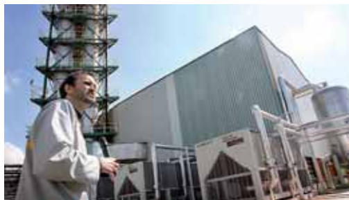
Renault llevo a cabo en 2010 un total de 150 líneas de acción.

La factoría de la marca del rombo ha llevado a cabo en 2010 un total de 150 líneas de acción a través de su Comité de Energía y ha invertido 1,5 millones de euros en ahorro energético, apostando también por las energías renovables, con ocho paneles solares que ahorran en la producción de agua caliente en vestuarios y servicios, al permanecer apagas las calderas desde mayo y hasta octubre.