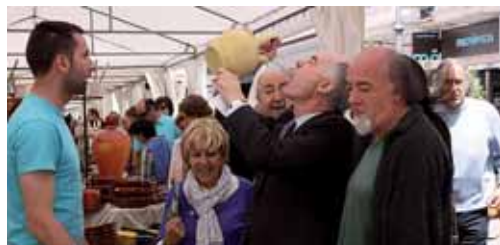
La Calle Mayor de Palencia acoge hasta el 12 de junio la Muestra.

mostración de raku el jueves 18 a partir de las 18.00 horas y demostraciones de torno el jueves, viernes, sábado y domingo en horario de 13 y 19 horas.