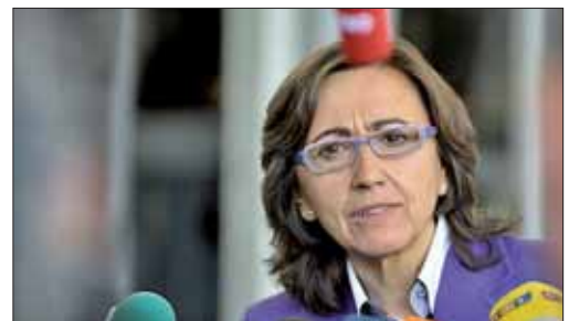
La ministra de Medio Ambiente, Rosa Aguilar.

no, Rosa Aguilar, lanzaba un mensaje claro en medio de la crisis. El fondo con 150 millones de euros en ayudas que propone crear la Comisión Europea para compensar el 30% de las pérdidas de los agricultores europeos -no sólo los españoles-, afectados por la crisis.