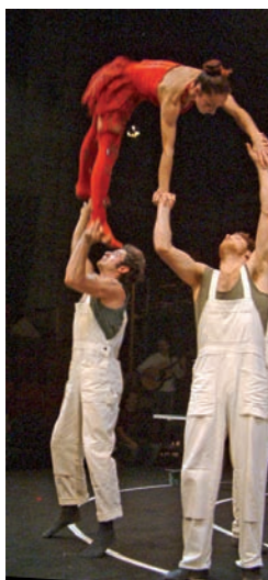
'Pffffff' de la compañía Akoreacro.

“Este año se apuesta por impulsar la creación de nuevos proyectos escénicos