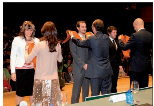
Unos alumnos reciben su beca en el Acto de Graduación del pasado año.

además de las becas correspondientes a los cerca de quinientos titulados, menciones a los mejores expedientes académicos de cada una de las carreras que se