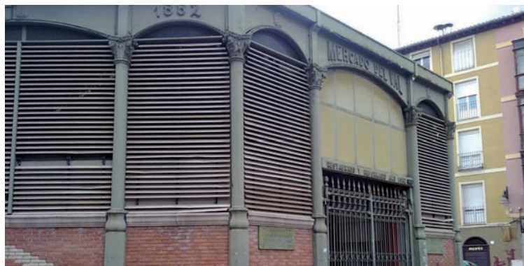
El Mercado del Val va a mejorar su imagen y sus servicios.

ciación para hacer frente a las grandes superficies comerciales en la periferia de la ciudad, ante la ausencia de servicios estables y modernos para los clientes potenciales en los pequeños y medianos comercios del casco histórico, suponen una pérdida paulatina de competitividad del comercio tradicional, y además alteran el ritmo de vida tradicional del casco urbano.