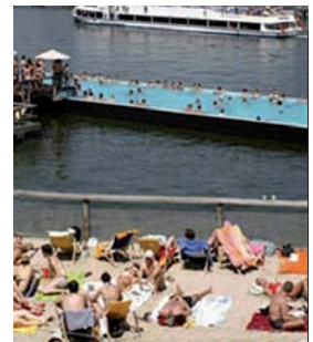
León de la Riva prometió para el río Pisuerga una piscina flotante como la de la imagen en Berlín.