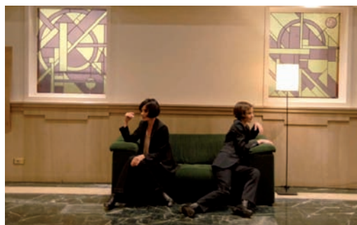
Espectáculo de la compañía La Permanente.

peatonales, y con 'Bajo el andamio', de Teatro Percutor, que podrá verse a las 21.00 horas en la calle Santiago, esquina con la Plaza Zorrilla. Por último, la compañía francesa Luc Amoros estrenará en España su obra multidisciplinar 'Page Blanche' a las 23.00 horas en el espacio B de la Plaza Mayor.