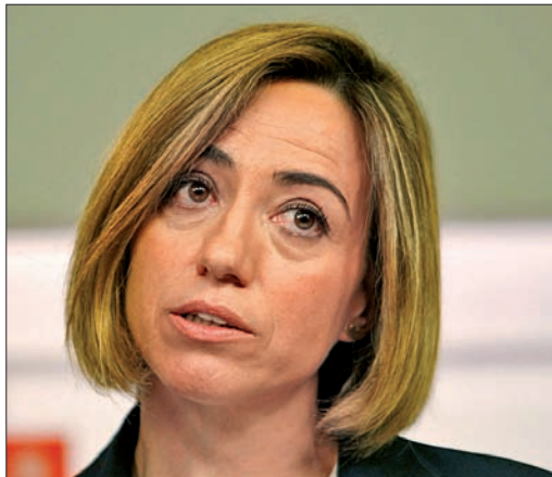
Carme Chacón atiende a los medios antes de anunciar su decisión

Los socialistas buscan una salida y una regeneración del partido tras la debacle en las urnas municipales y autonómicas. En el penúltimo capítulo de los enroques internos que mueven las piezas para las generales 2012, Carme Chacón ha decidido salir del tablero. La ministra de Defensa ha anunciado de forma inesperada su abandono en la carrera de las Primarias arguyendo que "se estaba poniendo en riesgo la unidad del partido, la autoridad de Zapatero, la imagen colectiva del PSOE e incluso la estabilidad del Gobierno". El viernes 27, Rodríguez Zapatero ha convocado a sus 'barones' en busca de unidad cara al comité federal del sába-