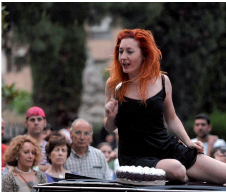
La Plaza de la Universidad acogió la exhibición de la compañía de danza Alicia Soto-Hojarasca.

nacional centrarán la programación del viernes del Festival Internacional de Teatro y Artes de Calle de Valladolid, que celebrará su duodécima edición hasta el próximo domingo 29 de mayo. os estrenos absolutos se completarán con los espectáculos 'El triángulo de las Bermudas', de Zootroupe. Troupe Mágica, que tendrá lugar de 12.30 a 14.00 horas y de 19.00 a 20.30 horas en la calle Santiago y