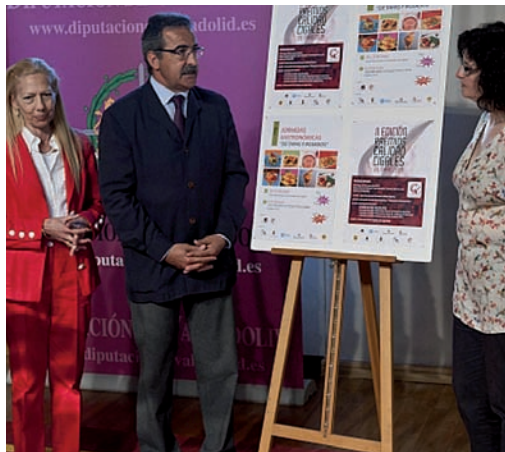
Momento de la presentación en la Diputación Provincial.

convencida de que "la iniciativa tendrá éxito" y auguró que quizás "no haya tantas botellas del vino ganador para que toda la gente que quiera pueda probarlo". En definitiva, espera que "dentro o fuera de España" se logre que Cigales "sea tan importante como cualquier otro vino".