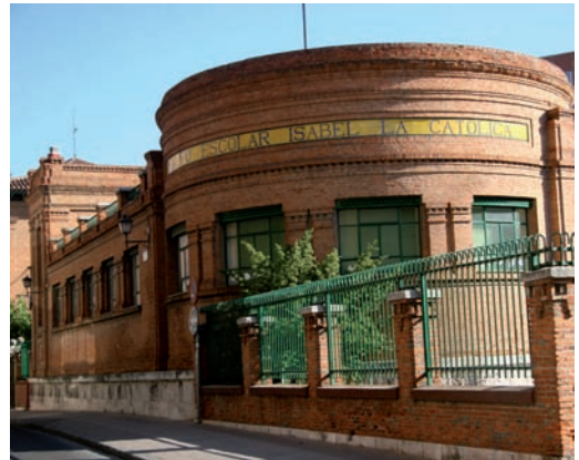
Imagen de la entrada principal del colegio Isabel La Católica.

El calendario escolar del próximo curso establece un total de 179 días lectivos para los alumnos de Primaria y 175 días en el caso de alumnos de Secundaria, ajustándose así a la normativa establecida por el Ministerio de Educa-