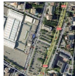
Vista aérea de la Feria.

CENTRO DE MAYORES. En su programa incluye la construcción de un centro de personas mayores para el barrio de Parquesol, una obra que se llevará a cabo durante el próximo mandato. León de la Riva espera poder dedicar a Centros de día los locales de