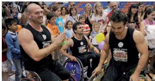
Los jugadores del Grupo Norte festejan el título.

Hay que remitirse hasta la década de los ochenta para acordarse del Ademi de Málaga, el último equipo que consiguió el título y dejó de ser el equipo más laureado del baloncesto en silla de ruedas español. En ese momento, aparecía el Fundosa Once, gran dominador en todos los sentidos.