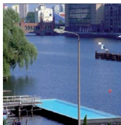
Piscina flotante de Berlín.

SOTERRAMIENTO. Sin duda ha sido el tema estrella de todos los candidatos y, según De la Riva, el principal acicate para presentarse a la reelección. El PP prometió una intervención entre el antiguo apeadero de la Universidad de Valladolid y la calle Daniel del Olmo. A mediados de 2012 se terminarán los nuevos talleres que,