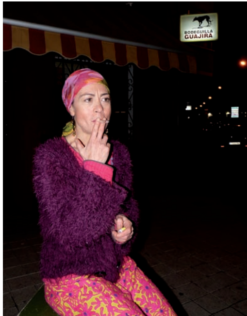
Los fumadores continúan saliendo a la calle con sus cigarrillos y bebidas.

Nicolás Prieto ha recordado asimismo que en España el fumador es un "gran consumidor" de la hostelería, una realidad en la que "no se puede mirar hacia otro lado". Según sus datos, las pérdidas del sector por la aplicación de la Ley Antitabaco se sitúan en torno al 28 por ciento, si