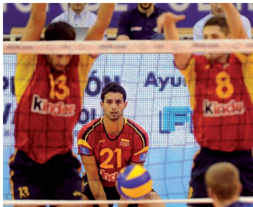
La selección española regresa para jugar en Valladolid.

La Liga Europea la disputan doce selecciones, encuadradas en tres grupos de cuatro, de los que Holanda, Austria y Grecia conforman el correspondiente al