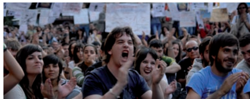
Los manifestantes durante la concentración en Fuente Dorada.

Los acampados en la plaza Fuente Dorada convocan una manifestación para este viernes 27 de mayo