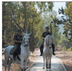
Patrulla ecuestre de Murcia.

EL DEPORTE COMO ESPECTÁCULO. Entre las promesas electorales del PP en este ámbito destaca el apoyo a los clubes de elite de la ciudad; la apuesta por traer a Valladolid la organización de competiciones de categorías inferiores y de carácter nacional, que tanta riqueza generan en nuestra sociedad, y la colaboración con la Federación Española de Balonmano para que Valladolid albergue una de las sedes del mundial 2013 de