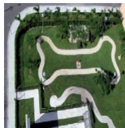
Dog Park de Denver (Colorado).

ESCALERA MECÁNICA EN PARQUESOL: Otro atractivo será si finalmente se construyen las escaleras mecánicas que unirán, desde las calles Juan Valladolid y