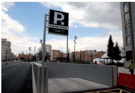
Acceso al aparcamiento de la Plaza del Milenio.

El alcalde de Valladolid les respondió, como es habitual en él, con firmeza. "La mañana y la tarde es tarifa completa, y el que entre ahí ya sabe lo que va a pagar, si quiere un rotatorio convencional que vaya al de la planta primera y ahí pagará por el tiempo que esté", aseguró, antes de apuntar que los sábados y domingos y a partir de las 20.00 horas ambas plan-