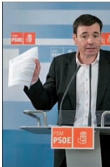
Gómez denuncia el copago

Curioso es el hecho de que, a pesar de sus repetidas críticas contra la gestión privada de los hospitales, entre sus promesas electorales no figure la gestión directa de dichos centros y la recuperación de su concesión administrativa, tal y como hace el partido liderado por Gregorio