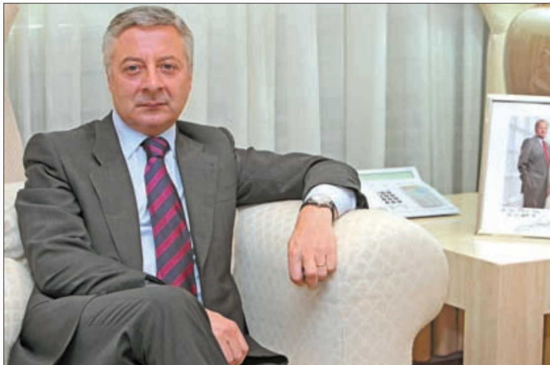
José Blanco se muestra confiado en que haya sorpresas en las urnas

Este Gobierno no sólo se ha preocupado de emprender actuaciones que contribuyan a la cohesión social y territorial del país, sino que hemos puesto en marcha un conjunto de reformas para adelantar la salida de la crisis y establecer un sistema de transporte eficiente, competitivo y sostenible. Ese ha sido el objetivo que buscaba la nueva Ley de Puertos, las Autopistas del Mar, la reforma de la Ley de Navegación Aérea, el nuevo Modelo Aeroportuario, la configuración de una de las redes de Alta Velocidad Ferroviaria más importantes del mundo o el Plan de Impulso al Transporte de Mercancías por Ferrocarril. El Gobierno socialista ha alcanzado inversiones anuales del orden de 17.000 millones de euros (1,62% del PIB), cuando en el mejor año de gobierno del PP (2003) la inversión apenas superó los 9.000 millones de euros (1,22%), poco más de la