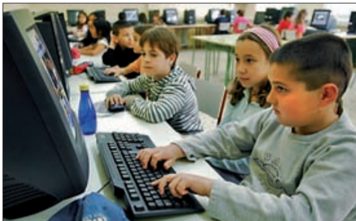
Niños usando ordenadores en un colegio

Cada uno de los temas ofrece una presentación multimedia y más de 50 actividades que podrán realizar los alumnos y su objetivo es conseguir que los estudiantes se impliquen mientras aprenden.