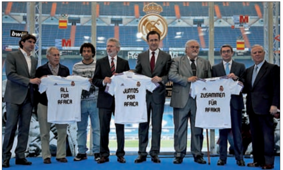
Presentación del partido Juntos por África

Para participar, los interesados tendrán que acudir a la Oficina Joven-TIVE.