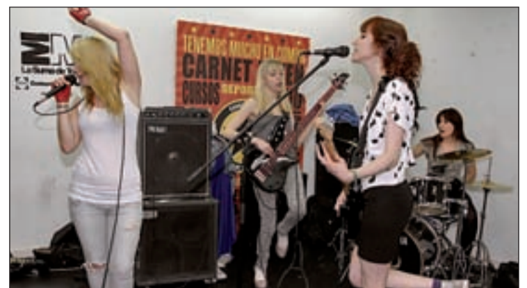
Una banda actúa en las salas de ensayo de Metro