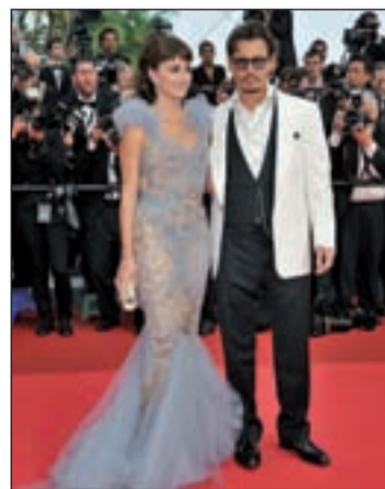
Penélope Cruz y Johnny Depp

Tras el tradicional paseo, ambos atendieron a la prensa, donde 'Pe' recordó que "siempre seré una actriz española, trabaje allí o en cualquier sitio".