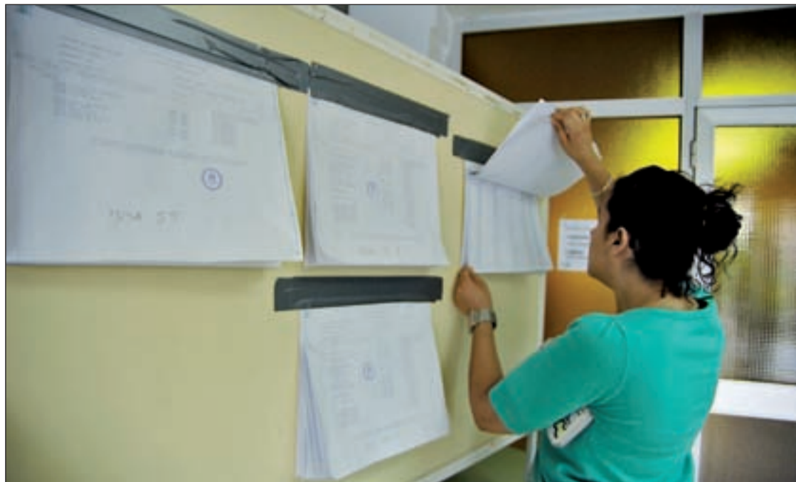
Papeletas en un colegio electoral en los comicios municipales de 2007