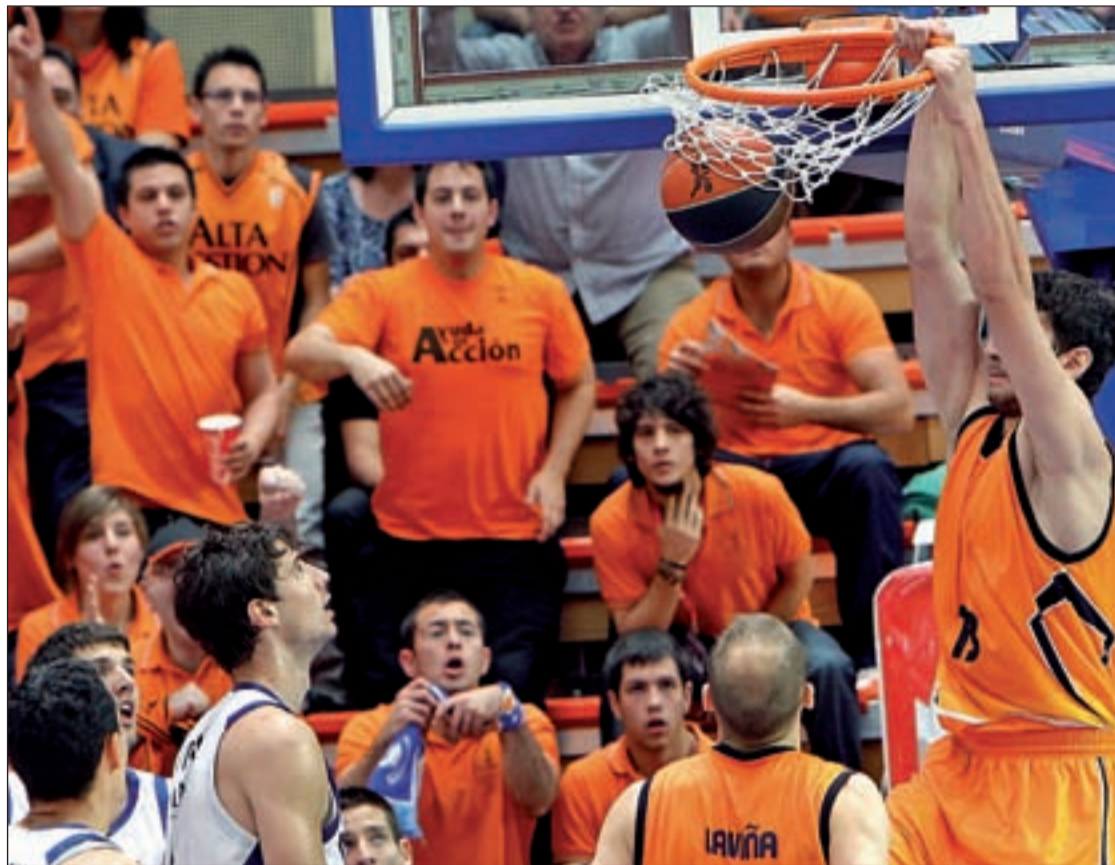
Los blancos ya cayeron en el Fernando Martín en el partido de vuelta de la fase regular