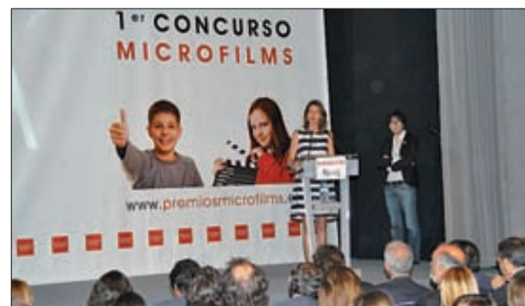
La consejera de Educación, Lucía Figar, en la entrega de galardones

Los ganadores de cada categoría han recibido como premio un viaje de estudios valorado en 4.000 euros, aparte de un cheque regalo de 300 euros para material escolar y la emisión del trabajo a través de La 10 TV y en www.premiosmicrofilms.es