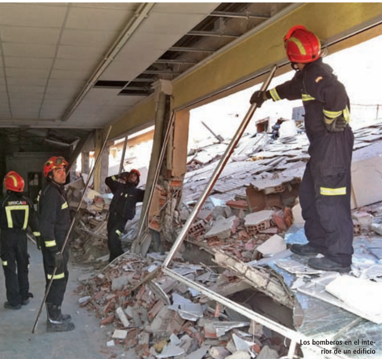
Los bomberos en el interior de un edificio