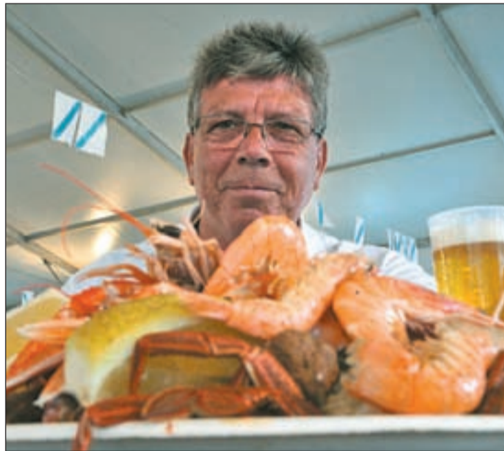
Un hombre ante un succulento plato de comida