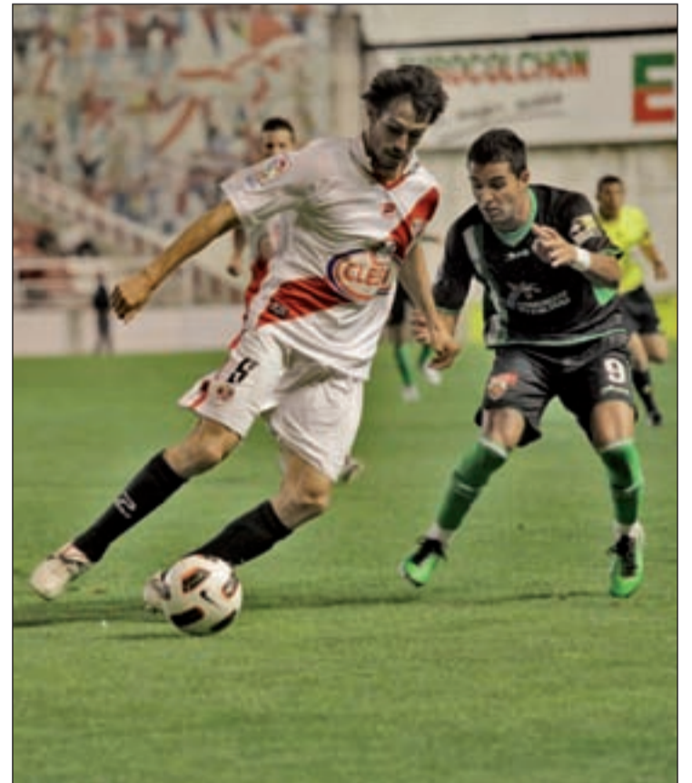
Los rayistas pueden lograr el objetivo ante su afición

De este modo, el Rayo tiene en su mano la posibilidad de alejar a un incómodo inquilino que lo ha acompañado durante todo el año: el sufrimiento. Primero fueron los impagos, después las dudas de la familia Ruiz-Mateos en torno a la profesionalidad de la plantilla y por último la agonía que supone cerrar el ascenso.