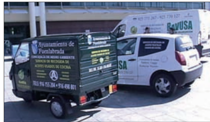
Fuenlabrada está a la cabeza de la recogida de aceite