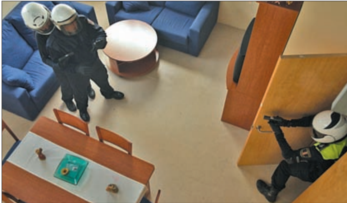
Agentes durante las prácticas del asalto