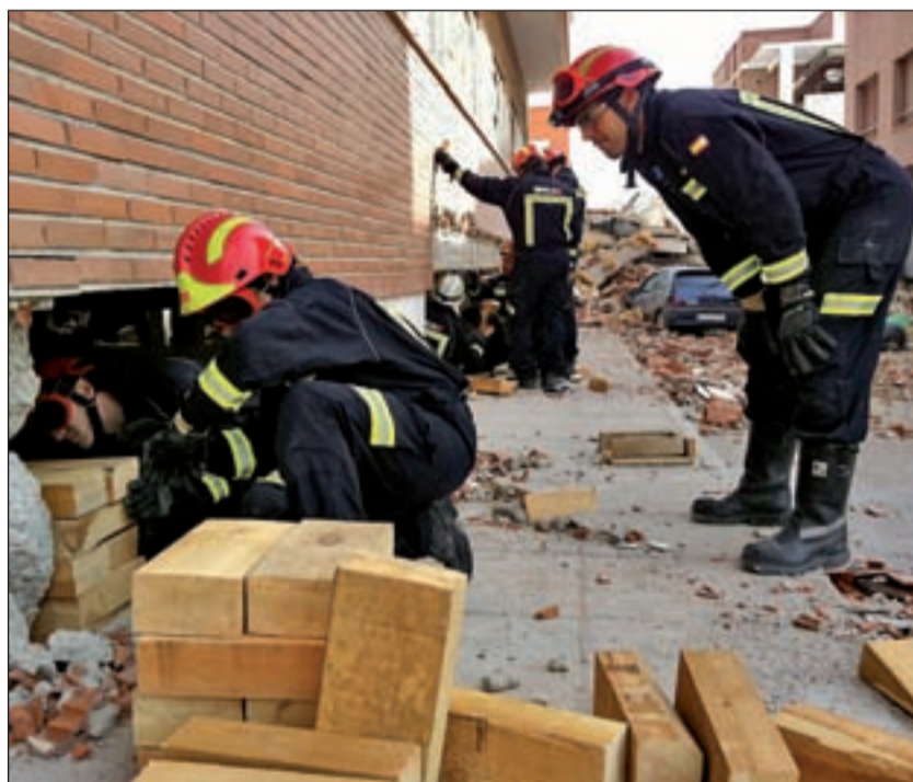
Bomberos del ERICAM trabajan en Lorca

Así, en tan sólo 24 horas un equipo de bomberos de la Comunidad de Madrid perteneciente a la Unidad de Emergencia y Respuesta Inmediata desembarcó en el municipio con el objetivo de ayudar en la revisión de las construcciones afectadas por el seísmo, realizar apuntalamien-