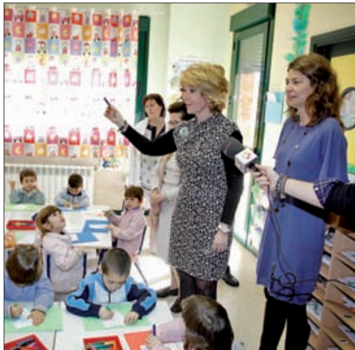
Esperanza Aguirre visita un colegio de la Comunidad

PSM e IU incluyen en sus programas la universalización de la oferta educativa de los 0 a 3 años gratuita. A esto los socialistas añaden la construcción de nuevas escuelas infantiles y casas de niños y la unificación progresiva en el mismo centro escolar de los dos tramos de la Educación Infantil, de cero a tres y de tres a seis años. También coinciden PSM e IU en proponer la gratuidad de los libros de texto y de materiales didácticos.