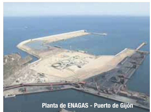
Planta de ENAGAS - Puerto de Gijón