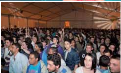
Éxito de participación en Candinamia 2011