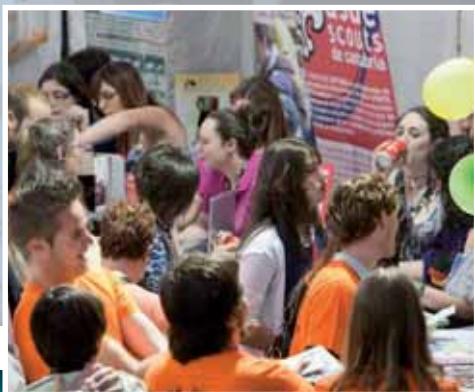
Animación, diversión y compañerismo.