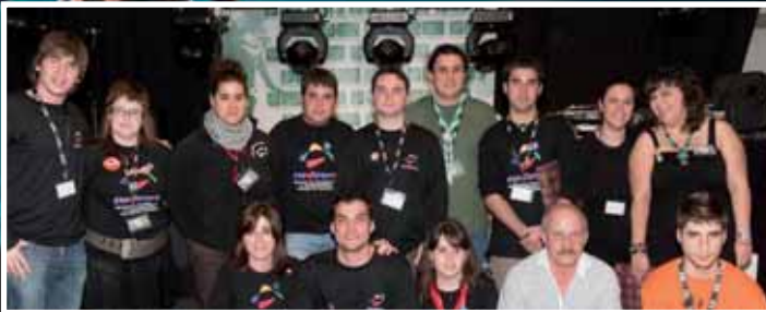
Imágenes finales de Candinamia para el recuerdos de la edición 2011