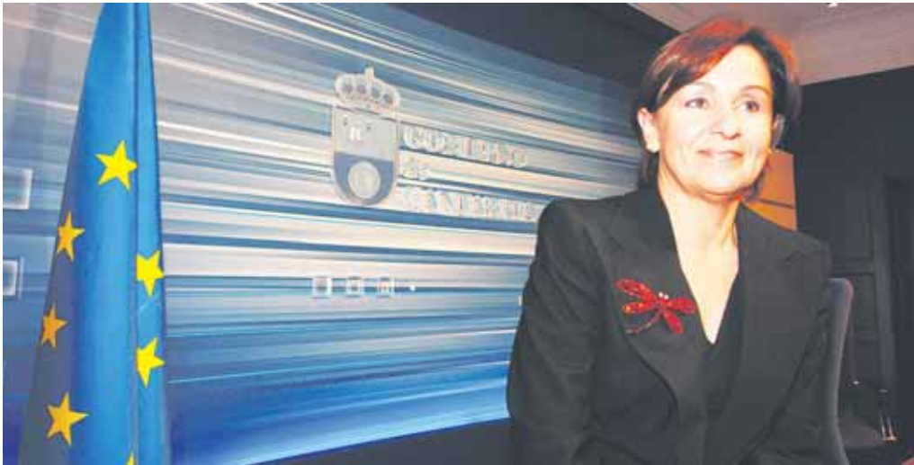
Dolores Gorostiaga es la vicepresidenta del Gobierno de Cantabria y candidata a la Presidencia por el PSOE.

La vicepresidenta del Gobierno de Cantabria se refería al centro educativo Torrevelo