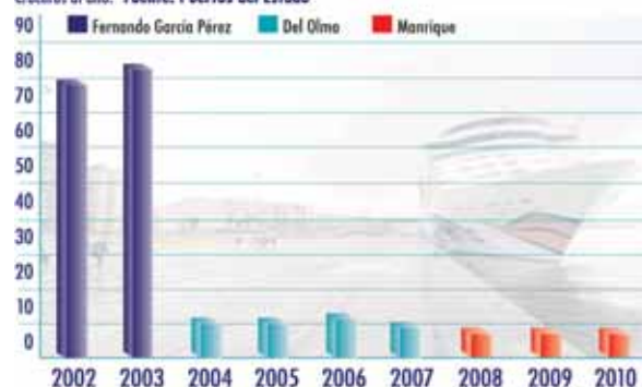
Inversión realizada por el Estado en los puertos de Santander y Gijón (datos de Puertos del Estado en millones de euros)