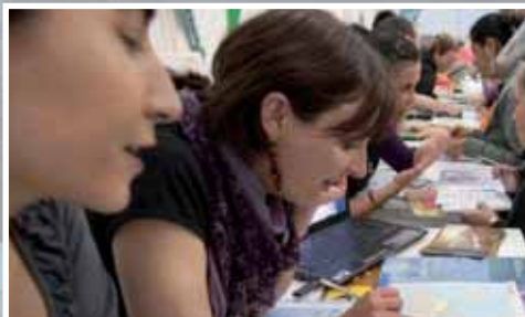
Jóvenes en la edición de Candinamia 2011.

voluntaria". Candinamia 2011 ha contado este año con