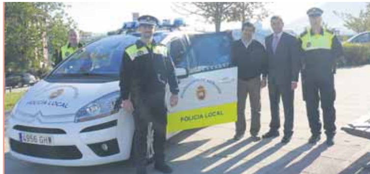
Agentes del cuerpo de policía local posando con los coches dotados de los nuevos sistemas

En este sentido, se considera así la solución idónea que unifica movilidad y conectividad en la transmisión de datos, ofreciendo una nueva posibilidad de "oficina móvil", se esté donde se esté. Esta iniciativa se suma además a otra que se ha desti-