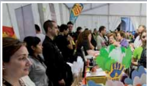
Actividades varias en Candinamia 2011.