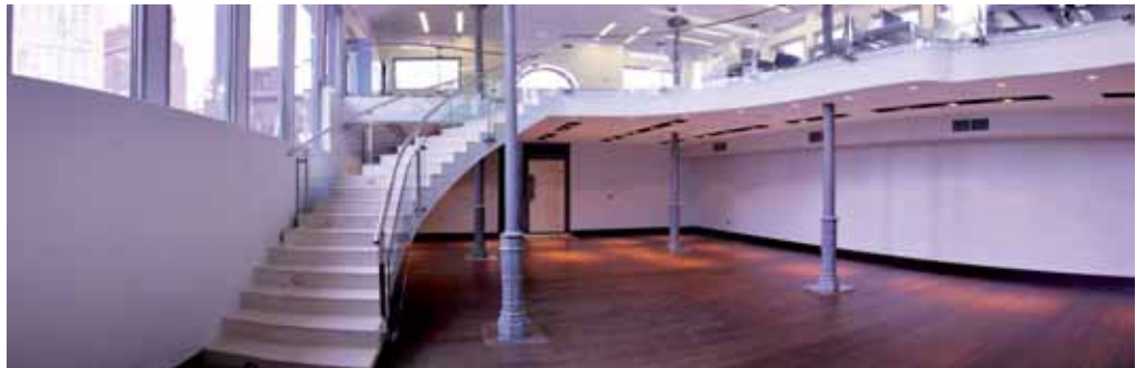
El Ayuntamiento llegó a un acuerdo con el colectivo Espacio Imagen para dinamizar y programar actividades en este centro.

dos, que estarán distribuidos en tres plantas. De esas plazas, 270 serán para residentes y 168 de rotación; distribuidas entre ambas habrá 15 plazas reservadas para personas con movilidad reducida. Asimismo, habrá 14 plazas para motos.