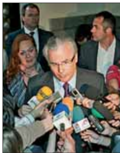
El juez Baltasar Garzón

Pese a que el comunicado de la Fiscalía no tiene carácter vinculante, los cinco vocales que debe adoptar una resolución no tiene prácticamente