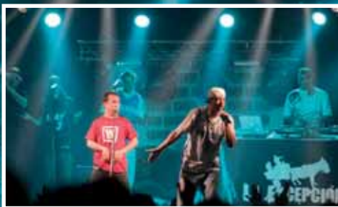
Las actuaciones de los Grupos musicales estuvieron muy animadas durante el desarrollo de la actividad.

Con el lema "Red-Voluntaria-T. Red+Voluntariado+Acción= 25 años CJC", Candinamia 2011 ha ofrecido talleres, el concurso de Graffiti y el Concurso de Maquetas Musicales, que ganó Balance de Daños.