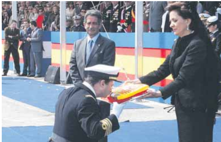
Miguel Ángel Revilla y Aurora Díaz en el momento de amadrinar al Buque de Aprovisionamiento Cantabria.

sentable que se silbara mientras se homenajeaba a los familiares de los soldados fallecidos, y Aguirre, siempre según la versión de Aurora, apeló a la libertad de expresión.