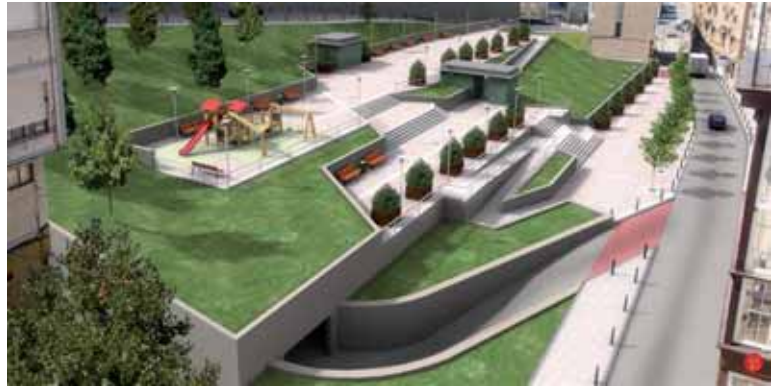
El futuro parque de 1.750 metros cuadrados tendrá zonas verdes, áreas de juegos infantiles, bancos y fuentes.