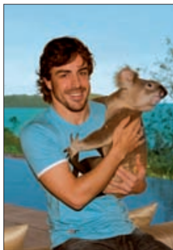
Alonso, en la isla Hamilton

Pocos días después de haber sobrepasado holgadamente los 300 kilómetros por hora en la carrera de F1 en Melbourne, Australia, el bicampeón mundial de F1, Fernando Alonso, desaceleraba hasta los 20 kilómetros por hora en Hamilton Island, la paradisíaca isla situada en la Gran Barrera de Coral, en el estado de Queensland, Australia. En un merecido descanso en el lujoso resort de Hamilton Island denominado Qualia, Alonso ha disfrutado al volante de un silencioso buggy eléctrico mientras se aventuraba por la paradisíaca is-