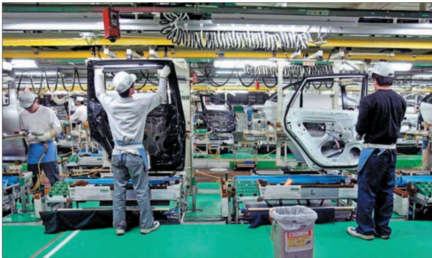
Empleados de una fábrica durante su jornada laboral que al menos es de ocho horas diarias