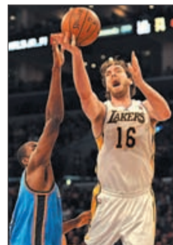
Pau Gasol, ala-pivot de los Lakers

Con mucha menos presión llegan los Memphis Grizzlies de Marc Gasol. La franquicia de Tennessee no se metía en las eliminatorias por el título desde