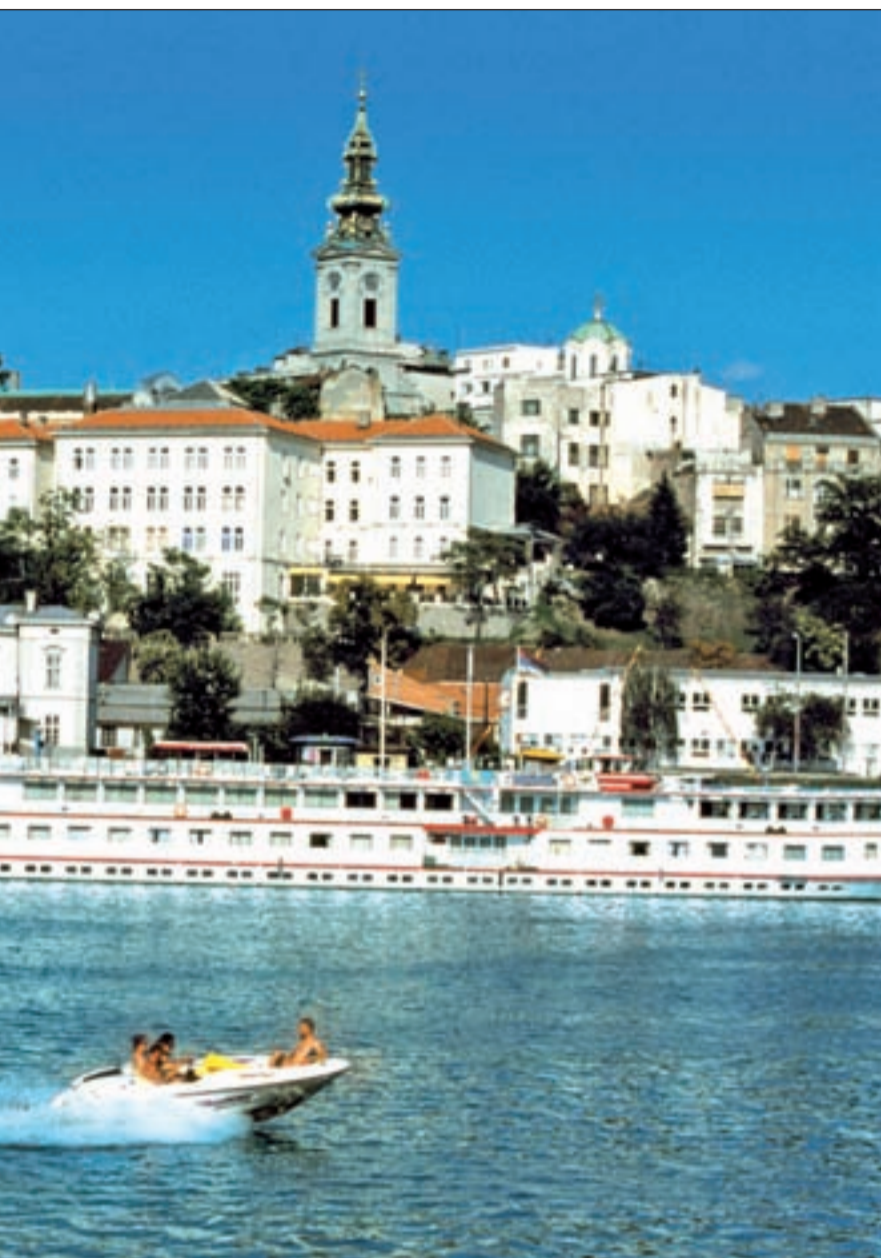
es encontrar ofertas de última hora para destinos como Serbia

suben las temperaturas. Acabamos el día en los cafés, restaurantes y clubes ubicados en las riberas de los ríos.