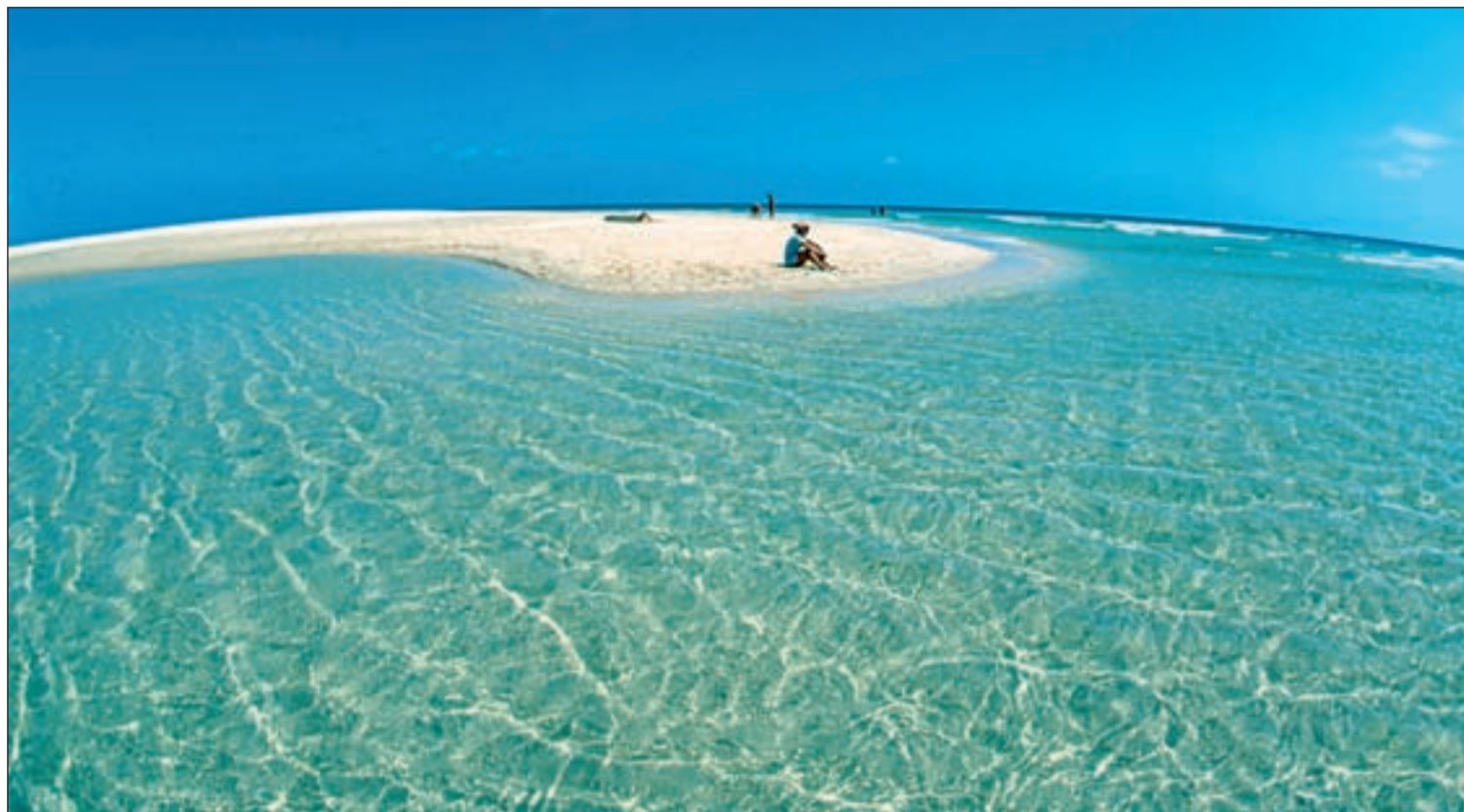
Imagen de la Playa de Jandia, en Fuerteventura