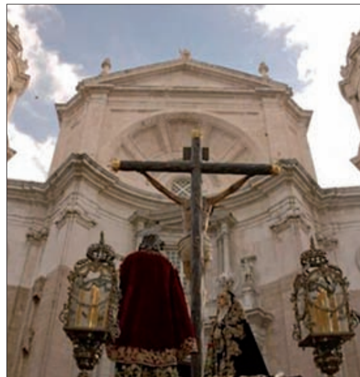
Cádiz, una Semana Santa llena de contrastes