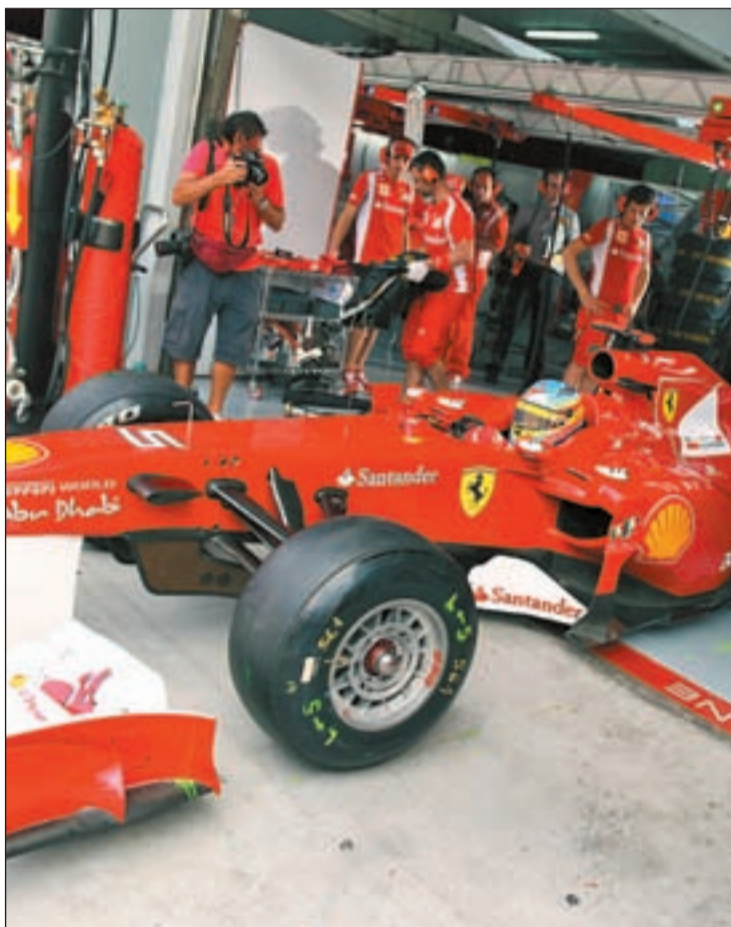
El piloto asturiano se quedó otra vez fuera del podio

La carrera de Sepang no dejó buenos resultados para Fernando Alonso, quien estuvo cerca de meterse en el podio pero que tuvo que conformarse con una sexta posición que sólo le permitió sumar ocho puntos que le dejan ya a 30 del líder de la clasificación general, el alemán Sebastian Vettel. Esa diferencia y las sensaciones negativas que rodean a Ferrari han provocado que el equipo italiano trabaje apresuradamente en el desarrollo del F150 para no dar por perdido el campeonato. De este modo, tres de los principales responsables del conjunto italiano, Stefano Domenicali incluido, viajaron esta semana hacia Italia para tratar esta crisis de resultados y buscar una solución.