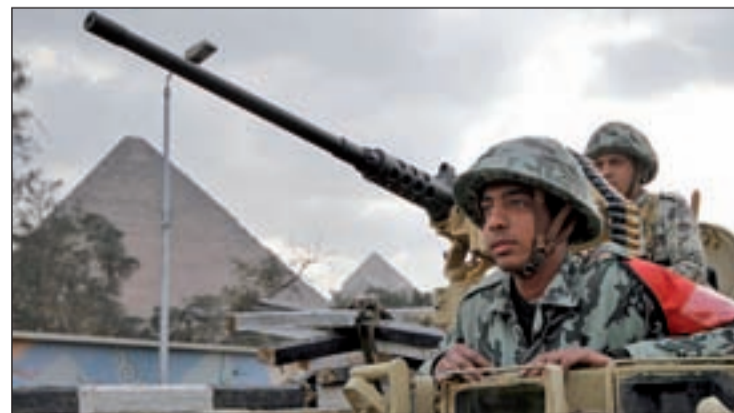
La situación de los países árabes ahuyenta a los turistas

En consecuencia, la situación de caos que se vive en los países árabes "redundará positivamente" en la industria turística española porque los turistas "no suelen" renunciar a viajar durante sus periodos vacacionales, explica Maciñeira,