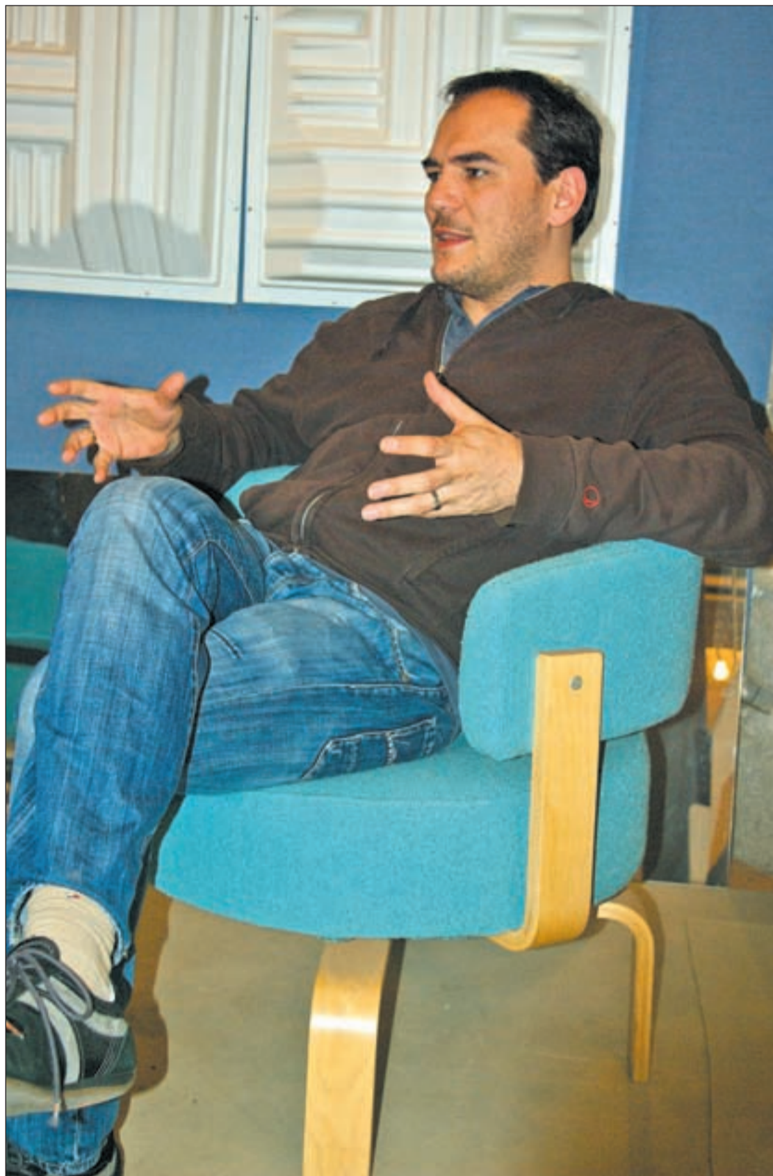
Ismael Serrano dialoga en la comodidad de su propio estudio de grabación

"Eso de la imagen del artista pleno y satisfecho, que muchos proyectan, creo que es totalmente irreal. Detrás de eso hay un complejo de inferioridad importante porque fundamentalmente los músicos tenemos miedo a la soledad. Componemos canciones porque queremos combatir nuestros miedos, y por eso también se crean personajes que no se ajustan de hecho a tu personalidad. Parecen dioses y en el fondo son personas muy frágiles. Yo tengo mis miedos, y el acuérdate de vivir me lo tengo que decir a mí mismo. En mi caso hay una llamada constante a ser consecuente, no sucumbir al desaliento y no rendirme. Sobre todo, en esto del arte, relativizar mucho los fracasos y los éxitos. En especial cuando vivimos en una sociedad exitista o que nos vende como éxito cosas que no sé hasta qué punto lo son tanto. Se puede tener un gran éxito profesional y