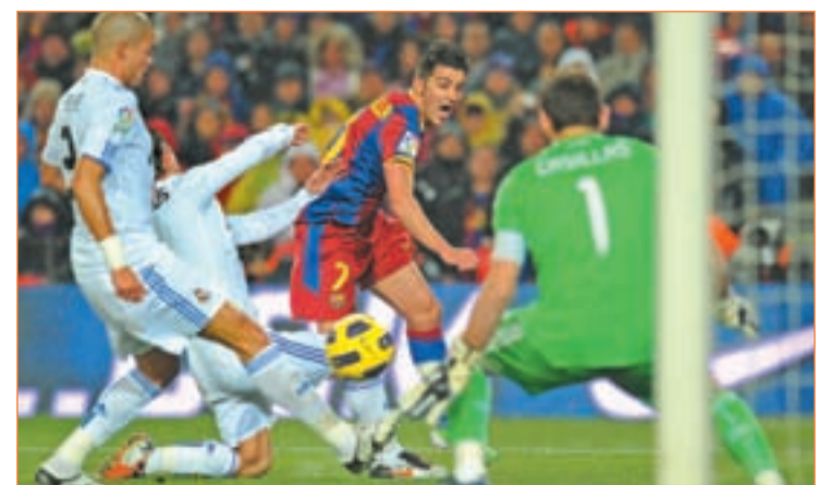
La eliminatoria podría decidirse en el Camp Nou

primera data de la temporada 60-61 con triunfo global del Barça por 4-3. Los merengues se tomaron la revancha en las dos siguientes citas. La última de ellas tuvo lugar en las semifinales de la campaña 2001-2002, con triunfo madridista por 0-2 en el Camp Nou y empate a uno en el Bernabéu, en el preludeo del que fue su noveno título.