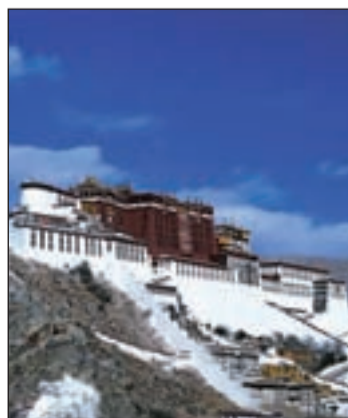
China, en los cuadernos de Lonely

con las acuarelas de Joaquín González Dorao, basándose en la tradición de los antiguos viajeros, quienes dejaron sus impresiones de viaje en forma de dibujos y apuntes. Cada libro está compuesto por más de 200 acuarelas --128 páginas--, donde aparecen comentarios del propio autor de los dibujos.