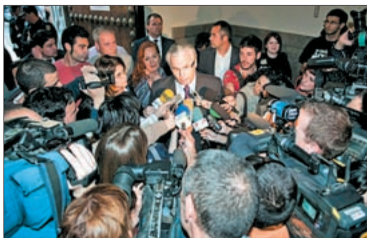
El juez Baltasar Garzón atiende a las preguntas de los medios

Mientras que el Consejo General del Poder Judicial, CGPJ, ha iniciado los trámites para decidir si suspende cautelarmente de funciones de nuevo al juez Baltasar Garzón tras abrirle el Supremo juicio oral por ordenar las escuchas del caso Gürtel, el magistrado sigue su defensa en el banquillo "convencido". Está acusado de los delitos de prevaricación y violación de las garantías constitucionales, al ordenar la grabación de las conversaciones que mantuvieron en prisión los imputados en el caso Gürtel y