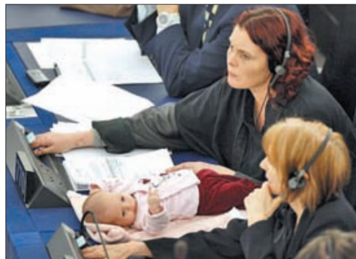
Una eurodiputada acude a un pleno con su bebé