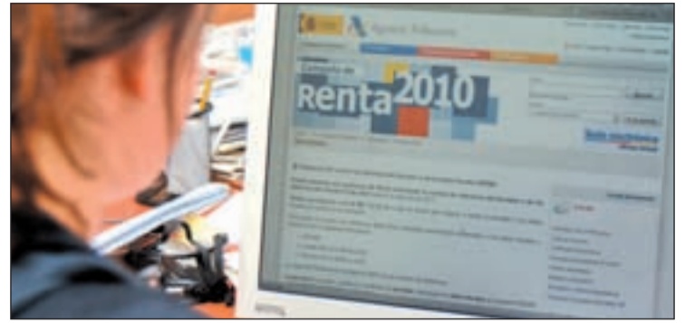
Una contribuyente consultando la web de Hacienda

Otra novedad viene dada por la deducción por obras de mejora en la vivienda. La rebaja será de un 10% sobre la cuota estatal.