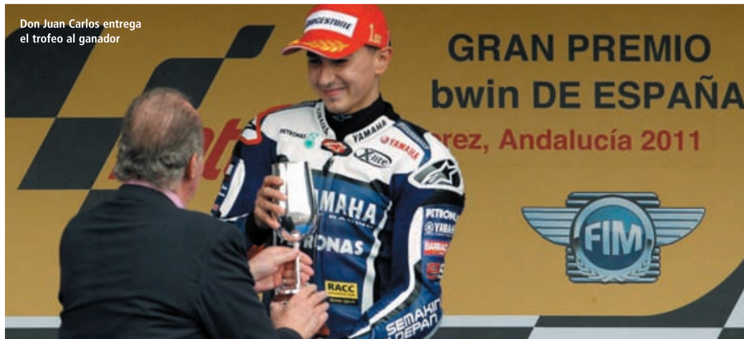
Don Juan Carlos entrega el trofeo al ganador

MOTOCICLISMO EL MALLORQUÍN APROVECHÓ LA CAÍDA DE STONER PARA COLOCARSE COMO LÍDER