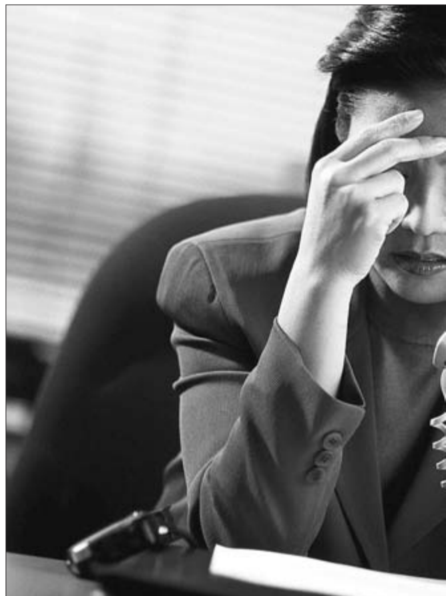
Las horas extra pueden pasar factura a la salud a medio y largo plazo

Sin embargo, los científicos dijeron que los grandes trabaja-