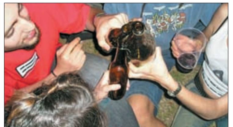
Un grupo de jóvenes bebiendo en la calle

rolina del Norte, Fulton Crews, "este es también el momento en el que los circuitos neurales en desarrollo del cerebro están más sensibles a los trastornos". Además, dice, "se ha demostrado que un cortex frontal adolescente en crecimiento es mucho más sensible al daño que un cortex frontal adulto.