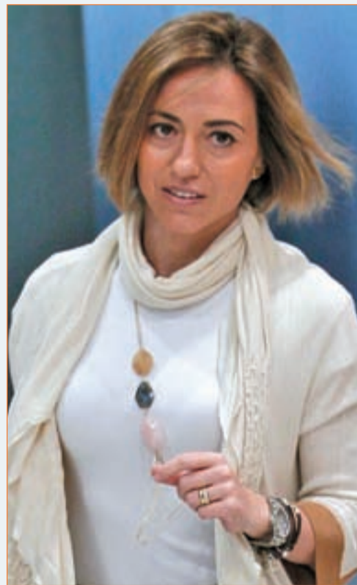
CARME CHACÓN PIQUERAS

Alfredo Pérez Rubalcaba tiene 59 años. Nació en Solares, Cantabria, el 28 de julio de 1951. Es licenciado en Ciencias Químicas por la Universidad Complutense de Madrid. Ingresó en el PSOE en el año 1974. Su primer cargo de responsabilidad llegó de la mano de Felipe González. Bajo su mandato fue ministro de Educación y Ciencia (1992-1993) y ministro de la Presidencia (1993-1996). Desde abril de 2006 es ministro del Interior. El 21 de octubre de 2010 tomó posesión como vicepresidente primero y portavoz del Gobierno. Es uno de los políticos mejor valorados. Arrastra el pasado de los últimos tiempos de González.