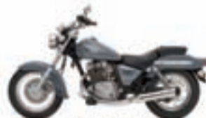
Suzuki Marauder 125. Precio anual orientativo con bonificación.

PROMOCIÓN ESPECIAL PARA LECTORES DE GENTE