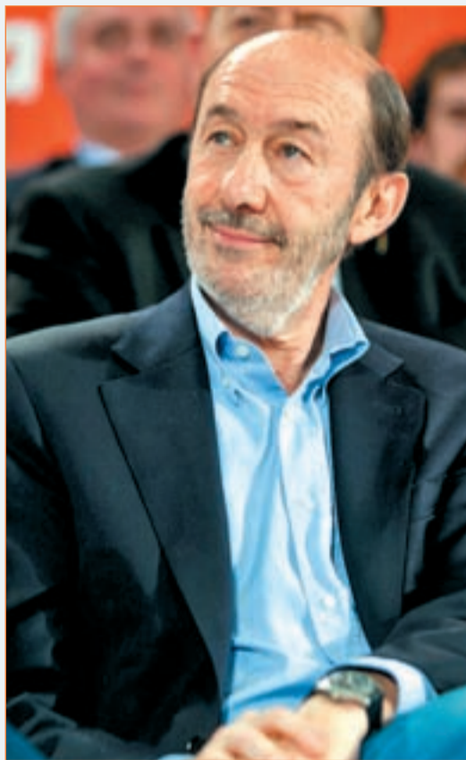
ALFREDO PÉREZ RUBALCABA