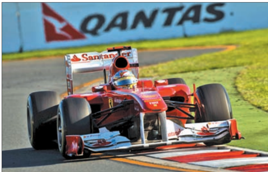
Fernando Alonso no tuvo mucha suerte en el Gran Premio de Australia