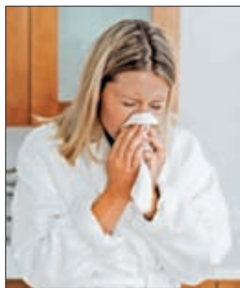
Las alergias van a más

cancen al 50 por ciento de la población". De hecho, y sólo en Sevilla, en la actualidad existen más de 300.000 pacientes alérgicos. Guardia ha advertido que esta proyección de futuro la han extraído ya "los propios epidemiólogos, basándose en modelos matemáticos de proyección de la enfermedad.