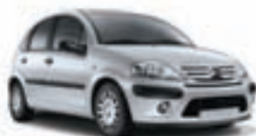
Citroën C3 1.1 AHD. Precio anual orientativo con bonificación.