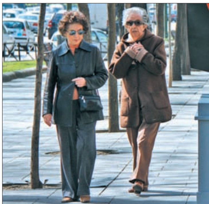
ESPERANZA DE VIDA Las mujeres españolas son las que viven más años de toda la Unión Europea (84,9 años frente a 82,4 de media) y en los hombres el promedio también supera el comunitario (88,6 frente a 83,7).

No obstante, la Comisión pronostica que tras la crisis la inmigración volverá a recuperarse, aunque a niveles muy inferiores a la etapa anterior. Ello hará que la población de España crezca un 16% de aquí a 2050, hasta si-