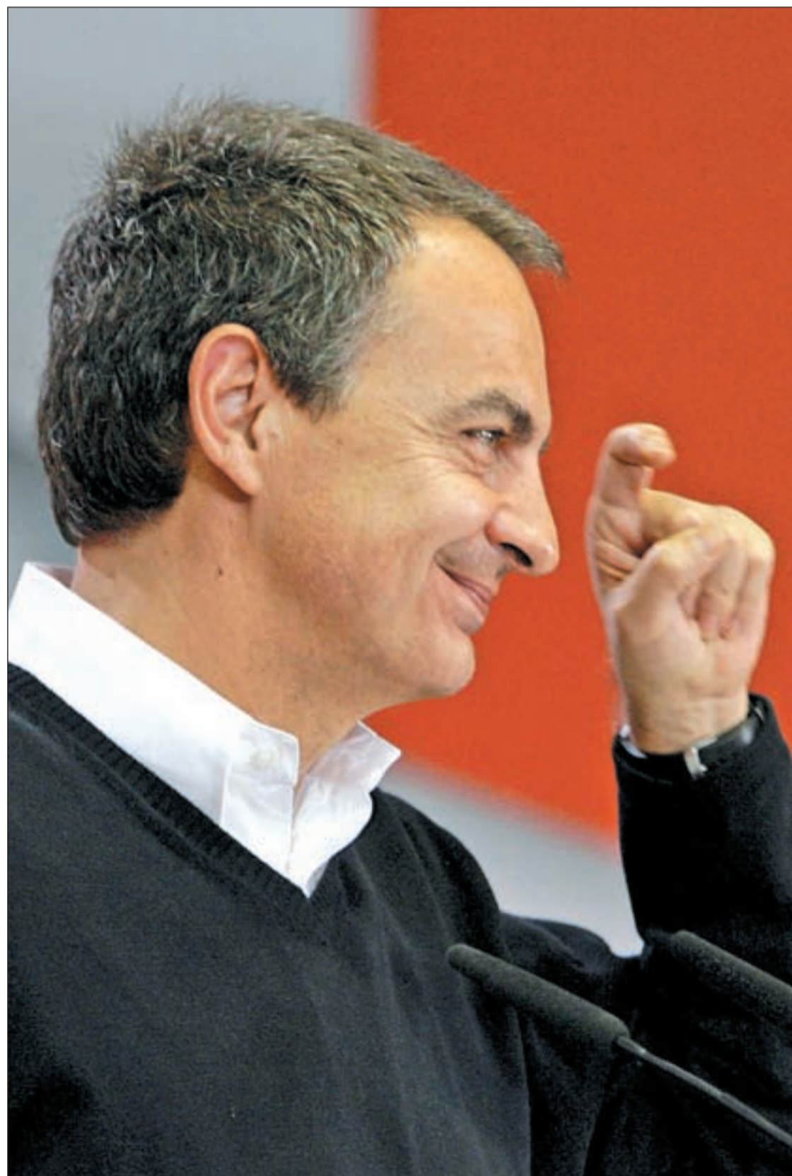
José Luis Rodríguez Zapatero, en el Congreso Federal del PSOE