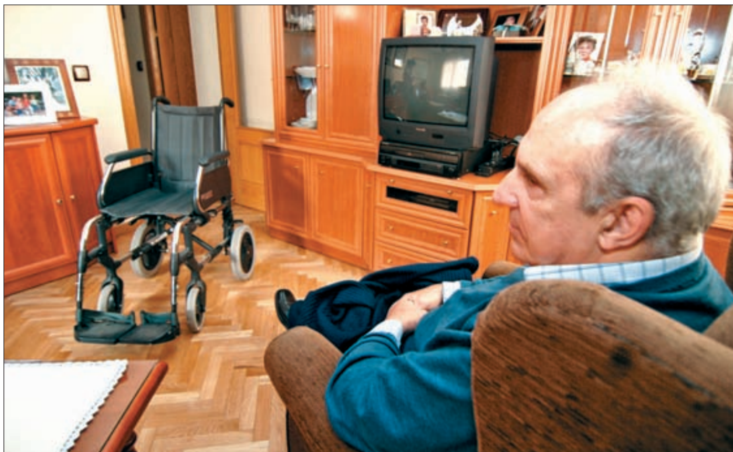
La tasa de dependencia en España rondará el 60% en 2050, según Bruselas