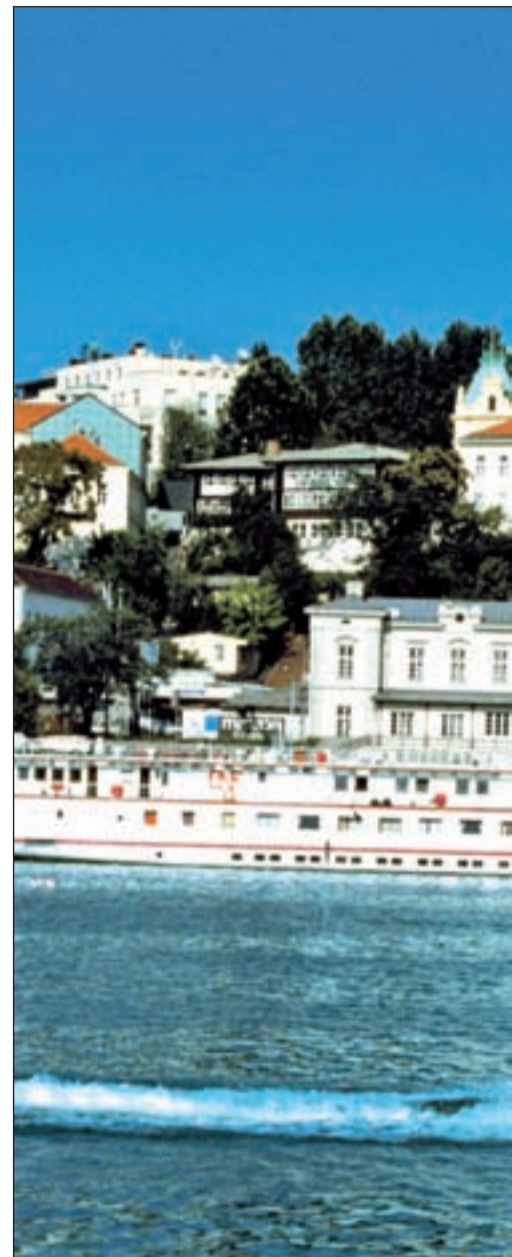
A través de las web de Last Minute o Destinia puedes...

Día 3. Desplazamiento al Parque Nacional de Fruska Gora. En este enclave montañoso podremos perdernos y practicar gran número de actividades al aire libre con una excelente relación calidad-precio. Equitación, senderismo, avistamiento de pájaros... las posibilidades son amplias. Pero este Parque es sobre todo conocido por combinar naturaleza prácticamente inalterada con un buen número de monasterios ortodoxos de entre los siglos XII y XVI. Los antiquísimos ritos de la Iglesia Ortodoxa, inalterados durante siglos, el entorno virgen de los monasterios y la belleza arquitectónica de los