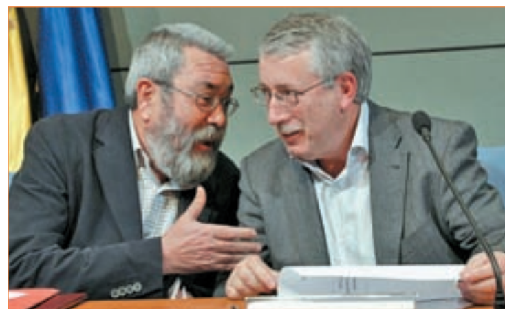
Los secretarios generales de los sindicatos CC.OO. y UGT

Por su parte, CC.OO. y UGT reconocen la necesidad de estas medidas, pero aseguran que la apertura de las negociaciones en este sentido están provocando un retraso en las conversaciones para la reforma de la negociación colectiva.