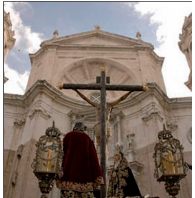
Cádiz, una Semana Santa llena de contrastes