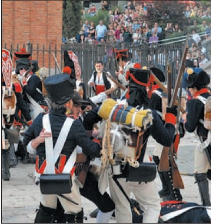
Recreación histórica de la rebelión contra los franceses

A esta macro actuación se suma el ya habitual 'Festimad 2M', que comenzó el 28 de abril y se prolongará hasta el 8 de mayo. En esta ocasión cuenta además con la incorporación de un circuito dedicado a niños y jóvenes menores de 18 años bajo el nombre SI MENOR, en el que se