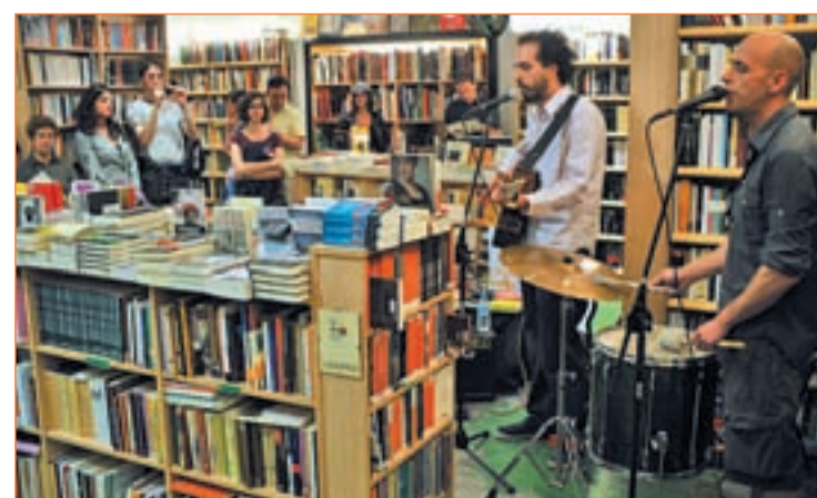
Tenedor y Miedo actuaron en el CBA este miércoles

leños a participar en la iniciativa ya que "el fútbol dura un ratito y se acaba. Pero el libro dura mucho tiempo y hay que aprovechar para disfrutar de él". La lectura de El Quijote, conciertos o exposiciones convirtieron el Círculo de Bellas Artes en uno de los epicentros de la Noche, junto a La Casa Encendida, Casa Sefarad o la Academia de Cine.