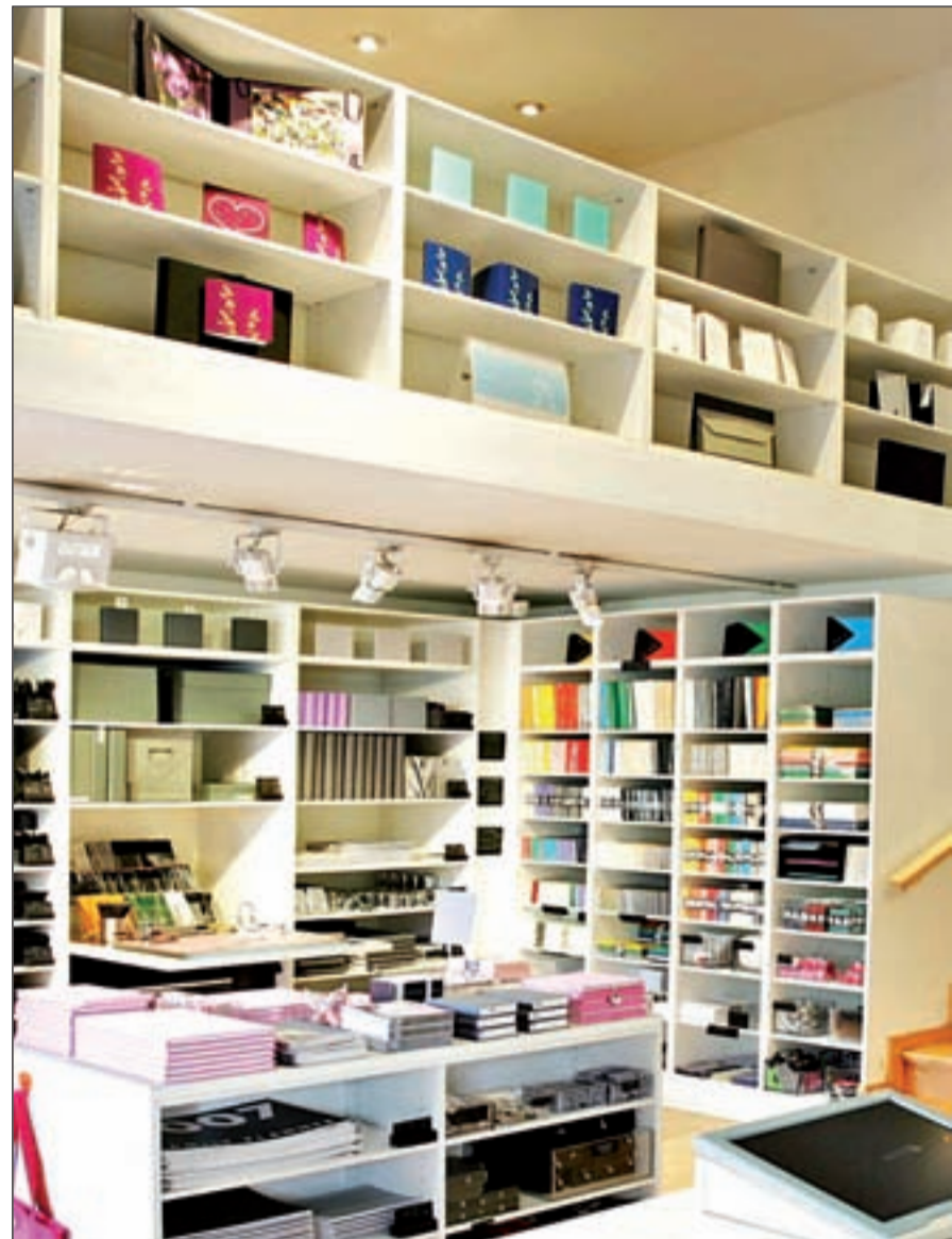
En Madrid se encuentra el 25% de las franquicias de España, según el informe de Avalmadrid

Avalmadrid pone a disposición de las franquicias y los franquiciadores productos específicos para ellos, como la línea de emprendedores, el plan para el fomento del pequeño comercio y la hostelería (FICOH) y los avales técnicos para garantizar el pago ante el arrendatario y los necesarios para el correcto desa-