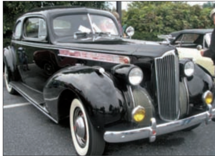
Los vecinos podrán admirar los coches de época

HORARIO Los vehículos entrarán al casco urbano por la avenida del Mar Mediterráneo y se dirigirán al