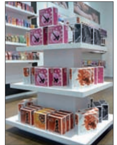
Interior de una tienda Sensualove

Además, animada por el incremento de ventas y consciente de las necesidades de los inversores, acude a esta feria presentando las mejores condiciones para abrir una tienda Sensualove. Actualmente, requiere una inversión de 45.000 euros (con canon de entrada de 12.000 euros incluido) sin variar en absoluto el concepto inicial de negocio. También pone a disposición de los nuevos franquiciados parte de la financiación así como la posibilidad de trabajar con las entidades financieras con las