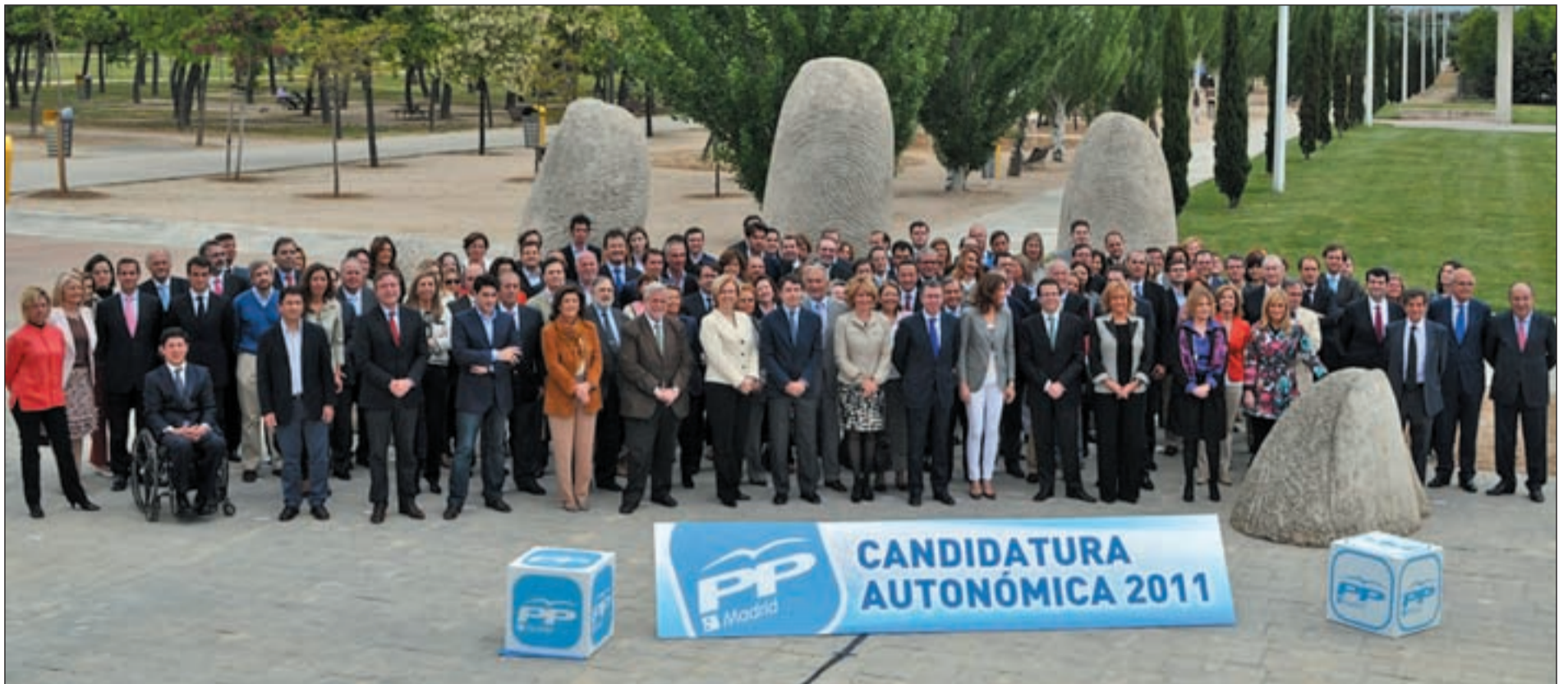
Los miembros de la candidatura popular a la Asamblea de Madrid posa en el Parque Juan Carlos I de Madrid