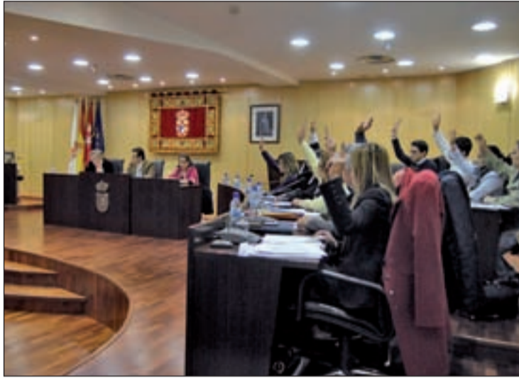
La polémica vuelve al pleno pinteño

Sin embargo, el Partido Popular respondió a este comunicado afirmando que el Tribunal de