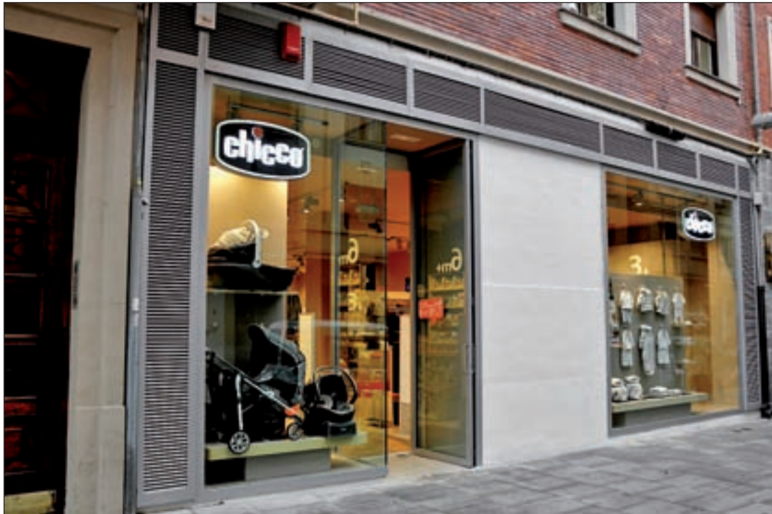
Fachada de una de las franquicias de Chicco