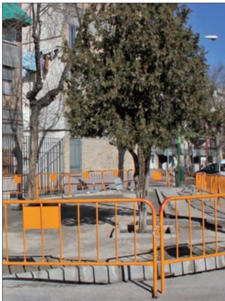
Las obras de El Nido avanzan a buen ritmo