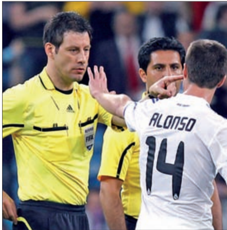
La labor del árbitro alemán Stark no gustó a los blancos

La estadística también juega en contra de los madridistas, ya que a lo largo de la historia de la Copa de Europa sólo siete equipos lograron remontar un 0-2 adverso y ninguno de ellos lo lo-