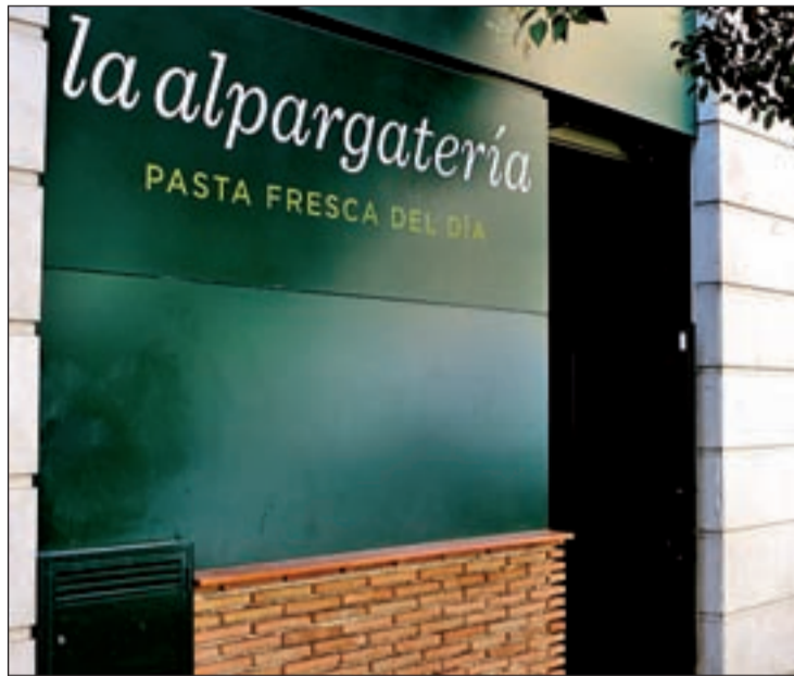
La Alpargatería comenzó su expansión en franquicia en 2010

La Alpargatería abrió su primer establecimiento en 1992 y desde entonces ha crecido hasta alcanzar los 17 establecimientos y ser un referente en la capital de la