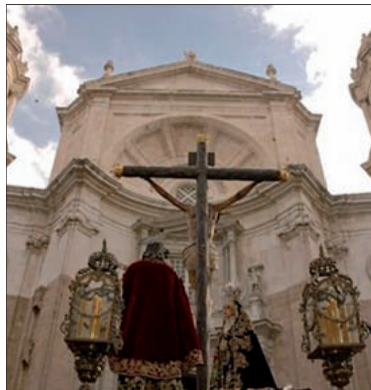
Cádiz, una Semana Santa llena de contrastes