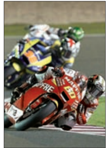
El toledano acabó sexto

Peor les van las cosas a los pilotos españoles. Para encontrar al primer clasificado de la 'Armada' hay que descender hasta la séptima posición donde se en-