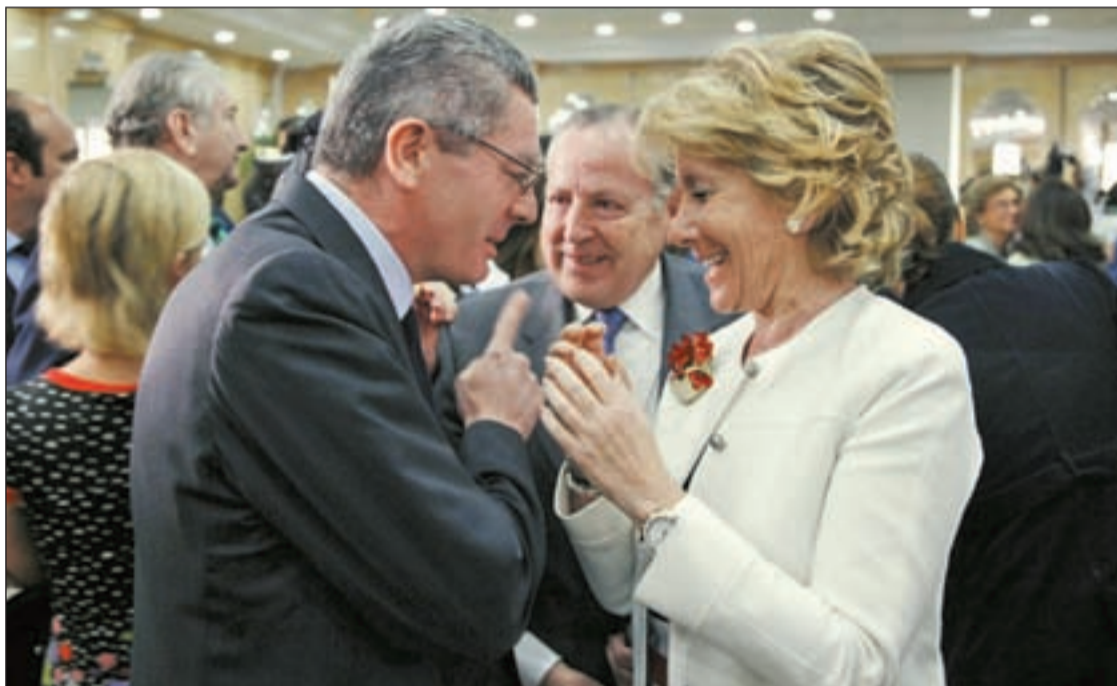
Alberto Ruiz-Gallardón y Esperanza Aguirre, en el Foro Madrid

El alcalde cree que sería la única alternativa para que la oposición gobernara · Adelanta que muchos concejales repetirán en la lista Pág.5