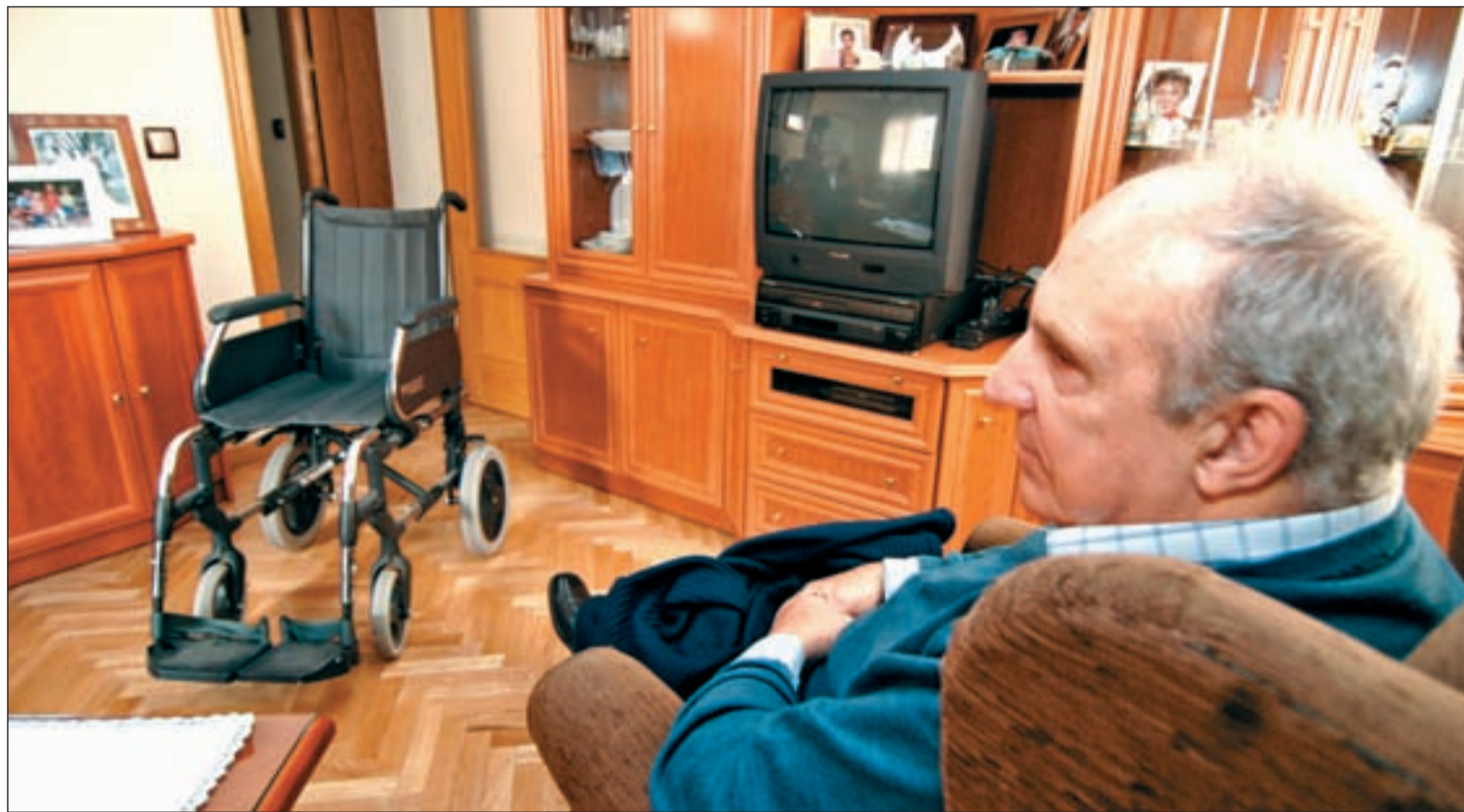
La tasa de dependencia en España rondará el 60% en 2050, según Bruselas