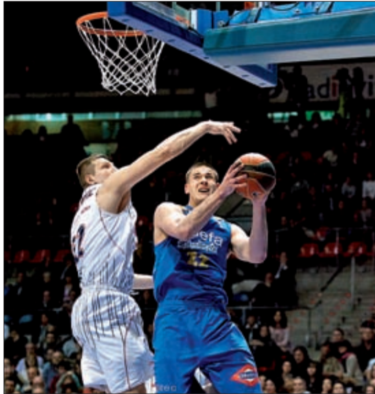
Caner-Medley durante el partido ante el Caja Laboral

Con ese tropiezo, la carrera por acabar en primer lugar la fase regular queda abierta. Regal Barcelona y Real Madrid buscarán en las seis jornadas restantes hacerse con un puesto que otorgará el privilegio de tener el factor cancha a favor en todas y cada una de las eliminatorias por el título. Por ello, el 'Clásico' de este sábado en la Caja Mágica puede ser decisivo.