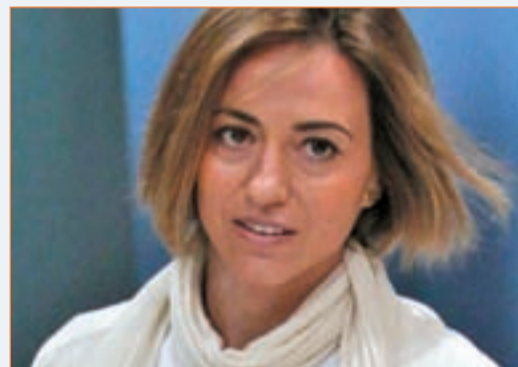
CARME CHACÓN PIQUERAS

Alfredo Pérez Rubalcaba tiene 59 años. Nació en Solares, Cantabria, el 28 de julio de 1951. Es licenciado en Ciencias Químicas por la Universidad Complutense de Madrid. Ingresó en el PSOE en el año 1974. Su primer cargo de responsabilidad llegó de la mano de Felipe González. Bajo su mandato fue ministro de Educación y Ciencia (1992-1993) y ministro de la Presidencia (1993-1996). Desde abril de 2006 es ministro del Interior. El 21 de octubre de 2010 tomó posesión como vicepresidente primero y portavoz del Gobierno. Es uno de los políticos mejor valorados. Arrastra el pasado de los últimos tiempos de González.