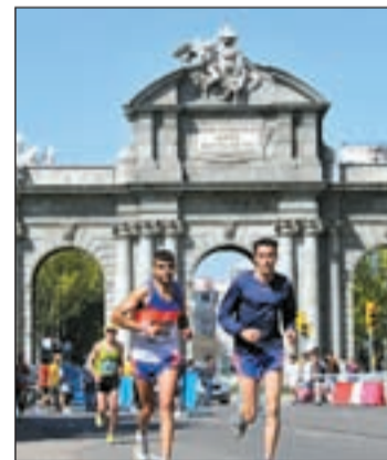
Imagen del año pasado