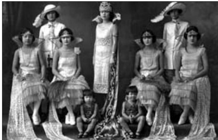
Una de las obras de Carlos Endara que se expondrá en el festival

En este sentido, la Fundación Lázaro Galdiano acogerá 'Una imagen para la memoria: la carte de visite', que reúne una colección de imágenes también de fi-