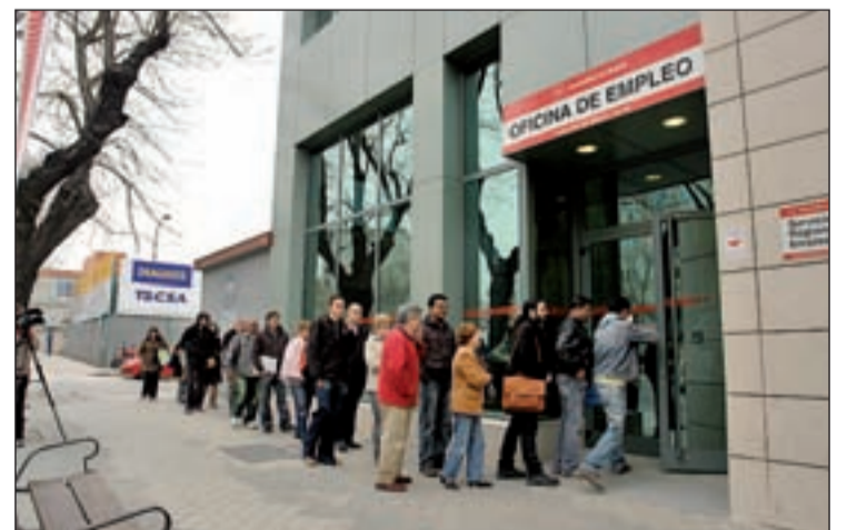
Una cola en la oficina de empleo

Por sectores, el desempleo se incrementó en los servicios (2.357), entre las personas sin