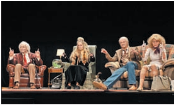
El lenguaje gestual, santo y seña de sus directores, brilla con luz propia

EL ESPECTÁCULO DE TRICICLE TRIUNFA EN EL COMPAC GRAN VÍA