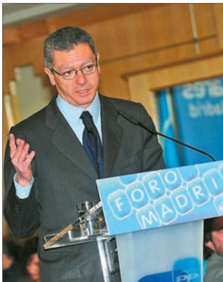
Alberto Ruiz-Gallardón, durante su discurso en el Foro Madrid

“No quiero que un nuevo zapaterismo, espoleado por Izquierda Unida, resucitado por esta for-