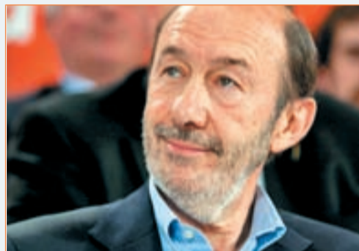
ALFREDO PÉREZ RUBALCABA