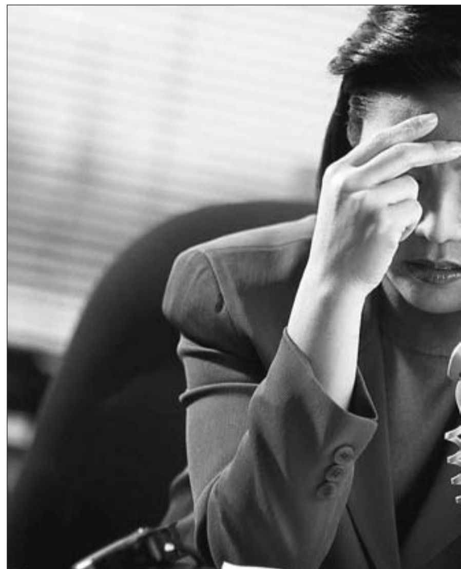
Las horas extra pueden pasar factura a la salud a medio y largo plazo

Sin embargo, los científicos dijeron que los grandes trabaja-