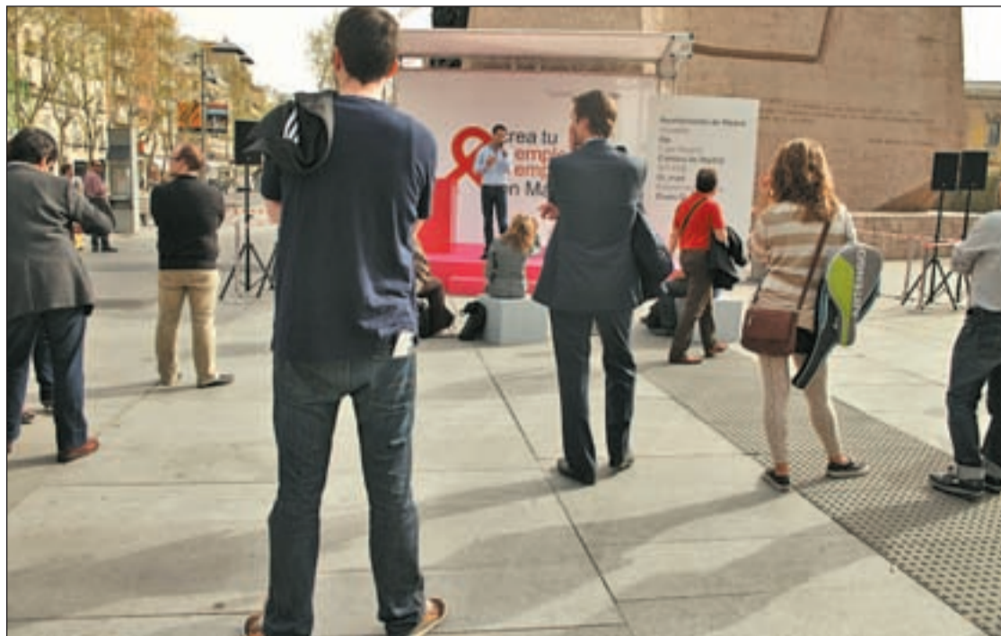
Un emprendedor explica su proyecto este miércoles en el 'Speaker's Corner' de Colón

Es quizás un resultado lógico aunque imprevisto, dado que la campaña electoral estuvo marcada por las críticas de todos los aspirantes a la anterior administración por la enorme deuda, valorada en cerca de 150 millones que tiene la institución, así como en el asalto de un grupo de estudiantes a la capilla de la Facultad de Políticas y Trabajo Social, que llevaron a un conato de enfrentamiento a la institución docente con la Comunidad.