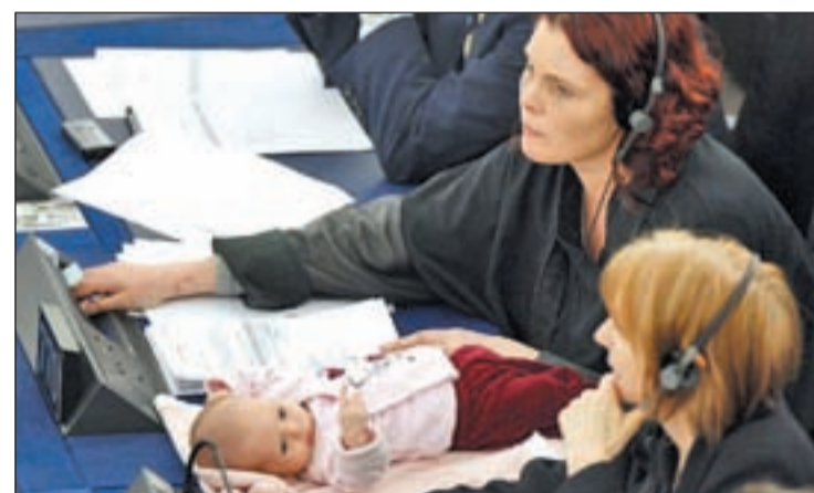
Una eurodiputada acude a un pleno con su bebé

dores no deberían alarmarse necesariamente sobre la salud de su corazón.