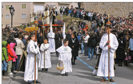
La procesión de La Estrella recorre las calles de la ciudad.

El Vía Crucis penitencial que en la madrugada del Viernes