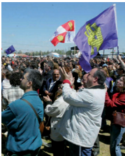
Multitud de castellano-leoneses se darán cita este año en la campa.

Por octavo año consecutivo se celebrará el Rally Fotográfico "Día de Villalar" cuyo tema versará sobre la propia celebración de la Fiesta de la Comunidad Autónoma de Castilla y León en la Villalar de los Comuneros. La inscripción será gratuita y se realizará en la Casa de la Fundación Villalar-Castilla y León el día 25 de abril de 10:00 a 20:00 horas.