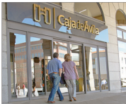
Una pareja entra en la sede central de Caja de Ávila.

Un "compromiso" con esta Comunidad, que Rato ha garantizado que continuará tanto en la financiación de la economía real y las familias castellano-leonesas, como en los proyectos sociales. Como ejemplo ha citado los 25 millones que en los últimos tres años ha destinado Caja de Ávila a la atención social. En 2010, la obra social de esta entidad ha permitido