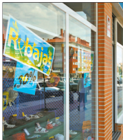
El fin de las rebajas y los carburantes han elevado el IPC, según la UCE.

En relación con los alimentos, se mantiene, según el Instituto Nacional de Estadística, una connotación en los precios,