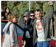
Troitiño a su salida de prisión tras permanecer excarcelado 31 años

El miembro de ETA, Antonio Troitiño, condenado a más de 2.200 años de cárcel por más