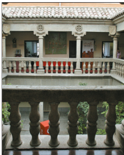
Patio interior de la Cámara de Comercio e Industria.

Además, en el apartado de infraestructuras, piden la construcción y puesta en funcionamiento de las autovías Ávila-Adanero-A6 y Ávila-Maqueda, así como la eliminación del peaje de la AP-51 y avanzar en la implantación y modernización del transporte interurbano de la provincia y la región de esta con otras Comunidades limítrofes.