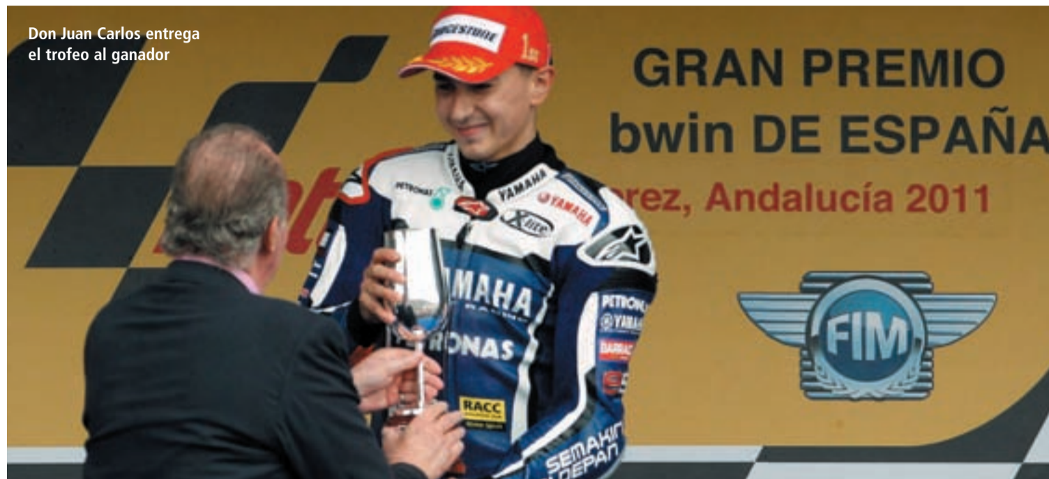
Don Juan Carlos entrega el trofeo al ganador

MOTOCICLISMO EL MALLORQUÍN APROVECHÓ LA CAÍDA DE STONER PARA COLOCARSE COMO LÍDER