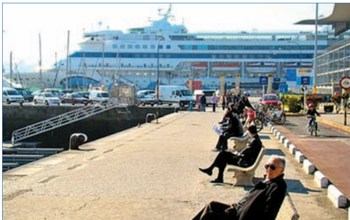
PUERTO A CORUÑA