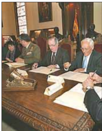
Convenio firmado este martes.