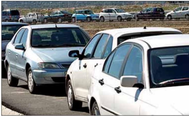
Los expertos recomiendan comparar precios antes de renovar el seguro.