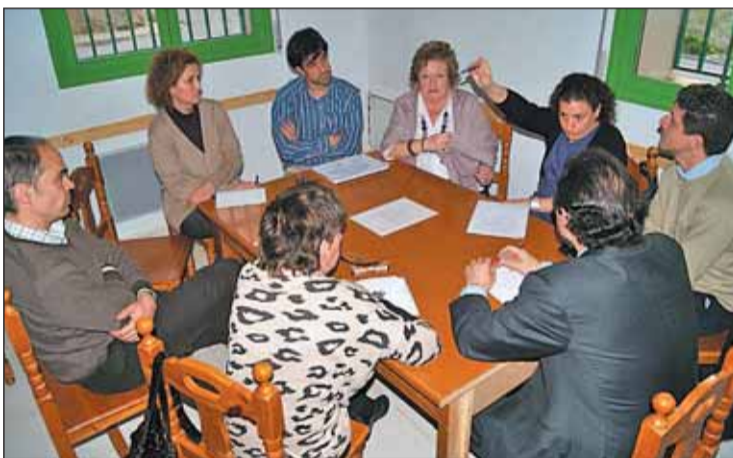
Reunión mantenida entre los vecinos y el candidato socialista.

nueva normativa se elimina la obligatoriedad de presentar listas del tipo cremallera, en las que se alternen hombres y mujeres, sino que establece la proporción mínima del cuarenta por ciento en cada tramo de cinco puestos.