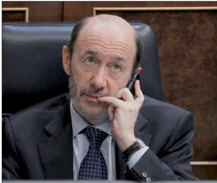
Alfredo Pérez Rubalcaba en el Congreso

La publicación de las actas de las reuniones que mantuvo ETA con el Gobierno, en el marco de la negociación hacia el proceso de paz y escritas por la banda terrorista, ha levantado un verdadero tsunami político en el último ataque del PP hacia el Ejecutivo, con especial virulencia hacia el ministro de Interior, Alfredo Pérez Rubalcaba. En el Congreso los populares pedían la comparecencia especial de Rubalcaba para dar explicaciones sobre la continuidad de las conversaciones tras el atentado de la T4 de Barajas, así como exigían su dimisión o su cese. En la otra bancada, el PSOE criticaba el uso partidista y electoralista de la lucha anti-