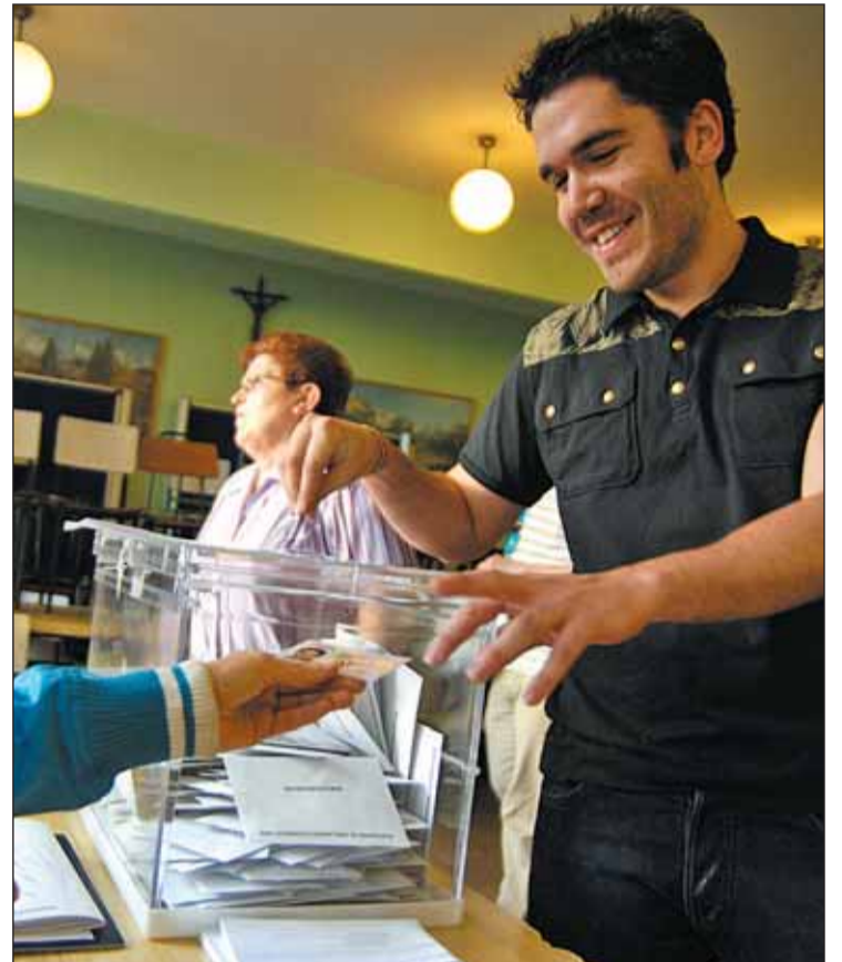
Las votaciones se llevarán a cabo el domingo, 22 de mayo de 9 a 20 h.

La nueva Ley Electoral contempla que todos los municipios de más de 3.000 habitantes deberán contar con listas parita-