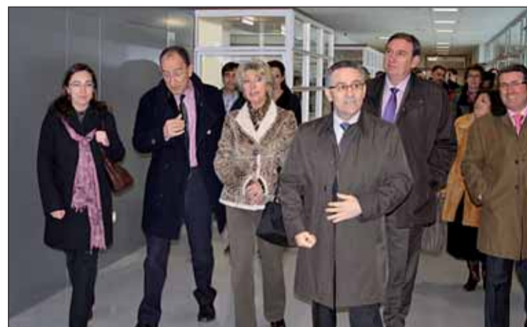
Los alumnos estrenarán las instalaciones para el curso 2011-12.

A finales de mayo de 2009 la finalización de las obras del Cen-