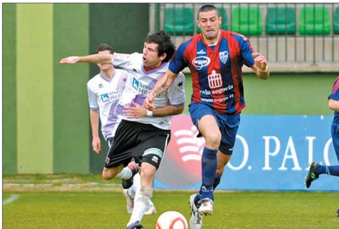
La Gimnástica sufrió para superar el cierre en defensa del Numancia en el estadio de La Albuera.