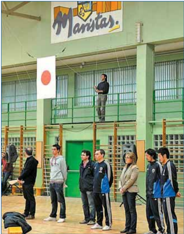
El desastre de Japón ha estado presente en pruebas deportivas y colegios...

pasado más cosas esta semana al margen de las procesiones de políticos que nos van preparando para las de Semana Santa , reproducidas hasta el infinito en cada pueblo y ciudad y anunciadas por los alegres (he oído otros calificativos) pitidos, desafinados a menudo, será porque están de ensayo, de las "bandas" que acompañarán a los pasos en cada barrio y experimentan en las calles cada día, ¡sin falta!... Me toca llorar los recortes de Titirimundi que llevan a abandonar el proyecto Titiricole ... ¿No fue el año pasado cuando esa actividad se complicó en el Juan Bravo ? Diré a los de redacción que pregunten. A ver, que estoy ingenioso: No me ha dejado a medias la Media ( ) porque fue todo un éxito. Este año hasta he corrido, aunque cuando