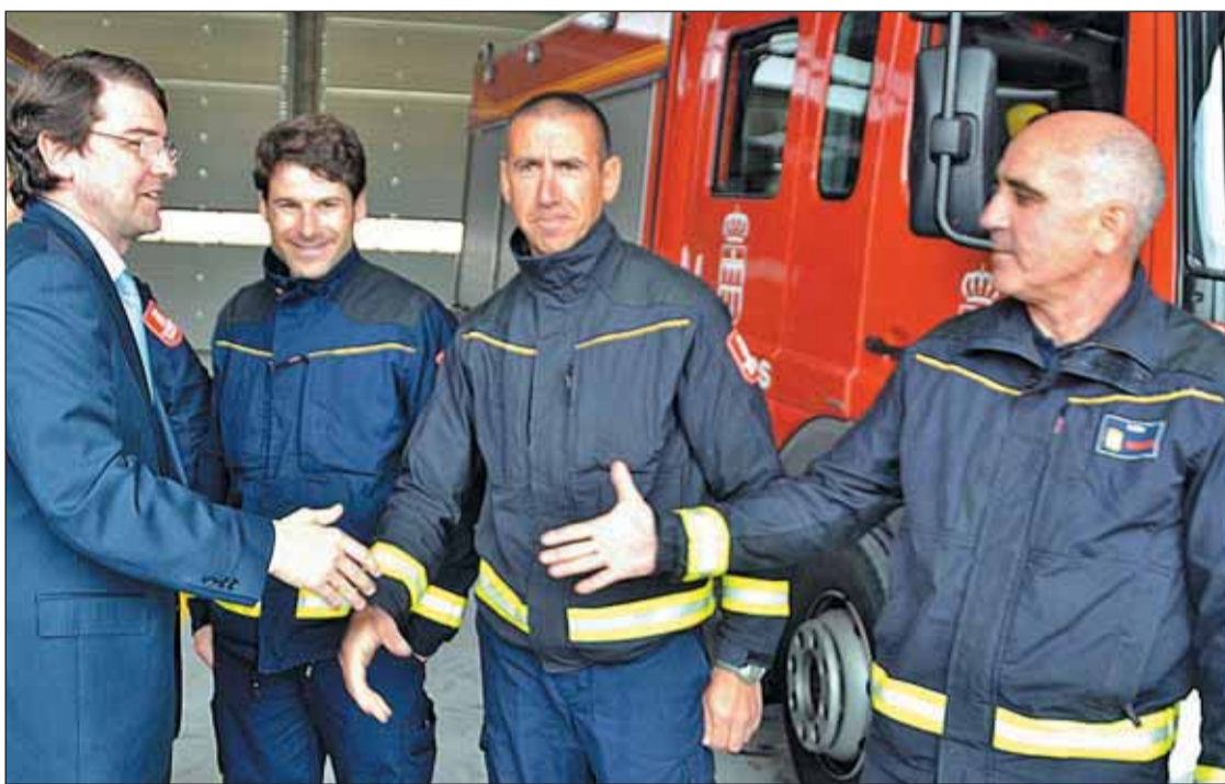
La subfase 1 de la primera fase ha costado dos millones de euros financiados por Junta y Ayuntamiento.

Las instalaciones entrarán en funcionamiento a mediados del mes de mayo, según los plazos estimados por el Consistorio. El actual Parque de Bomberos lleva más de 40 años en la avenida de Padre Claret, cuando en 1967 lo inauguraba el entonces