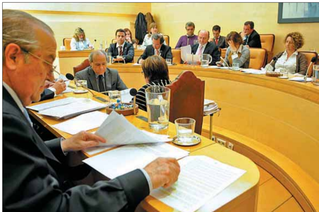
El pleno municipal de este jueves dio luz verde al documento del parking del Salón que se llevará a la Unesco.