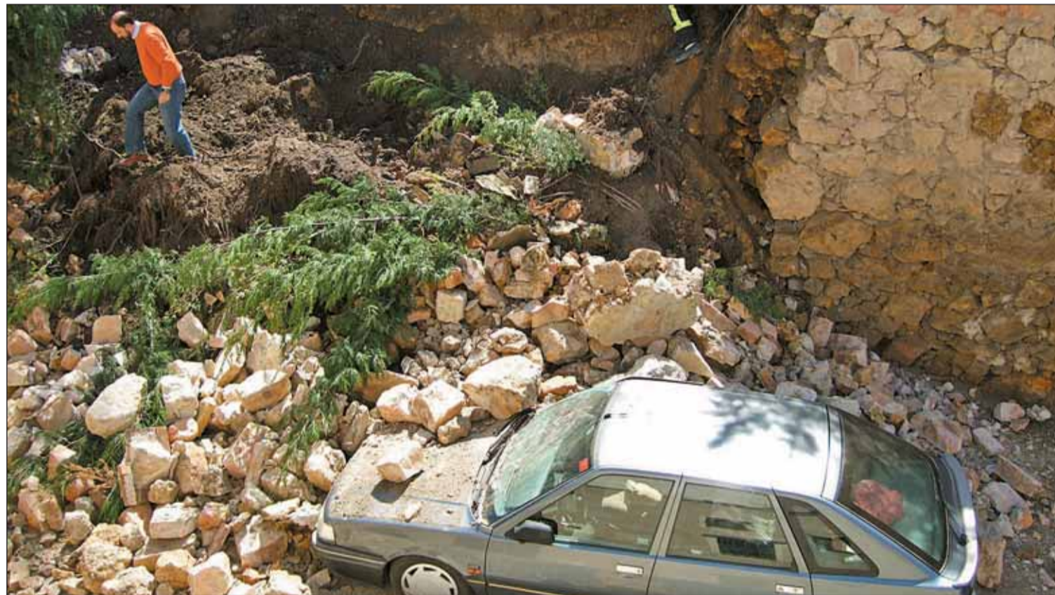
El jefe de los bomberos de Segovia examina la zona con el coche afectado por el suceso en primer plano de la imagen.

Varios kilos de piedra cayeron a la vía pública este jueves, procedentes de la valla que cierra la finca de la iglesia de San Pedro de los Picos. El Ayuntamiento cortó al tráfico la zona para retirar las rocas Pág. 3