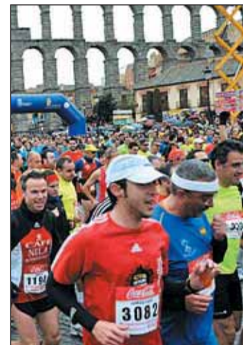
De nuevo, récord de participantes.

Tras la entrega de los premios en las distintas categorías