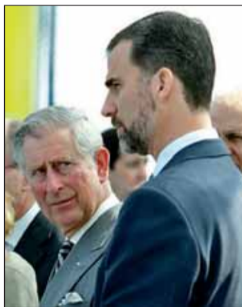
El príncipe Carlos de Inglaterra

El presidente del Gobierno y la oposición no han eludido comentar el brindis del príncipe Felipe ante Carlos de Inglaterra. El príncipe de Asturias aprovechó su discurso tras la cena de gala ofrecida al heredero de la corona británica y su mujer Camilla Parker Bowles en el Palacio del Pardo, para poner sobre la mesa uno de los puntos más espinosos de las relaciones entre ambos estados: Gibraltar. Don Felipe demandó que "nuestras autoridades avan-