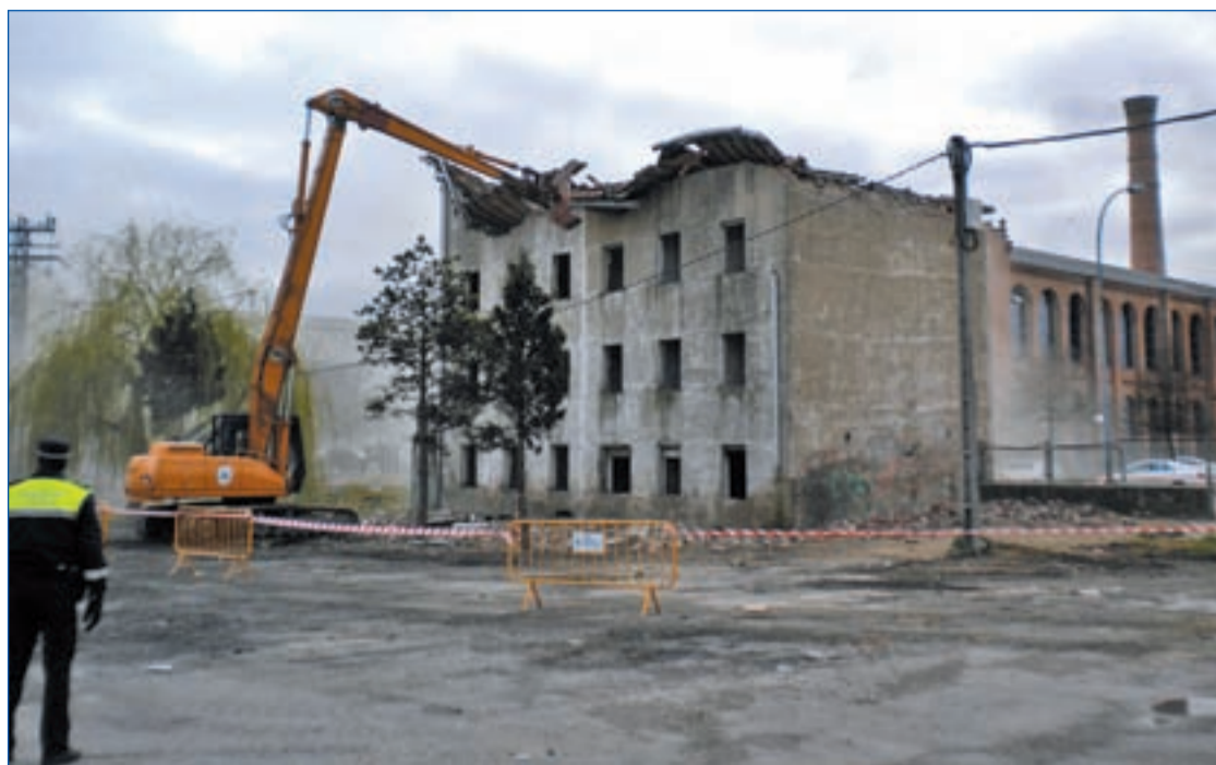
AYUNTAMIENTO DE VITORIA

En el conjunto de España, en tanto, la cifra de negocios del sector experimentó un incremento del 1,9% en los últimos doce meses aunque, en cambio, la ocupación descendió en promedio un 0,4%.