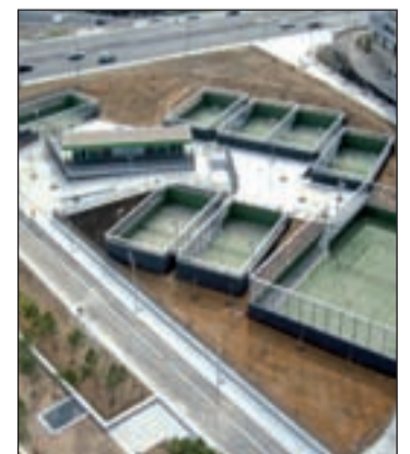
Un gran polideportivo al aire libre

un campo de fútbol 11, dos canchas de baloncesto, dos pistas para patinaje en línea y skate y un canal de remo para practicar piragüismo deportivo. En definitiva, un lugar perfecto no sólo para pasear o montar un bici, sino para practicar una gran variedad de deportes en pleno centro de Madrid.