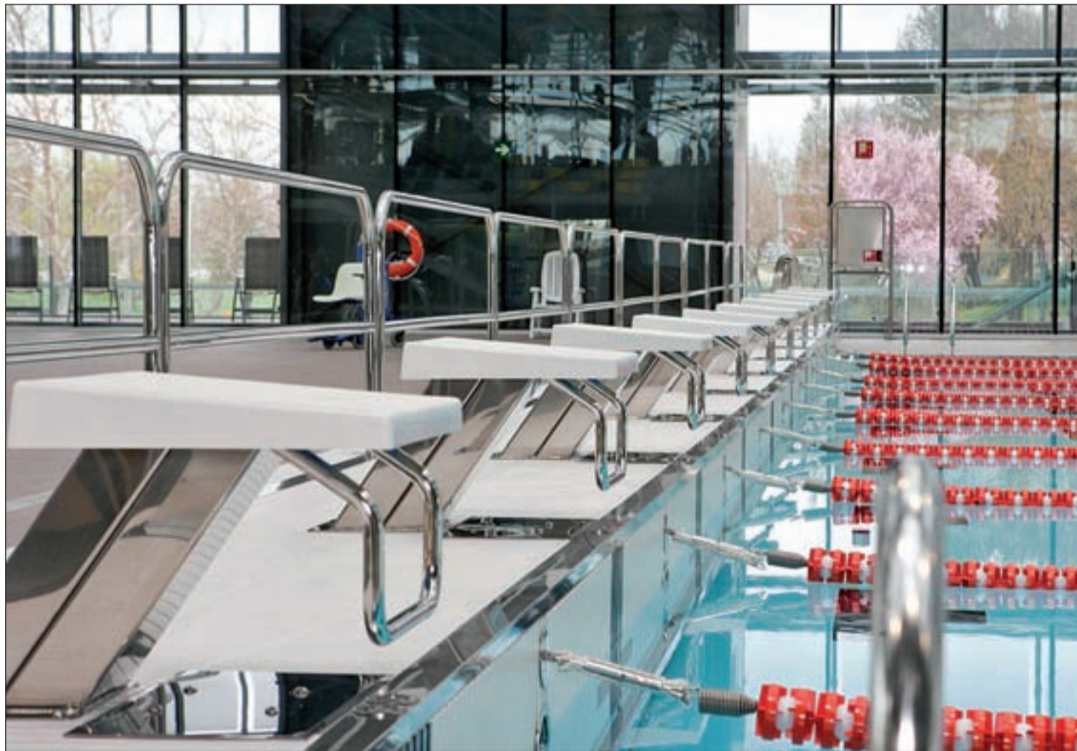
Trampolines y calles de uno de los vasos de las piscinas de Mendizorrotza

Tras dos años de retraso en la entrega de la instalación, el Ayuntamiento presenta la dotación deportiva de Mendizorrotza que cuenta con dos vasos y una zona de relax acuático Pág. 4