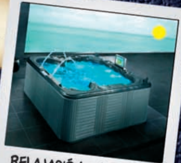
RELAJACIÓN EN UN SPA A partir de 60 euros

El SPA y sus múltiples variantes es un regalo perfecto para aquellos padres que quieren relajarse y huir momentáneamente de las tensiones del día a día. Regálale un tratamiento anti stress que le dejará como nuevo.