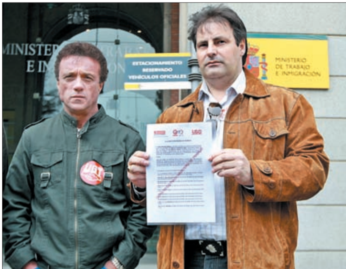
Representantes sindicales con su convocatoria de huelga

Los días marcados con los paros coinciden con temporadas de especial tráfico en los aeropuertos, ya que además de abarcar el periodo de vacaciones de Semana Santa incluyen varias festividades regionales, como en el caso del 25 de abril (fiesta en Baleares, Valencia, Euskadi, Aragón, Castilla y León, La Rioja, Cataluña y Navarra); el 13 de junio en Cataluña; el 23 de junio en Madrid y Castilla-La Mancha o el 15 de agosto, festivo en me-