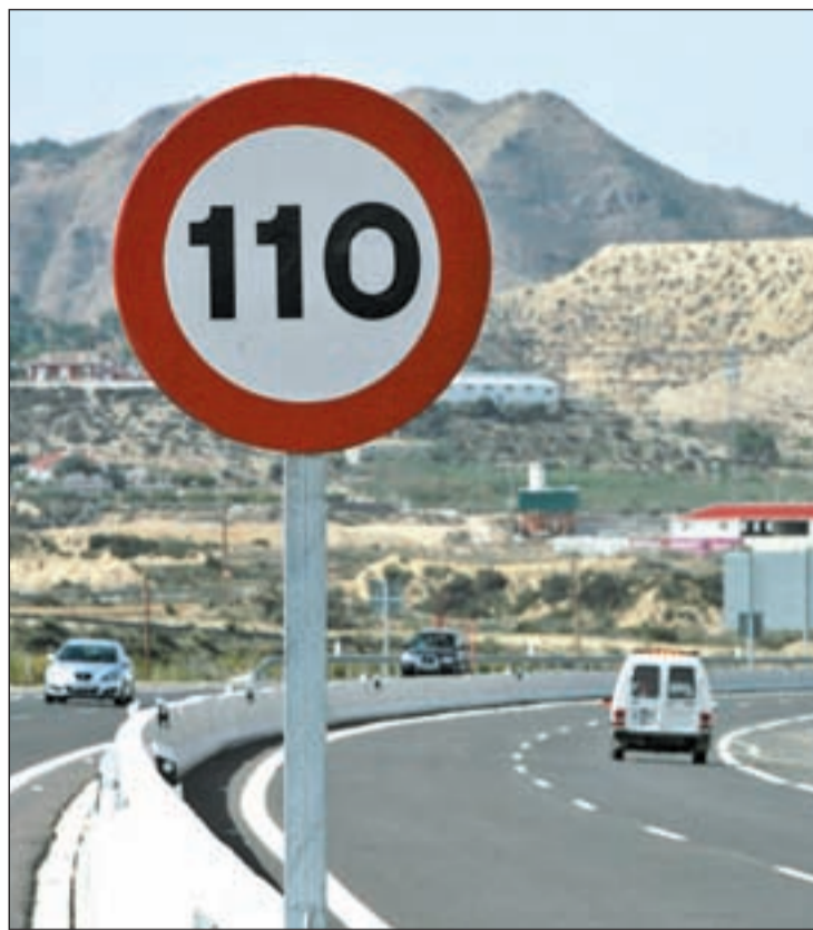
Las nuevas señales ya están instaladas en las autovías y autopistas

Sin embargo, esta limitación ha ganado detractores a gran velocidad. Entre ellos, el PP que, en palabras de De Cospedal, ha tachado la medida como otra más de "las 110 improvisaciones que el Gobierno tiene a la hora" y la relaciona con fines recaudato-