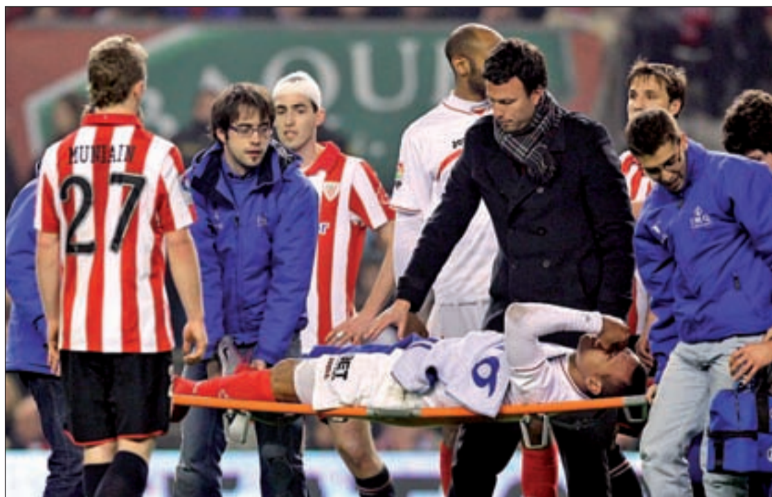
Luis Fabiano tuvo más suerte y estará alrededor de seis semanas fuera de los terrenos de juego EFE