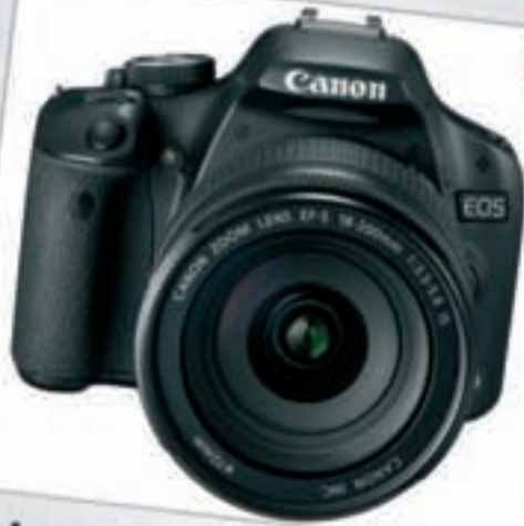
UNA CÁMARA REFLEX A partir de 600 euros

Esta estupenda Reflex de Canon que cubre todas las expectativas de los aficionados al mundo de la fotografía digital. Capaz de grabar vídeo, la Canon EOS 5000 destaca por su ligereza y su reducido tamaño que la hacen ideal para el paso de una cámara compacta a una reflex.