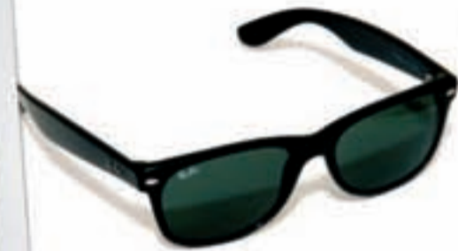
UNAS WAYFARER Unos 110 euros aprox.

Este modelo clásico de Ray-Ban ha sido el modelo de gafas más vendido e imitado de la historia.