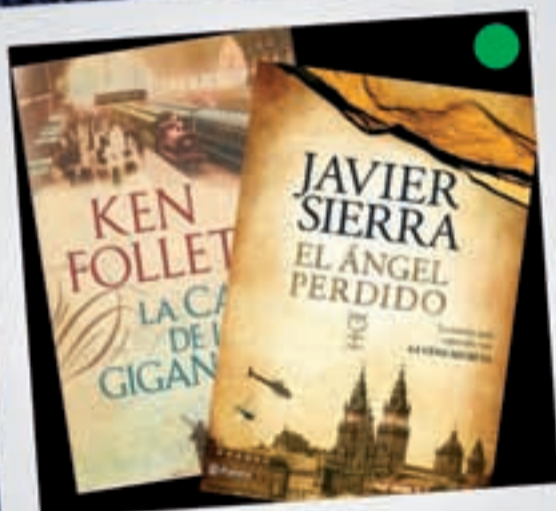
UN LIBRO Menos de 30 euros

Regálale un buen GPS y conseguirás que dejen de dar vueltas por la ciudad.