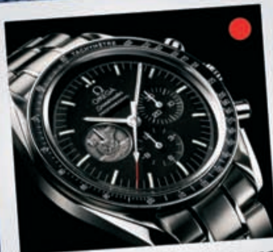
UN OMEGA SPEEDMASTER Desde 2.400 euros