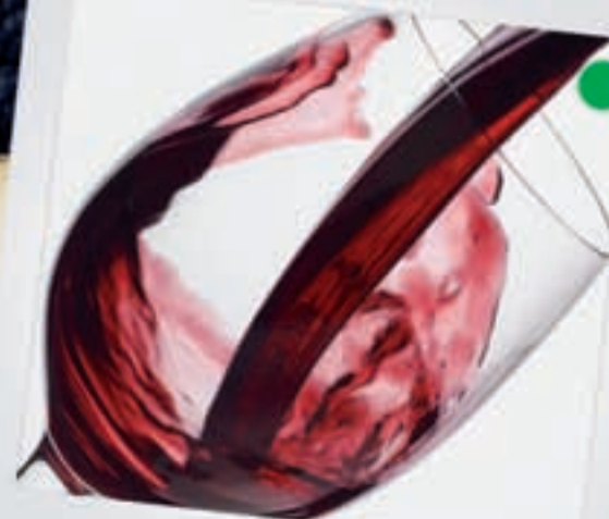
CATA DE VINOS A partir de 50 euros

Una introducción al mundo del vino, de la mano de los más prestigiosos profesores. Enseñarán a disfrutar del vino en todos sus matices, aroma, color, gusto... y los alimentos con los que mejor combina cada caldo.