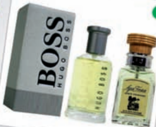
UNA COLONIA Menos de 30 euros

Das opciones, por un lado una colonia para utilizar a diario. Suave, fresca, pero con carácter: Agua Fresca de Adolfo Domínguez. Por otro lado, la colonia más emblemática de Hugo Boss, Boss Bottled. Toda la personalidad de la fragancia de Hugo Boss en el formato más reconocido.