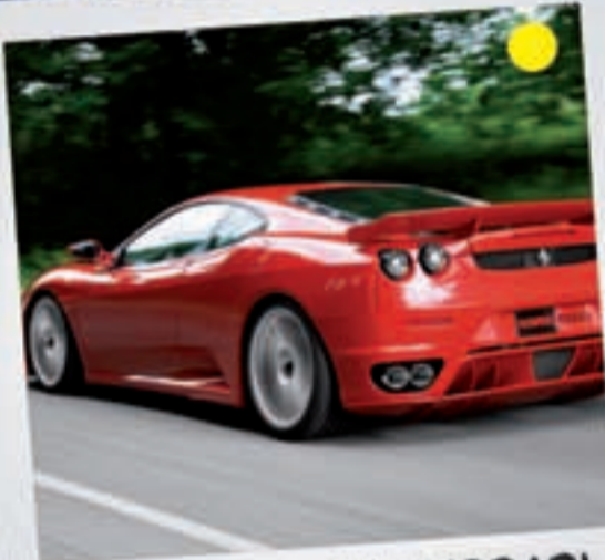
CONDUCIR UN FERRARI Desde 100 euros

Unas entradas o incluso una excusa perfecta para una familia de un día. Puedes consultar el ocio a través de especializadas. Entradas.com,