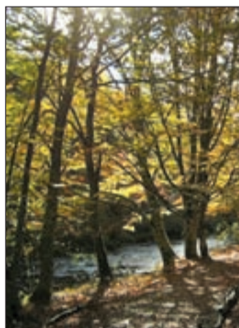
Uno de los bosques españoles

Igualmente, el citado estudio alerta de los riesgos que sufrirán especies animales, sobre todo los vertebrados. Tras analizar 292 tipos de estos animales terrestres, las predicciones científicas