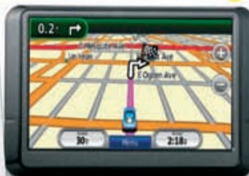
UN GPS para el COCHE A partir de 90 euros

Legendario reloj que utilizan los integrantes de la mayoría de las misiones especiales desde la década de los 60.