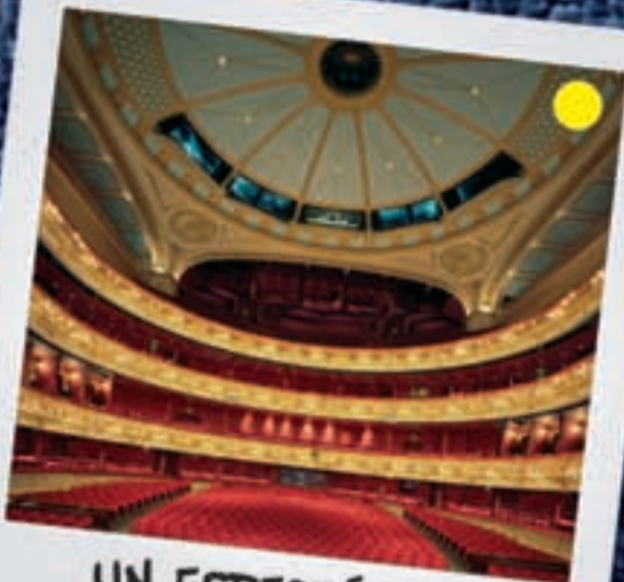
UN ESPECTÁCULO A partir de 30 euros