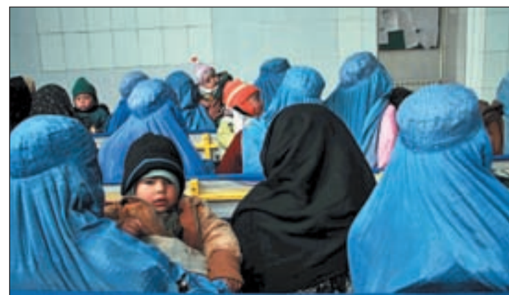
Burkas en Afganistán, único país donde esta prenda es habitual