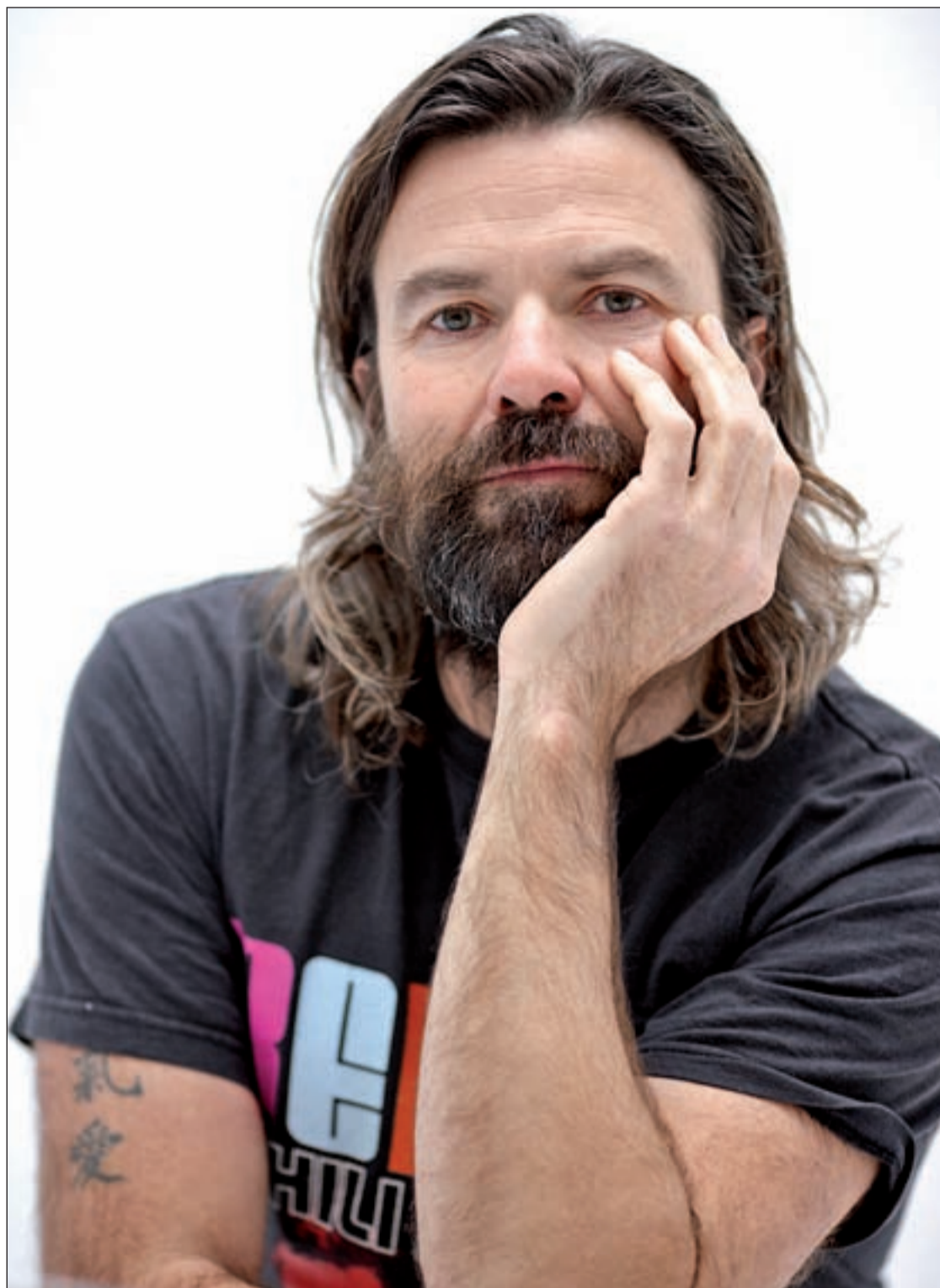
Pau Donés editó el disco por su sello, Tronco Records, donde "las ideas pesan más que el negocio"

En una época en la que la industria discográfica tal como se conocía parece un espécimen en extinción, Jarabe de Palo decidió tomar el camino contrario a la lógica de mercado y fundar Tronco Records, abandonando el paraguas de los sellos multinacionales. "Queríamos ser independientes para conservar nuestro trabajo potenciando la creatividad y las ideas, que es lo que nosotros estamos ofreciendo. Hacemos discos cuando ya no se venden discos, además cuidando el libreto, el contenido. Nos gusta lo que hacemos y lo queremos hacer bien", resume. ¿Entonces Tronco Records es una trinchera de libertad, un acto de resistencia romántica? Donés invierte la ecuación e in-