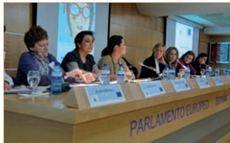
Mesa redonda de personalidad en la sede la UE en Madrid

que son mayoría las mujeres en empleos a media jornada o temporales lo que sustenta la brecha salarial y propicia el empobrecimiento mayor de las mujeres en comparativa con los hombres. La UE ha definido una estrategia de igualdad de género que determinará las acciones de la Comisión Europea en cinco áreas clave entre 2010 y 2015.