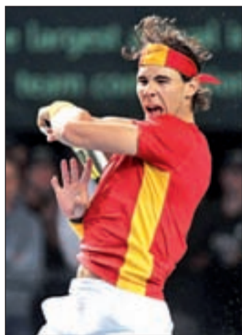
Nadal reapareció en Bélgica

En tierras norteamericanas estarán todos los grandes del circuito, incluido Juan Martín Del Potro, lesionado el año pasado. Rafa Nadal partirá, una vez más, entre los favoritos para hacerse con un título del que fue apartado el año pasado en semifinales por el croata Ivan Ljubicic, a la poste ganador del torneo.