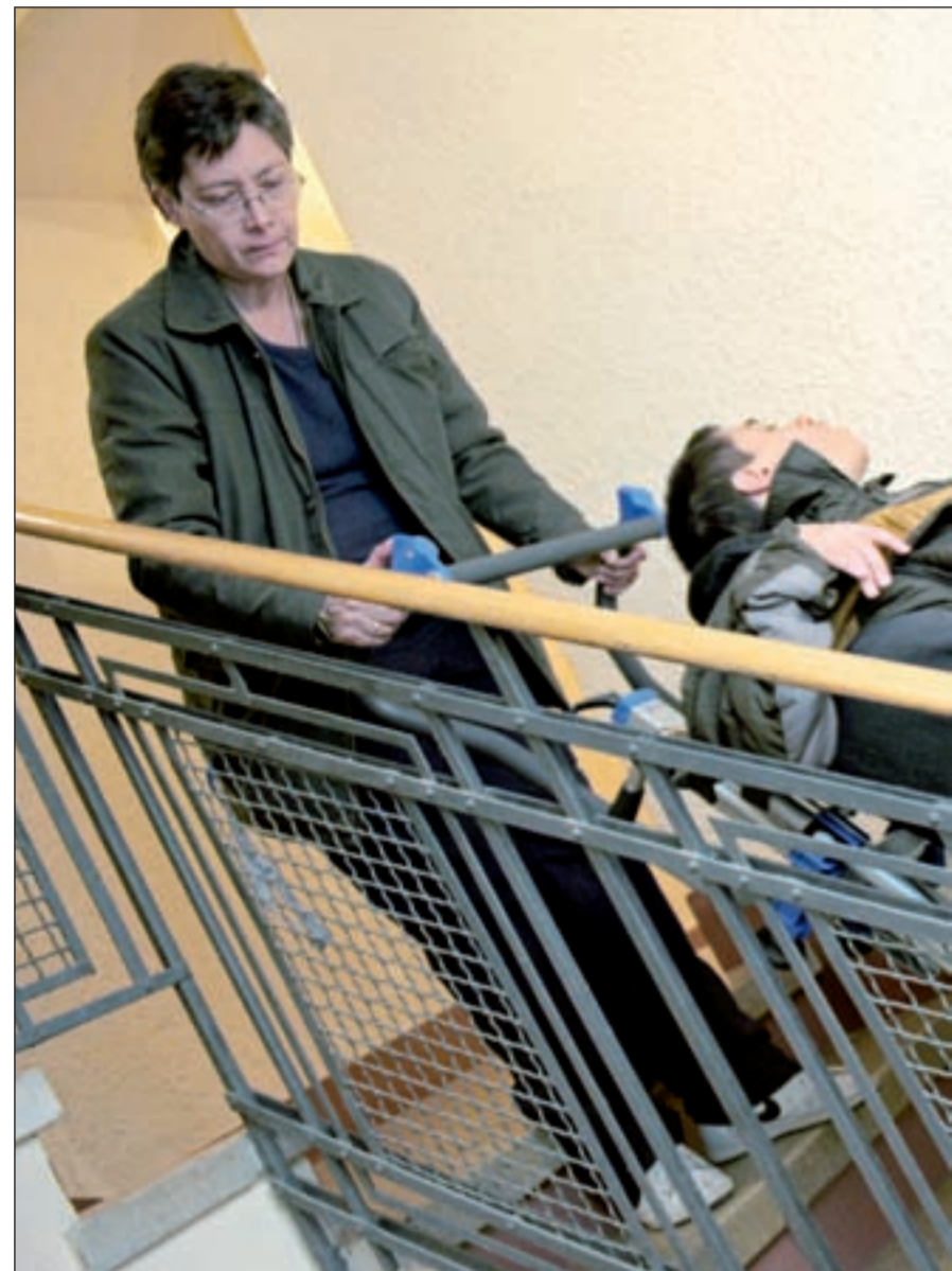
Una madre baja a su hijo en silla de ruedas por la escalera

La citada aplicación compete a los Gobiernos autonómicos, pero bajo el paraguas del Gobierno estatal por lo que el com-