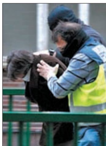
Uno de los atracadores detenido

Todos los detenidos son delincuentes muy peligrosos y for-