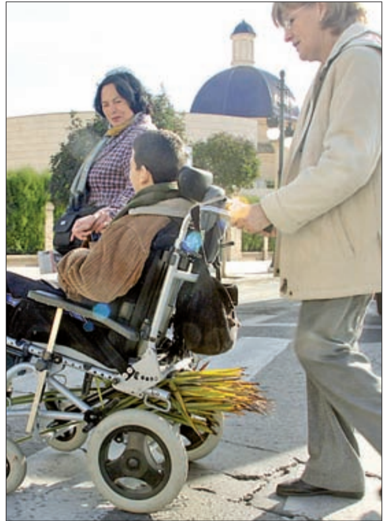
Familiares atienden a un dependiente GENTE

El catálogo de estas atenciones que garantiza la Ley en su artículo 15 para los Dependientes se divide en: servicios de prevención y promoción de la autonomía personal; teleasistencia; ayuda a domicilio con ayuda para las necesidades del hogar; cuidados personales; centros de día y de noche; así como servicio de atención residencial tanto para mayores como para dependientes por algún tipo de discapacidad. Por otro lado existe una tabla aprobada por el Real Decreto 374/2010 que determina según el grado certificado de dependencia y el tipo de cobertura necesaria, las asignaciones pecuniarias máximas. Así existe una prestación vinculada al servicio que el SAAD no puede