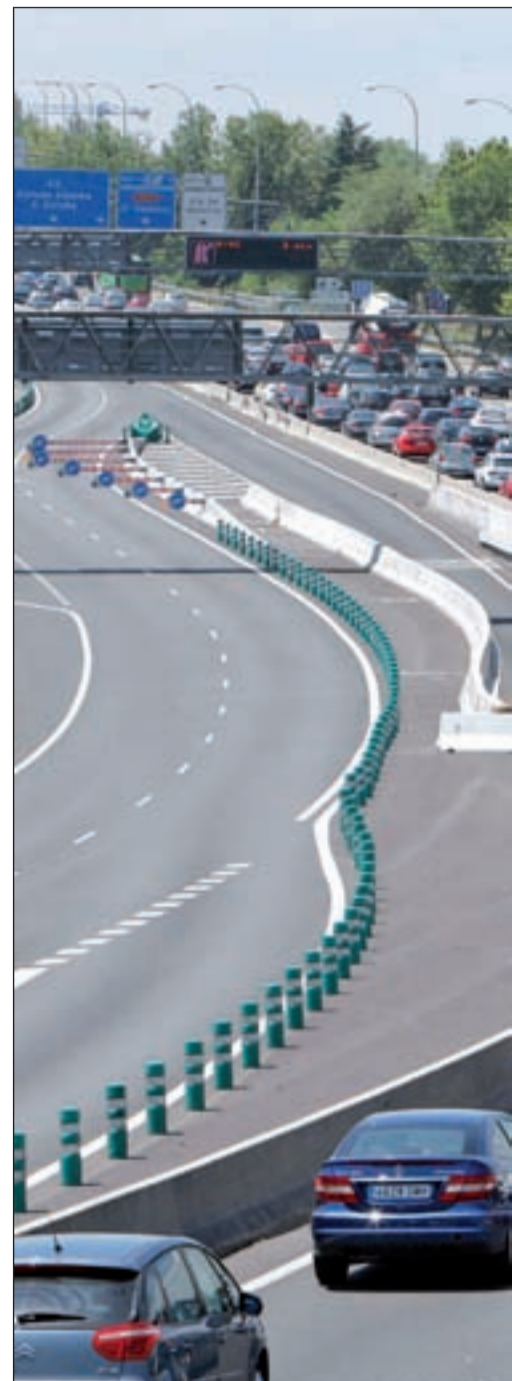
La organizaciones de conductores rechazan la inversión

La Comisión Europea calcula que hará falta una inversión de unos 1,5 billones de euros en los próximos cuarenta años para llevar a cabo todos estos cambios. Respecto a la sustitución de los combustibles tradicionales en el transporte por otros alternativos -una reducción del 50 % en 2030 y total en 2050- y al fomento del uso del coche eléctrico, el comisario explicó que se apoyará en facilidades fiscales, aunque no concretó cuáles. La Comisión quiere luchar, por otro lado, contra la congestión del tráfico y fomentar el desarrollo de corredores eficientes de transporte, así como mejorar la conexión entre los aeropuertos y las estaciones de tren.