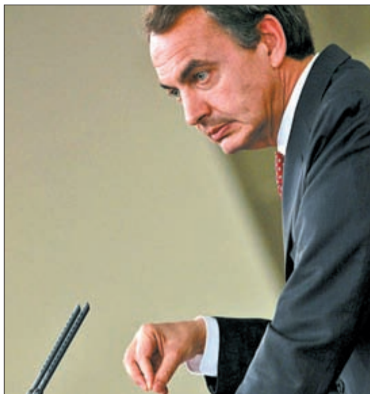
El presidente del Gobierno, José Luis Rodríguez Zapatero

Sin embargo, los ecos que auguran cambios apunta a dos posibles herederos con fuerza. Alfredo Pérez Rubalcaba y Carme Chacón. Nombres, que a medida que se tachan los días en el calendario para el 22-M, ganan más fuerza. Declaraciones como