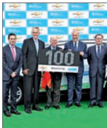
Momento de la firma

vilidad de sus trabajadores y de los niños que están a su cuidado. España es uno de los principales países participantes, y Chevrolet España ha anunciado la aplicación de este proyecto en nuestro país, y su ampliación mediante una participación activa de su Red de Distribución de la compañía norteamericana.