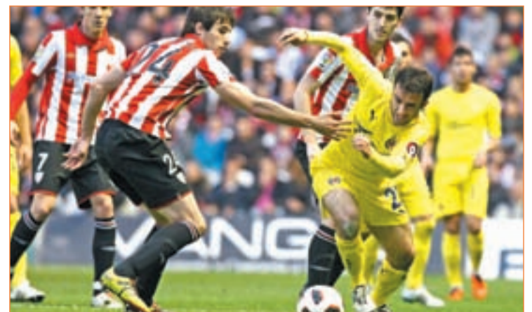
El Villarreal podría haber sido uno de los grandes perjudicados

League ante el Twente holandés. La imposición de la UEFA de reservar el día 28 de mayo para la celebración de la final de la Liga de Campeones y los compromisos de la selección a principios de junio, hubieran relegado a la última jornada de Liga al día 12 de junio, fecha en la que varios internacionales debería estar ya pensando en la Copa América.