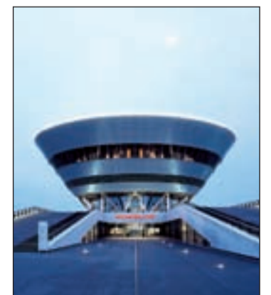
La planta de Porsche en Leipzig

"Durante la producción del Cayenne y el Panamera, nuestra planta de Leipzig ha demostrado que puede producir vehículos premium de muy alta calidad", manifestaba Matthias Müller, presidente del Consejo de Dirección de Porsche AG. "La decisión en favor de esta ubicación es una prueba de nuestra confianza en la alta competencia y cualificación del personal de Leipzig, a la vez que supone una contribución más en el avance económico de la región".