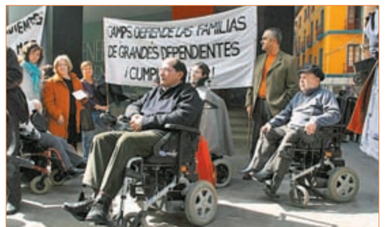
Dependientes exigiendo el cumplimiento de la Ley

se sentirán “más motivados y respaldados”. Prueba de las consecuencias de no obrar con celeridad en el proceso es el caso que CCOO denuncia en la Comunidad de Madrid donde su Boletín Oficial publicó la conclusión del proceso de valoración (para el que la Ley fija un máximo de seis meses) “de 3.200 personas que ya habían fallecido”.