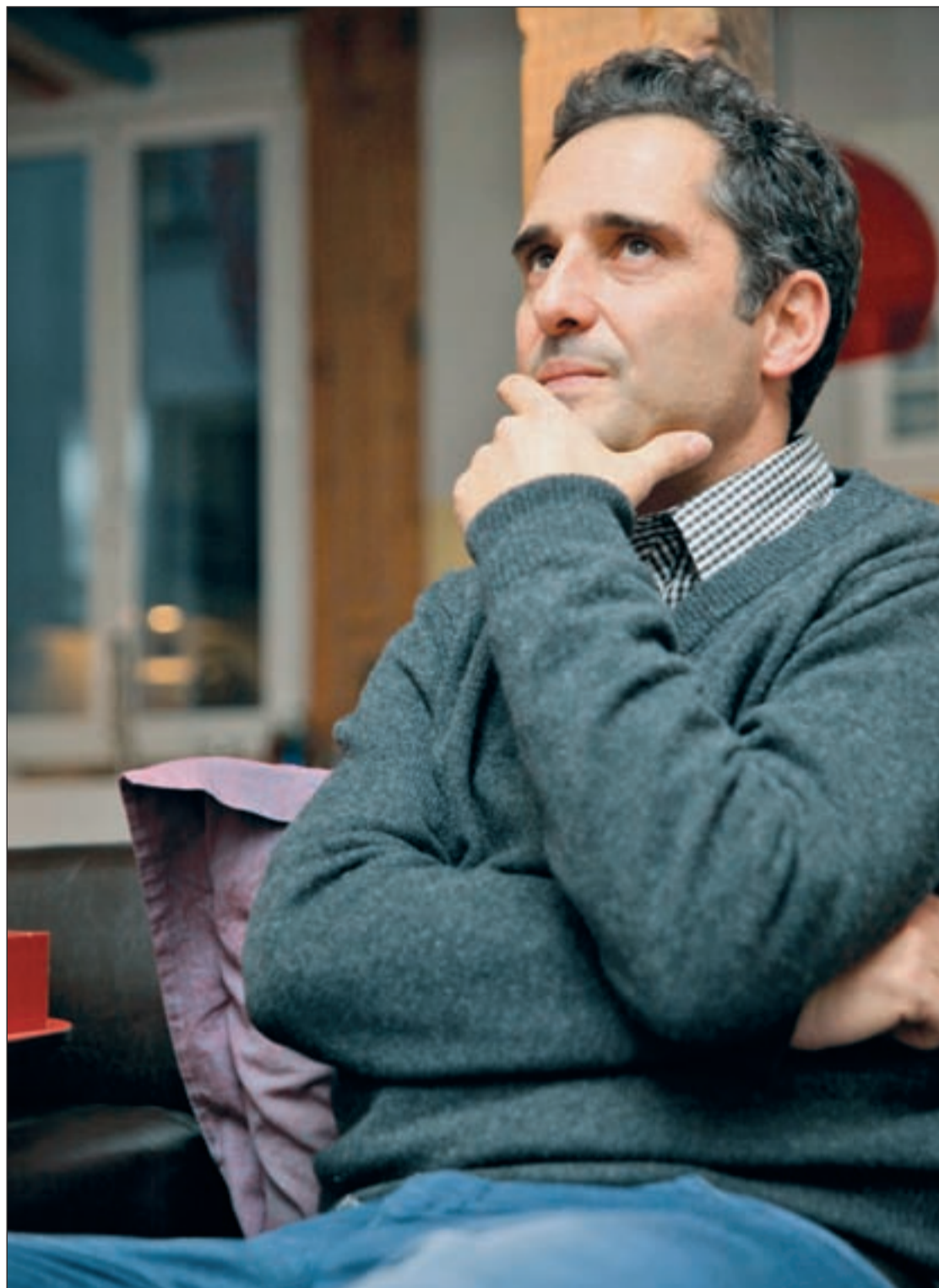
En la intimidad de su piso, Jorge Drexler se expresa fiel a su estilo, calmo y reflexivo.

A veces lo curioso es que las que parecen más simples son las que te dan más trabajo y las más complicadas a veces son el desarrollo de metodologías de trabajo. La idea del trabajo es que no se note, que no se vean las costuras. Lo esencial es la idea central que se resume en tres palabras de cada canción. No disfruto del acto de componer: la inseguridad brutal de una hoja en blanco, la euforia desmedida de una rima resuelta con la que pensás que vas a solucionar el mundo. Hasta que no