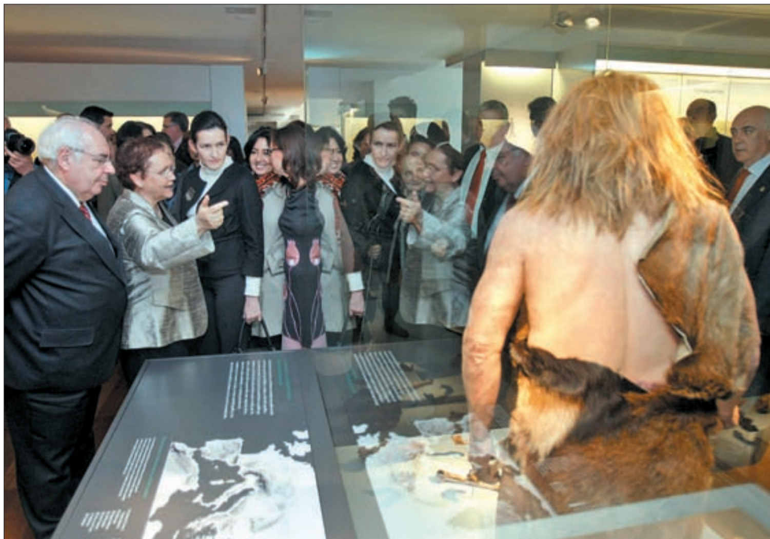
Vicente Álvarez Areces y Ángeles González Sinde en una de las salas del Museo Arqueológico de Asturias

La ministra de Cultura, acompañada de Vicente Álvarez Areces, recorrió la colección de más de dos mil piezas del legado histórico asturiano en el rehabilitado convento de San Vicente Pág. 4