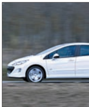
La nueva versión del Peugeot 308

sistema eHDi en la gama del 308 permite optimizar los consumos y las emisiones de este automóvil. Este dispositivo se combina con una motorización 1.6 HDi FAP de 112 caballos Euro 5. El 308 alcanza unas emisiones de dióxido de carbono de 98 gramos por cada kilómetro recorrido, según datos de la compañía.