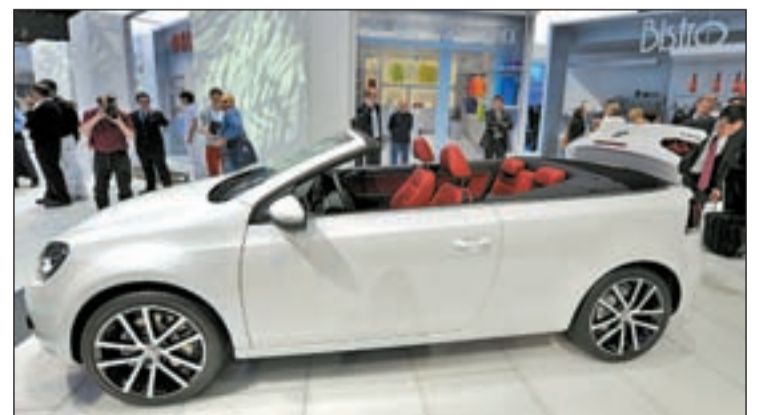
El nuevo Cabriolet no defrauda

ventas de la nueva generación del Golf Cabriolet comienzan el 24 de febrero en Alemania. El precio de partida en el mercado teutón se sitúa en los 23.625 euros. Por el momento, se desconocen las tarifas que estarán vigentes en nuestro país, aunque sí sabemos que en España estará disponible después del verano.