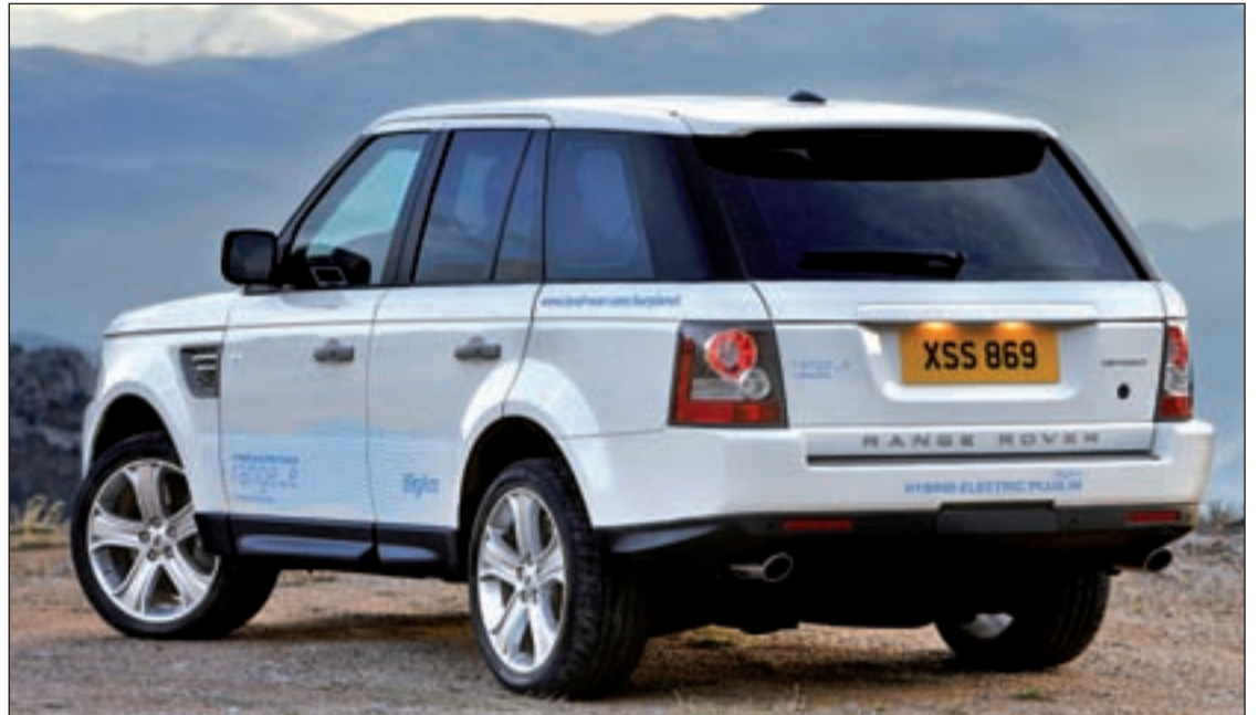
El modelo Range-e: hacia una nueva conciencia

Este modelo muestra las características de la próxima generación de coches Saab. Las formas consiguen un coeficiente aerodinámico de sólo 0,25 y exploran la capacidad de gestionar el flujo de aire a través de los apéndices laterales. Las puertas, que se abren como las alas de una mariposa, permiten un cómodo acceso al habitáculo de 2+2 plazas. También se presenta el innovador sistema de información y entretenimiento IQon, que incluye un ordenador con conexión a Internet al accionar el encendido del coche.