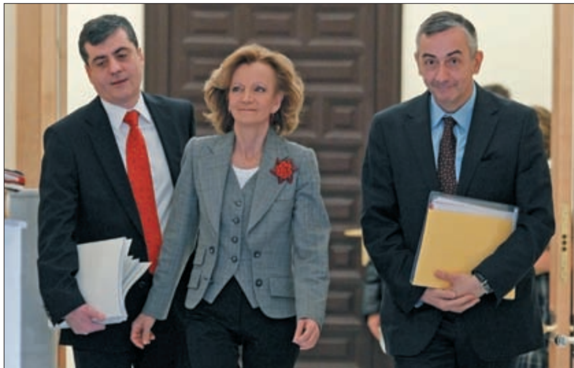
Elena Salgado, vicepresidenta segunda del Gobierno, instantes antes de dar cuenta del déficit público