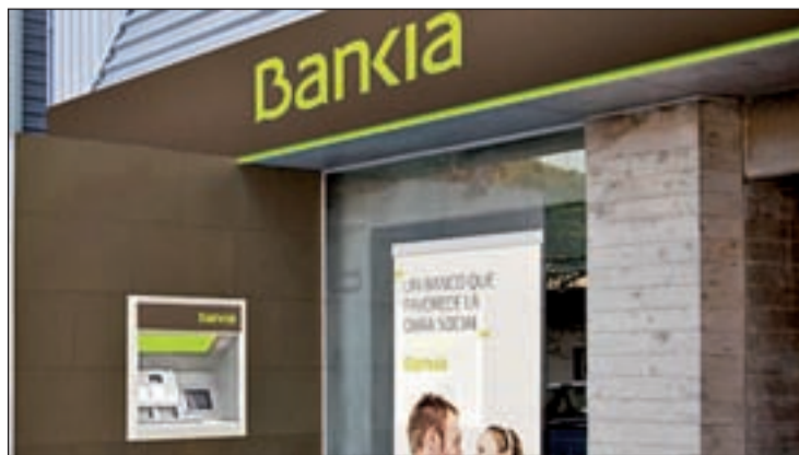
Una de las sucursales con la imagen corporativa de Bankia

Ha nacido Bankia. La marca comercial de la entidad que aglutina a Caja Madrid, Bancaja, la Caja de Canarias, Caja de Ávila, Caixa Laietana, Caja Segovia y Caja Rioja. La presentación se ha celebrado en el Palau de les Arts de Valencia, ciudad que acoge su sede social.