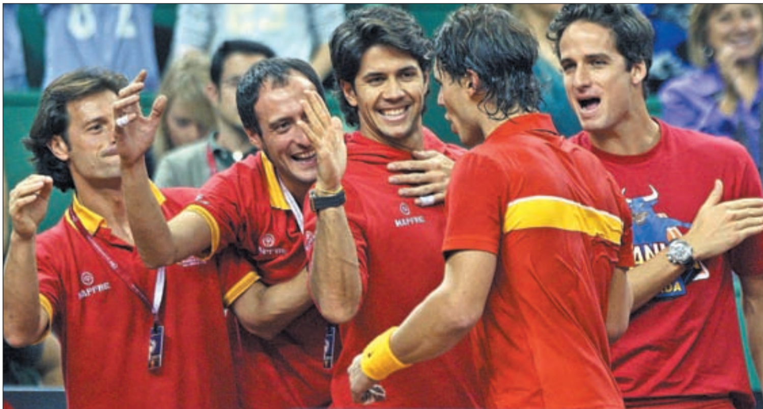
Rafa Nadal no disputó ninguna de las eliminatorias correspondientes al año 2010