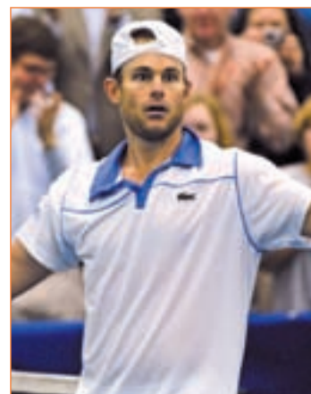
EEUU visita a Chile

ñoles deberán esperar a conocer el nombre del ganador entre Chile y Estados Unidos para saber qué rival es el que les esperará en cuartos de final. En caso de hacer valer los pronósticos, el equipo que lidera Andy Roddick recibirá a la 'Armada' allá por el mes de julio. Si por el contrario Chile da la sorpresa, lo más probable es que Rafa Nadal, Verdas-