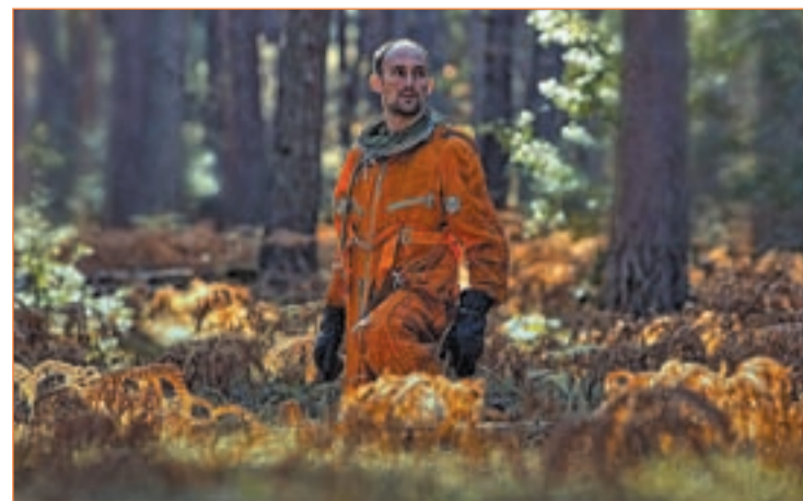
La película será rodada en Madrid y en La Ciudad de las Estrellas, Rusia

equipo y el realizador, Xavier Artigas. [NO-RES] es el “testigo audiovisual de los últimos días de vida de la Colonia Castells” para erigir en su lugar un homogéneo destino turístico. El fin que persigue este proyecto es “sentar un precedente para reflexionar sobre los procesos de urbanismo” y quizá “evitar la destrucción futura de otros espacios” con autenticidad. Además, el equipo de este documental baja de la red el crowdfunding y le da un lado más humano. Organizan actos para que los implicados “se vean las caras, hablen...”, luchan contra la soledad de Internet.