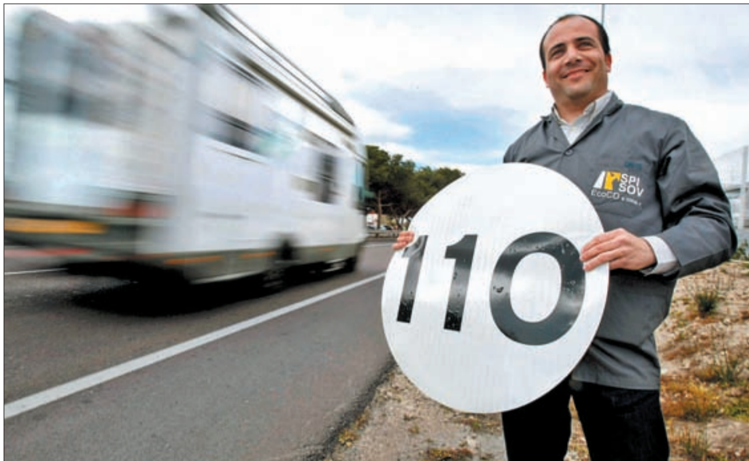
El lunes 7 de marzo todas las señales de 120 llevará la nueva pegatina