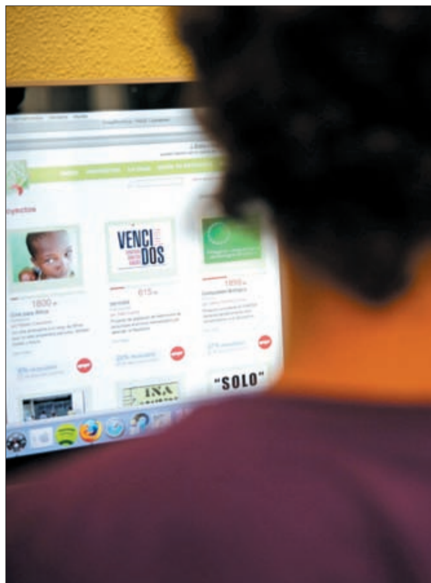
'Apoya ideas diferentes y artistas innovadores', incitan desde verkami.com, y en lanzanos.com

La novedad radica en el paso del inmovilismo del espectador al activismo del productor. En la implicación de quien elige el producto y se enreda en el crowdfunding. "A través de esta herramienta se abre una vía para llegar y vincularse directamente a un público despierto, consciente, productivo...", analiza el colectivo de fotoperiodistas de 'Piel de Foto'. Sin embargo, el crowdfunding en el Estado español aún está en su fase lactante. Madurando. Hoy en día todavía resulta complicado que un proyecto se nutra sólo de las micro-donaciones solidarias. "Necesita otras fuentes de inversión paralelas", sobre todo en creaciones de mayor envergadura presupuestaria, comenta a GENTE el equipo que tiene en sus mentes lanzar el documental 'Vencidos' si consigue el trampolín económico necesario. Aunque ésta no es la única ecuación. Garrido Barroso guarda en su recámara gráfica un cómic, 'Solo', que únicamente necesita de las aportaciones altruistas de la red para