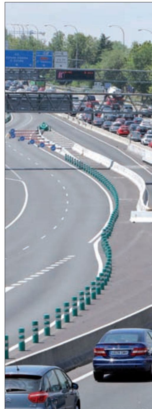
La organizaciones de conductores rechazan la inversión

La Comisión Europea calcula que hará falta una inversión de unos 1,5 billones de euros en los próximos cuarenta años para llevar a cabo todos estos cambios. Respecto a la sustitución de los combustibles tradicionales en el transporte por otros alternativos -una reducción del 50 % en 2030 y total en 2050- y al fomento del uso del coche eléctrico, el comisario explicó que se apoyará en facilidades fiscales, aunque no concretó cuáles. La Comisión quiere luchar, por otro lado, contra la congestión del tráfico y fomentar el desarrollo de corredores eficientes de transporte, así como mejorar la conexión entre los aeropuertos y las estaciones de tren.