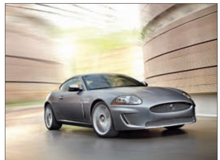
'SPRING EDITION': Con motivo del 50 aniversario de su modelo E-TYPE, Jaguar ha diseñado la Edición Limitada "Spring Edition" disponible para el modelo XK 5.0 V8, Coupé y Convertible.

El diseño de los interiores de esta edición limitada, se inspira en los históricos interiores del Jaguar E-TYPE, homenajeando al mítico modelo de la marca británica. Todo un lujo, como refleja su precio, a partir de los 105.000 euros.