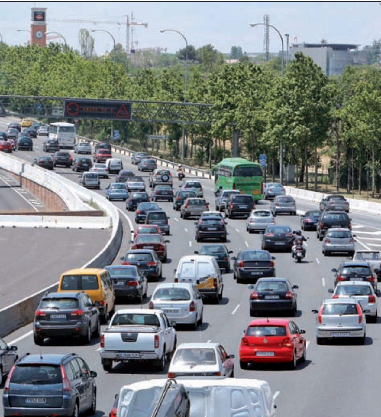
iniciativa mientras que los ecologistas critican a la UE por "posponerla durante décadas"