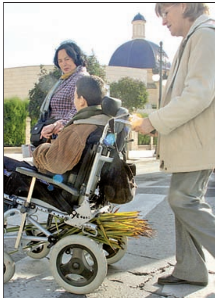
Familiares atienden a un dependiente GENTE

El catálogo de estas atenciones que garantiza la Ley en su artículo 15 para los Dependientes se divide en: servicios de prevención y promoción de la autonomía personal; teleasistencia; ayuda a domicilio con ayuda para las necesidades del hogar; cuidados personales; centros de día y de noche; así como servicio de atención residencial tanto para mayores como para dependientes por algún tipo de discapacidad. Por otro lado existe una tabla aprobada por el Real Decreto 374/2010 que determina según el grado certificado de dependencia y el tipo de cobertura necesaria, las asignaciones pecuniarias máximas. Así existe una prestación vinculada al servicio que el SAAD no puede