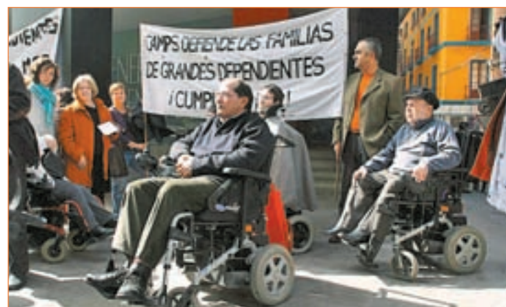
Dependientes exigiendo el cumplimiento de la Ley

se sentirán “más motivados y respaldados”. Prueba de las consecuencias de no obrar con celeridad en el proceso es el caso que CCOO denuncia en la Comunidad de Madrid donde su Boletín Oficial publicó la conclusión del proceso de valoración (para el que la Ley fija un máximo de seis meses) “de 3.200 personas que ya habían fallecido”.