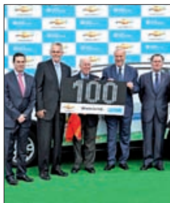
Momento de la firma

vilidad de sus trabajadores y de los niños que están a su cuidado. España es uno de los principales países participantes, y Chevrolet España ha anunciado la aplicación de este proyecto en nuestro país, y su ampliación mediante una participación activa de su Red de Distribución de la compañía norteamericana.