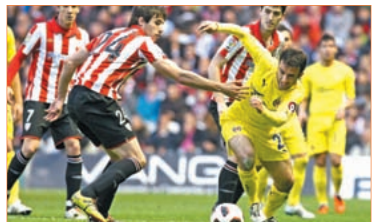
El Villarreal podría haber sido uno de los grandes perjudicados

League ante el Twente holandés. La imposición de la UEFA de reservar el día 28 de mayo para la celebración de la final de la Liga de Campeones y los compromisos de la selección a principios de junio, hubieran relegado a la última jornada de Liga al día 12 de junio, fecha en la que varios internacionales debería estar ya pensando en la Copa América.