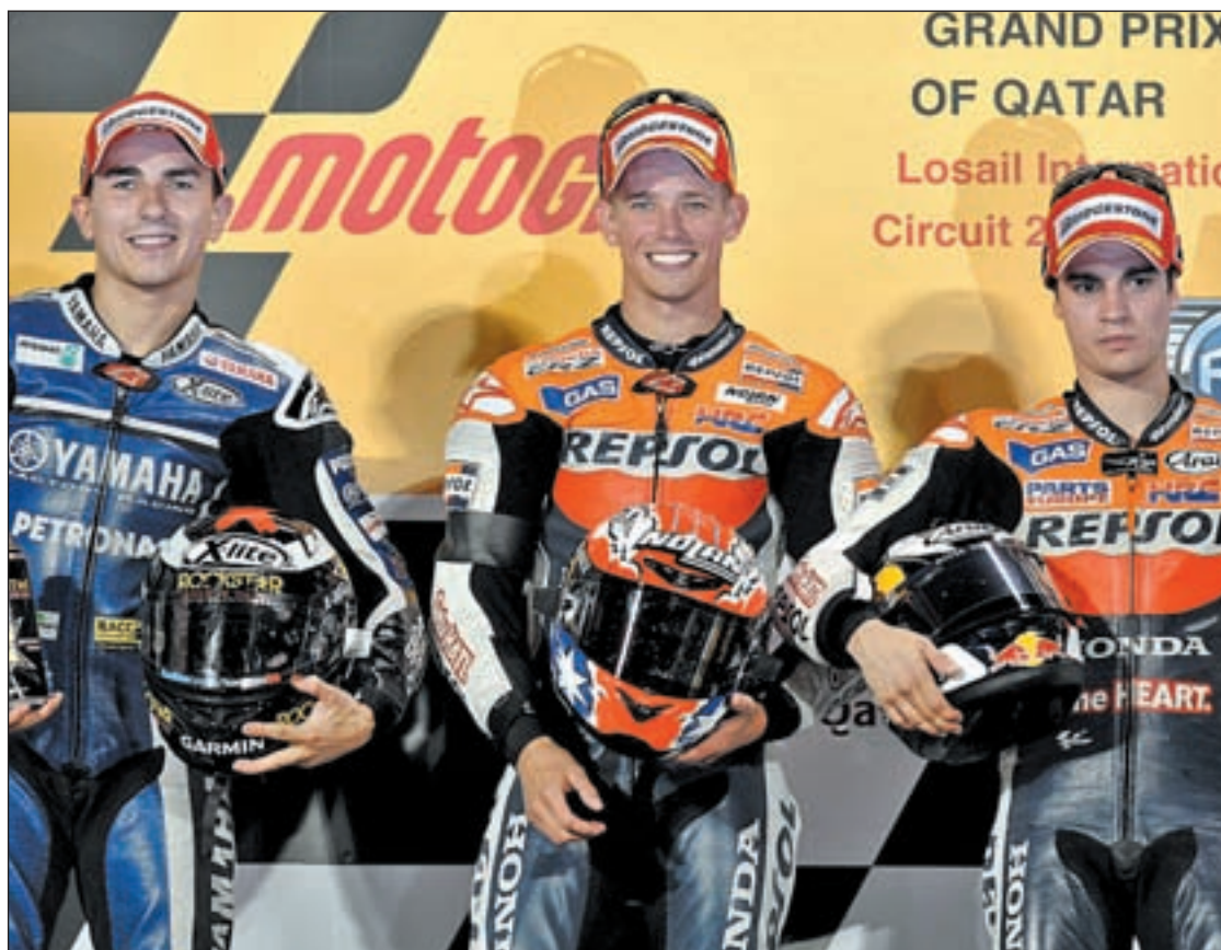
Jorge Lorenzo, Casey Stoner y Dani Pedrosa completaron el primer podio de la temporada

La gran ausencia entre los pilotos españoles de la categoría reina será Álvaro Bautista. El talaverano se fue al suelo durante los entrenamientos de la primera carrera del año y se vio obligado a pasar por el quirófano para subsanar la fractura de fémur