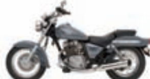
Suzuki Marauder 125. Precio anual orientativo con bonificación.

PROMOCIÓN ESPECIAL PARA LECTORES DE GENTE