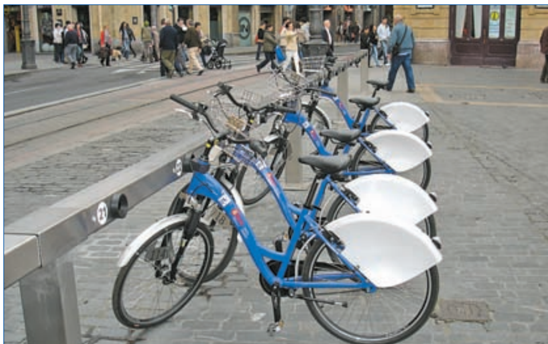
AYUNTAMIENTO DE BILBAO

El pasado 25 de marzo inauguraron las nuevas instalaciones del polideportivo 'La ciudad de la Raqueta', en San Ignacio. Las obras de rehabilitación han renovado totalmente el centro, con una nueva entrada, situada en la calle Arturo Campión, más cercana al barrio y al transporte público. Cuenta con una nueva zona de recreo para los niños, mesas de tenis de uso libre y bancos para sentarse a observar la actividad de las 15 nuevas pistas de pádel y tenis. Actualmente, el centro da servicio a 10.000 personas abonadas a Bilbao Kiroiak y 13.000 cursillistas.