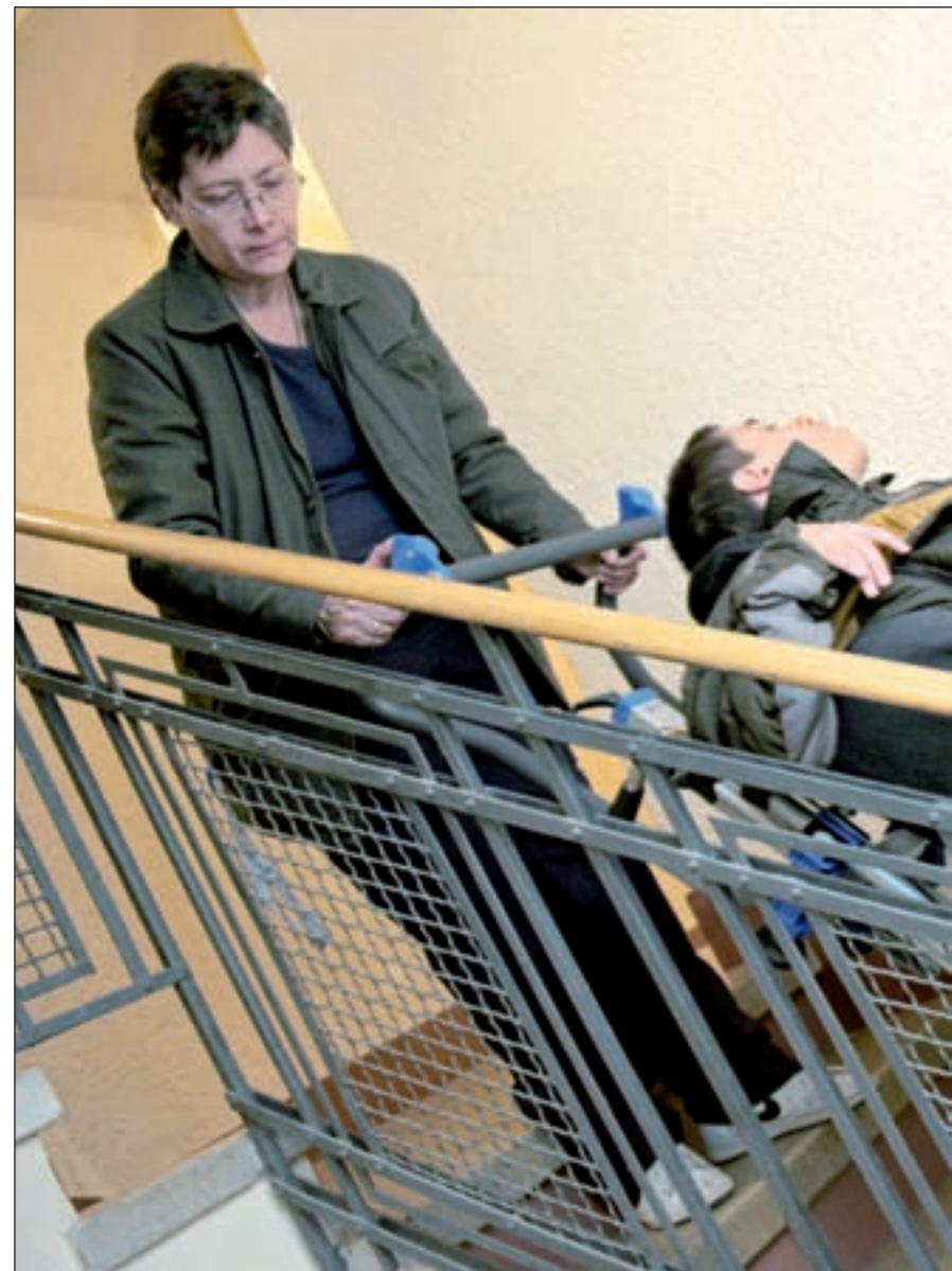
Una madre baja a su hijo en silla de ruedas por la escalera

La citada aplicación compete a los Gobiernos autonómicos, pero bajo el paraguas del Gobierno estatal por lo que el com-