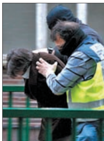
Uno de los atracadores detenido

Todos los detenidos son delincuentes muy peligrosos y for-