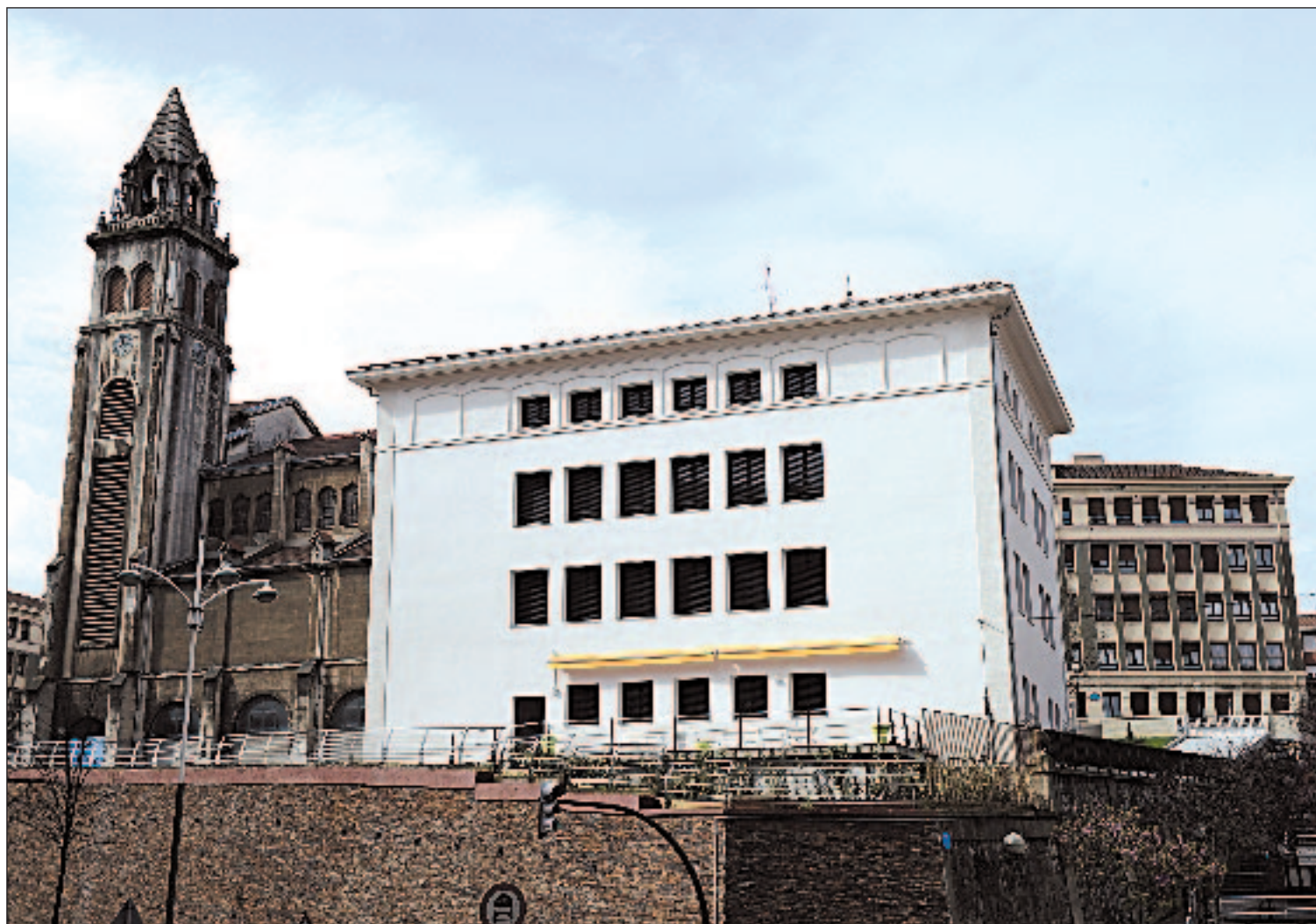
Fachada del edificio que la Diputación de Bizkaia ha alquilado al Obispado de Bilbao

La residencia especializada en atender a personas que sufren esta enfermedad degenerativa está ubicado en un edificio de Torreurizar en Irala y cuenta con un total de dieciséis plazas Pág. 4