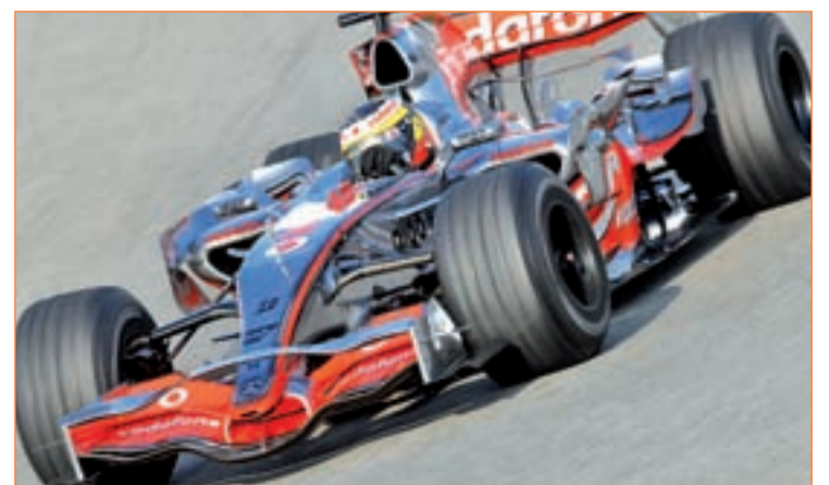
De la Rosa volverá a aportar su experiencia al equipo británico

Button. Quien no ha cambiado de aires es Jaime Alguersuari. Después de una temporada y media como piloto de Fórmula 1, el barcelonés llega a Australia con veintidós años recién cumplidos y el objetivo de superar a su compañero Sebastian Buemi. El suizo acabó con un mejor balance gracias a sus ocho puntos, por los cinco de Alguersuari.