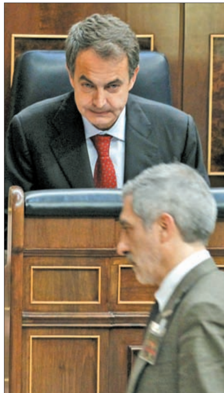
Zapatero observa a Llamazares tras criticar éste la intervención

En paralelo, la ministra de Defensa, Carme Chacón, ha despedido a la tripulación de la fragata 'Méndez Nuñez', en su partida de la base naval de Rota, en Cádiz, hacia la zona de operaciones en Libia, diciéndoles que "van a proteger a una población indefensa frente a los crímenes de un tirano". Asimismo, la titular de Defensa les ha trasladado