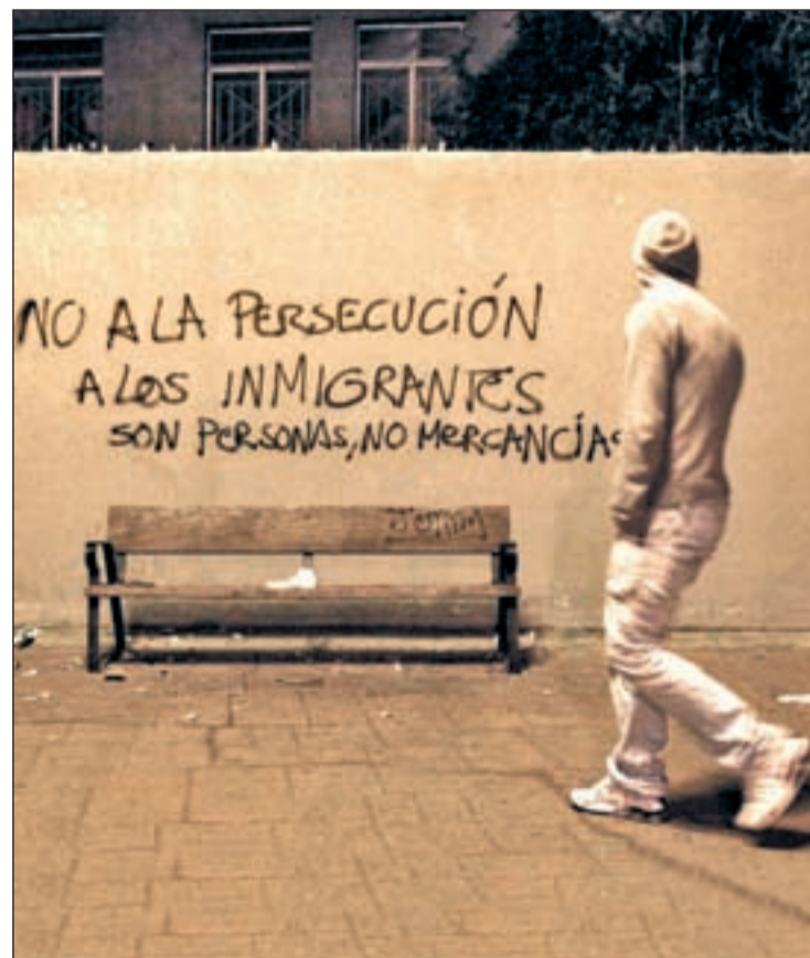
Pintada en una calle de Madrid contra las redadas FRONTERAS INVISIBLES