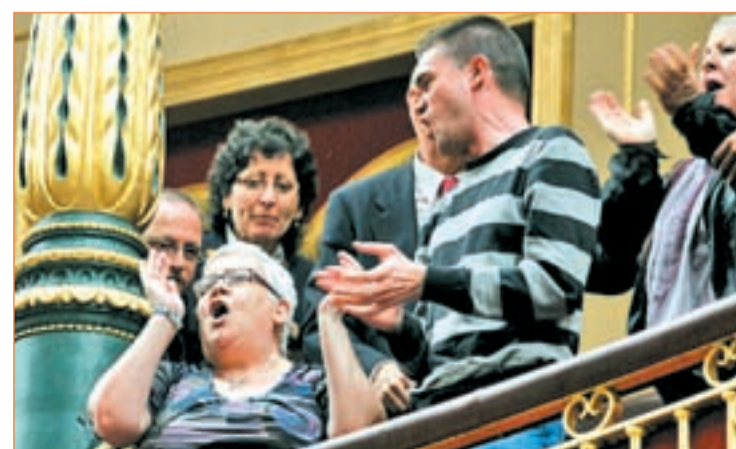
Protesta en el Congreso de los Diputados

ledo y los activistas saharauis. La diferencia es que el incidente de este martes se produjo una vez levantada la sesión. Aquel incidente motivó que, desde hace unas semanas, el Congreso reparta entre sus invitados unas octavillas recordando que el Parlamento es inviolable y que alterar sus sesiones está tipificado como delito en el Código Penal.