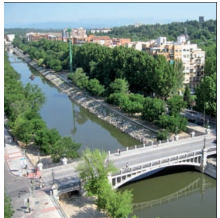
El sistema de agua se basa en la recuperación para un nuevo uso público

“El sistema de agua se basa en la recuperación para un nuevo uso público, del agua proveniente del sistema de depuradoras municipales y de la red de drenaje de diversas infraestructuras públicas, y que hasta ahora se vertía al saneamiento”, explican los impulsores de la iniciativa.