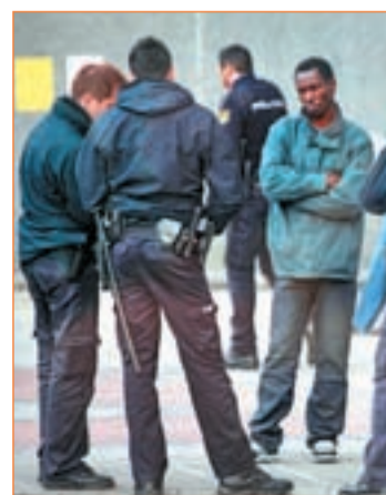
Control policial FRONTERAS INVISIBLES

les. Para la ONU, tener "escaso número de denuncias" no debe considerarse "necesariamente positivo, ya que puede ser un indicador, entre otros, del temor de las víctimas" o de su "falta de confianza en los órganos policiales y judiciales". En esta línea, Andalucía Acoge quiere hacer hincapié en la necesaria reforma de la Ley de Extranjería que aboca a las mujeres víctimas de la violencia machista a permanecer calladas ante el temor a una orden de expulsión. En la semana internacional contra el racismo, España aún está en pañales.