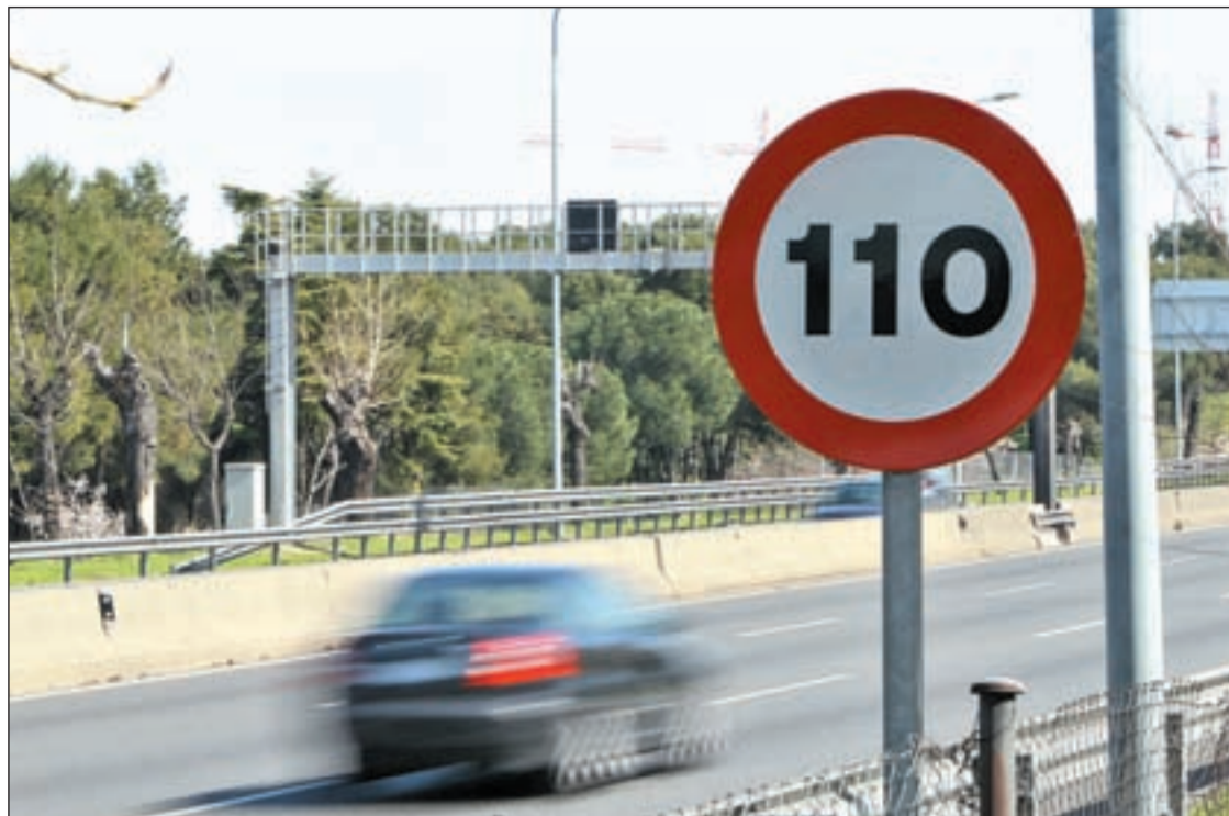
Vehículos circulando por una autovía con la reducción de la velocidad a 110 kilómetros hora