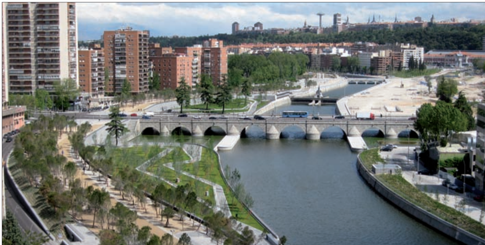
Imagen de Madrid Río, un gran espacio para disfrutar más de Madrid