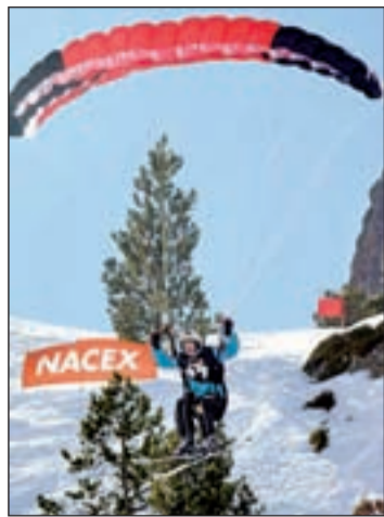
Espectáculo de altura en Arcalís