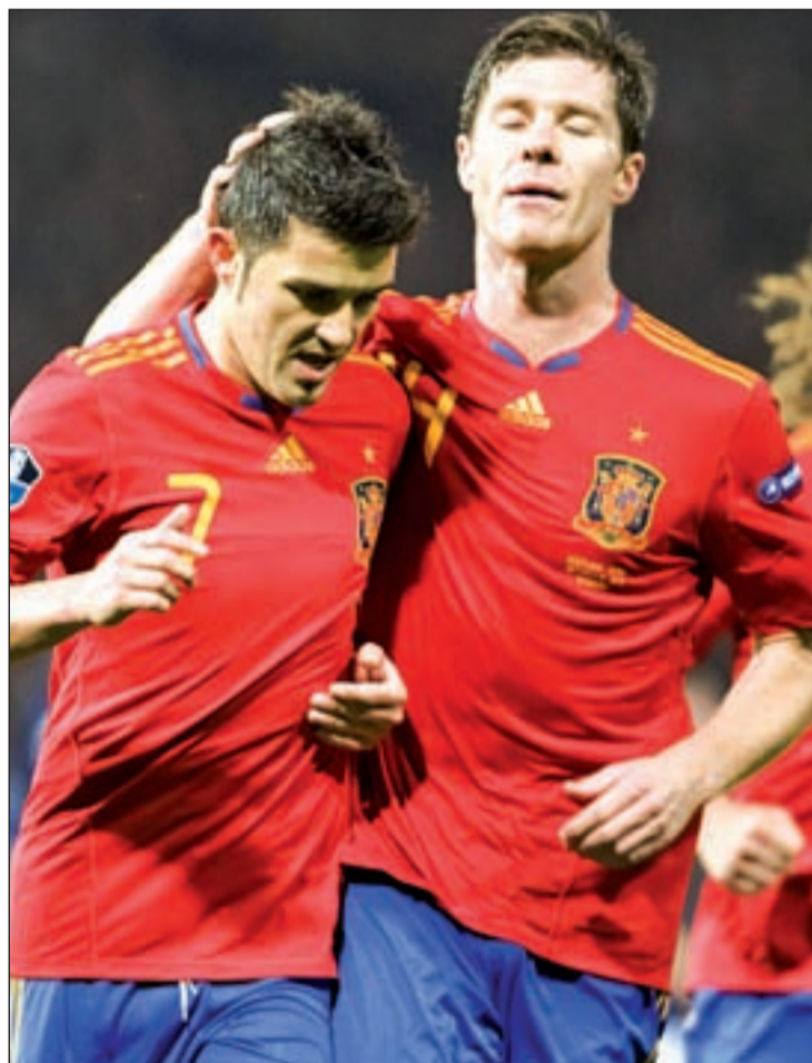
Villa puede superar a Raúl como máximo goleador histórico

Los bálticos se aferran a ese precedente y a otro un poco más lejano en el tiempo. Fue en octubre de 2004 cuando el equipo