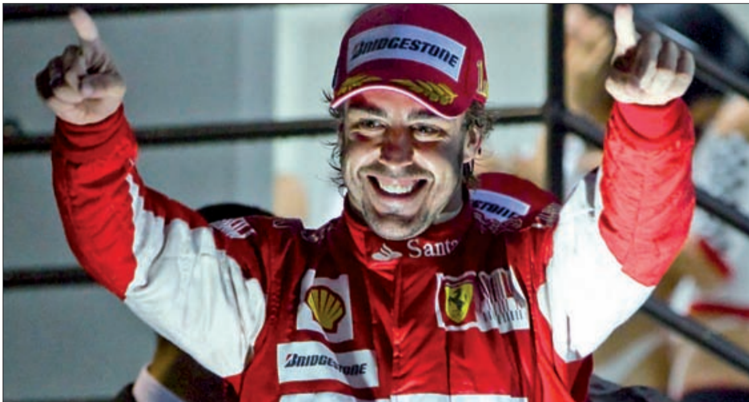
El piloto español espera resarcirse tras una temporada un tanto aciaga que acabó con el título en manos de Sebastian Vettel

EL MUNDIAL DE FÓRMULA 1 COMIENZA ESTE FIN DE SEMANA CON EL GP DE AUSTRALIA