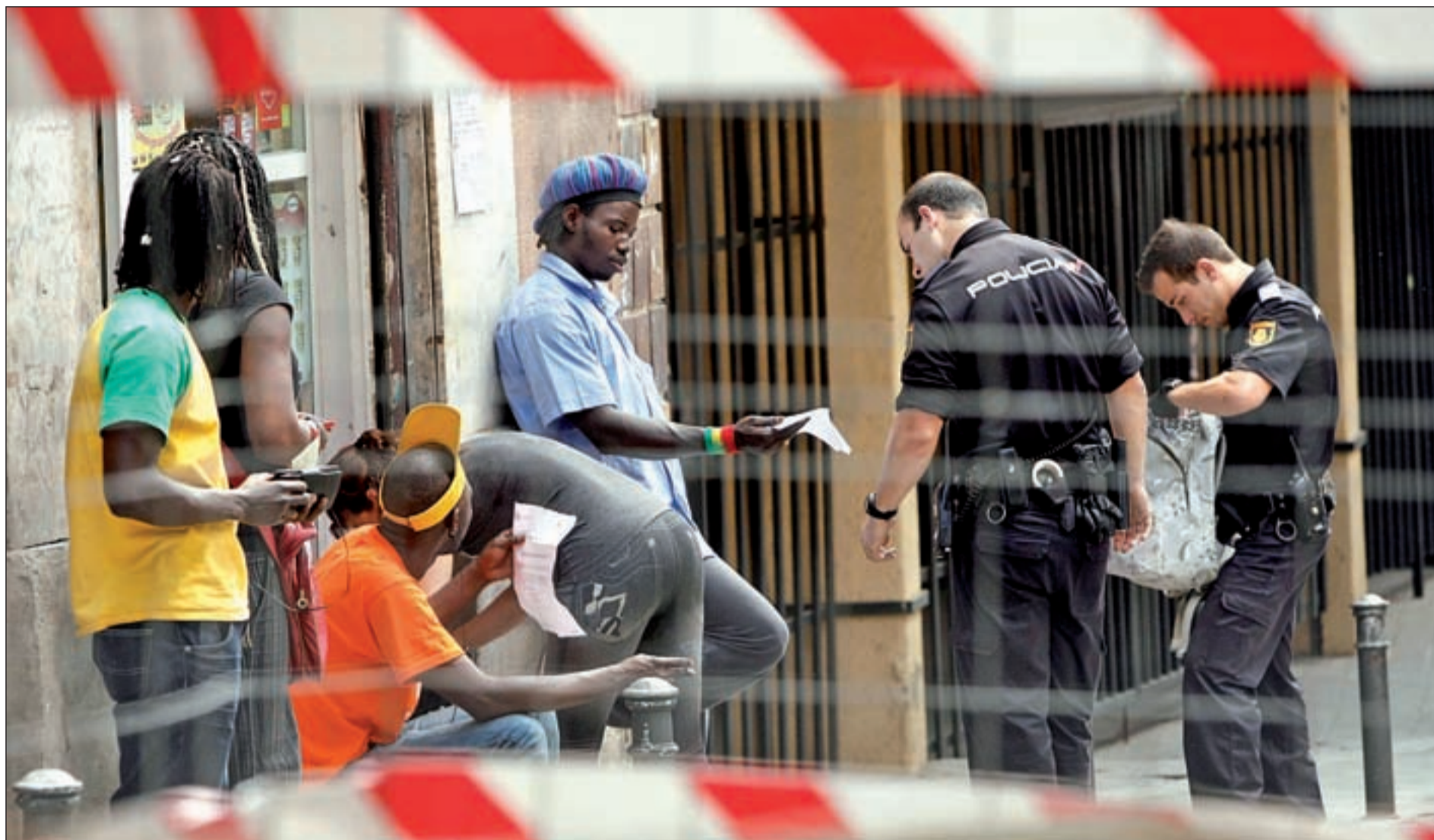
Un control policial, con registro incluido, a varias personas en una de las calles de un barrio madrileño

SEMANA INTERNACIONAL CONTRA EL RACISMO España ha recibido una llamada de atención de la ONU y las organizaciones sociales por las redadas policiales por motivos étnicos y raciales • Interior las niega