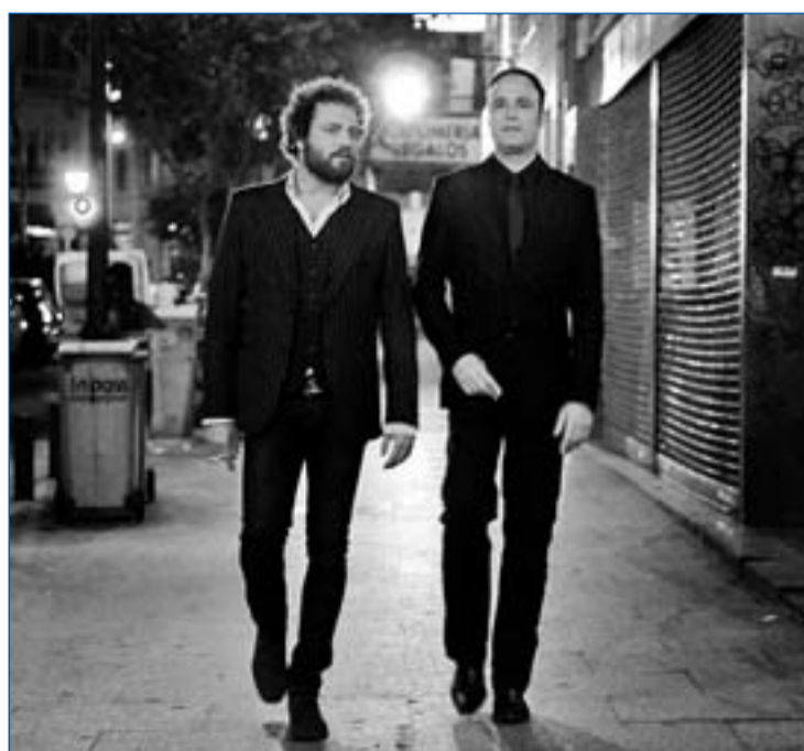
COMPONIENDO COMO 'GUIRIS'. M-Clan proviene del rock&roll y el blues clásico norteamericano. Por eso, cuando crean la letra en "semi inglés" sobre la melodía ya hecha queda ese "feeling más soul", teoriza Tarque.