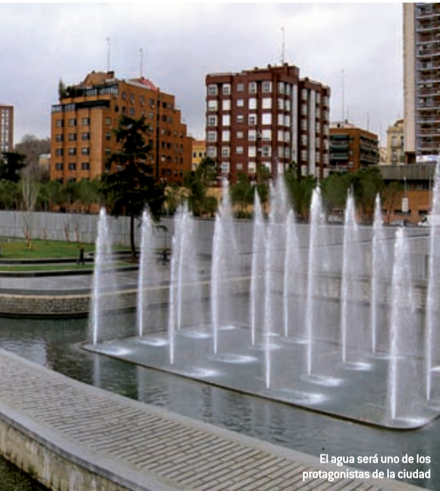
El agua será uno de los protagonistas de la ciudad