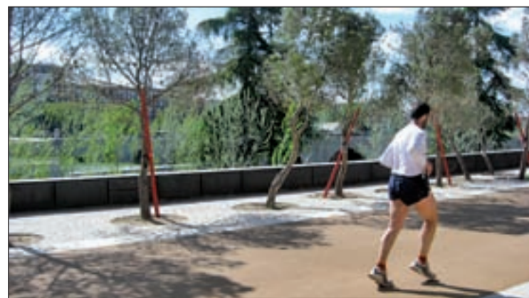
Se han plantado 33.000 árboles de 30 especies diferentes

cuadrados; puente de Toledo, de 40.000 metros cuadrados, Matadero, de 89.000 metros cuadrados y, como pieza principal de estos espacios verdes, el parque de Arganzuela, el ámbito más extenso del sistema de zonas verdes que articula el proyecto Madrid Río, que alcanza los 232.000 metros cuadrados.