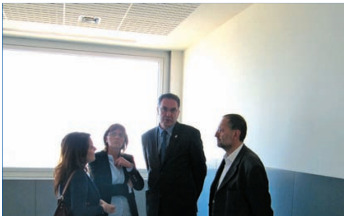
PRINCIPADO DE ASTURIAS

El ahora candidato oficial de Foro Asturias, Francisco Álvarez-Cascos, ha asumido su cargo con el convencimiento de que conquistará en las urnas el Principado. En esta línea, Cascos, ha afirmado que él no es de la opinión de los que creen que va a necesitar al PP para presidir Asturias y ha dicho que su partido no aceptará ni "pactos de trastienda ni acuerdos de restaurante" para poder gobernar. Su primera propuesta como candidato ha sido solicitar un sistema de primarias en su partido equivalente al de EEUU para que los militantes elijan a los cabezas de lista.