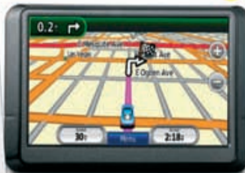
UN GPS para el COCHE A partir de 90 euros

Legendario reloj que utilizan los integrantes de la mayoría de las misiones especiales desde la década de los 60.