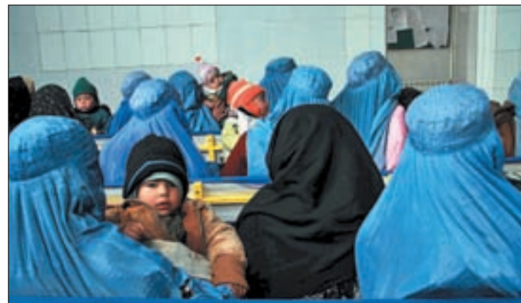
Burkas en Afganistán, único país donde esta prenda es habitual