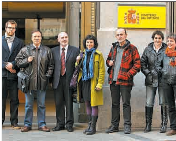
Promotores de la formación ilegalizada Sortu

No obstante, tres de los 16 magistrados han anunciado que presentarán votos particulares por estar en contra del fallo de la sala.