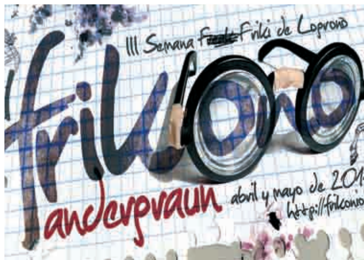
Cartel de Diego Solloa.

este año, la tercera edición, 'se ha ido de las manos' y dura dos meses. Todo cabe en el FRIKOÑO: fiestas, concursos, conciertos, teatro, proyecciones... y exposiciones. Y el presupuesto asciende a 0 euros. En dos meses y con un programa de lo más variado y variopinto, llama la atención la exposición colectiva Grotosque!!, que se celebra en la Escuela de Artes. Pornoterrorismo, y el homenaje al cineasta Iván Zulueta, son algunos de los actos y frikiactos de los que Logroño será escenario los meses de abril y mayo. Pasen y vean todo el programa en http://frikonio.blogspot.com/ .