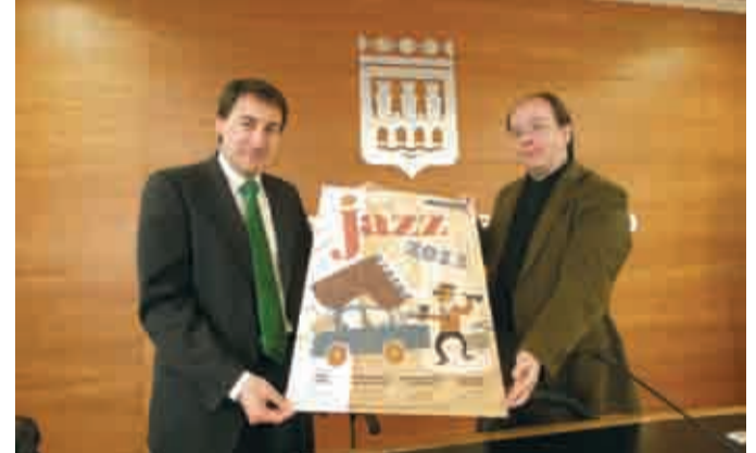
El pasado jueves se presentó el ciclo de Jazz que organiza Cultural Rioja y que se celebrará durante todos los jueves del próximo mes de mayo en el Teatro Bretón de los Herreros.