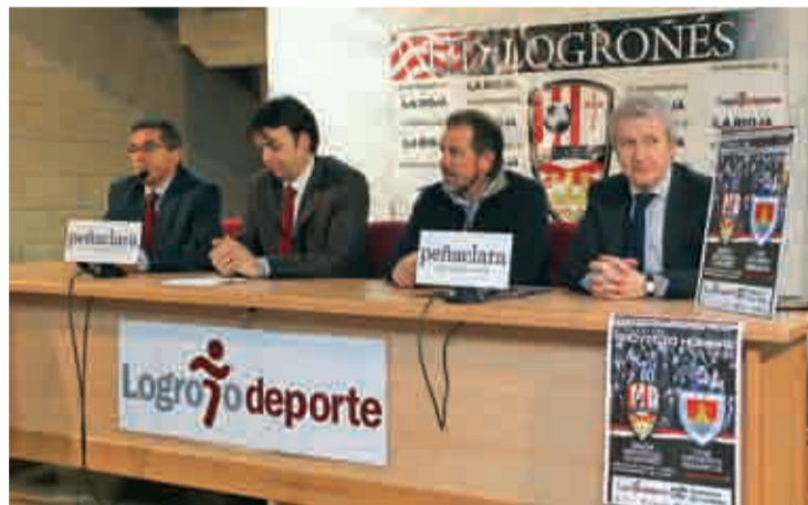
Presentación del partido.

Las entradas se venderán, por los cauces habituales, en las taqui-