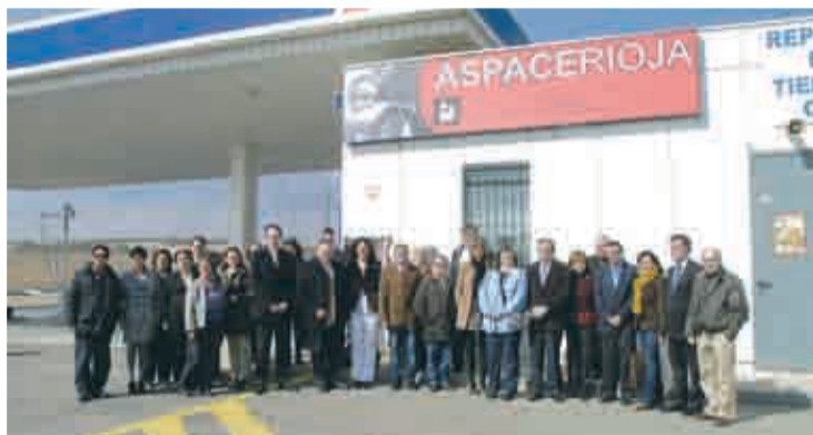
Visita a las instalaciones del Centro.

En su visita, Sanz destacó la importancia de los Centros Especiales de Empleo, a los que definió como "empresas que realizan un trabajo productivo cuya finalidad es asegurar un empleo remunerado, además de prestar servicios de