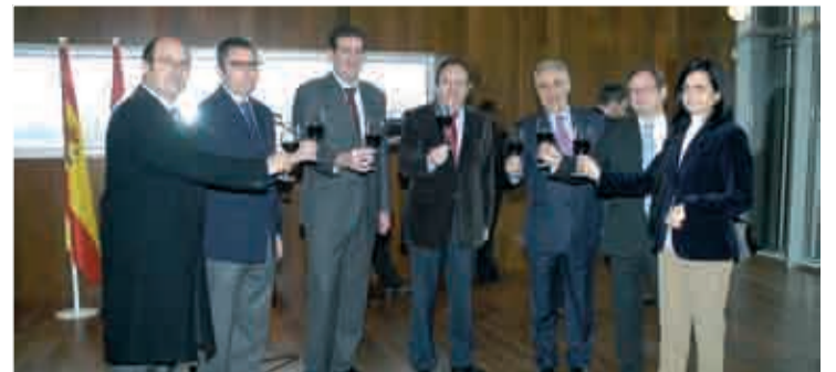
Visita a las instalaciones del futuro complejo.