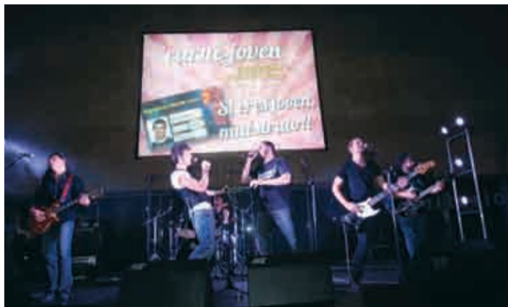
Presentación del nuevo Carné Joven en Riojaforum.

También se dio a conocer el nombre de la persona ganadora del concurso para elegir un eslogan para el Carné Joven. Previamente, los jóvenes tuvieron oportunidad de enviar sus propuestas a la web del Carné Joven. El ganador recibió como premio un net-book.