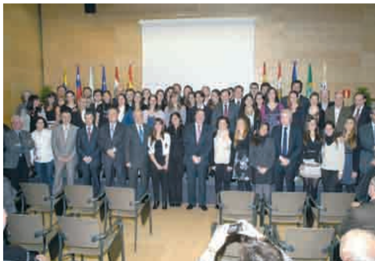
Los 30 jóvenes que se despidieron de La Rioja.

El Riojaforum fue el escenario donde se despidió a los 30 jóvenes que han integrado la expedición de la undécima edición del programa 'Volver a las Raíces', una iniciativa del Gobierno regional para que los descendientes de emigrantes riojanos puedan conocer la tierra de sus antepasados y tengan oportunidad de realizar prácticas en empresas de nuestra región gracias a la colaboración de la Federación de Empresarios de La Rioja (FER) y de otras entidades. De los participantes, la mayor parte han sido de Argentina y los jóvenes descendían de 27 localidades riojanas.