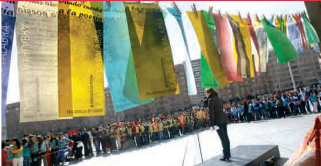
El colegio IES Batalla de Clavijo de Logroño celebró, el pasado miércoles, un acto en el que los alumnos leyeron poesías en la plaza del Ayuntamiento dentro de sus jornadas poéticas.