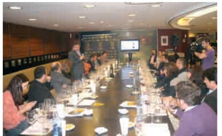
Presentaron la exposición con una cata guiada.