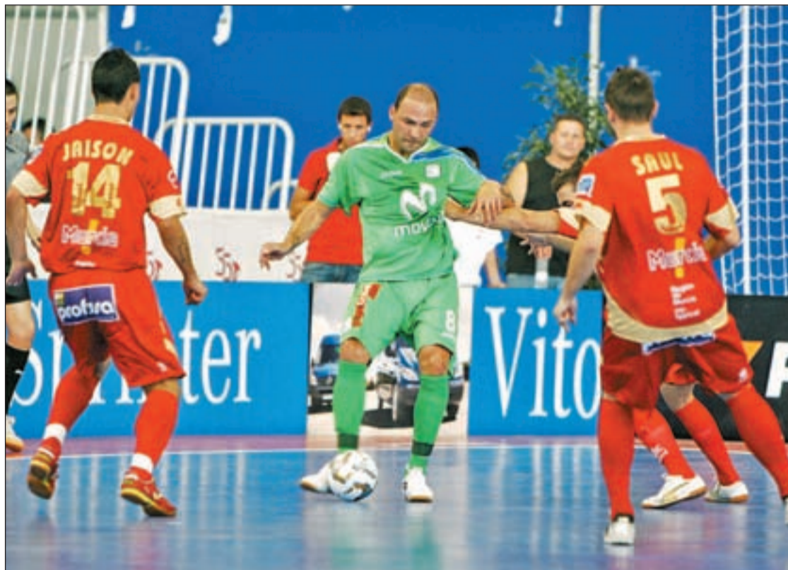
Inter y ElPozo ya se vieron las caras en la Supercopa celebrada en Guadalajara LNF.S.ES

A pesar que en las últimas cuatro ediciones tanto Inter Movistar como ElPozo se han repartido los títulos, la historia reciente del torneo invita a no tener en cuenta el hipotético cartel de favorito. Los resultados de esta temporada caminan en esa dirección. Inter Movistar no acaba de encontrar una línea de regularidad, un déficit que la campaña pasada llevó al equipo madrileño a caer de forma prematura en el 'play-off' por el título y a despedirse de sus opciones en