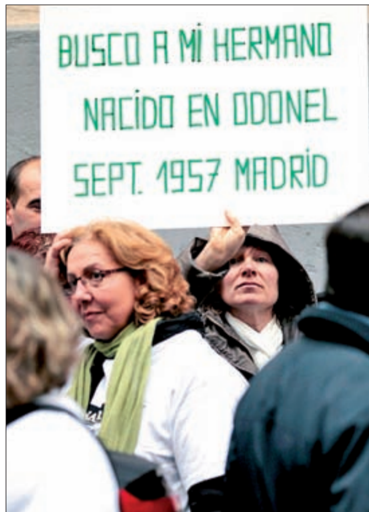
Una mujer muestra una pancarta en una concentración ante la Fiscalía

Desde la Federación Española de Municipios y Provincias (FEMP), su presidente, Pedro mostró públicamente su apoyo a la causa de esta asociación compuesta por, “familias que buscan familias, hijos que buscan el cariño de unos padres y hermanos