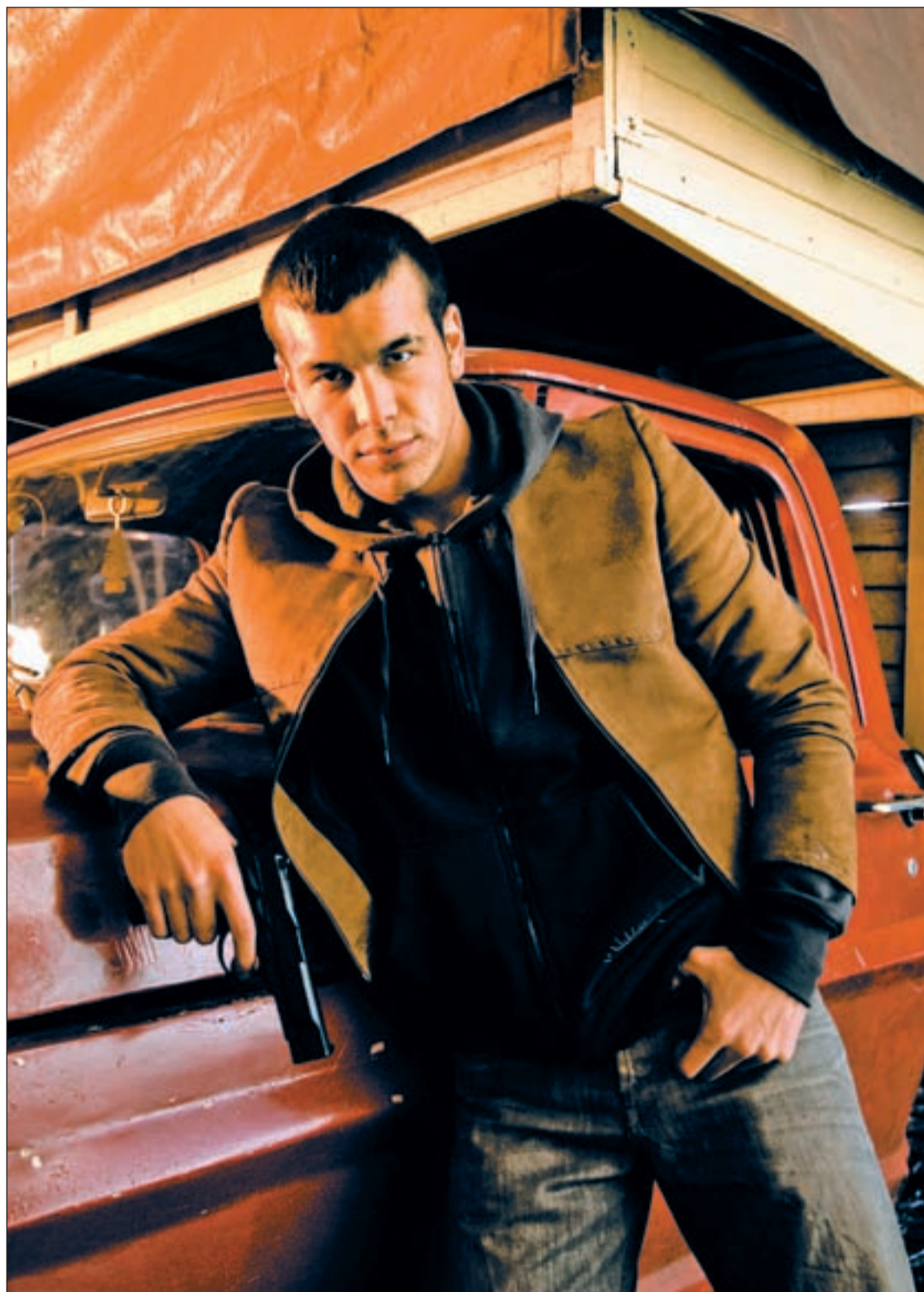
Mario Casas, caracterizado como Ricky en Carne de Neón, un "hijo puta con sentimientos"

Ambos actores comparten serie en pantalla, 'El Barco', y una larga lista de nuevos proyectos. Sobre su posible 'encasillamiento' estos dos jóvenes lo tienen claro. "Tengo 24 años", analiza Casas, "de momento no puedo interpretar a un padre con hijos, pero dentro de las opciones que he tenido he pasado por personajes distintos como un freak en 'Fuga de Cerebros' o un chico