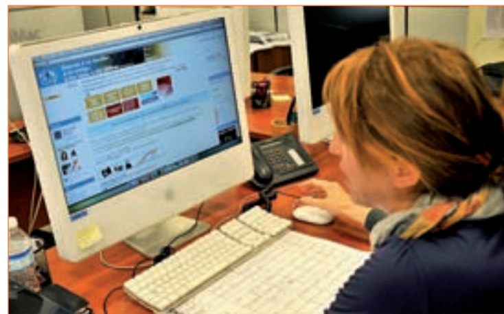
Una mujer visita la página web ‘quien-sabedonde.es’

Vila es consciente de la dificultad de ello, pero lo ve necesario. “En la mayoría de los casos han sido las víctimas, y sólo pretendemos que la justicia vaya contra los miembros de la mafia”. Aunque Vila les cree inocentes, no les disculpa. “Yo también soy adoptado, aunque legal, y estoy convencido de que mis padres nunca hubiesen pagado dinero por ello”, sentencia