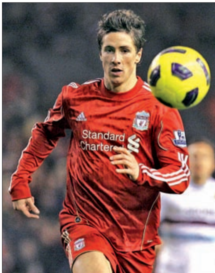
Fernando Torres fue el gran protagonista con su fichaje por el Chelsea

Los dos 'grandes' de la Liga, Real Madrid y Barcelona, han vuelto a recurrir al mercado invernal para reforzar sus plantillas. Después de no efectuar ningún movimiento la temporada anterior, madridistas y azulgranas han tirado de chequera para asegurarse los pases de Emmanuel Adebayor (cuatro millones) e Ibra-