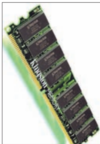
Una memoria RAM convencional

El consumo de energía es un gran problema para las compañías con grandes ordenadores y