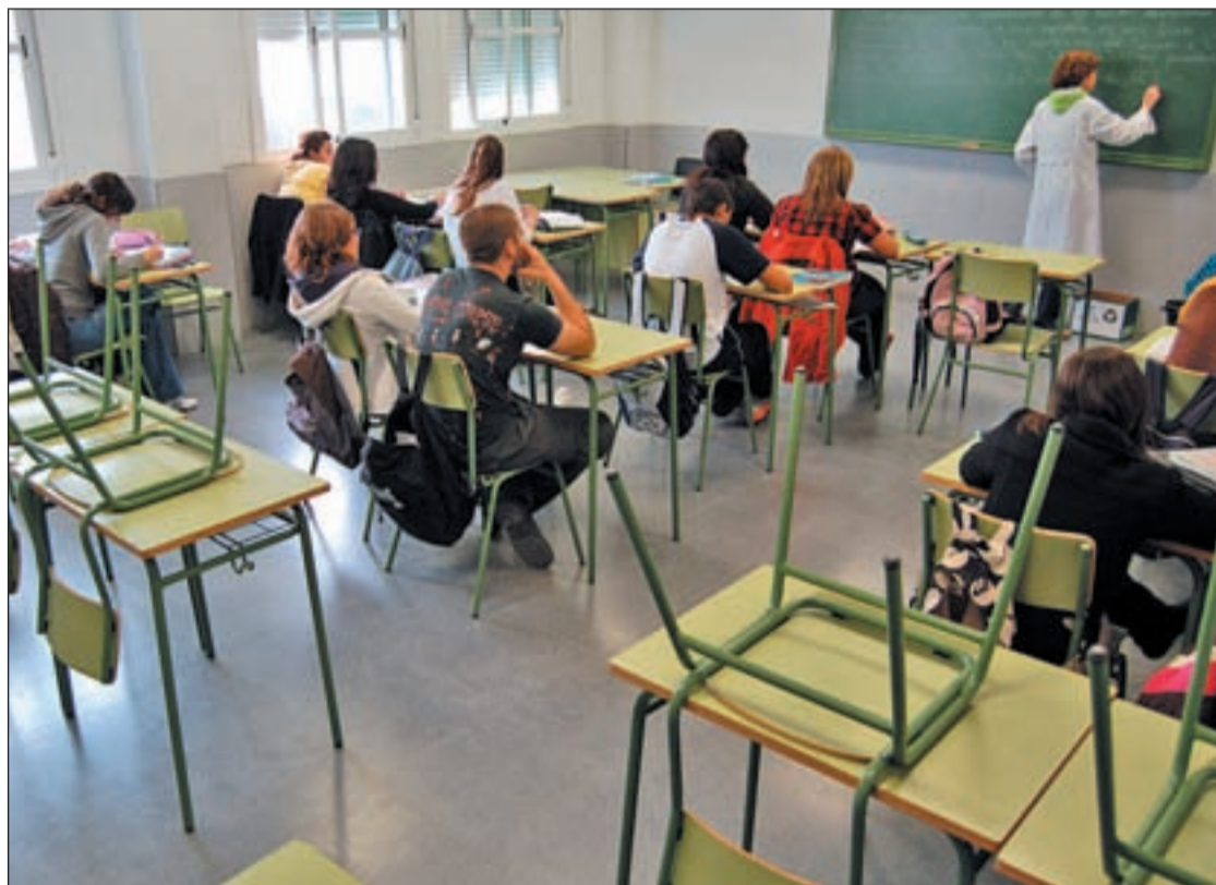
En nueve años el abandono de las aulas en España creció 7,2 puntos alcanzando el 31,2%

Pero la crisis ha destrozado el espejismo laboral que regía la vida de muchos jóvenes del Estado español. Actualmente, un 51% de los estudiantes que abandonaron los estudios obligatorios