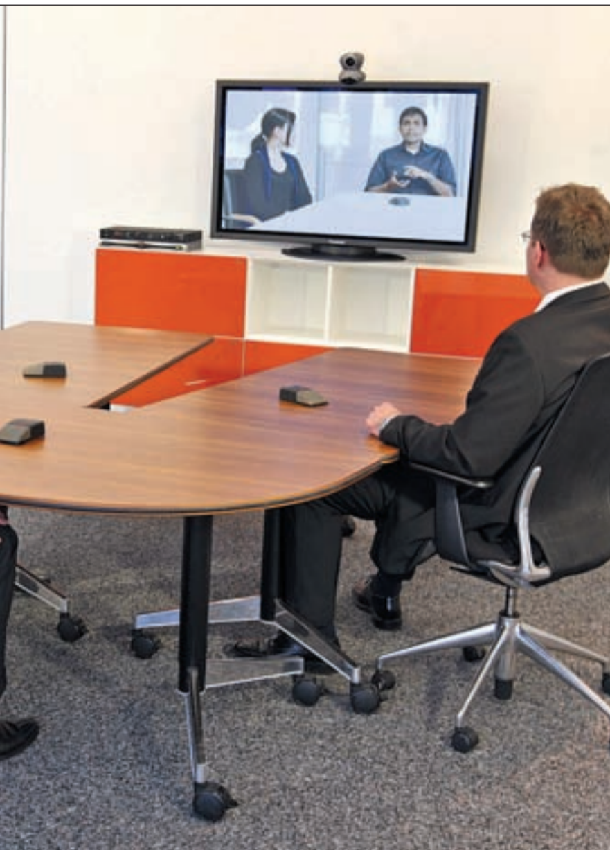
para disminuir las emisiones de CO2