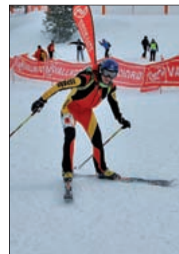
Imagen de una edición anterior

La prueba supondrá un exigente test para la preparación física de los participantes, quienes deberán acreditar un gran estado de forma para hacer frente a las duras exigencias del recorrido. Los participantes deberán superar los 17 kilómetros de recorrido con llegada y salida en la Coma de Arcalís. A su paso ascenderán a cuatro cimas: Pereguils, Creussans, Baser y el Coste Grande, cumpliendo con una de