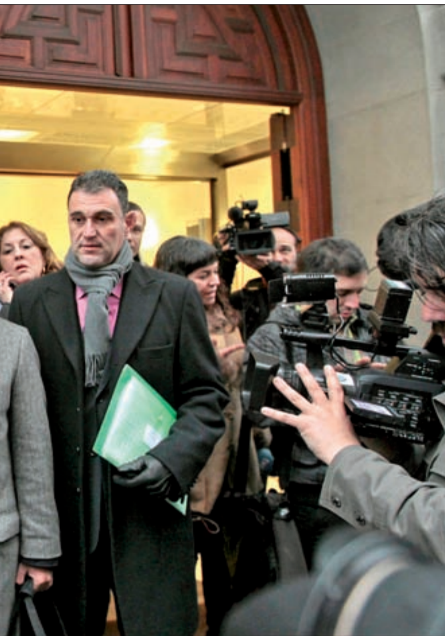
Entregada a la Fiscalía General del Estado

orígenes cuando sus padres le comentaron que habían dado un donativo de 50.000 pesetas. “Creí que era un caso único y para mi sorpresa he descubierto que somos muchos. Ahora, los afectados reclaman al Ministerio de Interior la creación de un banco de ADN para poder cruzar los datos de los denunciados. En Anadir hay hijos irregulares, apropiados, madres que