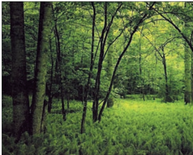
Las empresas de tecnología tienen un papel esencial frente al cambio climático

Por su parte, la Unión Internacional de Telecomunicaciones (ITU) y la Global E-Sustainability Initiative (GeSI), la asociación que representa a las compañías que apuestan por un desarrollo sostenible, presentaron