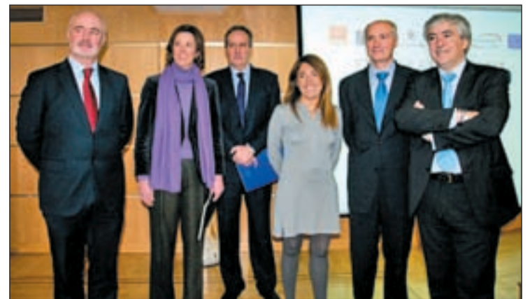
Representantes de la ONG 'Protégeles' y de las compañías telefónicas

botón conecta directamente con la línea de denuncia anónima promovida por la Comisión Europea en España: www.protegeles.com . El botón es exactamente el mismo en las cuatro compañías, de tal forma que resultará perfectamente reconocible independientemente del servicio que utilicen habitualmente.