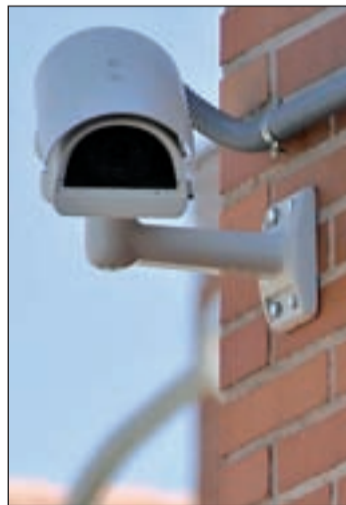
Una cámara de videovigilancia

La intimidad gana así la batalla jurídica a la protección del hogar y las herramientas de seguridad. El Alto Tribunal, no obstante, va más allá, y destaca, además, que los focos instalados junto a la cámara para las grabaciones nocturnas no dejaban dormir al ve-