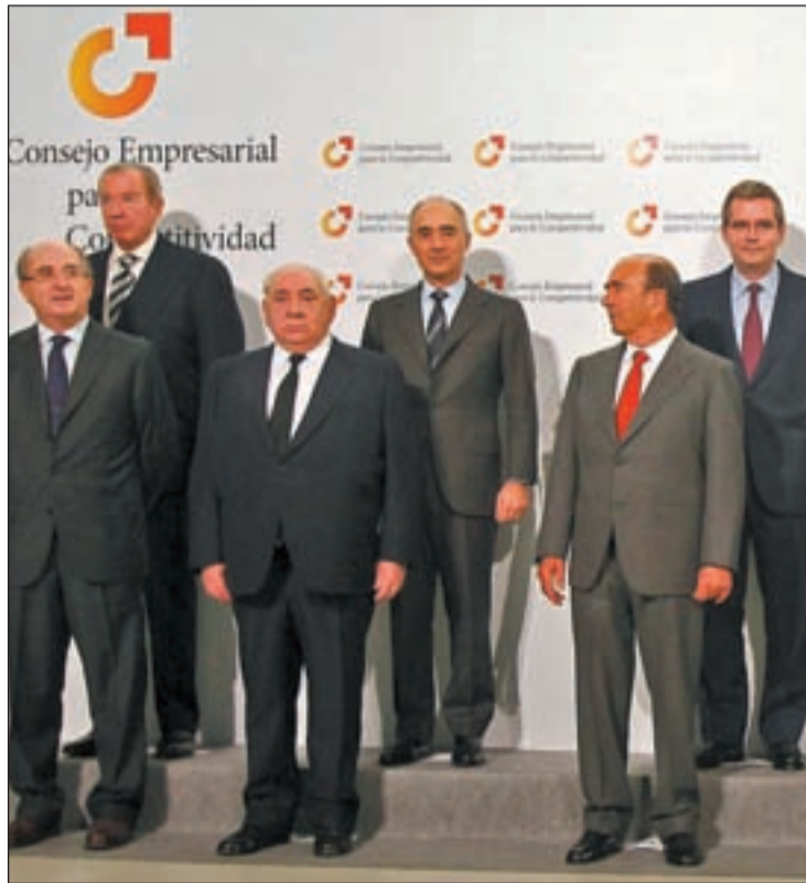
Algunos de los empresarios que han formado el 'lobby'

Los miembros de este selecto grupo han señala en palabras de su primer portavoz, Alierta, que brindan "su experiencia y capacidad para trabajar juntos", en base a su "probada experiencia internacional y avalados por el éxito en la gestión". No en balde forman parte de este compendio empresarial entidades bancarias como el Santander, BBVA o la