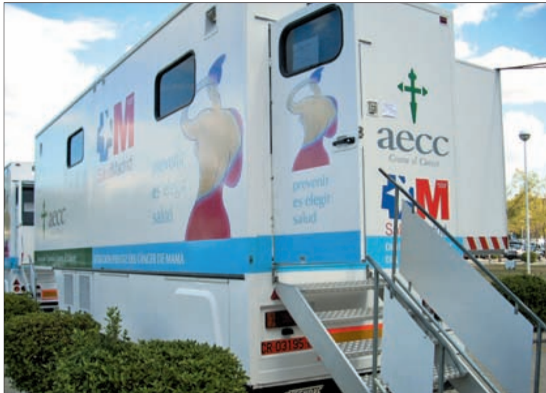
Un unidad móvil para realizar mamografías de la Aecc

En estas enfermedades, cuyos tratamientos suelen ser largos y, en ocasiones, llevan aparejados largos periodos de baja laboral,