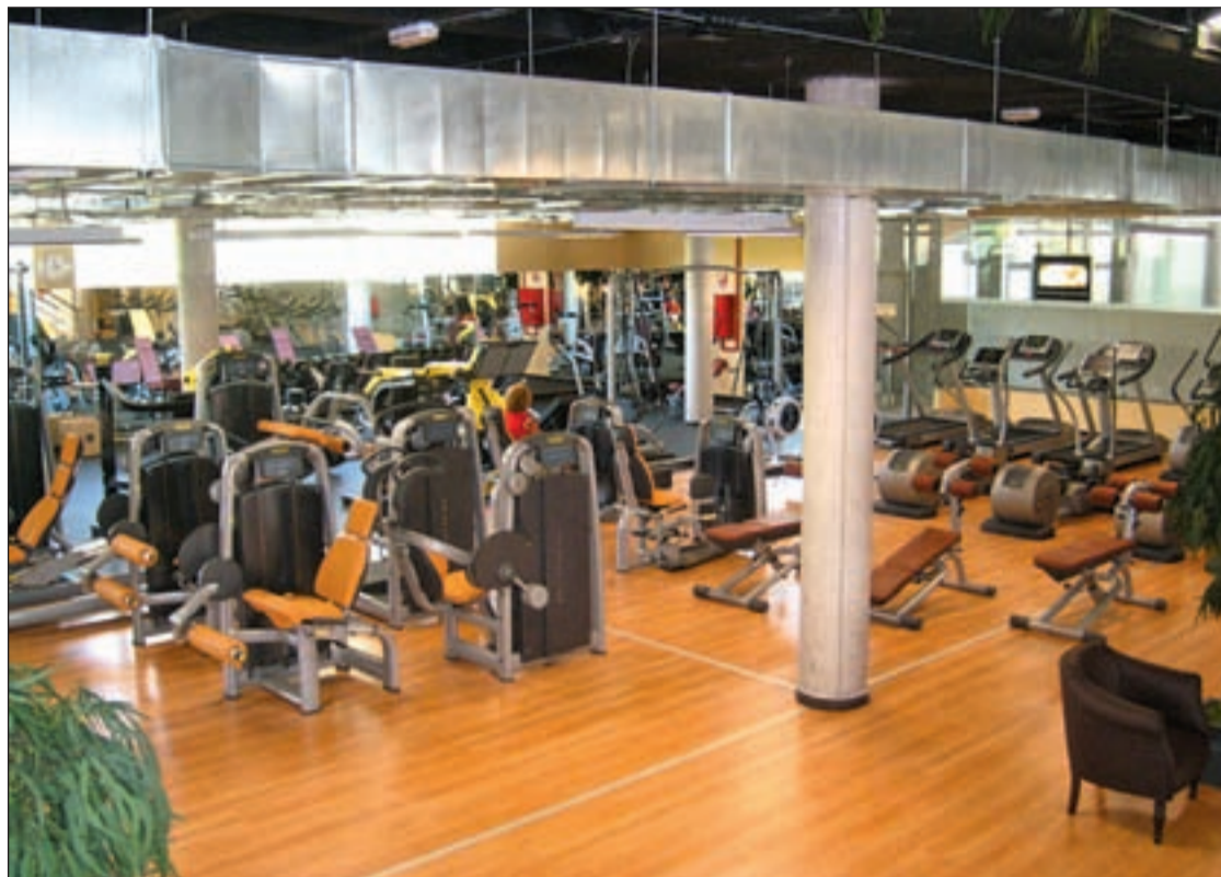
Imagen de un gimnasio Body Factory

Los centros Body Factory suman un total de 65.000 metros cuadrados, emplean a un total de 1.050 personas y continúan