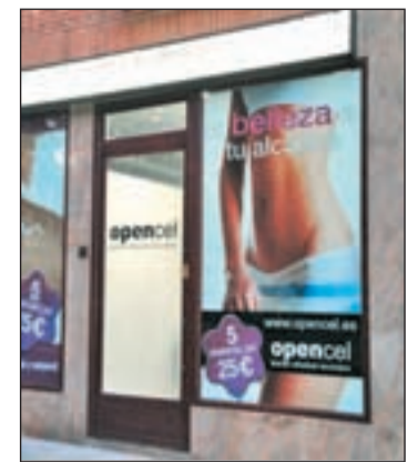
Fachada de un centro Opencel

Con este crecimiento, Body Factory es la cadena española de fitness y wellness más consolidada del panorama nacional, con una experiencia de más de 20 años ofreciendo la mejor calidad y profesionalidad.