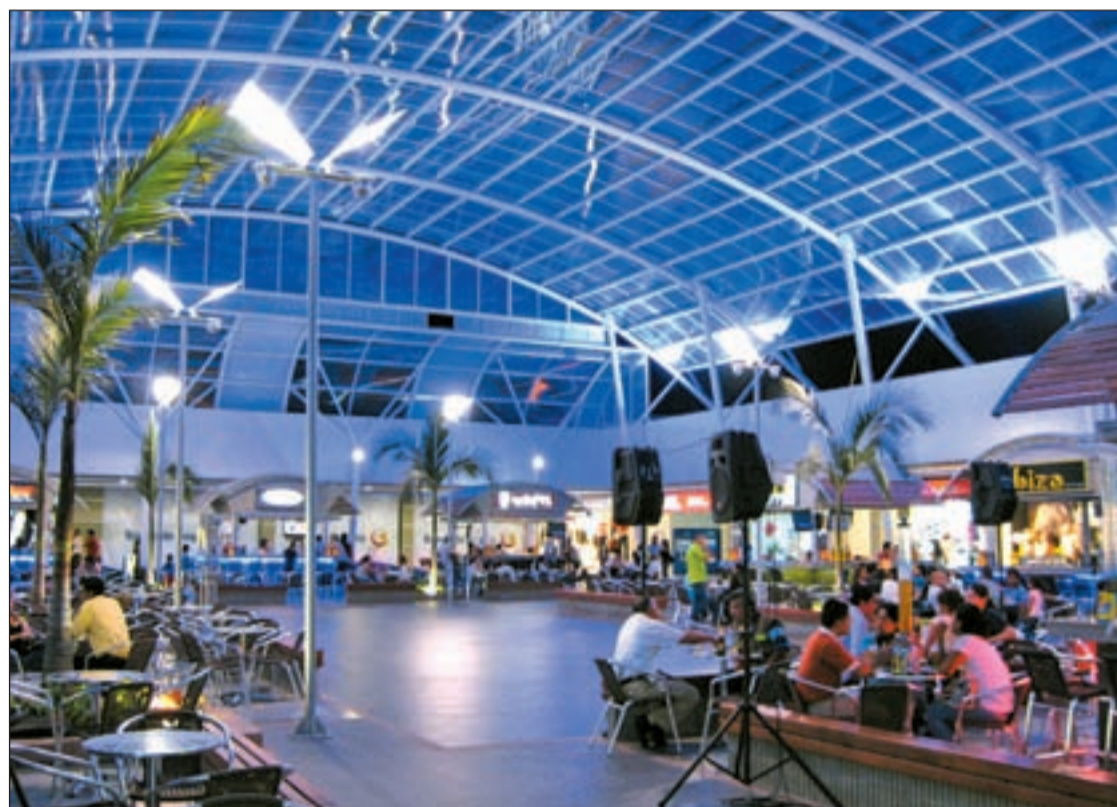
Gran parte de las franquicias apuestan por los centros comerciales

El mayor peso corresponde a moda infantil y juvenil. Le siguen los comercios dedicados a la venta de complementos, mo-