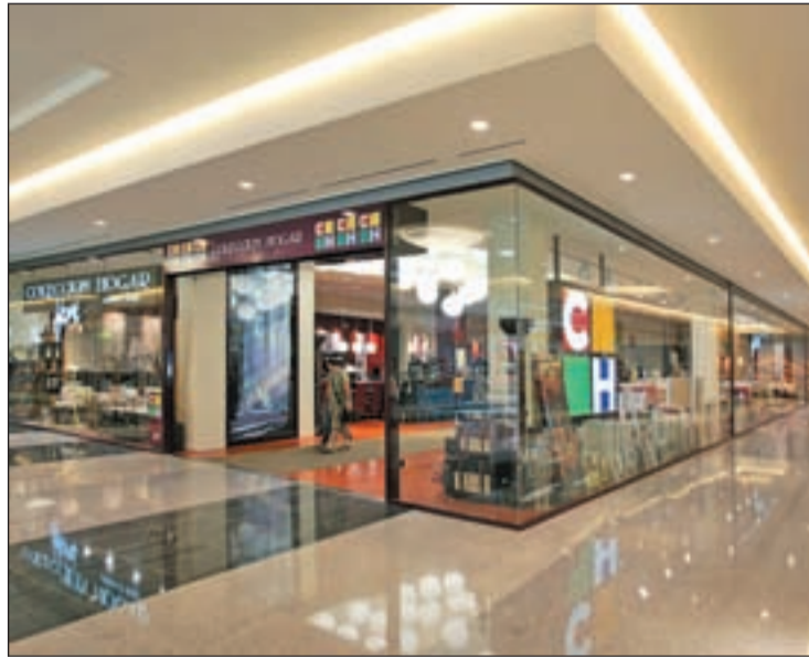
Tienda CH Colección Hogar en un centro comercial

Las claves del éxito económico de este negocio se basan en ofrecer un producto de calidad, diseño atractivo y a un precio muy económico haciendo de la decoración de calidad un hábito ac-