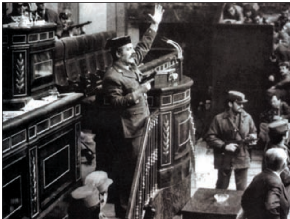
IMAGEN PARA LA HISTORIA En la fotografía de la izquierda, el teniente coronel Antonio Tejero en la tribuna del Congreso. La tarde del 23-F, al mando de unos 200 guardias civiles, Tejero