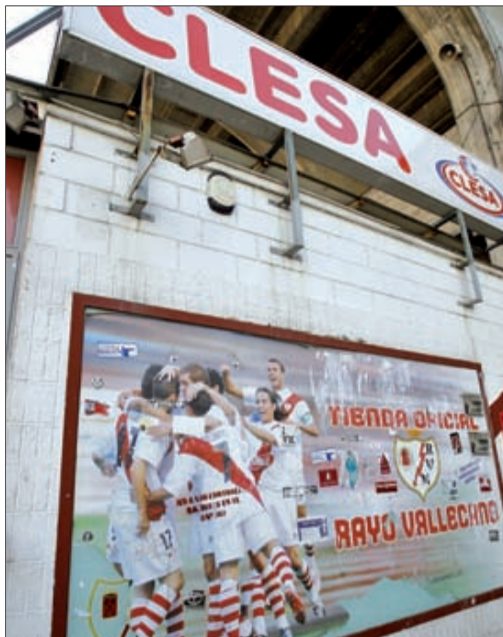
El club rayista busca una salida a su complicada situación

En un deporte tan particular como el del fútbol, los resultados deportivos no están siempre ligados directamente a la trayectoria reciente institucional. Así, el Rayo Vallecano que llevaba varios años viviendo una situación económica delicada tras su paso por el 'pozo' de la Segunda División B, ha completado una primera vuelta del campeonato en la Liga Adelante que lo ha llevado incluso a ocupar el liderato. Sin embargo, tras conocerse la medida tomada por sus propietarios, el equipo franjirrojo se ha visto inmerso en un mar de dudas que no se han despejado después del empate de la semana pasada ante un rival, a priori, inferior, como es el caso del Nástic de Tarragona.