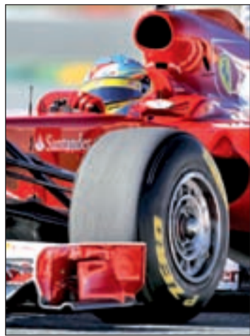
Alonso, durante la pretemporada