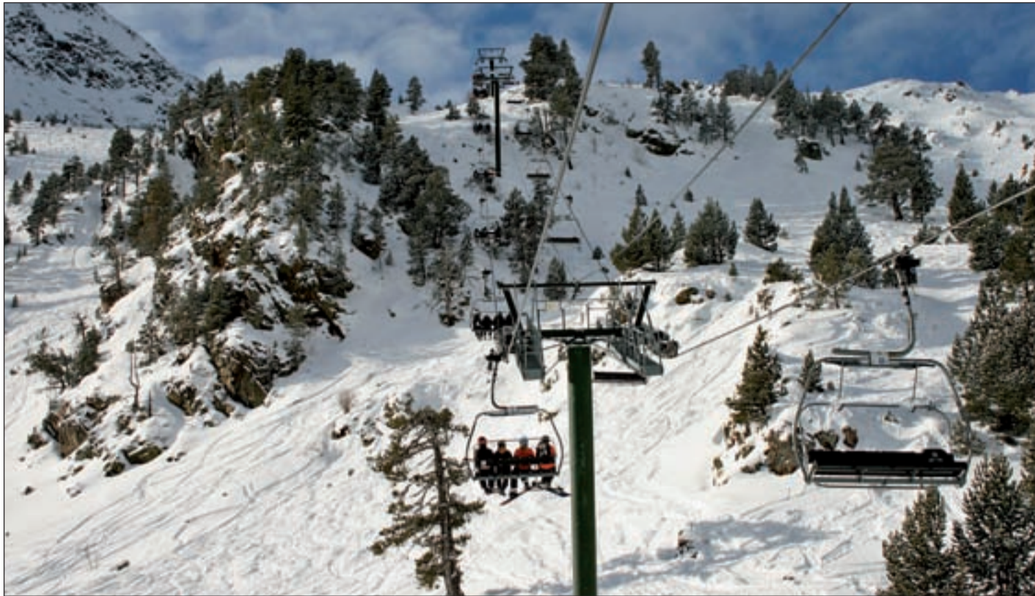
Desde el telesilla de Ordino se pueden apreciar paisajes espectaculares