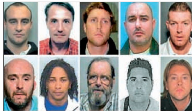
Fotografía de los fugados buscados por la 'Operación Captura'

Crimestoppers ha lanzado una nueva 'Operación Captura', en busca de diez delincuentes fugados del Reino Unido que podrían estar escondidos en las costas españolas. Uno de ellos ya ha sido localizado en Tenerife. La colaboración ciudadana es crucial en estas búsquedas.