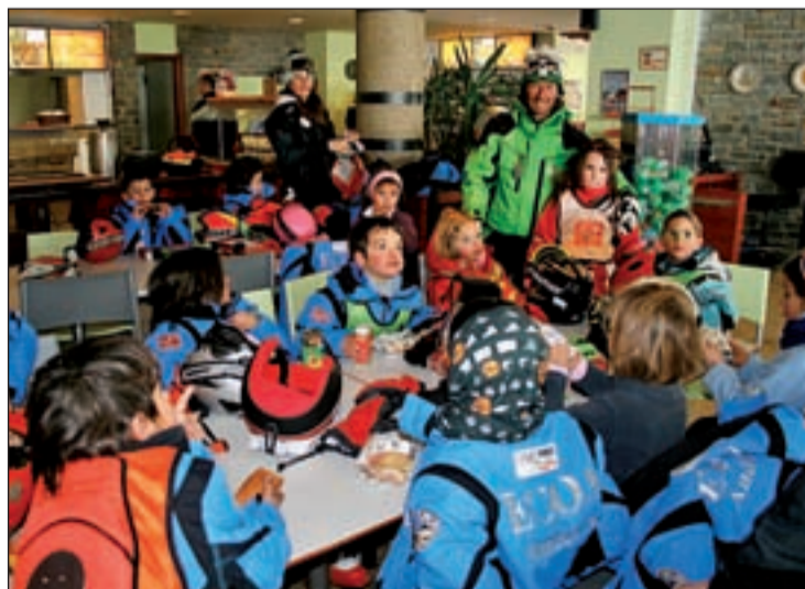
Escuela infantil de esquí de la estación con los niños en la Cota Coma

Acceder a un país como Andorra no es fácil, pero precisa-