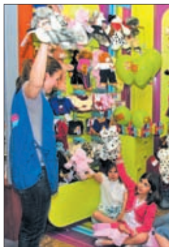
Monitora de Animal Party

Animal Party prosigue con la expansión de su nuevo concepto de ocio infantil en nuestro país y,