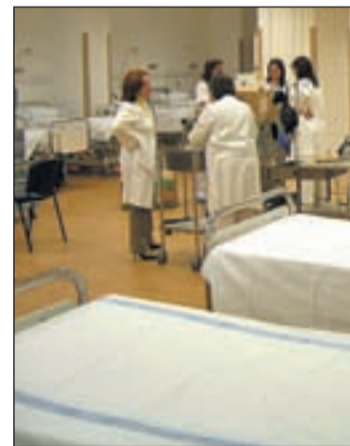
Varios profesionales sanitarios

mera ocasión gozó de unanimidad política. El 'padre' de esta proposición no de ley, Gaspar Llamazares, ha afirmado que el término copago es "engañoso" porque "en realidad debería hablarse de repago, ya que los ciudadanos ya financian el SNS con sus impuestos". En los mismos términos se ha pronunciado la socialista Pilar Grande, recordando además las "enormes desigualdades" que conllevaría para los ciudadanos, afectando más "a las rentas más bajas. Por su parte, el PNV ha lamentado que el copago sea un tema "es-